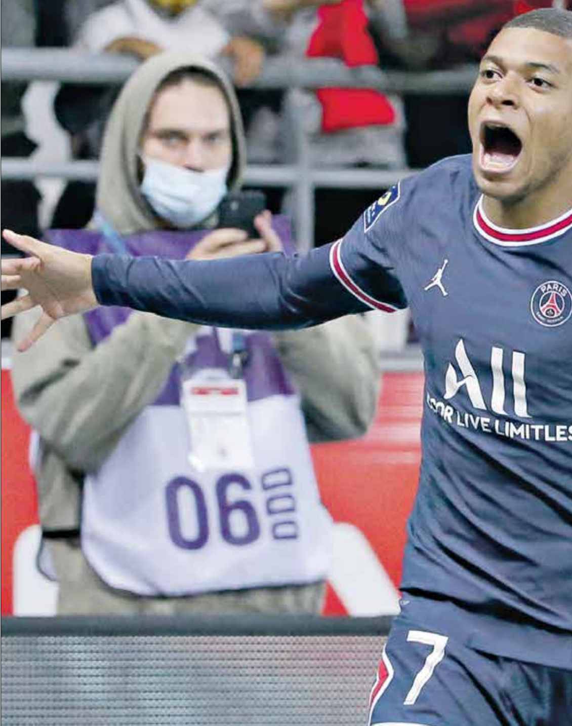
يبدو أنّ مبابي سيُتّبع مع فريق باريس سان جيرمان

يُحول فريق باريس سان جيرمان كثيراً على نقطة التتويج بلقب الأبطال، فهو يعرف جيداً أن التتويج الأوروبي من شأنه أن يُحرز «الباريسي»، فأي لاعب في العالم يُفكر