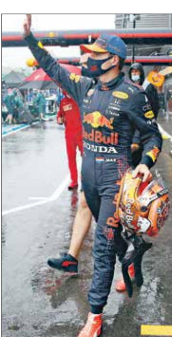
فيرستابن يحتف بخصامة بترتيب بطولة العالم

ويذكر، قلص «اماد مائكس» الذي نال 12,5 نقطة الفارق بينه وبين متصدّر ترتيب السائقين «السير» هاميلتون إلى 3 نقاط فقط بعدما حصل الأخير على 7,5 نقاط فقط (202,5 مقابل 199,5). وفي ترتيب الصانعين رفع ميرسيدس رصيدها إلى 310,5 نقاط مقابل 303,5 لـ«ريد بول»، فيما يحتل ماكلايرين المركز الثالث مع 169 نقطة. وتم في بادئ