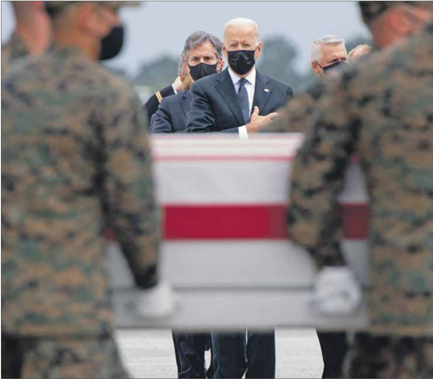
سيلفك السحاب الأميركي مع اعضاءالسلك لحايات في واشنطن، امرا، اوب،عراش، برس

وتنبئ «داعش» - ولاية خراسان، الهجوم بالصواريخ التي تعرض له مطار كابول، أمس، والذي انطلق من منطقة خريخانة الغربية من المطار، بالذات من «داعش» تجري القوات الروسية تدريبات عسكرية بالقرب من حدود أفغانستان، وأضافت السفارة أن مزيداً من رحلات الطيران ستتاح لإجلاء المواطنين الروس والمقيمين ومواطني دول منظمة معاهدة الأمن الجماعي التي تقودها روسيا، وحملت، أمس، طائرة في مطار كابول، تحمل أدوية ومعدات صحية من منظمة الصحة