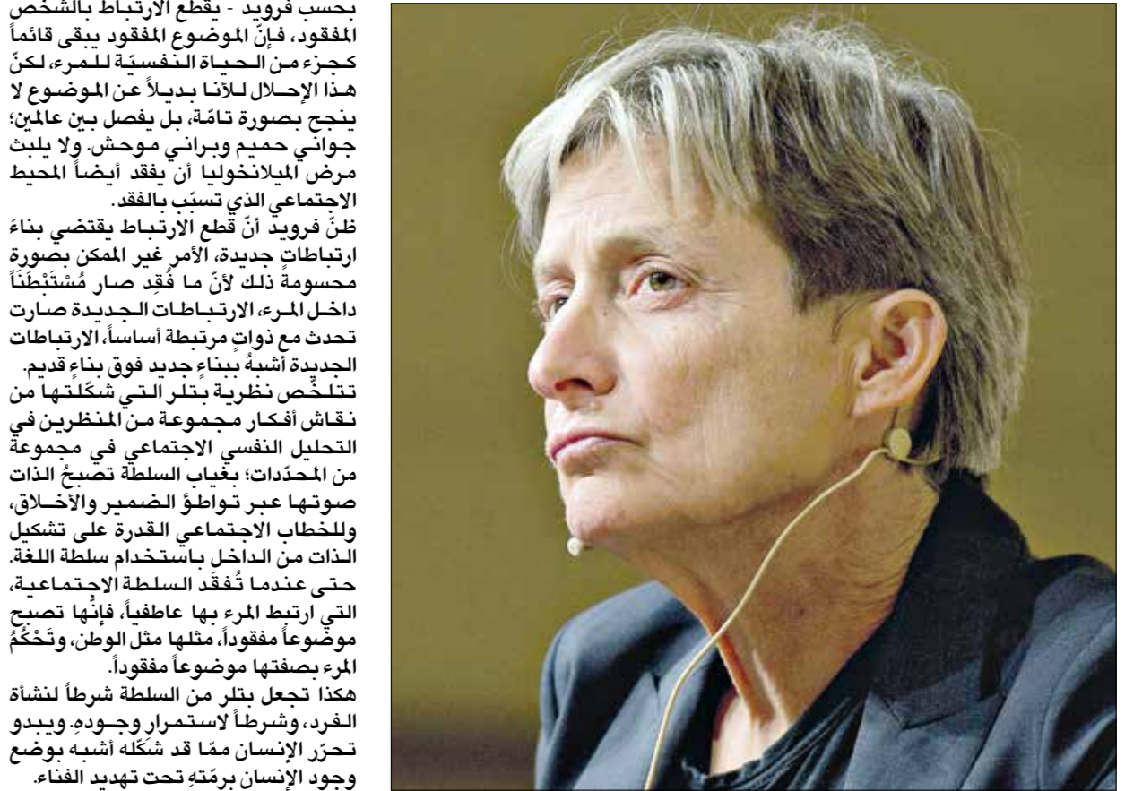
جوديث بتلر عام 2012

يعمارس الإخضاع على الذات، ومن ثمّ تمارسه ضدّ نفسها تجعل المفكّرة الأميركية من السلطة شرطاً لنشأة الفرد