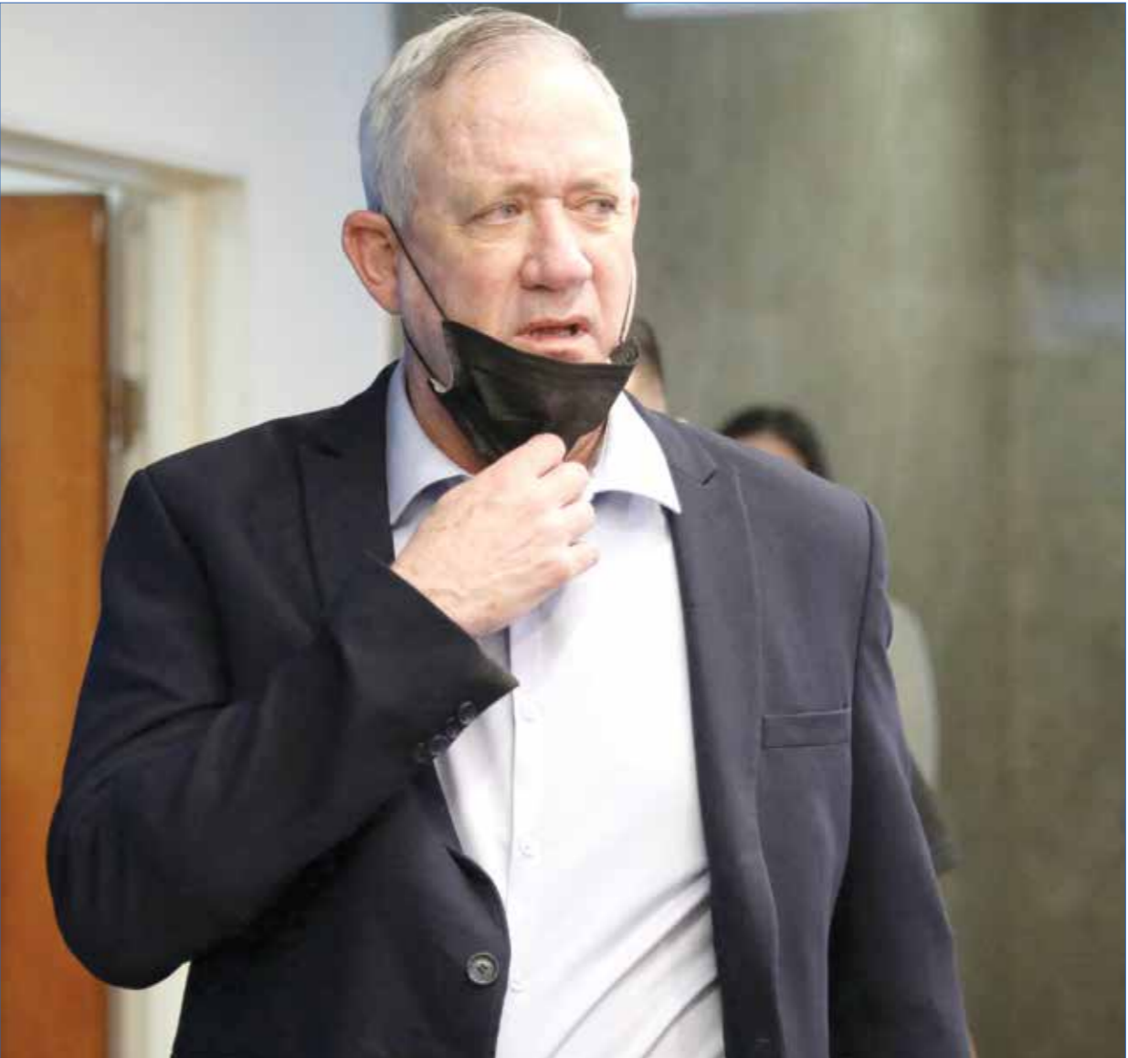
بحث غانتس مع عباس الأوضاع في غزة

في أول اجتماع رفيع المستوى بين الجانبين منذ سنوات،التقى الرئيس الفلسطيني محمود عباس مساء أول من أمس الأحد وزير الأمن الإسرائيلي بني غانتس، فيما تفاوتت الروايات بشأن مضمون بين ما قالته مصادر فلسطينية، وأخرى إسرائيلية. وبينما سارعت فصائل فلسطينية، على رأسها حركة حماس، لإدانة الاجتماع الذي بحث قضايا أمنية واقتصادية، فإن توقيته بدا لافتاً، خصوصاً أنه أتى بعد يومين من لقاء رئيس حكومة الاحتلال نفتالي بينت بالوزير الأميركي جو بايدن في واشنطن، والذي عاود خلاله الأخير التأكيد على دعم إدارته حل الدولتين. لكن ذلك لم يمنع بينت من السعي للتقليل