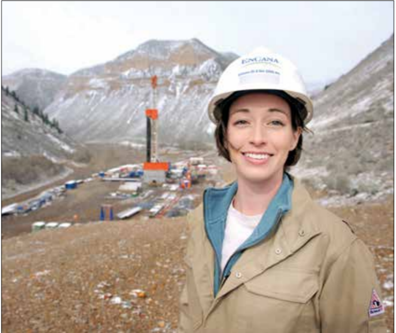
السطاط لتجه لإغلاق حفرة غاز اميركي

نابكس الأميركي بنسبة 1,1% إلى 4,44 دولارات لكل مليون وحدة حرارية بريطانية، أعلى مستوياتها منذ عام 2018، مع تعطل إمدادات الوقود في الولايات المتحدة، بعدما أجبر إعصار «إيدا» الذي ضرب خليج المكسيك وساحل لويزيانا السلطات على إغلاق المخازن من مخصات النفط البحرية. وأكفرت العقود الآجلة للغاز الطبيعي تسليم اعتبارا من السبت الماضي خفضت شركات