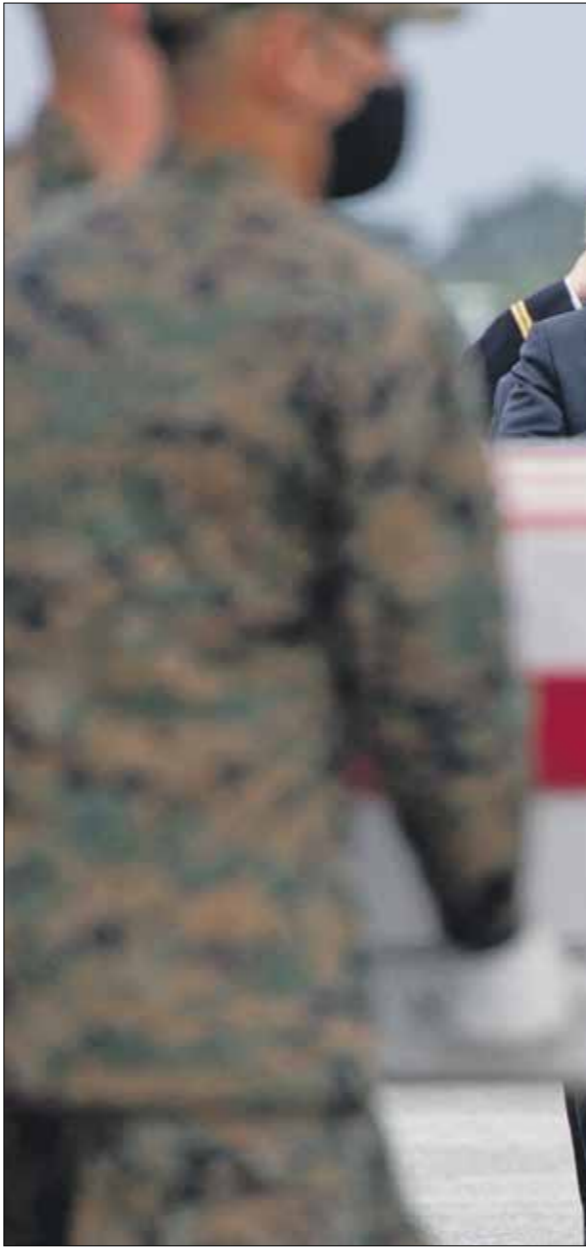
سيلفك السحاب الأميركي مع اعضاءالسلك لحايات في واشنطن، امرا، اوب،عراش، برس

وتنتهي اليوم الثلاثاء المهلة التي حددها بايدين لسحب كل القوات الأميركية من أفغانستان، بعد إجلاء أكثر من 122 ألف شخص عبر مطار كابول، منذ منتصف شهر أغسطس/آب الحالي، وركز الجيش الأميركي، أمس، على سحب الجنود، والدبلوماسيين الأميركيين خصوصاً، وهو ما سيواصل اليوم، مع استمرار التحضير من هجمات إرهابية أخرى، وأكد مسؤول أميركي لوكالة «رويترز» إجلاء معظم الدبلوماسيين، أمس، بانتظار إجلاء آخر الجنود اليوم، وكان وزير الخارجية الأميركي، أنتوني بلينكن، قد شدد، أول أمس، على أن «الوجود الدبلوماسي للولايات المتحدة في أفغانستان يجب أن يستقر في الأمر». وقال «طالبان» خلال الأسابيع والأشهر المقبلة، بعد الخروج الصاروخي الذي تعرض له مطار كابول، أمس، أنها تستمر رحلات طيران إغاثية لإجلاء أشخاص من أفغانستان، في حين تجري القوات الروسية تدريبات عسكرية بالقرب من حدود أفغانستان، وأضافت السفارة أن مزيداً من رحلات الطيران ستتاح لإجلاء المواطنين الروس والمقيمين ومواطني دول منظمة معاهدة الأمن الجماعي التي تقودها روسيا، وحملت، أمس، طائرة في مطار كابول، تحمل أدوية ومعدات صحية من منظمة الصحة