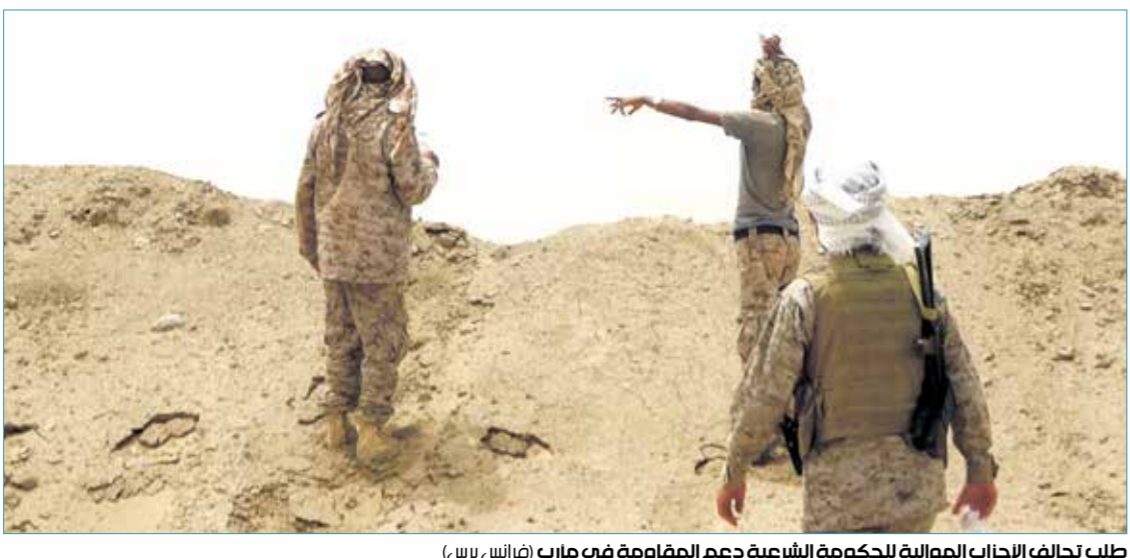
طلب تحالف الحزاب الموالية للحكومة الشرعية دعم المقاومة في مارب

وعلى الرغم من سيطرة القوات الموالية للحكومة الشرعية على كامل محافظة شبوة بعد دحر الانفصاليين في أغسطس/آب 2019، إلا أن القوات الإماراتية لا تزال تتمركز في معسكر العلم وميناء بلحاف الخاص بشروع لغزا الطبيعي المسال، الذي تديره شركة «توتال» الفرنسية، وهو ما أدى إلى توقف الصادرات منذ 2015، وترفض القوات الإماراتية سحب من ميناء بلحاف والسماح للحكومة بإعادة تصدير الغاز المسال.