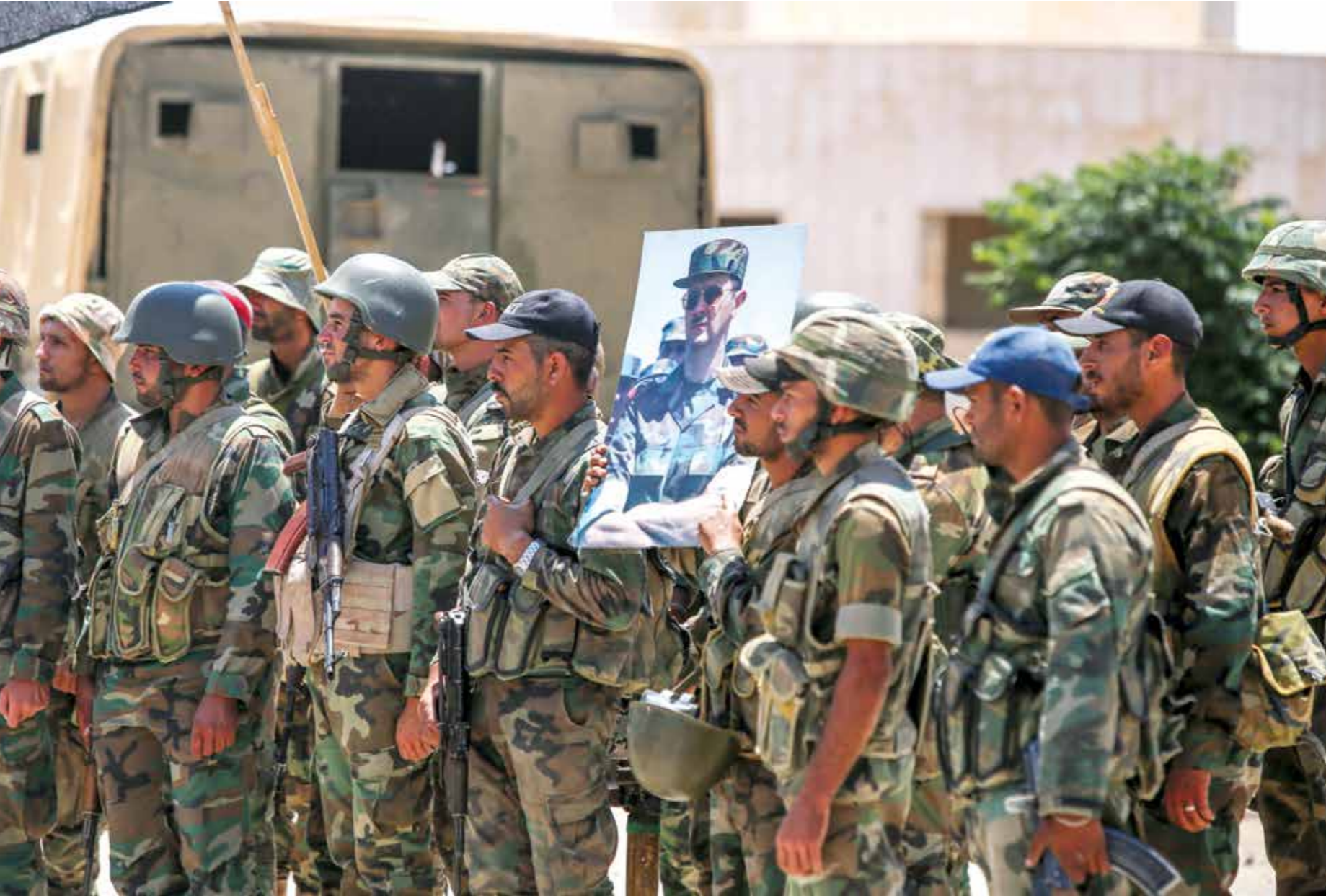
يحدد النظام فوهاله منذ أيام في محيط مدينة درعا

وحسب أحد المصادر، فإن ما لا يقل عن 3 فقرات في القانون القديم (جرائم المعلوماتية) تم نفلها للقانون الجديد الخاص بالعقوبات بصيغة مطابقة، للموجودة بالقانون القديم أو مشابهة لها، ولكن المشكلة في أنها فقرات فضفاضة قابلة للتأويل، فعلى الرغم من تحديثها عن الابتزاز الإلكتروني والعقوبات المرتبطة عليه وجريمة انتحال الصفة على مواقع