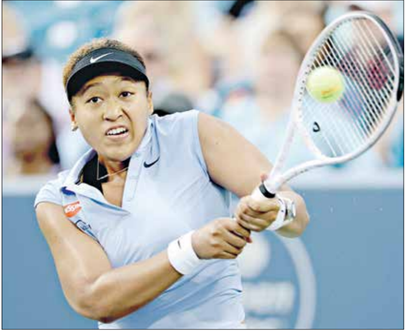
ريد اوساكا لسيات خيبة اولمبياد طوكيو

وتفتحت مشوارها في نيويورك بمواجهة التشبيكية ماري بوزوكفا اليوم الثلاثاء، وقد تعرضت طريقها صاحبة الأرض المراهقة كوكو غوف في الدور الرابع، الأوكرانية إيلينا سفيتولينا السادسة عالميا في ربع