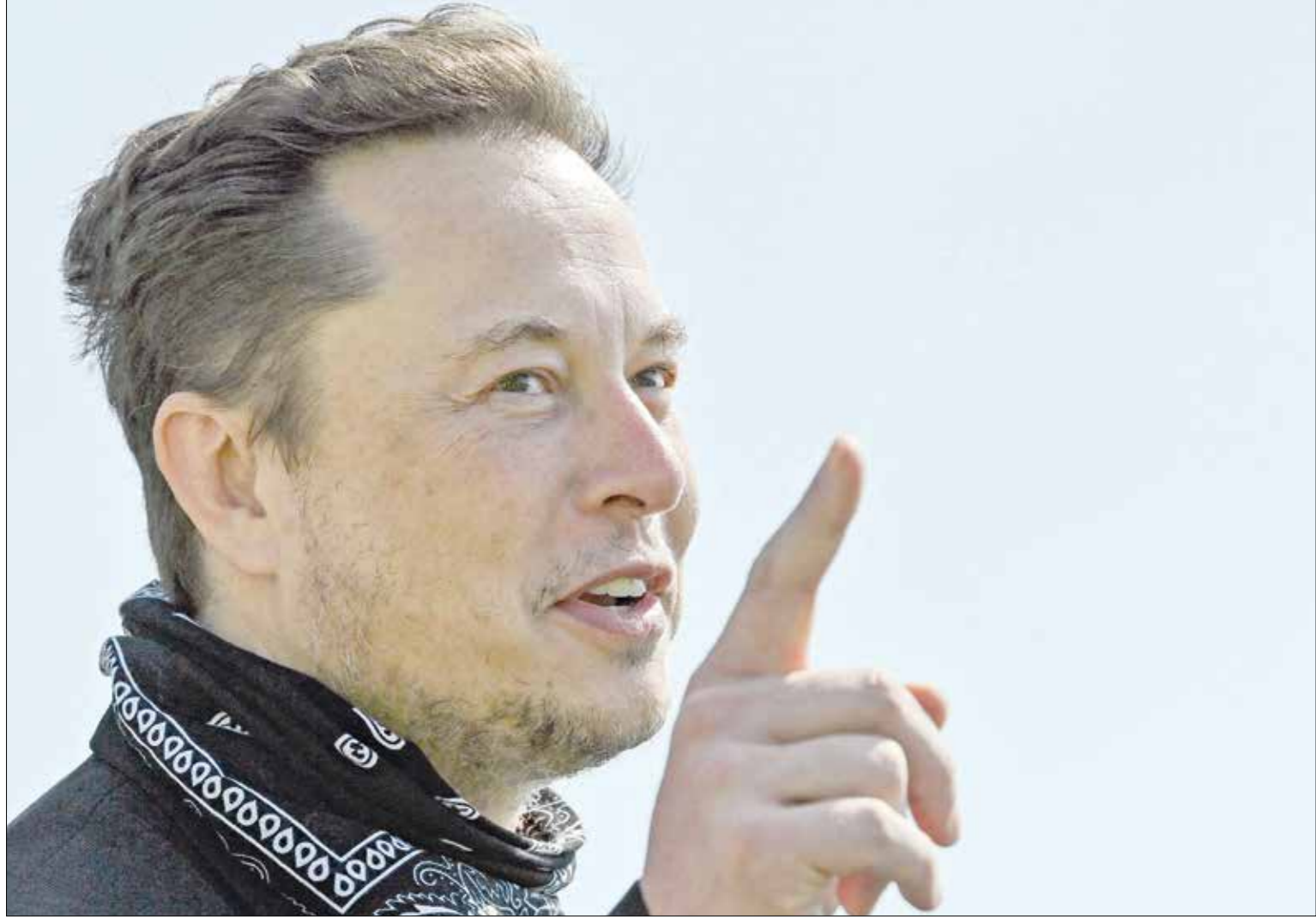
هدف الرجل الذي هو تحريك أفراد من المجتمع المدني

■ ما سبب خوضك تجربة فيلم «200 جنيه»؟ الفيلم مكتوب بشكل جيد من المؤلف أحمد عبد الله، وهو عشرة العجر وزميل الدراسة في كلية الحقوق، ويناقد العمل مشاكل وأزمات العديد من الطبقات الاجتماعية وقضاياها، ولكن بشكل غير مباشر من خلال قصص خفيفة، وأنا أحب جداً مثل هذه النوعية من الأعمال التي تكون هامة وتجعل لدينا همما اجتماعياً، وتُشعر بالناس في الغني المظلوم.