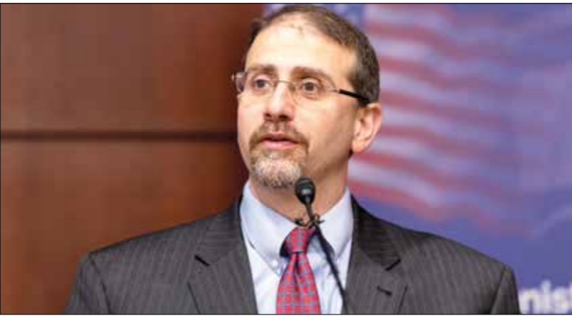
سبتلفك شابيرو بين واشنطن وغزة (إيرب شريف، المحافظ Getty)