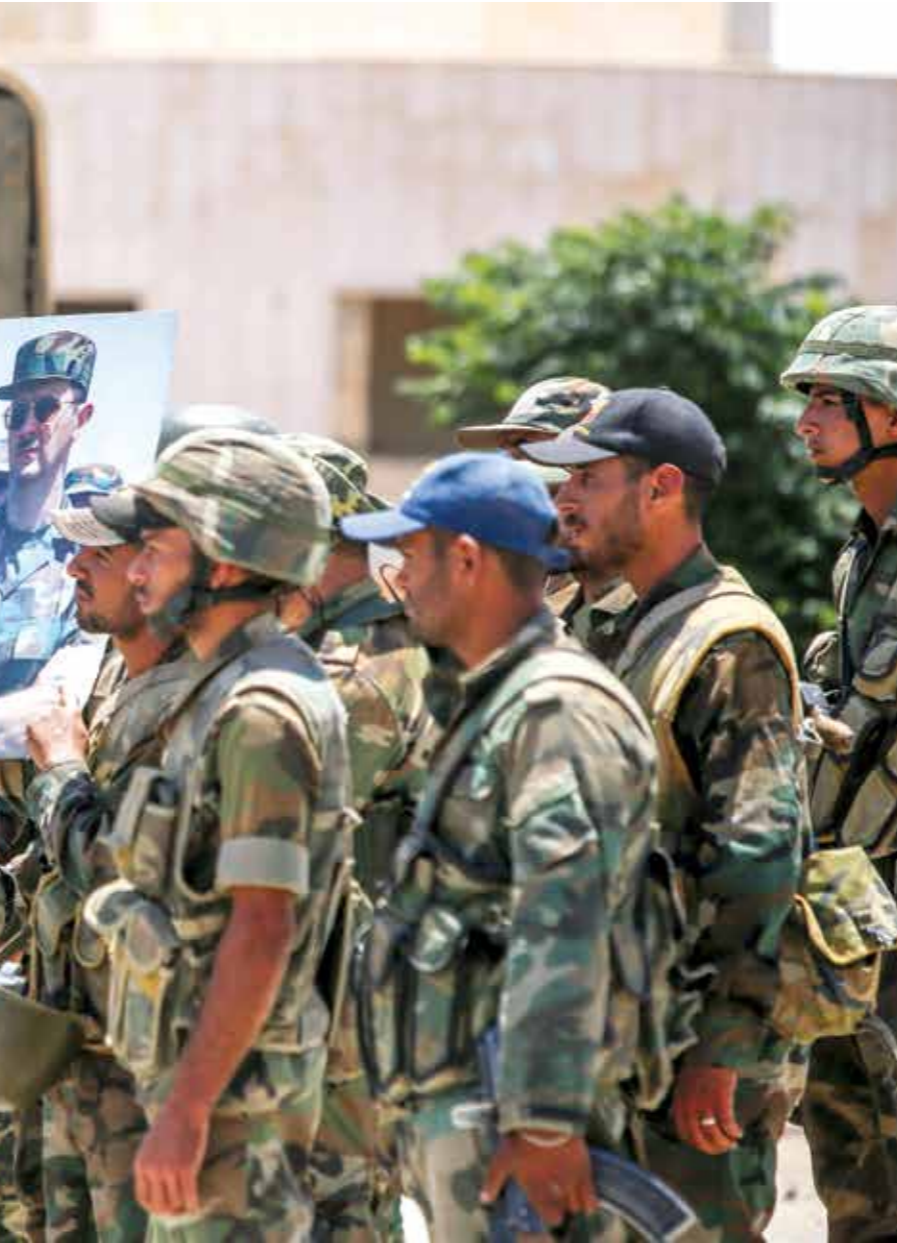
يحدد النظام فوهاله منذ أيام في محيط مدينة درعا

شروطاً جديدة هي بمثابة «الاستسلام» من قبل سكان أحياء درعا البلد. وتضمنت الشروط الجديدة «الاعتراف بعلم النظام علماً معترفاً به لكل سورية وهو خط أحمر»، والاعتراف بجيش النظام بأنه المسؤول عن أمن سورية»، و«الاعتراف بيشار الأسد رئيساً رسمياً منتخباً لسورية». كما تضمنت تفتيش احياء درعا البلد بإشراف الشرطة العسكرية الروسية بحثاً عن الأسلحة الخفيفة.