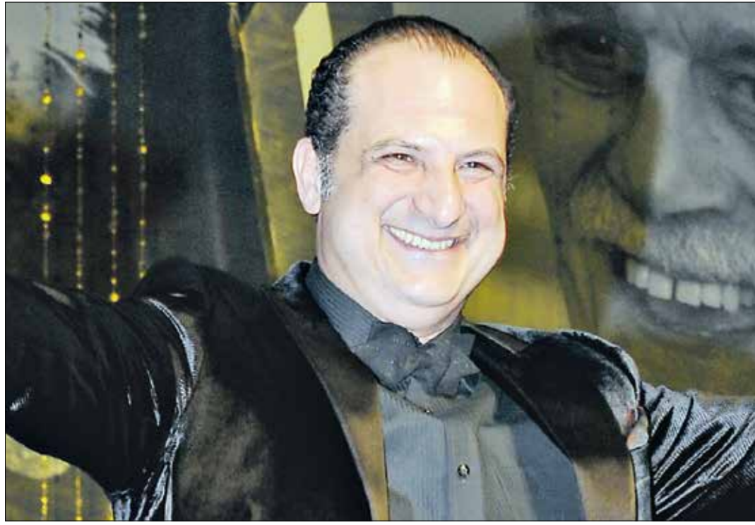
الصاوي، حينما كان ائرا العمل، كانت مشاهراً جداً لعرضه (في الحداث)

والفيلم الجيد بشكل خاص يفرض نفسه خاصة في ظل وجود أفلام لنجوم كبار أيضاً بدور محترم مثل محمد أمين.