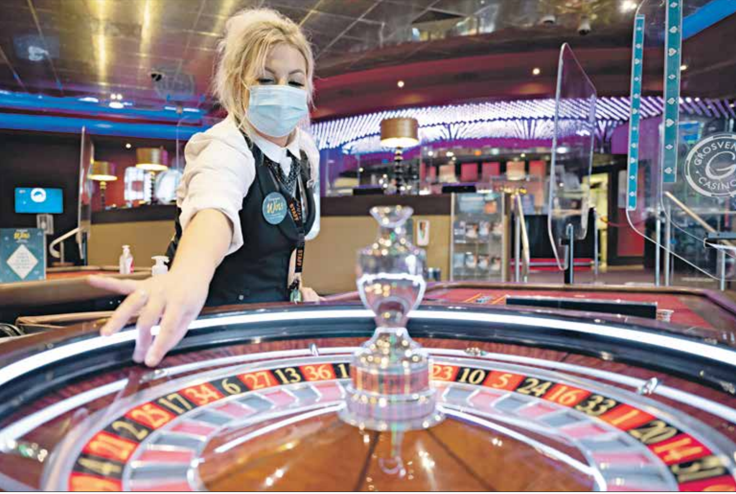
داخل كازينو