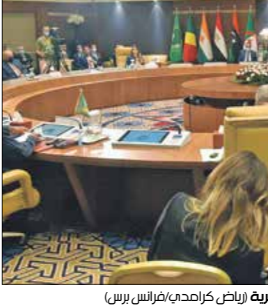
انعقد المؤتمر بصر العاصمة الجزائرية غرب، الحراك(عراش، برس)