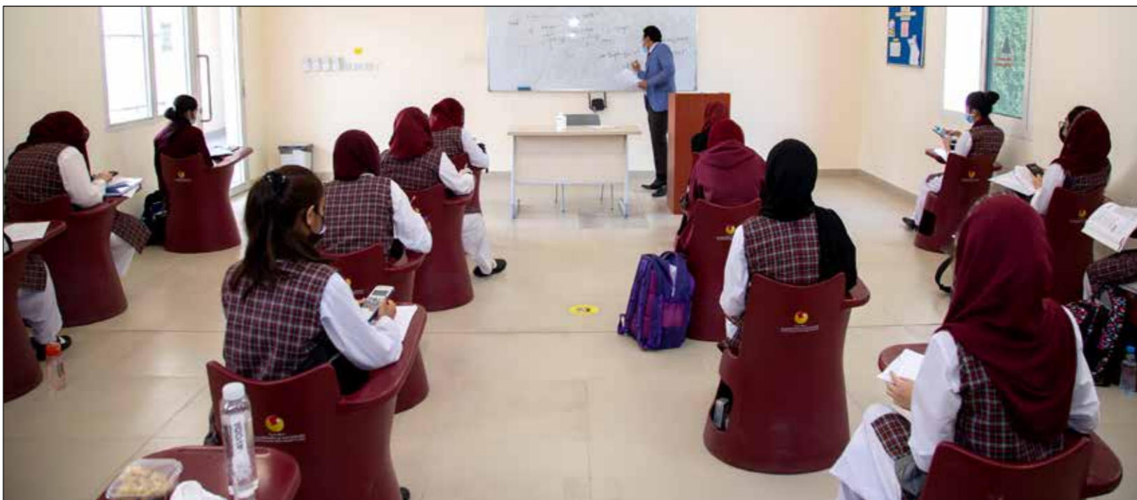
أحد الفصول الدراسية بالمدرسة الباكستانية الدولية في الدوحة