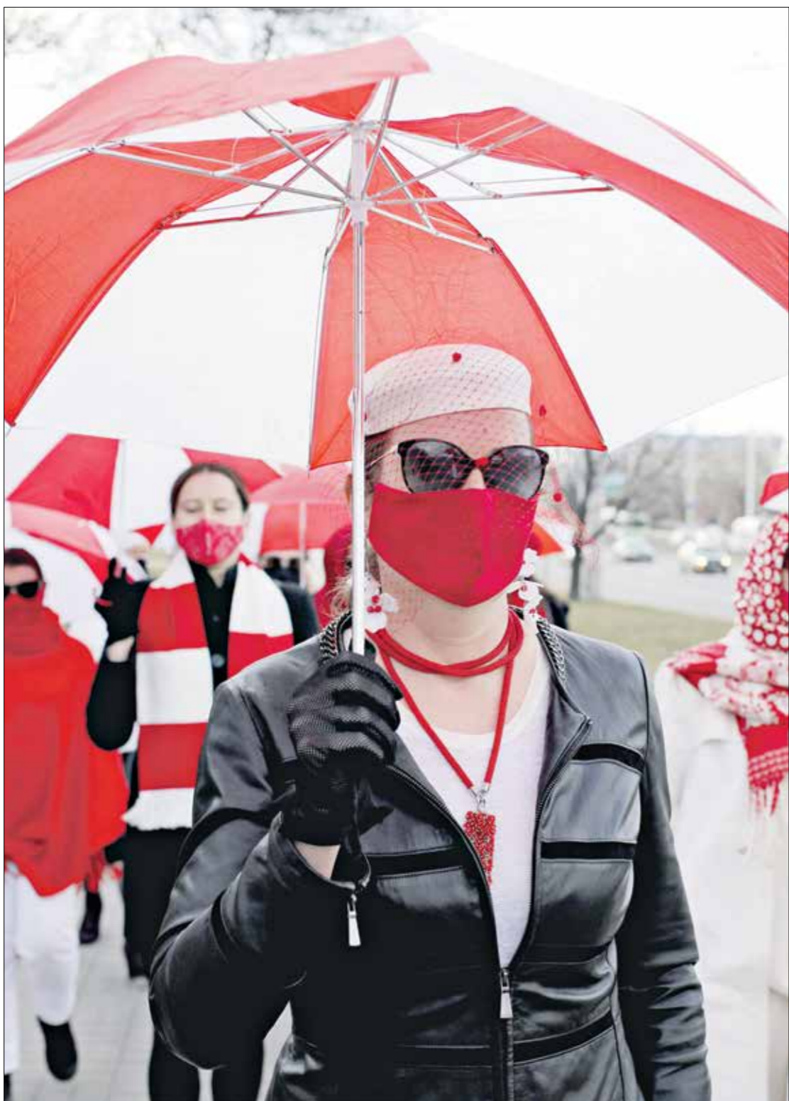
فص واسع وولابية اسلحها المتظاهرين في مينسك (مراهق سرب)