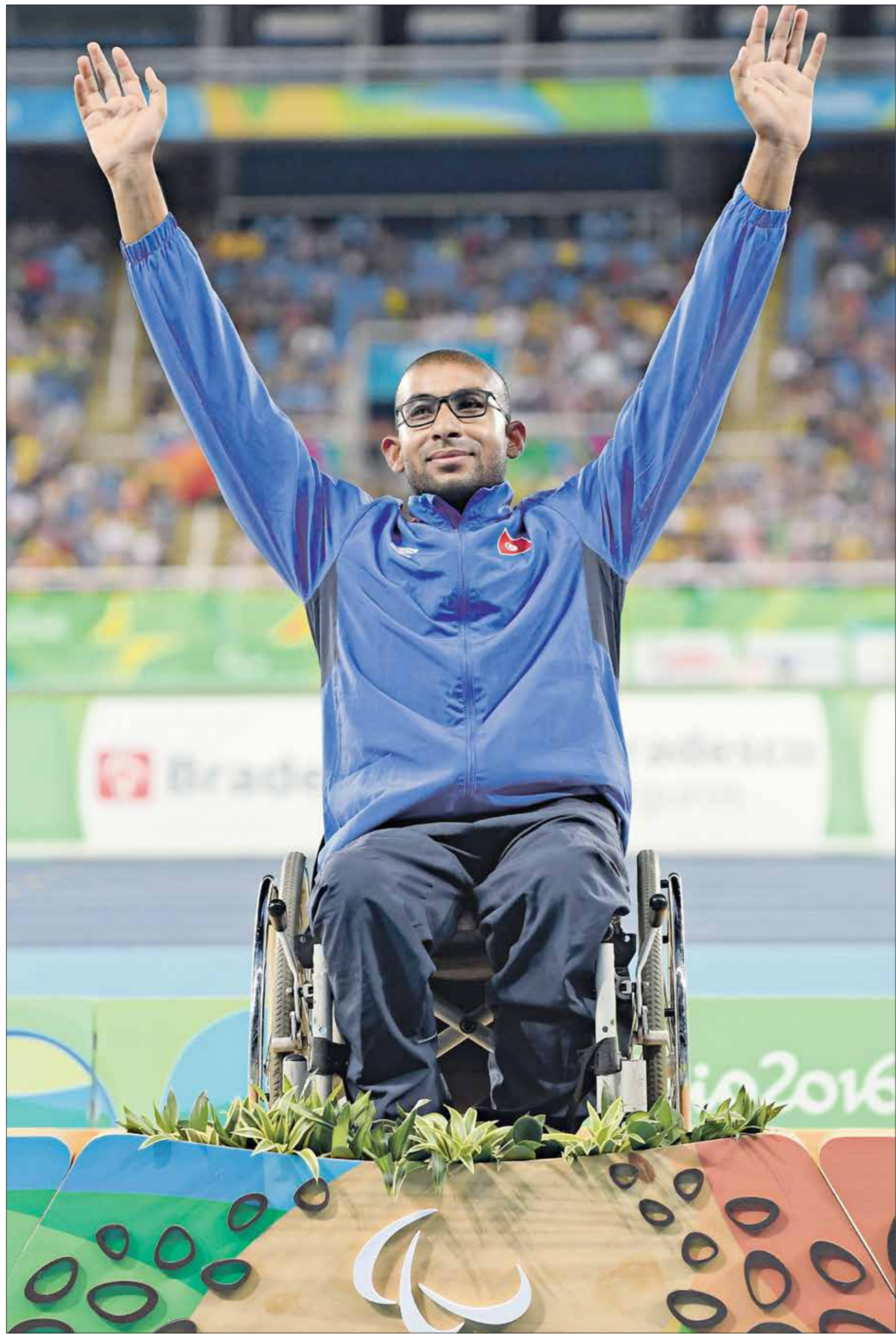
الابطك التونسي حصف الميدالية الذهبية للمرة الثالثة على التوالي