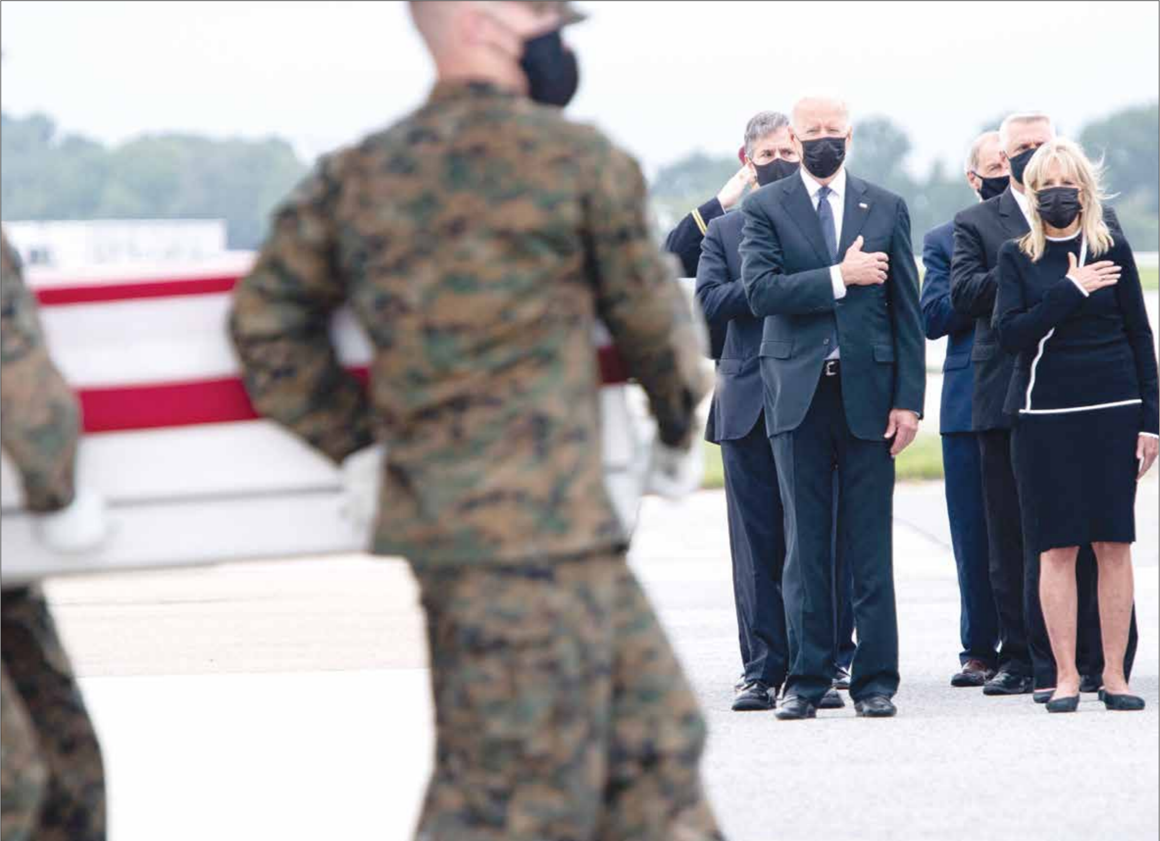
اميركا خسرت الالف ابرواج وترايلون دولار في أفغانستان

وثالثا، تطوير دول آسيا الوسطى في مسار غربي وإسمالي يعتمد فتح وتحرير الأسواق بعيدا عن النفوذين الروسي والصيني، ويقول البروفسور ياننار، إن تطوير العلاقات مع دول حوض بحر قزوين، «يمتح و اشتنف