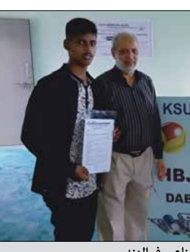
خرجي معهد حمد بن جاسم للتدريب الصناعي في الهند