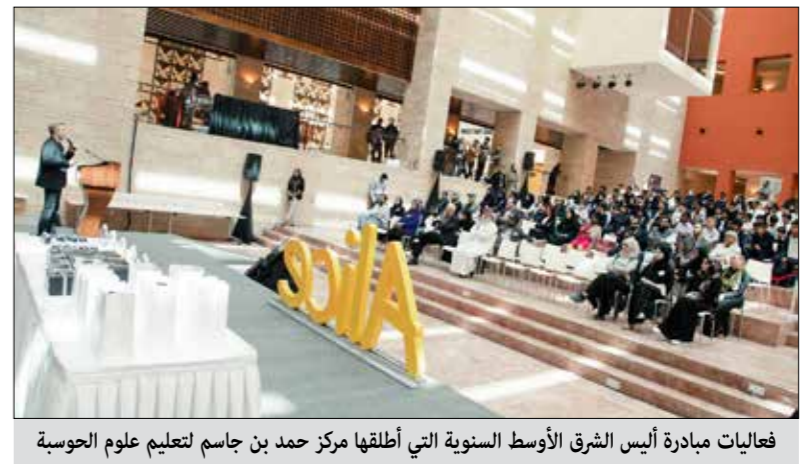
فعاليات مبادرة أيسس الشرق الأوسط السنوية التي أطلقها مركز حمد بن جاسم لتعليم علوم الحوسبة

والاقتصادي والثقافي، وموضحاً أنه من أهم مشاريع المؤسسة دولياً تأسيس معهد حمد بن جاسم للتدريب الصناعي بتكلفة إجمالية تقارب الـ 3 مليون ريال قطري، والذي تم تشييده بولاية ماهاراشترا في الهند بالتعاون مع مؤسسة كوكرن للتنمية الاجتماعية والمعترف به من قبل المجلس الوطني للتدريب المهني ومديرية التعليم والتدريب المهني بولاية ماهاراشترا والذي يعنى بتقديم تعليم مهني متخصص في مجالات الكهرباء والميكانيكا واللحام والسباكة وميكانيكا السفن وتشمل هذه قطر شهدت تنوعاً ملحوظاً من خلال بناء العديد من الشراكات مع المؤسسات التعليمية في دولة قطر وفي مقدمتها عدد من الجامعات وكذلك تقديم مختلف أشكال الدعم للعديد من المدارس الخاصة ومدارس الجاليات في محاولة من جانبها إلى توحيد الجهود الرامية لارتقاء بالعمليّة التعليمية، فضلاً عن مساندة جهود الجمعيات ذات الأنشطة التعليمية.