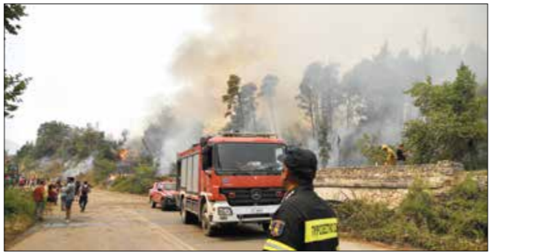
الحرائق تضرب السياحة في اليونان

شهريا من السندات الحكومية، ويتربق المستثمرون سحب هذا البرنامج من مخاطرتشديد السياسة النقدية الأميركية على الأسواق الناشئة، إذ إن تشديد السياسة يعني ارتفاع سعر صرف الدولار وارتفاع كلفة الاقتراض في الدول الناشئة، وقالت جوبيئات في مقابلة مع «فايناننشال