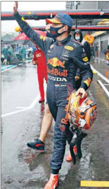
فيرستابن يحتف وصالفة ترتيب بطولة العالم

وبذلك، قلص «اماد ماركس» الذي نال 12,5 نقطة الفارق بينه وبين متصدّر ترتيب السائقين «السير» هاميلتون إلى 3 نقاط فقط بعدما حصل الأخير على 7,5 نقاط فقط (202,5 مقابل 199,5). وفي ترتيب الصانعين رفع ميرسيدس رصيدها إلى 310,5 نقاط مقابل 303,5 لـ«ريد بول»، فيما يحتل ماكلايرين المركز الثالث مع 169 نقطة. وتم في بادئ