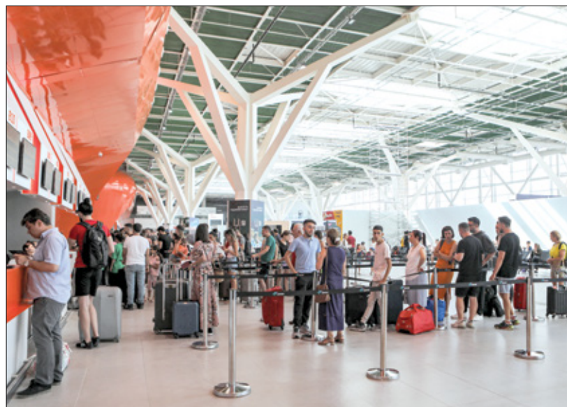
مسافرون في مطار إركان القبرصي، 21 يوليو 2023