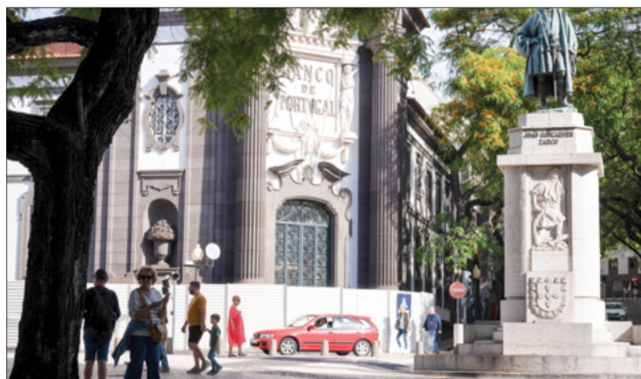
الساحة قرب البنك المركزي البرتغالي، 21 إبريل 2024

أطلقت إستونيا التأشيرة الرقمية في صيف 2020، وهي تتيح للأشخاص الذين يعملون عن بعد لدى شركات في الخارج، أو العاملين لحسابهم الخاص مع عملاء معظمهم في الخارج، البقاء في إستونيا لمدة تصل إلى عام واحد. يمكنك التقدم بطلب للحصول على تأشيرة إضافية مدتها ستة أشهر بعد انتهاء صلاحية التأشيرة. توفر الدولة أيضاً «الإقامة الإلكترونية» والتي تمنح رواد الأعمال عن بعد إمكانية الوصول الرقمي إلى الخدمات الإلكترونية من دون توفير الإقامة. مدة التأشيرة سنة واحدة، مع إمكانية التمديد لستة أشهر، رسوم الطلب 100 يورو ومتطلبات الدخل 3500 يورو شهرياً. كذلك، فإن تأشيرة العمل الحر في فنلندا مفتوحة لرواد الأعمال من خارج الاتحاد الأوروبي الذين يعملون لحسابهم الخاص، أو يديرون شركة مستقلة. يجب على المتقدمين تلبية الحد الأدنى من متطلبات الدخل وإثبات أن لديهم وسائل المعيشة. ومدة التأشيرة ستة أشهر، ورسوم الطلب 400 يورو ومتطلبات الدخل 1220 يورو في الشهر.