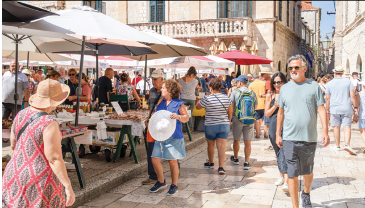
شارع دبروفنيك في كرواتيا، 13 سبتمبر 2023

يمكن للراغبين التقدم بطلب للحصول على تصريح إقامة الباني يسمح لهم بالبقاء والعمل لمدة تصل إلى عام واحد، ويمكن تجديده حتى خمس سنوات متتالية. يجب على طالب التأشيرة تقديم عقد عمل من شركة خارج البانيا تسمح له بالعمل عن بعد، بالإضافة إلى المؤهلات ذات الصلة. ويجب أن يكون لديه أيضاً حساب مصرفي محلي، وإثبات وجود أموال في الحساب، وعقد سكن، وتأمين صحي، وسجل جنائي نظيف. مدة التأشيرة هي سنة واحدة، مع إمكانية التجديد لمدة تصل إلى خمس سنوات. ومتطلبات الدخل تبلغ 9800 يورو في السنة. بدورها، أطلقت كرواتيا تصريح الإقامة للعاملين عن بعد لمدة عام واحد في عام 2021. المخطط مفتوح للمواطنين من خارج الاتحاد الأوروبي والمنطقة الاقتصادية الأوروبية الذين يعملون في تكنولوجيا الاتصالات، ويمكن للعمال عن بعد التقدم بطلب للحصول على تصريح إقامة لمدة عام واحد بعد الوصول. ومدة التأشيرة هي سنة واحدة مع إمكانية التجديد. ورسوم الطلب نحو 60 يورو، ومتطلبات الدخل نحو 2500 يورو شهرياً.