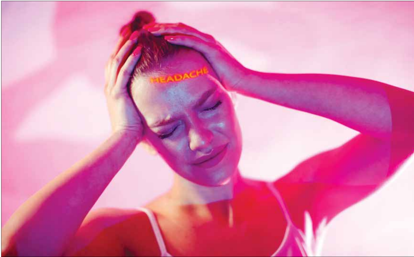
الصداع النصفي حالة عصبية شائعة

الصداع النصفي حالة عصبية يختلف تأثيرها بوضوح بين الذكور والإناث اللواتي يشكلن ثلثي المصابين به، ويحاول الباحثون أن يفهموا أكثر الأسباب الكامنة وراء هذه الاختلافات