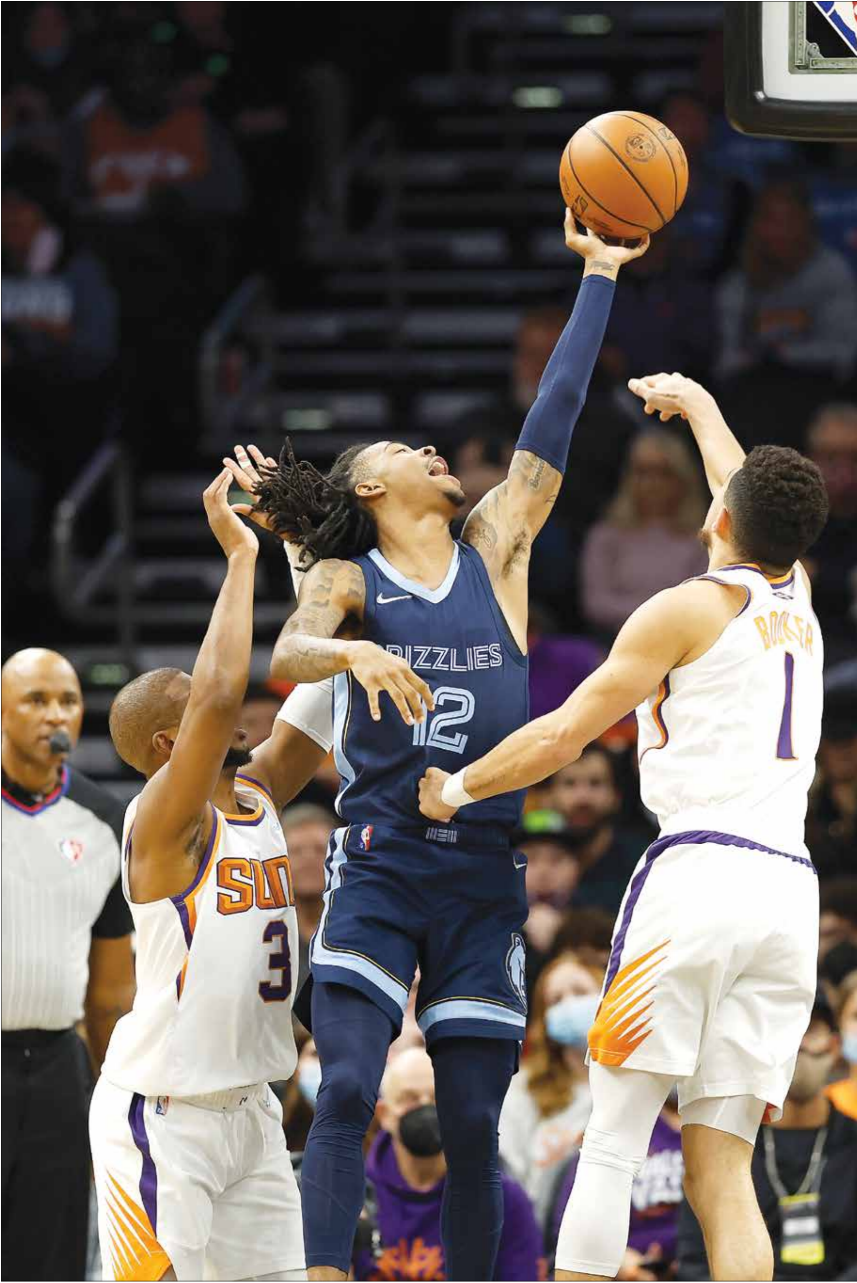
جا مورانت نجم فريق ممفيس غريزليز في المباراة