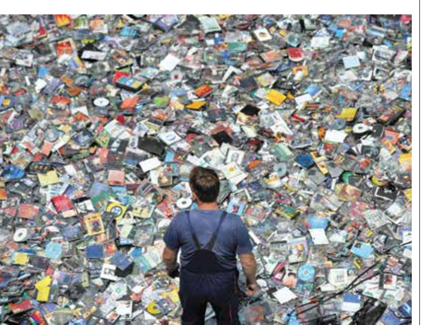
قرصنة الافلام، الإضرار بعم كئ شيء

بعض الأرقام مُفيد: من أصل 53 مليون مستخدم لا يترنن، هناك نحو 13 مليون شخص يسرقون، شهرياً، مبيعات كرة قدم وموسيقى وأفلام ومسلسلات. بعد أعوام شاهدة على تراجع عدد المقرضين، يرتفع العدد مجدداً، مع انتشار كوروتا. تقول الأرقام ما يلي: 16 مليون مقرض عام 2015، و12 مليوناً عام 2019، و8 ملايين بداية عام 2020. لكنّ، منذ مارس/آذار 2020، مع أول إغلاق دولي، أصبح الرقم 14 مليوناً. الأفلام والمسلسلات أكثر الأعمال