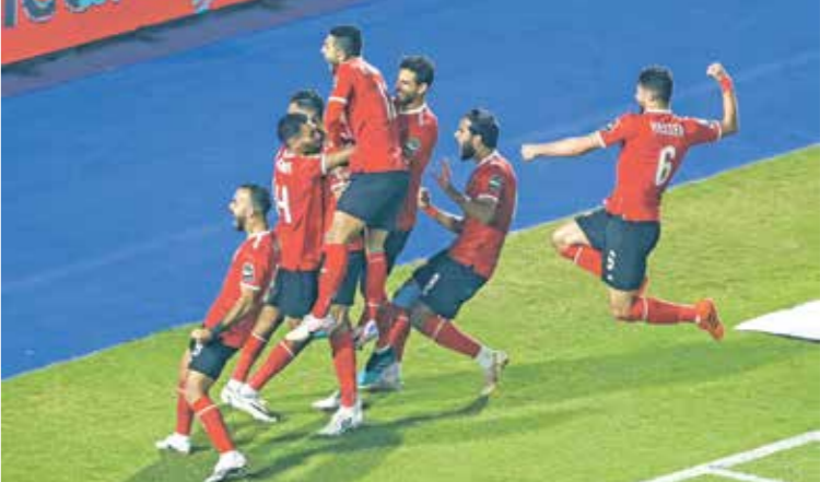
السولية قفشة سحبا هدف الاهلي

وقرر مسؤولو النادي الاهلي صرف مكافأة مالية للاعبين الفريق تصل إلى 500 ألف جنيه لكل لاعب في الأيام المقبلة، بخلاف مناقشة مدى إمكانية إقامة حفل لتكريم اللاعبين والجهاز الفني بعد الانجاز التاريخي. وأعرب الجنوب افريقي، بيتسو موسيماني، المدير الفني للنادي الاهلي بعد المباراة عن فخره بأول لقب حقيقي في حياته مع الفريق، بعد توليه السؤولية في أكتوبر/ تشرين الأول الماضي، في ضربة