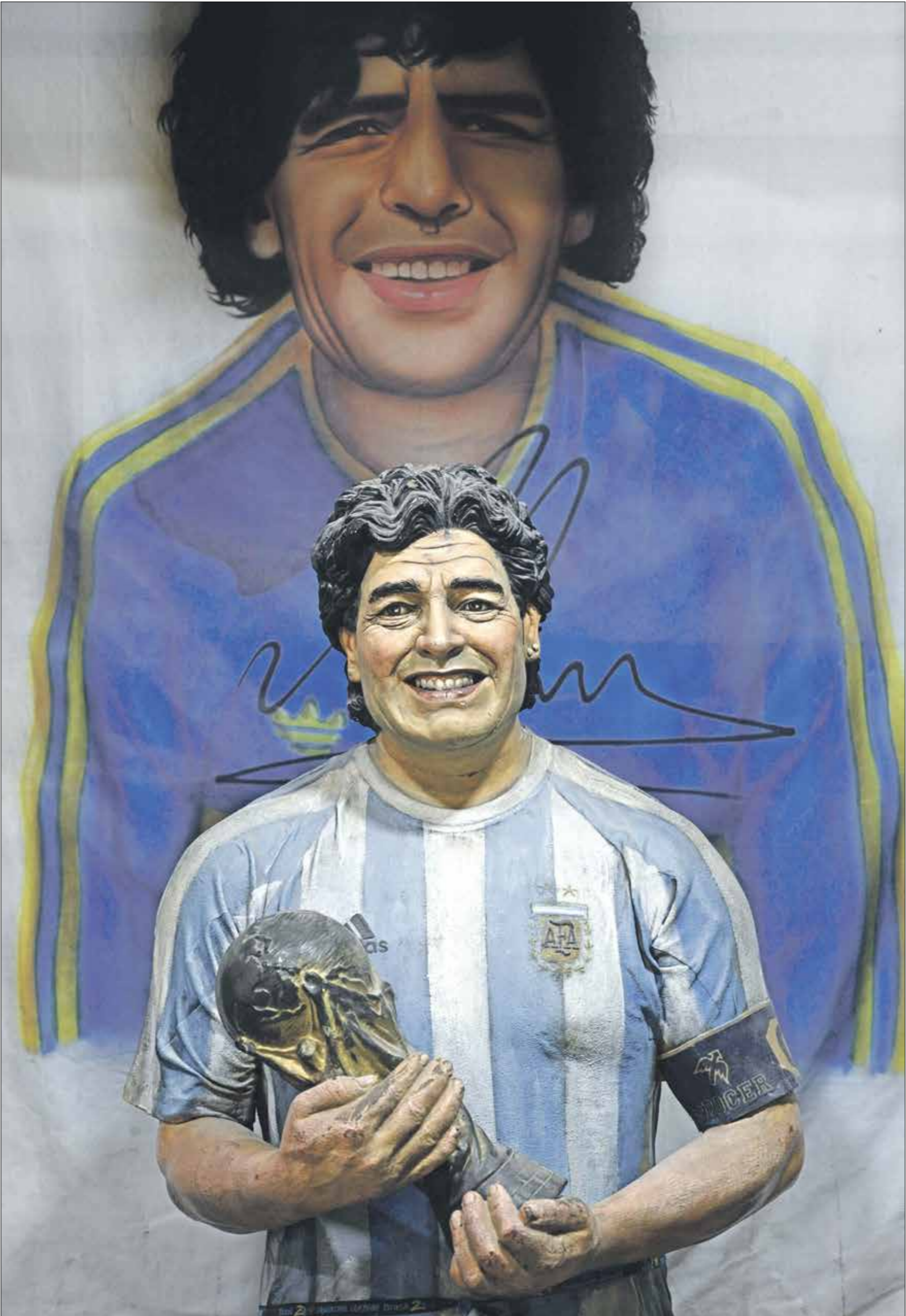
هذا سترع الإهمال الطبي برحيل مارادونا ؟

وتنتظر النيابة العامة النتائج المخبرية بعد أن وضع يده على الملف الطبي، بالإضافة إلى تحصيلات الكاميرات في المنطقة التي عاش فيها مارادونا أيامه الأخيرة. هذا وإنسر سجل إضافي بعد ظهور أحد موظفي الجنازة بلفظ صورة إلى جانب النعش المفقوح، ملاد مارادونا الأخير قبل الدفن يوم الخميس، فيما لم تنفع الاعتذارات المتكررة للجمعة مع وعد محامي مارادونا بمحاكمة المخالفين ومتابعة القضية حتى النهاية. وفي هذا الإطار، داهمت الشرطة الأرجنتينية منازل تعود إلى ثلاثة أشخاص التقطوا صوراً مع جثمان اسطورة كرة القدم دييغو مارادونا، داخل