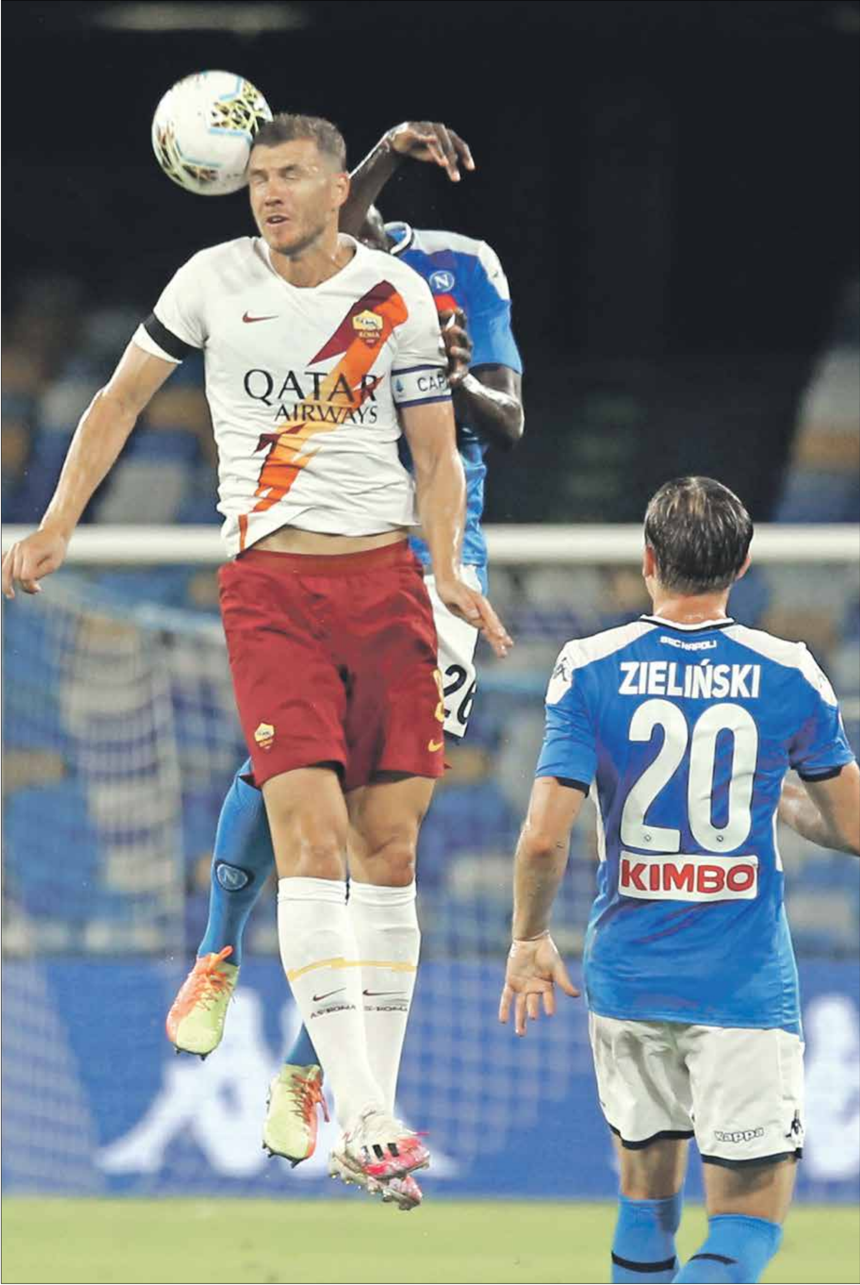
مواجهة قوية منتظرة في الدوري الإيطالي

تشهد الجولة التاسعة من منافسات بطولة الدوري الإيطالي لكرة القدم مواجهة إيطالية كلاسيكية بين نابولي وروما، على ملعب «ديغو ارماندو مارادونا». ويسعى كل فريق لمتابعة الانطلاقة المميزة محلياً ومحاولة تضيق الخناق على المتصدر، فريق ميلان، الذي يتعد بفارق 6 نقاط عن نابولي و3 عن روما.