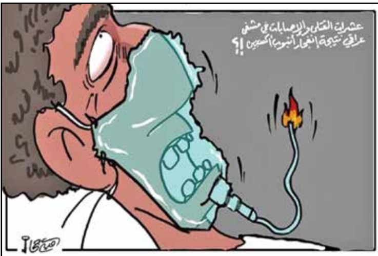
الأكسجيت القاتل في الصراف