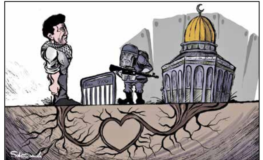
جنود إسرائيل وحواجزها لن تقطع رابطة العقادسة بقدسهم (محمد سايه، فيسبوك)