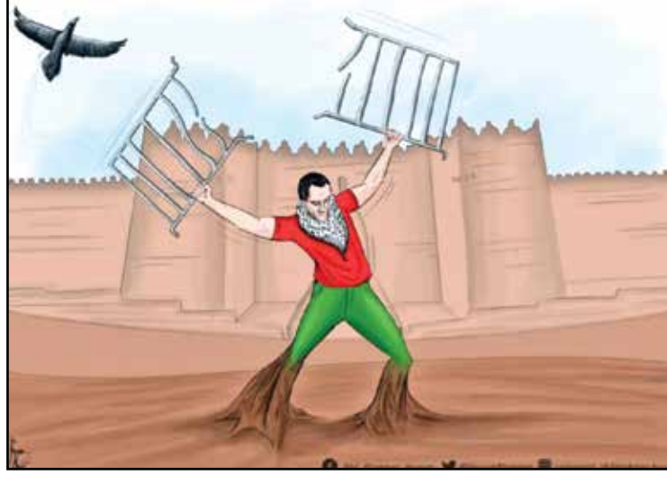
أهل القدس المرزوعين فيها يحطمون كل حواجز الاحتلال (عبدالرحمن حسيب، تويتر)

على وجه السرعة جمع الزعيم أركان نظامه للبحث عن مخرج لهذه «المعضلة»، ولا غرابة أنه رفض سائر المقترحات التي تمخضت عن قرائح «الأركان»، ولم يخرج إلا بحل واحد: «اصنعوا للشعب قمصانا وبناطيل بلا جيوب ووزعوها مجاناً عليهم، وبهذا ستكون قد حللنا معضلة جيوب الفقر».