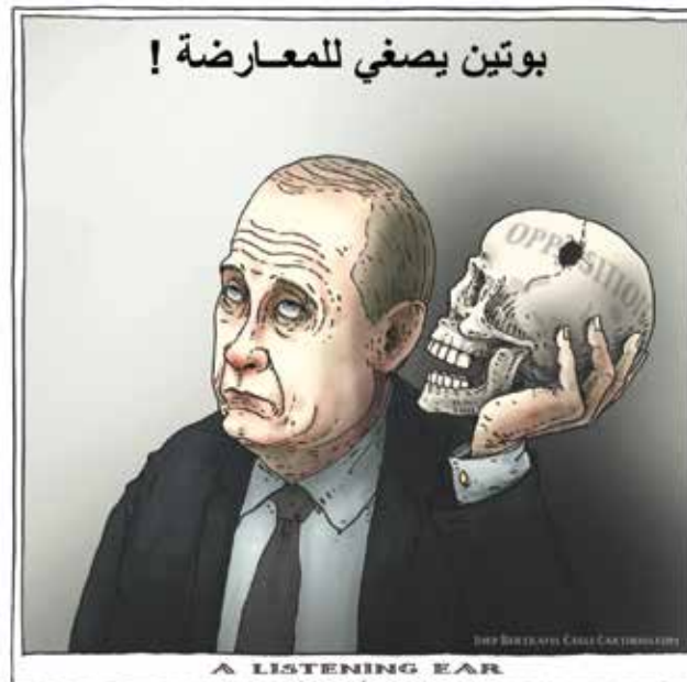
(جويب بر ترامز، كيغك كار تونز)