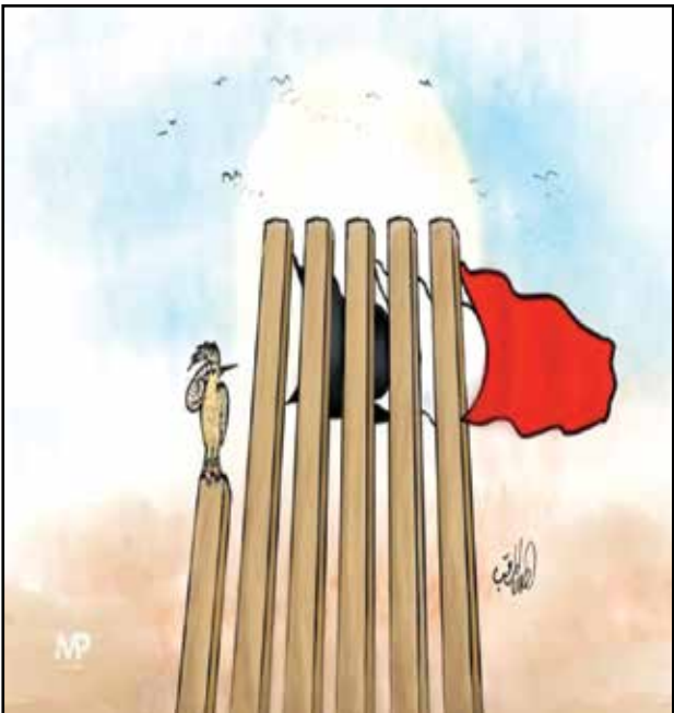
مارب مازالنت صامدة امام هجمات الحوثي