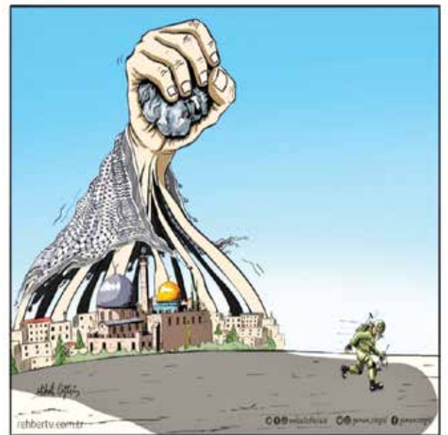
صمود القدس يربع الاحتلال