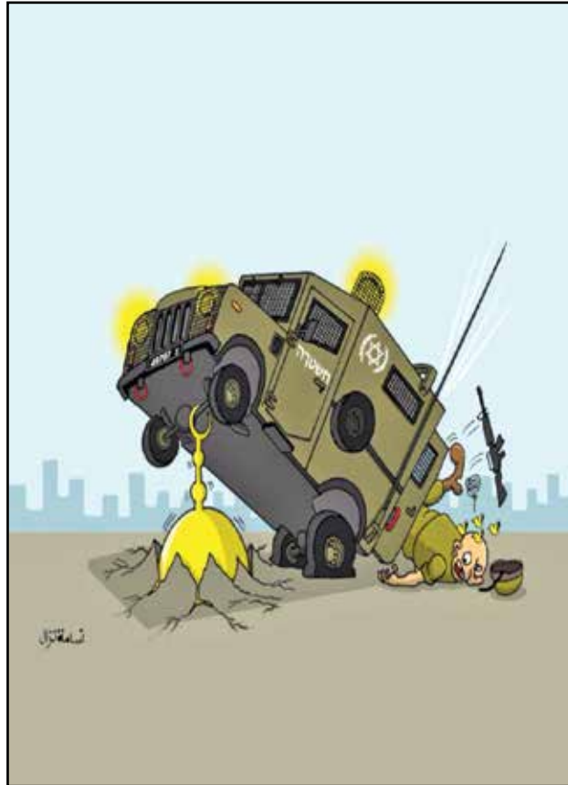
قبة الصخرة عثرة تقلب عربة الاحتلال الإسرائيلي (سامية زك، فيسبوك)

هبة القدس الباسلة والتي تصدر المشهد فيها أهالي المدينة المحتلة وهم يدافعون عن آخر ساحاتهم في باب العامود، كانت الموضوع الأكثر تأثيراً وحضوراً في مشهد الكاريكاتير العربي لهذا الأسبوع. شباب القدس الثائرون، ارتباك شرطة الاحتلال والمستوطنين، عودة أهل القدس إلى ساحاتهم، كلها لقطات مؤثرة ورمزية تفاعل معها الرسامون العرب وجسدوها في رسوماتهم. إليكم باقة منتقاة من الرسومات الكاريكاتيرية حول هبة القدس.