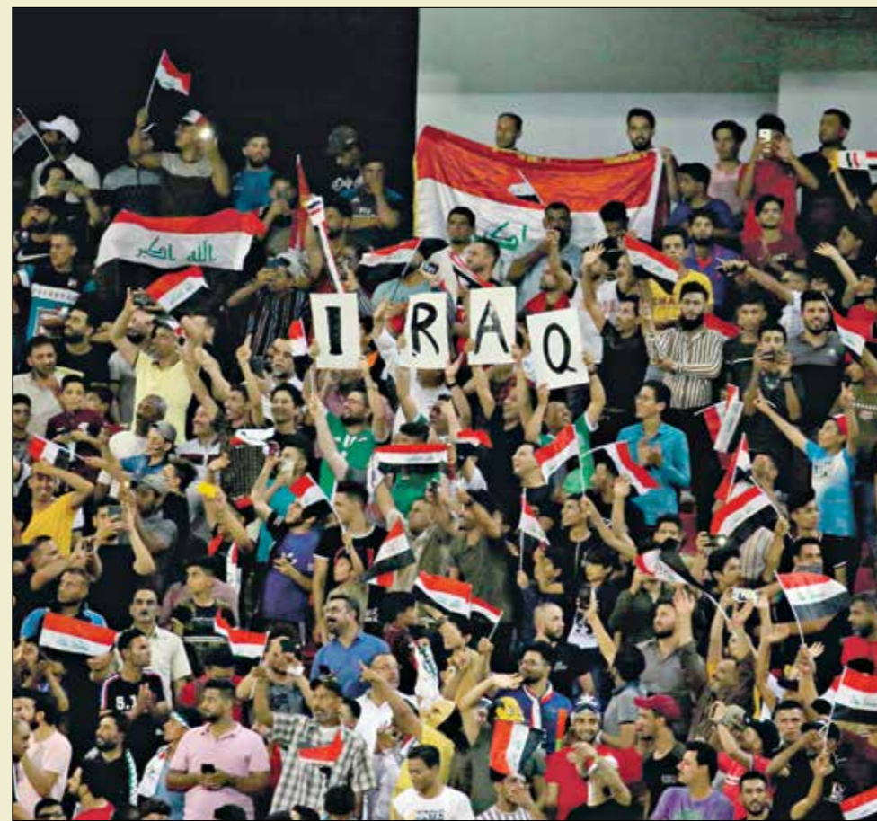
العراق حصد لقب الحدا في 3 مناسبات

الأملي، الذي خاض معه قرابة 13 موسماً وكان من أبرز نجوم الفريق على مر التاريخ. وتمتد تجربة اللاعب مع المنتخب السعودي سنوات طويلة، انطلقت في عام 1996، وتواصلت إلى عام 2018، وخلالها كان حاضراً في كأس العرب 1998.