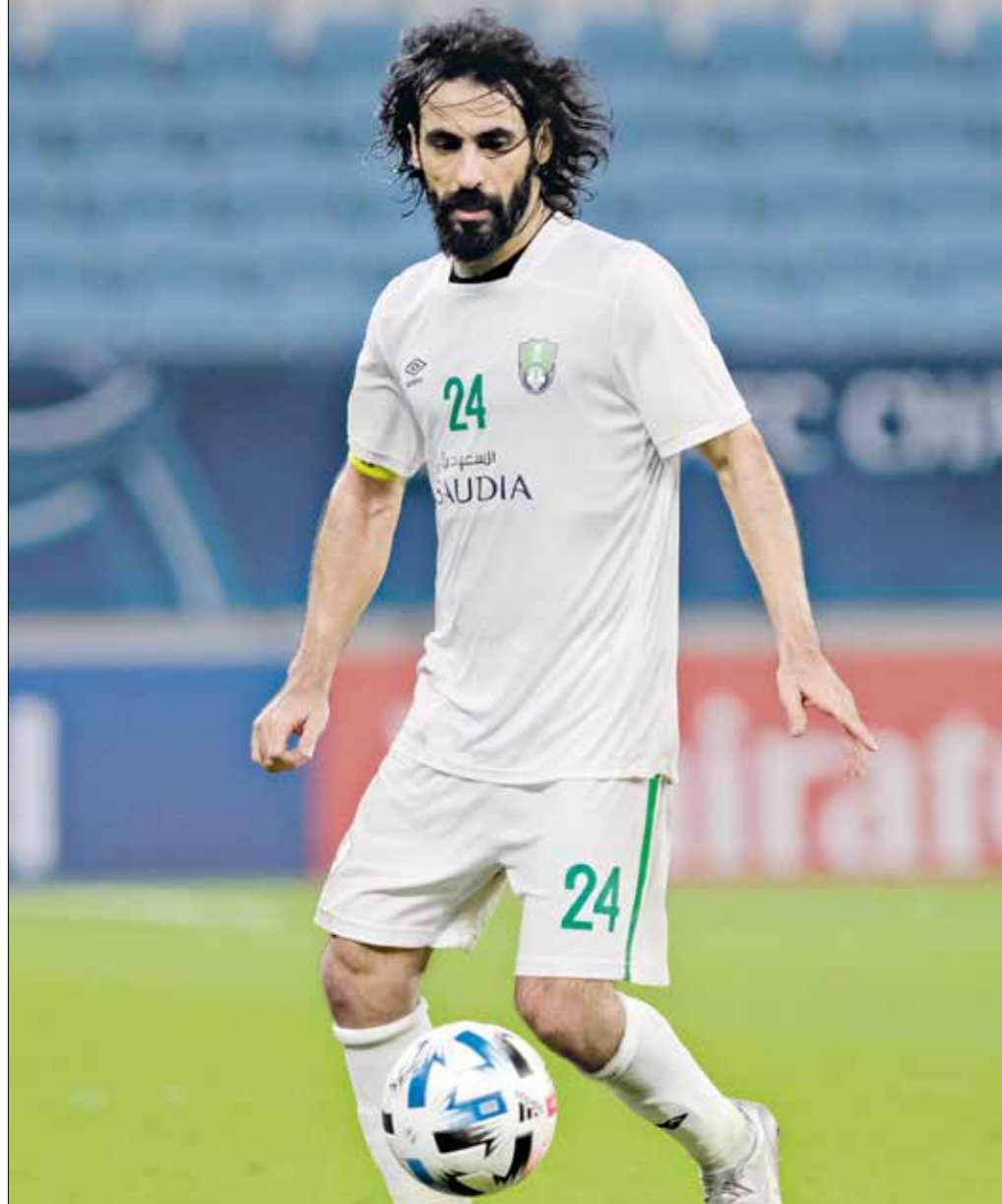
حسين عبد الغني شارك بكأس العرب 1998