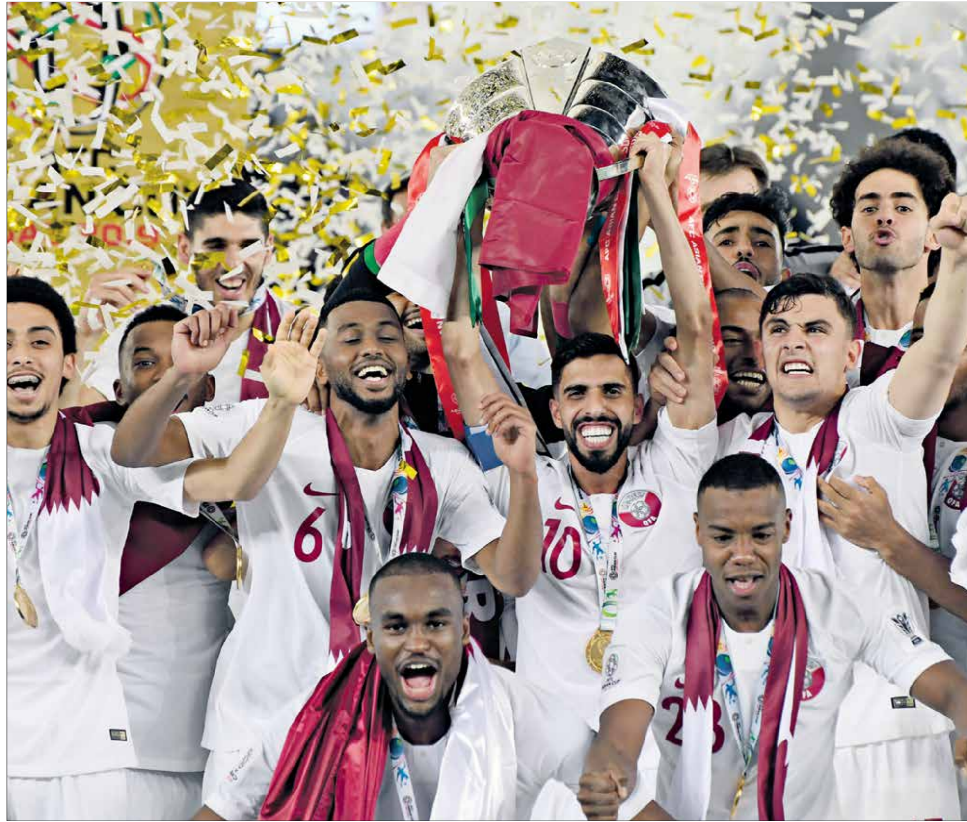
نك «العنابي» لقب كأس آسيا ويريد حصد كأس العرب