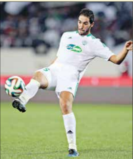
الصالحي هداف آخر نسخة لكأس العرب