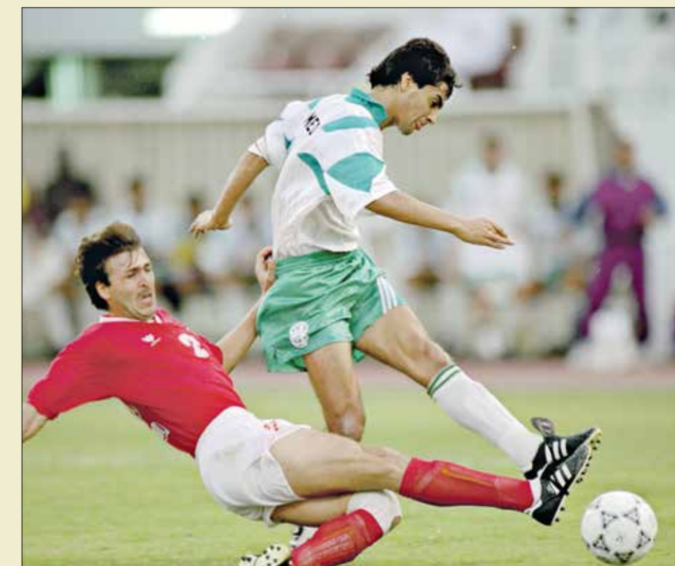
رجا رافع أحد نجوم سورية بكأس العرب