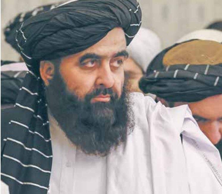
يقود ملقب الوهد إلى الدوحة (صفا كركان/الناضور)