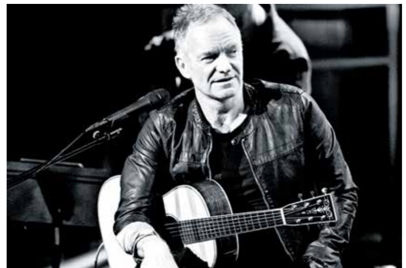
أحد مصغرات عالم العما طبعاً هادنا من دون تكلف

يستهل ستينغ، في الأغنية الافتتاحية RUSHING WATER، بالحنان موسيقى