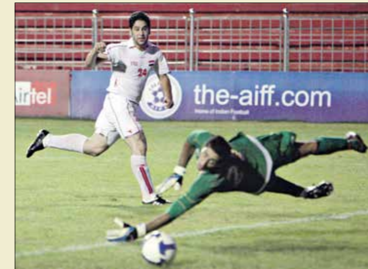
رجا رافع أحد نجوم سورية بكأس العرب