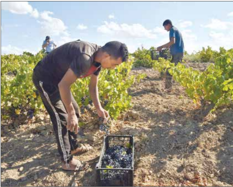
تراجع المساحات المزروعة

مقارنة بالاعوام السابقة. وتخص العملية الري العادي، والتي بتقنية التقطير، كما تخص شراء مضخات الأبار، الجوية، وتقدر كلفة الدعم بحوالي 120 ألف دينار (900 دولار)، فيما بلغ دعم إقامة الأحواض المائية بغشاء بلاستيك ما يصل إلى 400 ألف دينار (3000 دولار). ولديسمبر/ كانون الأول المقبل ارتفعت الأوكسجين بالنسبة لمنتجي الحبوب والقمح، إذ تعطيلهم تمهيدا لفرصة ثانية لبعث محاصيل القمح تمهيدا لحملة الخصاب، القادمة، فأتتها أدخلت المزارعين منتجي الحبوب والفواكه في سباق مع عقارب الزمن، بالنظر لاعتمادهم على الزراعة الموسمية الإيتية.