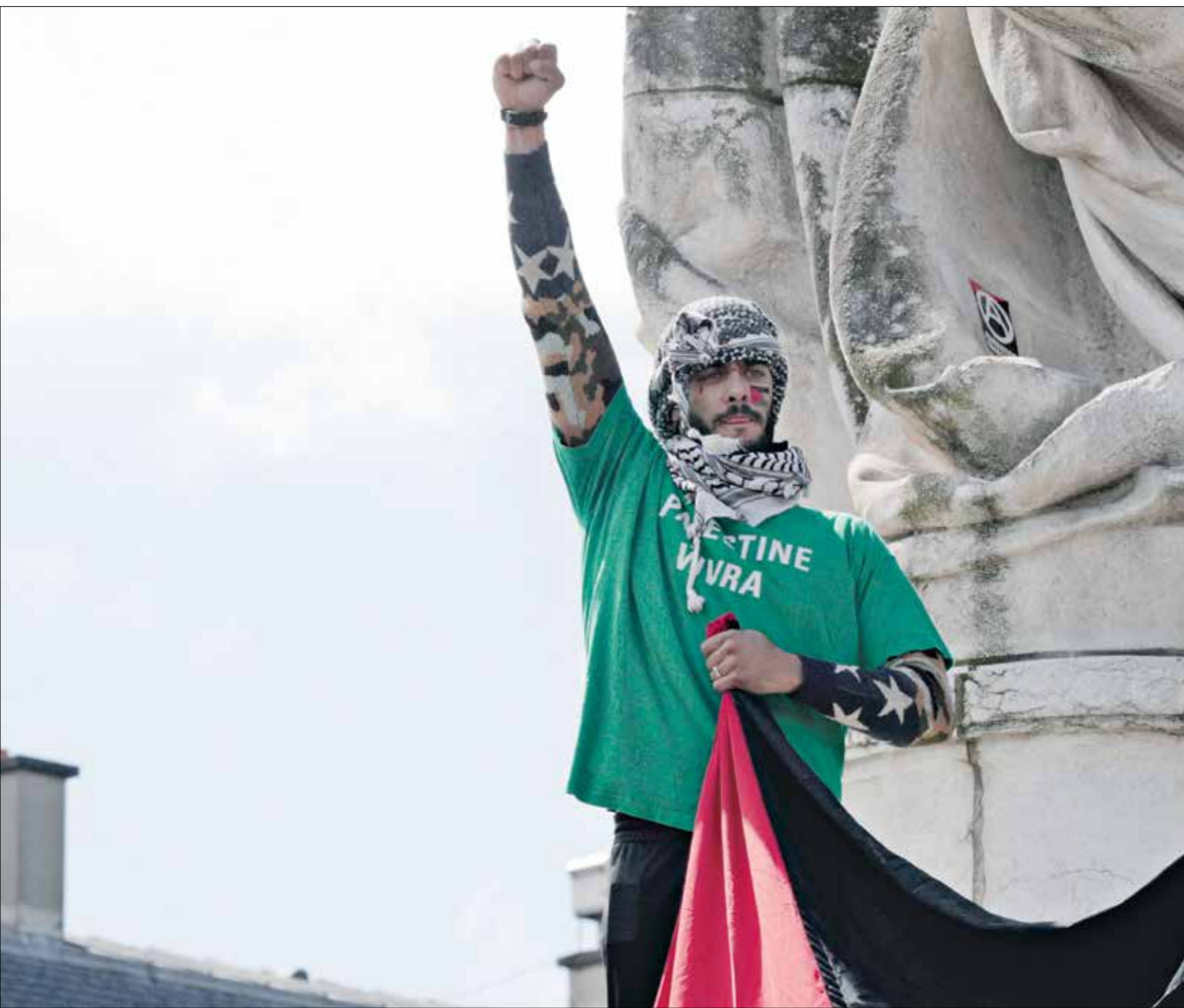
دعم للمستفيين من فرنسا