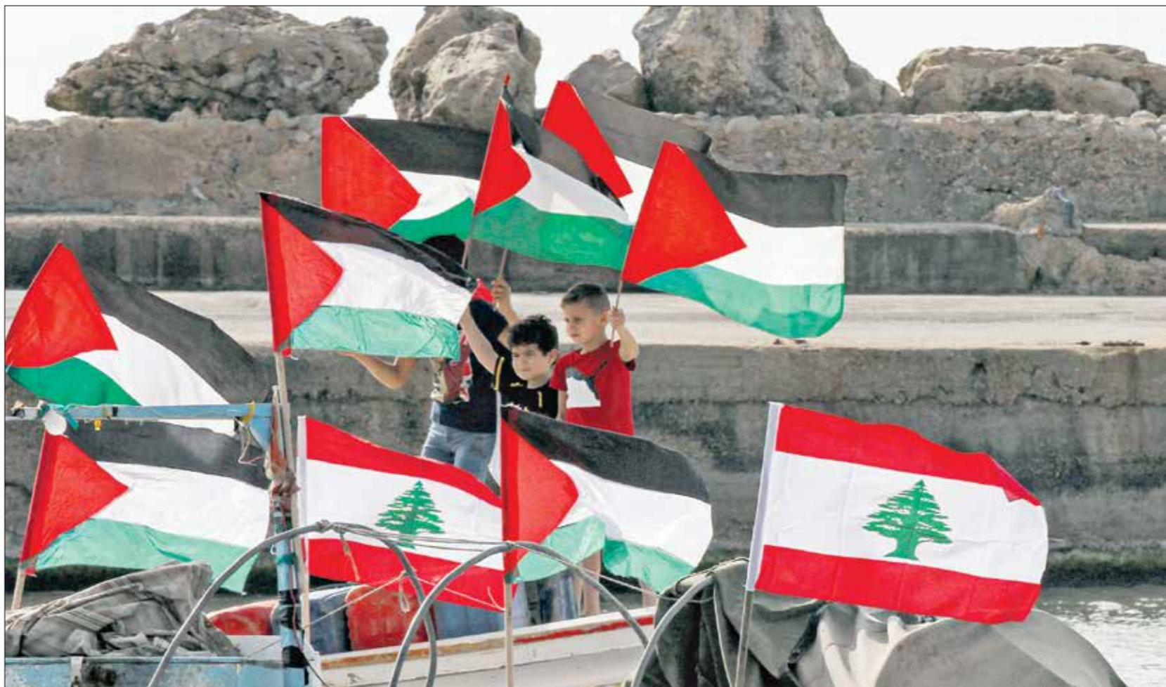
مستفيين في باك اطفال لبنان