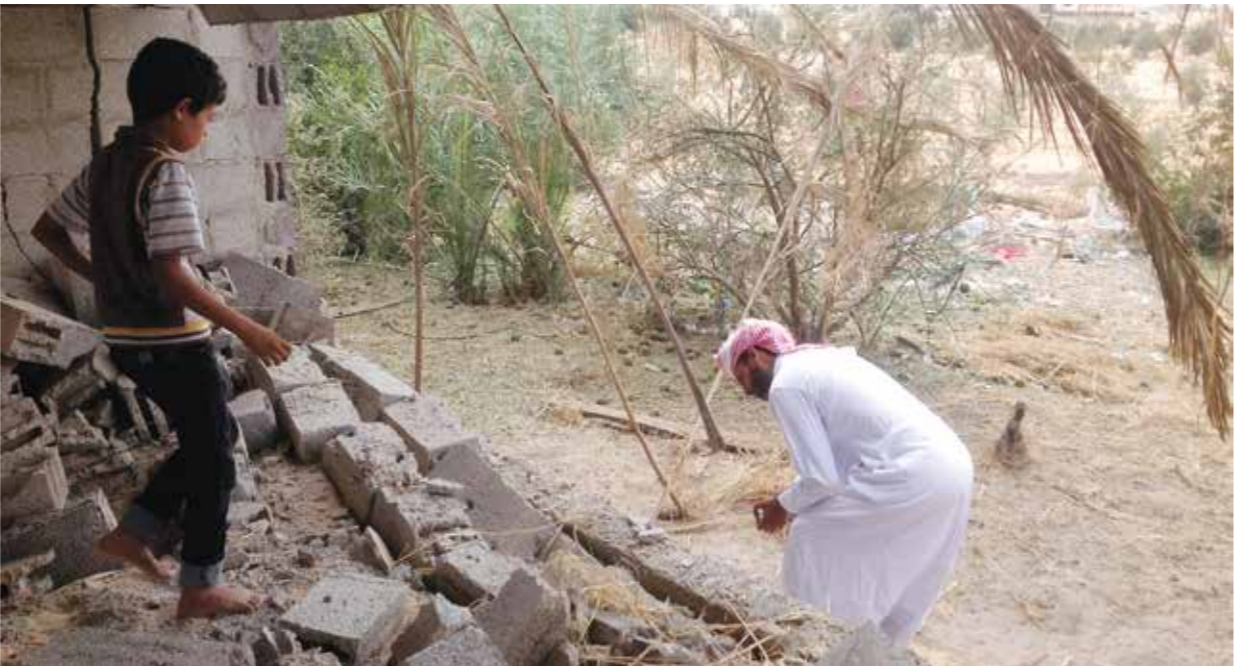
لم افرع عودة المواطنين لقراهم بعد التهجير 7 سنوات

وأوضح الشيخ أن المواطنين يطالبون القيادة بالجيش المصري بعودة عشرات الآلاف من