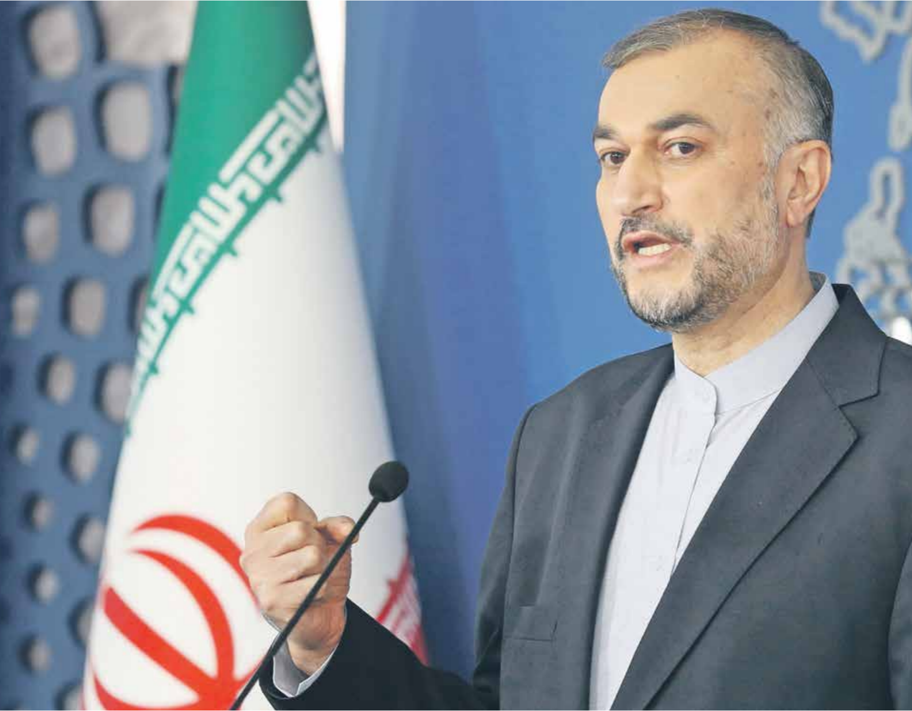
عبد اللهيان، اتخذنا جميع الترتيبات للتوصل إلى اتفاق سريع، في فيينا