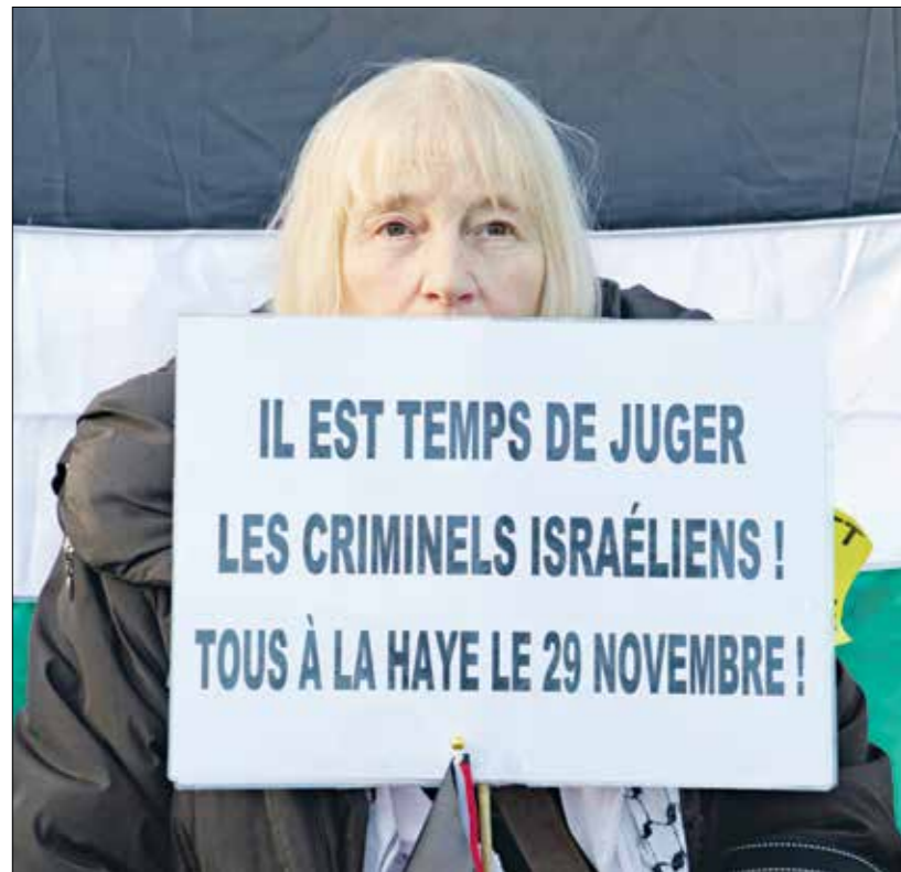
رضع للجرائم الإسرائيلية في هولندا