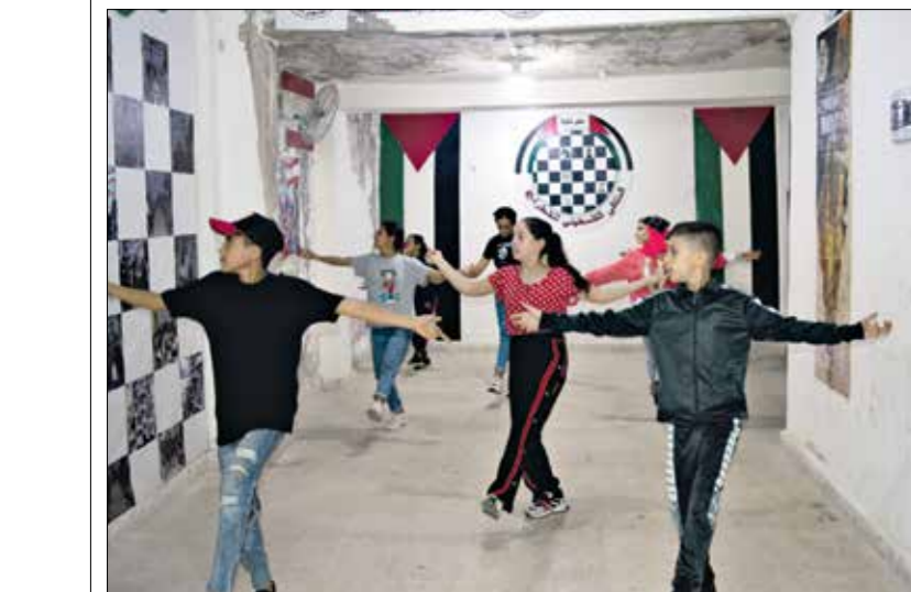
يلدرون بحضرة والدفاع (الضرب الحديث)