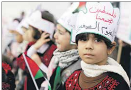
عزة في بلوهم