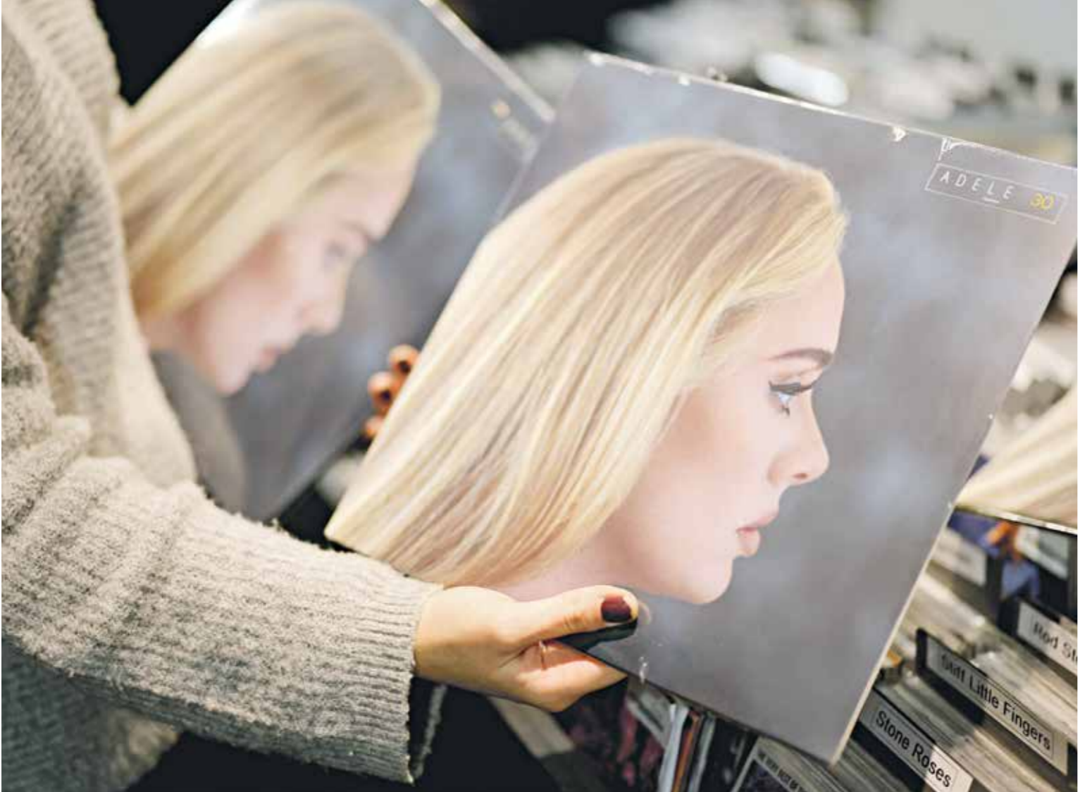
الألبوم الجديد من «30» الذي اختارته سلوات روناغا كإحدى مراسم برسن

■ ماذا تمثل لك تجربة فيلم «المحكمة»؟ الحمد لله تجربة جديدة أتمنى أن تحوز على إعجاب الجمهور وأكون عند حسن ظنه وأنا بالطبع لا أستطيع الحديث عن كتابات المؤلف الكبير احمد عبد الله، فهو كاتب يستطيع جيداً أن يلهم ما في المجتمع من قضايا وإزمات ورصدها من خلال شكل