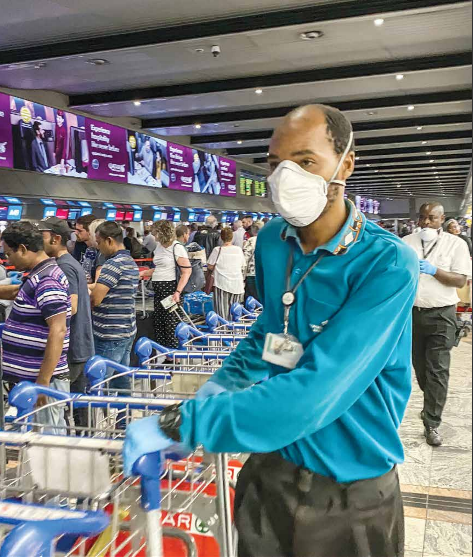
متساورون في مطار أولمبير رينالد تامبو في جوماسبرغ

وقالت الهيئة، في بيان لها، إنه ينبغي تقديم عروض تتضمن الدفع عند الإطلاع، وإن الموعد النهائي لتلقي العروض هو يوم الاثنين.