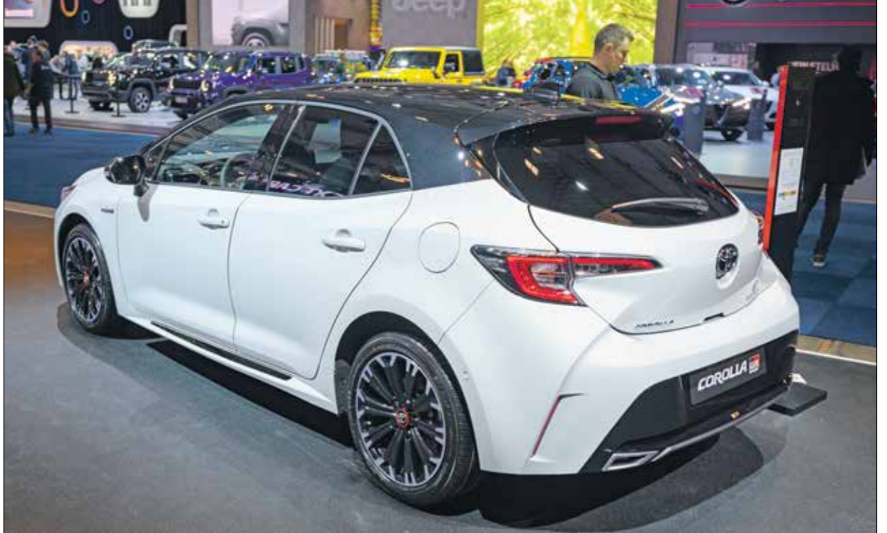
«تويوتا كورولا»، الأولى بحادث الأليات لتلجها عام 1966