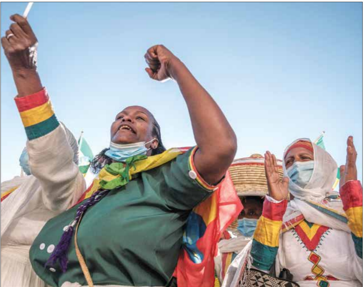
خلك حظه في اديس ابابا بعدما لقوات الحكومية

والجمعة، بث الإعلام الرسمي تسجيلاً مصوراً قال إنه الأول لأبي بري عسكري على الجبهة، وتضمن التسجيل مقابلة تعهد رئيس الوزراء فيها بـ«فن العدو»، وفتحت وسائل الإعلام المستقلة عملياً من الوصول إلى المناطق المتأثرة بالحرب في الأسابيع الأخيرة وإقام مسؤولون في إديس أبابا أمس حفلاً للبريانيين والغفائين الذين سيتجهون شمالاً لزيارة قوات الجيش. في الأثناء، يزداد القلق الدولي حيال إمكانية شن المتمردين هجوماً على العاصمة، فيما تكرر دول عدة باستمرار، إلى التشديد أول من أمس على ضرورة