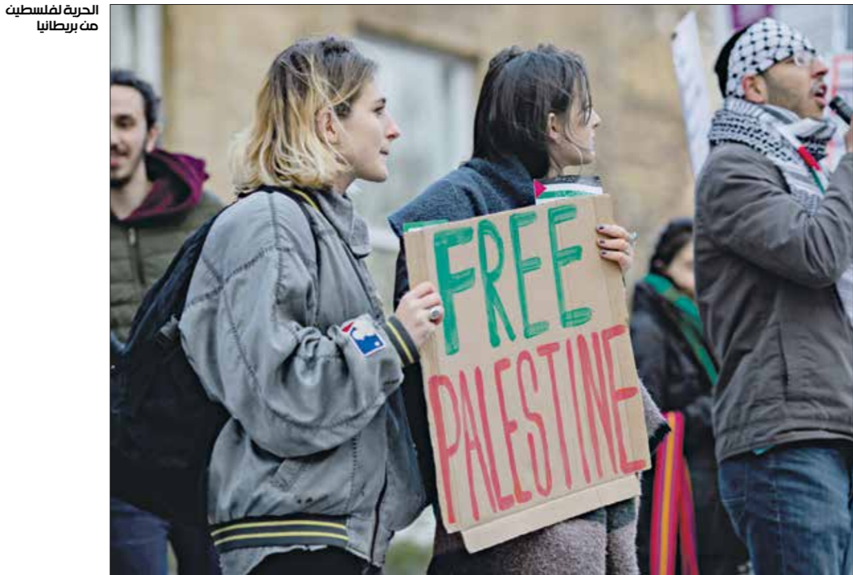
الحرية لفلسطين من بريطانيا