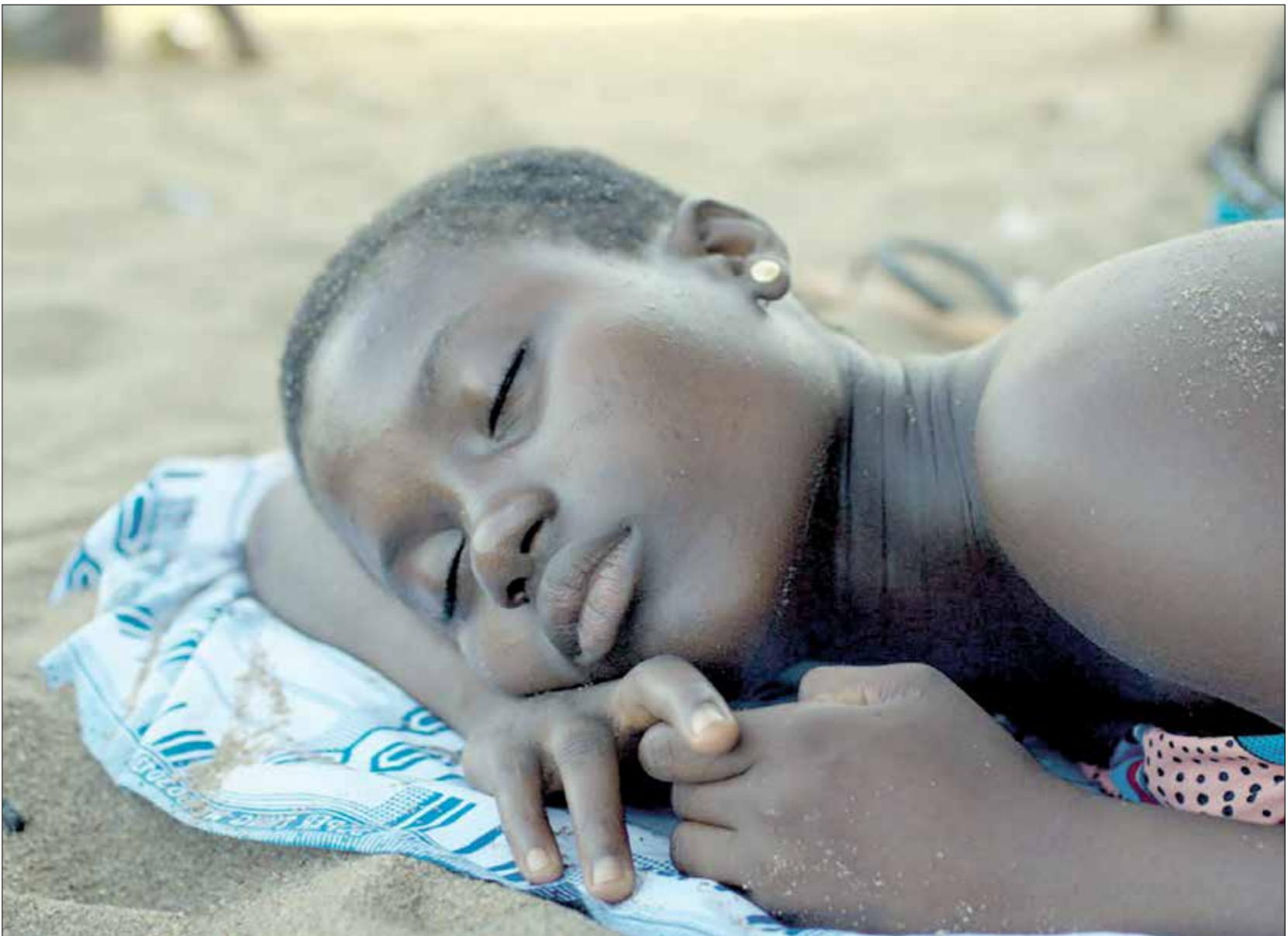
شارة الفيلم في «المهرجان الدولي لفيلم المرأة بسلا» (ميسوتك)

في بيئة عدوانية شحيحة، من دون أن تشبع هذا يُسبِّب إنهاكاً بدنياً هائلاً، يجعل النوم مسيطراً على الجفون. في أجواء كهذه، ينتقل ملل الحياة الواقعية إلى إيقاع الفيلم هكذا، يصير الفيلم التخيلي توثيقاً في جوانب كثيرة منه. هذه خاصية فنية، تحجبها المهرجانات السينمائية، ولا يلمقها شباك التذاكر. يتاكل الساحل يتقدم البحر، ويمحو البلد. مراهقة تتأمل تبذل اطلال موطئها، تبور