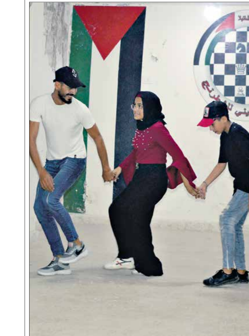
يبدأ مع المدرب (الضرب الحديث)

وتشمل حظر وكالات الاستخدام الخاصة التى تكون ضالعة فى الإساءات والممارسات الاحتلالية».