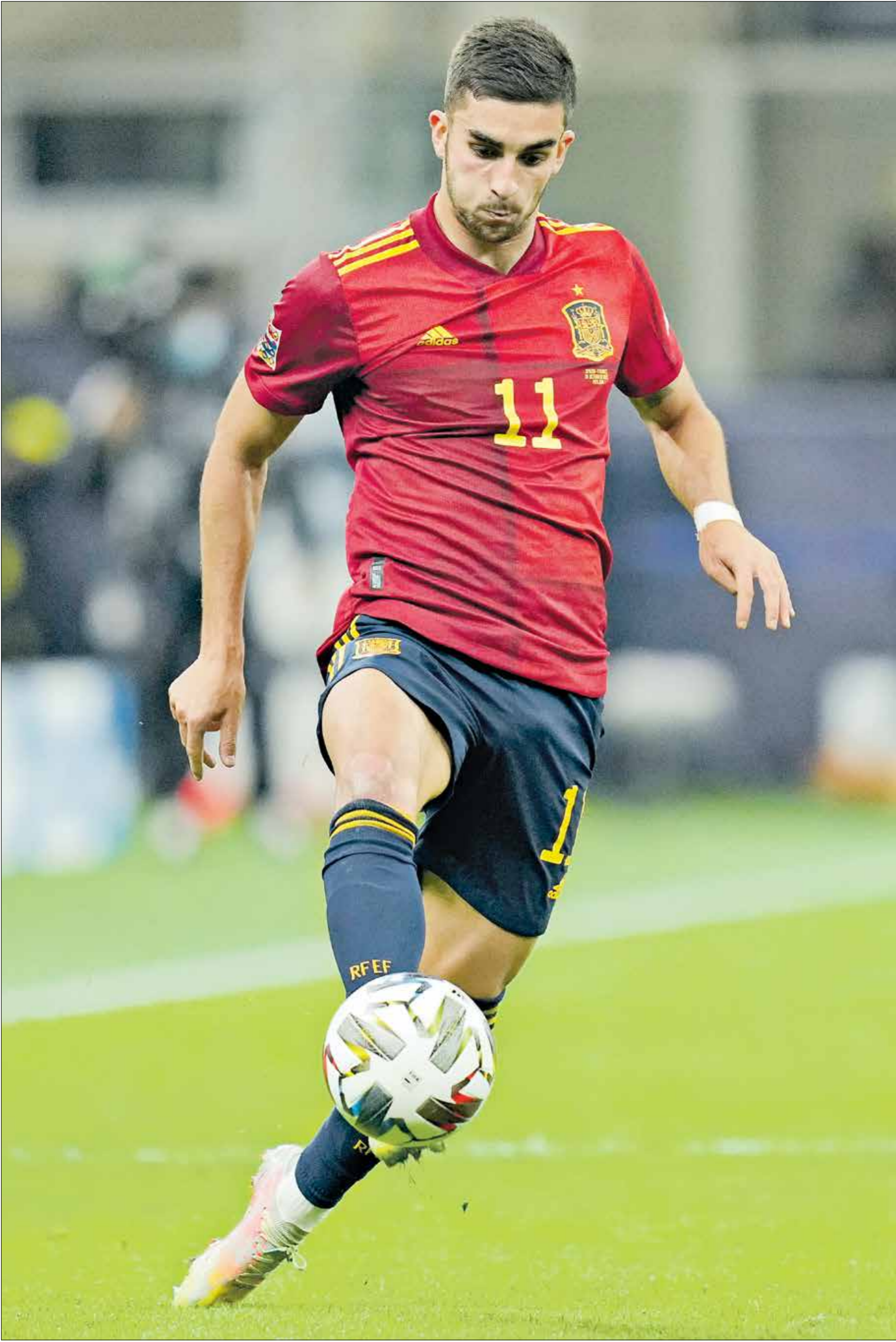
توريس يريد مغادرة مانشستر سيتي لأنه لا يلعب كثيرا