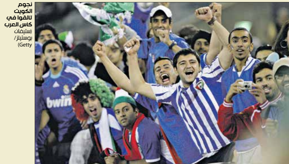
نجوم الكويت نافوا في كأس العرب