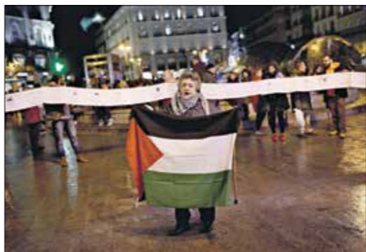
تضام من اسبانيا