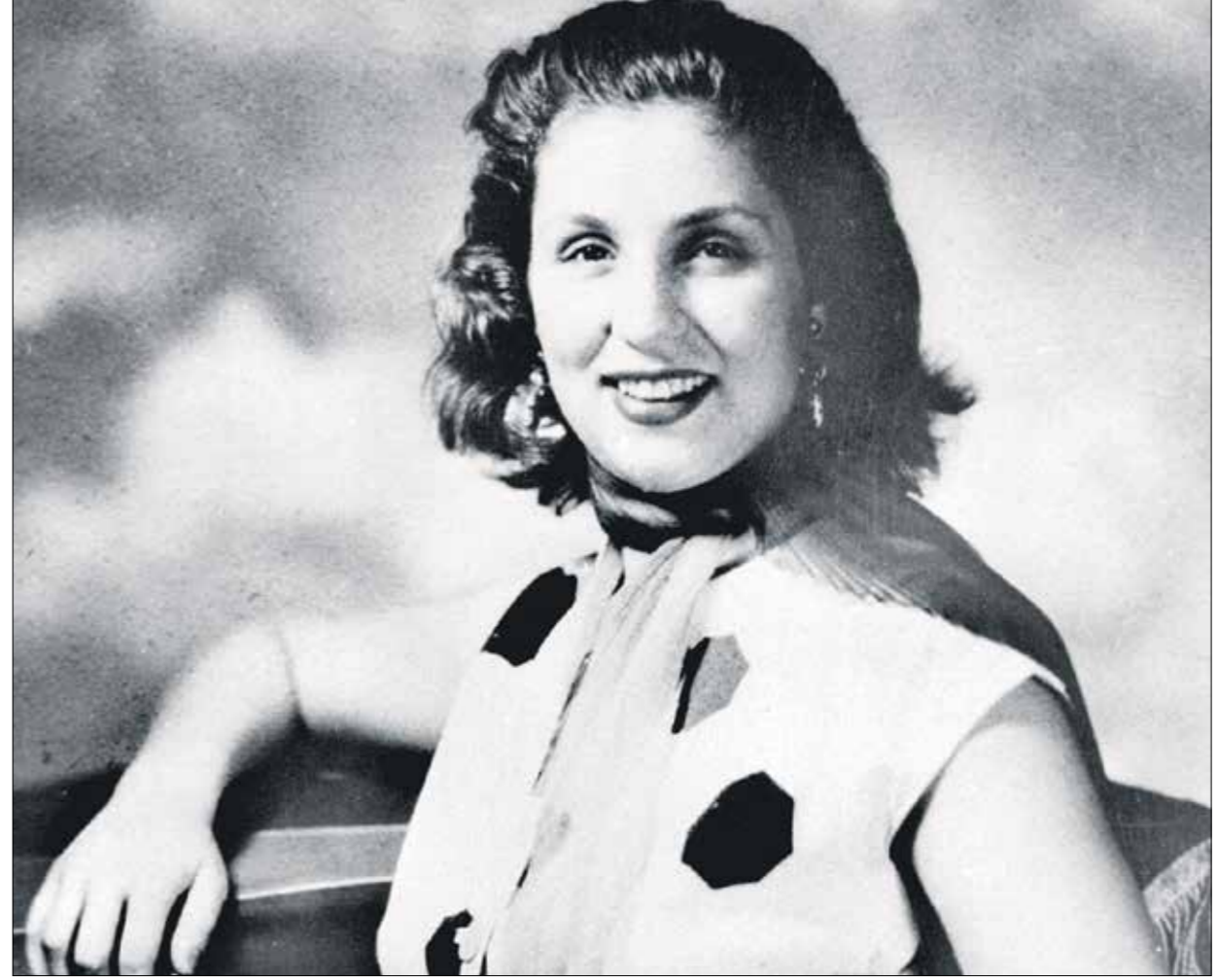
كان حظها اوفر مع جيلها من المحبين المصريين

في مثل هذه الايام من عام 2014، رحلت الفنانة صباح. قبل ان يمضي فيلمون وهبي الى مصر، كان يقترح عليها ان لبثانية جبليّة، انحسرت الشحورة بنمط غنائي لازمه الخفة، ما حرم صوتها من التعبير كاملة فيه