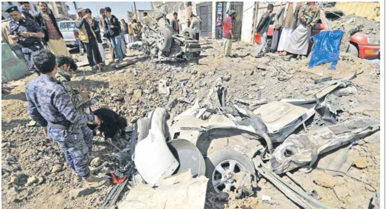
لم تعد مخازن الصواريخ والطائرات الهدف الوحيد للتحالف

وأوضح السكان أن العمليات الأخيرة مغامرة لسابقاتها، حيث تشهد العاصمة انفجارات غير مسبوقة، ما يشير إلى استخدام صواريخ وقذائف شديدة الانفجار، بهدف الوصول إلى اتفاق وملاحي سرية لأسلحة الحوثيين.