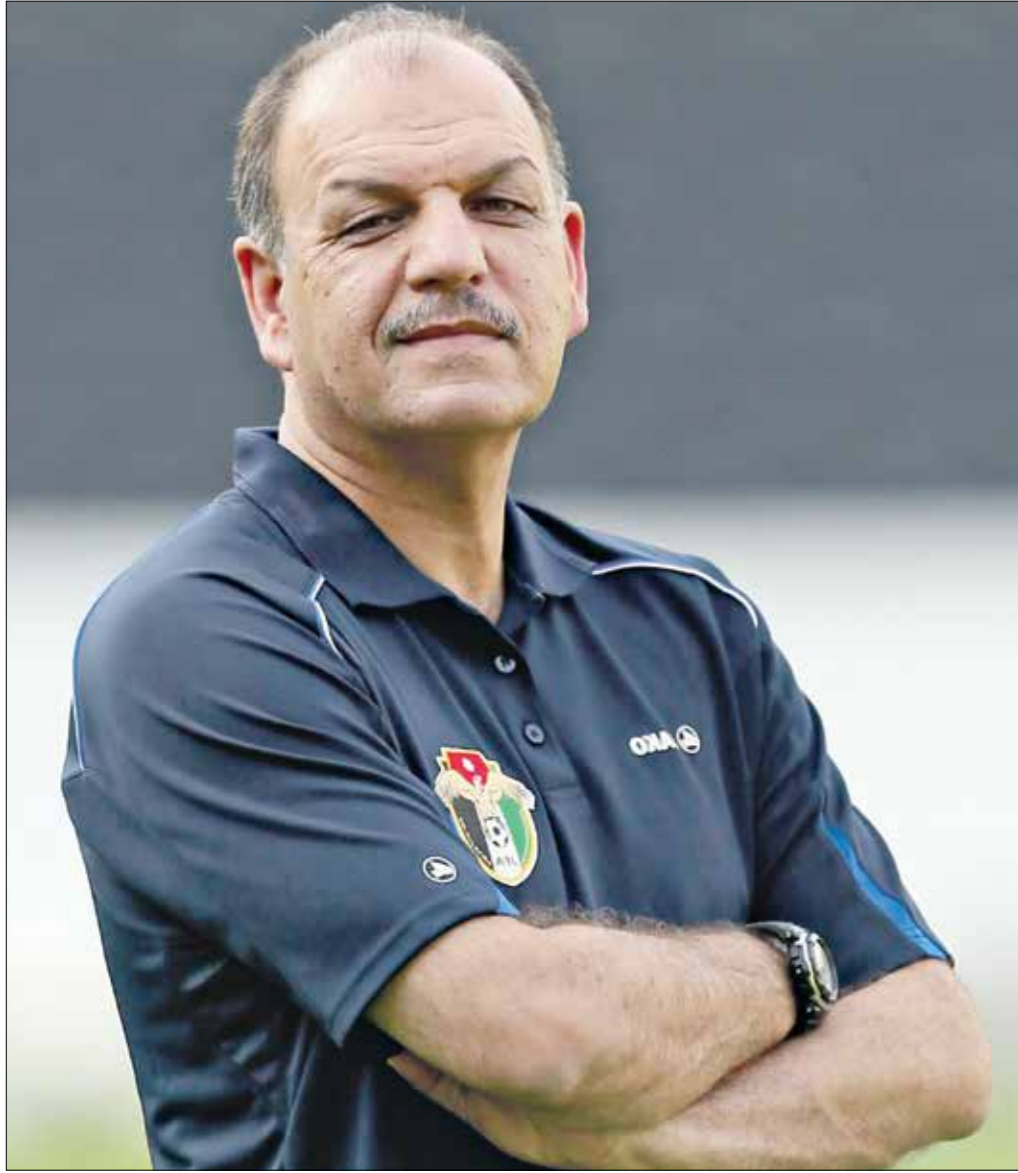
مدى حمد يامل بالمنافسة على اللقب