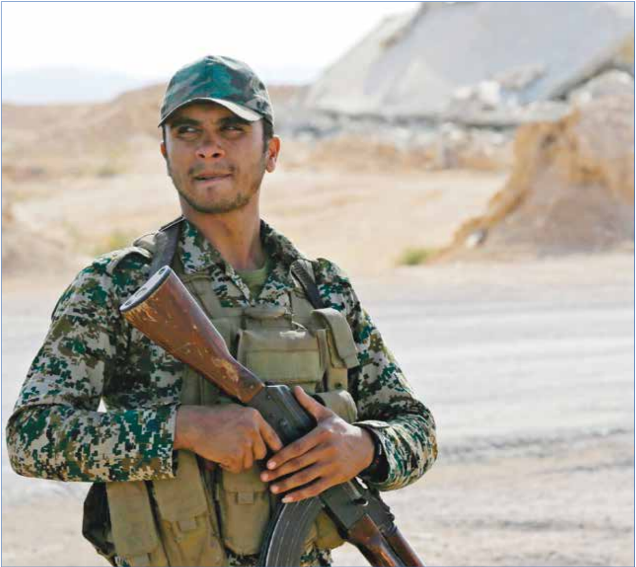
تقع البادية السورية تحت سيطرة قوات النظام