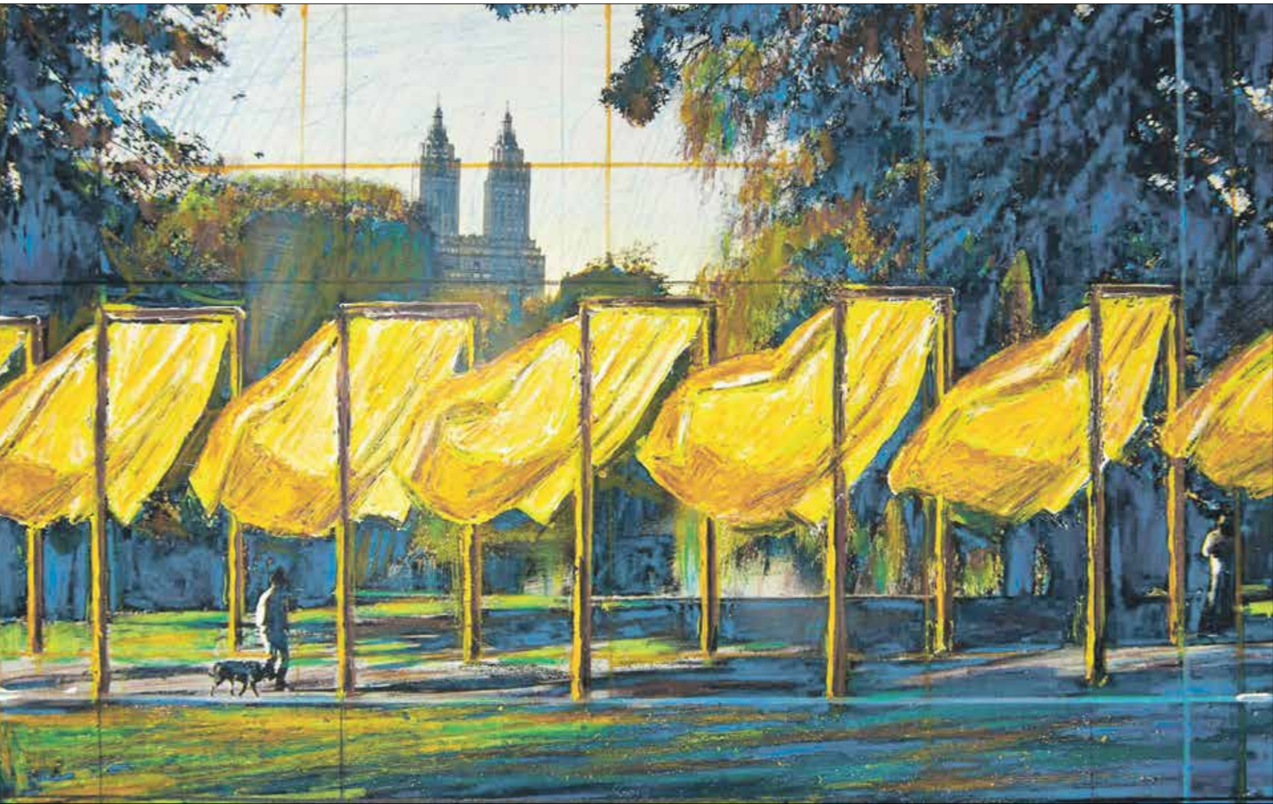
رسم تحضيريّ للهيبر «البنائات»، كريستو جاشاف، بناريا

تحميل السفن، مصفاة النفط، المستفي، يحملونها على مقطورات تتبع خط رحلتهم السنوي من موقف إلى موقف هنا يبقى قائما نصف سوفرونيا ذو أروقة التدريب على الرمي، ذوات الخيول، الصرحة المتدلّية من عربة مقلّمة سكة حديد الملاهي، ونبدأ باحتساب عدد الشهور والأيام التي يجب أن تنتظرها قبل أن تعود القافلة، وتستطيع حياة كاملة أن تبدأ مجدداً.