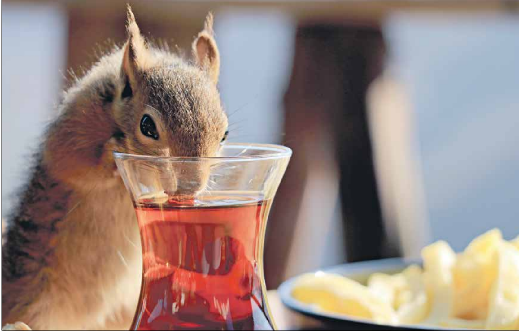
بعض أنواع القوارض في الماضي تعرضت بشكل متكرر للإصابة بفيروسات كورونا

أشارت دراسة جديدة إلى أنّ أسلاف القوارض هي أوّل من أصيبت بفيروسات شبيهة بفيروس السارس، مما يعني أنّ فيروس كوفيد المقبل ربما يأتي من الضران