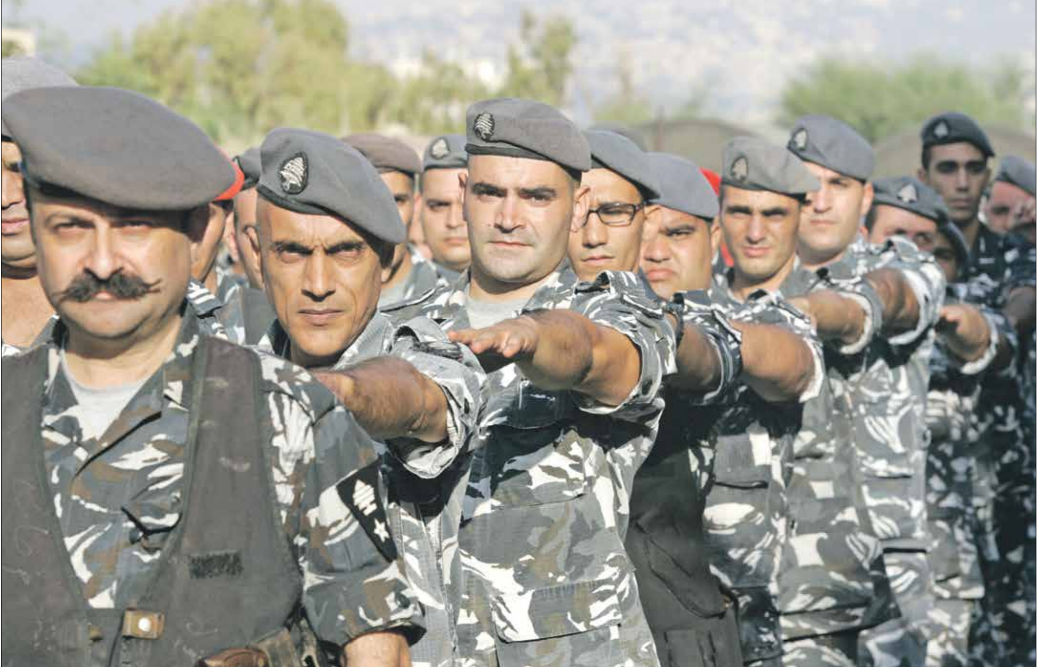
عناصر تقاعدوا منذ أكثر من عام ولم يحصلوا على مستحقاتهم

بات الفرار من الخدمة حلاً وحيداً أمام بعض عناصر قوى الأمن الداخلي اللبنانية، إذ يمنحهم القانون من العمل في مكان آخر وترفض طلبات تسريحهم أو منحهم ماذونيات سفر، بينما فقدت روايتهم قيمتها بعد انهيار العملة الوطنية