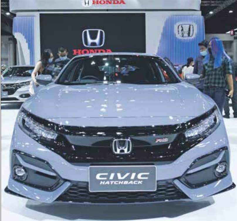
«هوندا سيفيك»، الثانية تم اطلاق أول طرازاتها عام 1972