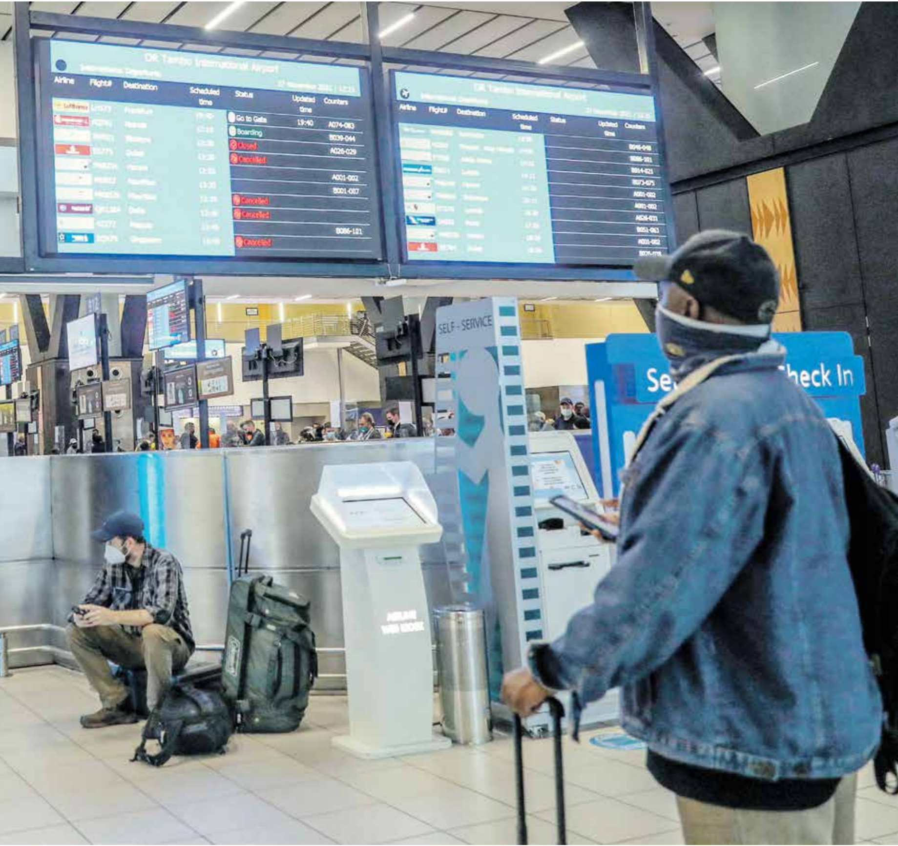
عند المتحور «أوميكرون» عشرات الرحلات الجوية

عدد الطفرات التى يضمها متحور فيروس كورونا «أوميكرون»، ما يجعله أسرع انتشاراً ومقاومة للقاحات.