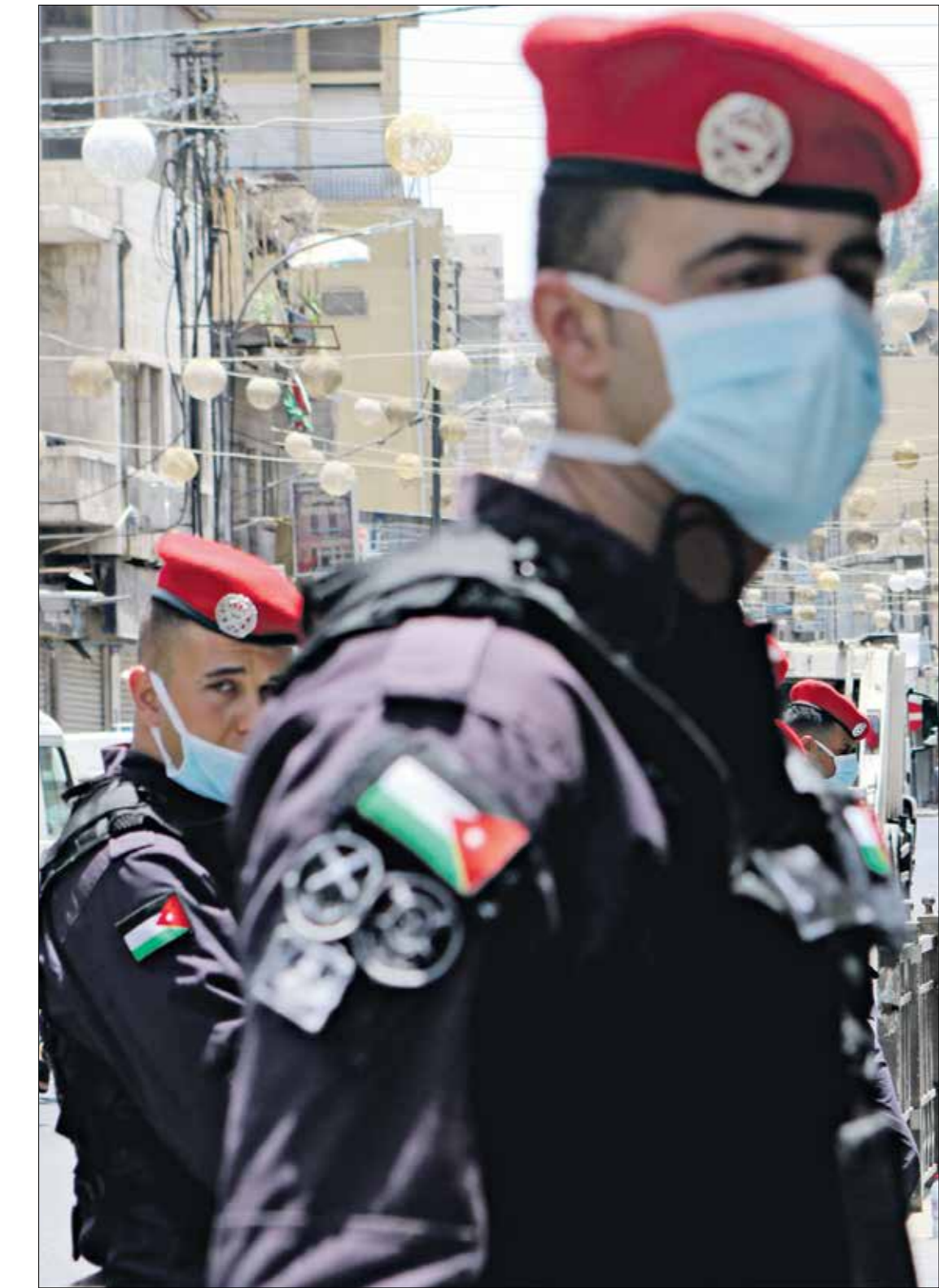
قانون الدفاع والأوامر والبلغات الصادرة بموجبه قيدت عمل الصحافيين

على أنواعها التقليدية، لما أصابها من اعتلال أعرق، مقارنة بالحدثة منها، لكن الواقع يعكس أزمة تشمل أنواعها جميعاً، ويوضح بريّة: «مبكراً، شخصت أزمة الصحافة الوطنية بأنها تعبير عن صراع بقاء، جذوته تستند إلى هوامش التكلفة وثورة الاتصالات، وتخوض الصحافة الورقية في مواجهة الصحافة الإلكترونية، بيد أنّ أمر الأزمة ظهر أكثر وضوحاً مع ترويتها، ليتبين أنّها تمتد إلى مختلف أنواع وسائل الإعلام». ويضيف: «لا