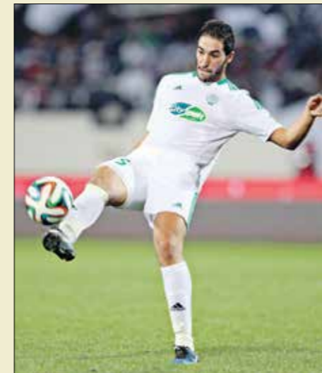
الصالح هدف آخر نسخة لكأس العرب