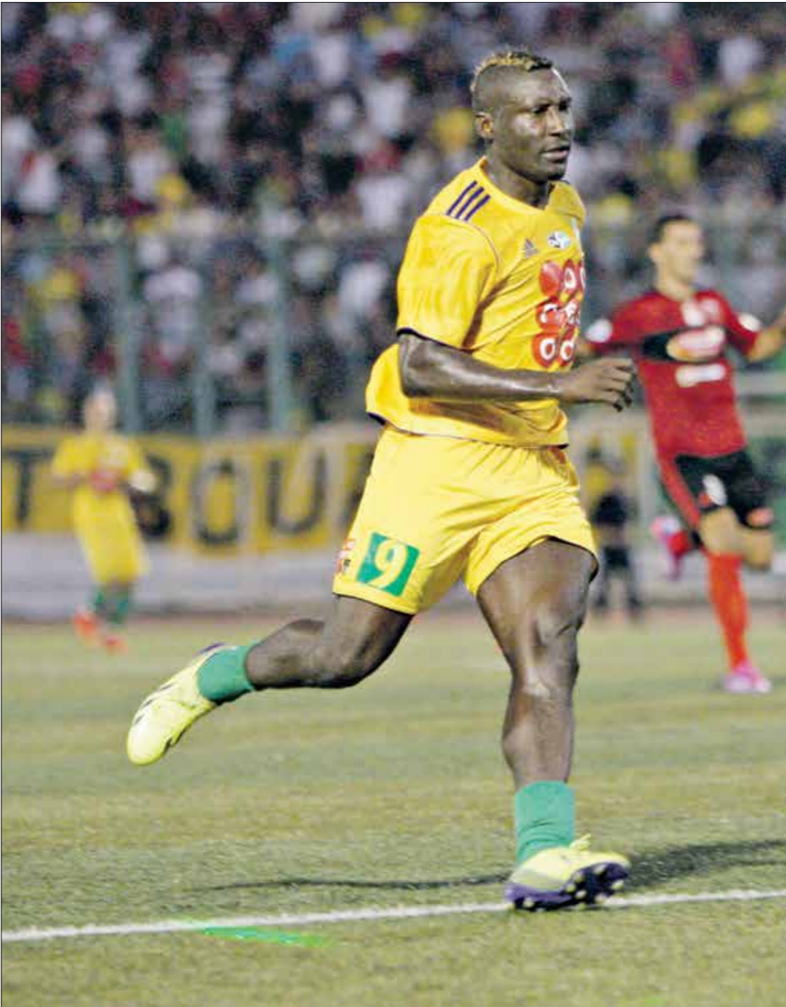
بحث شبيبة القبائل الجزائري ضيفاً على منافسه فريق ريال مدريد (ترانس جيتي)

ويعدنا عن المواجهات العربية، تقام مباريات أخرى في الدور نفسه، إذ يلتقي أورلاندو بيراتس بطل جنوب أفريقيا مع أولبرز جلال، المدير الفني، في تصريحات صحافية، الليبيرى، في وقت يلعب أوثو الكونغولي مع غورمهايا الملكي، وستصنف سيمبا الترناني فريق ريد أروژ الزامبي.