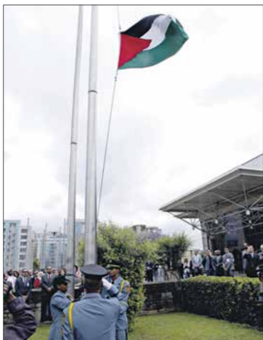
العلم الفلسطيني في ليبيا