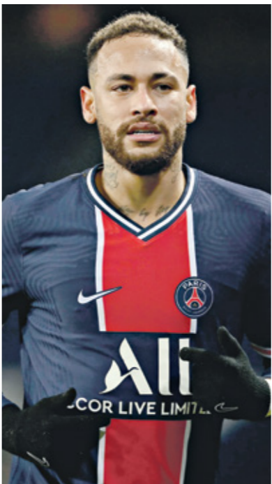
خطف لعلم الرحلة الباريس سانت جيرمان

أعلن نادي برشلونة الإسباني في بيان رسمي عبر موقعه الإلكتروني في الإنترنت، عن تسوية جميع النزاعات المهنية والمدنية المفتوحة مع النجم البرازيلي نيمار دا سيلفا مهاجم باريس سان جيرمان الفرنسي، بشكل ودي بعيدا عن القضاة وجاء في بيان نادي برشلونة الإسباني: «لقد قامت الإدارة بقيادة خوان لابورتا والنجم البرازيلي نيمار بتوقيع اتفاق، من أجل إنهاء الإجراءات القانونية العالقة بين الطرفين. 3 دعاوي مهنية ودعوى مدنية لدى القضاء الإسباني»، وكان النجم البرازيلي نيمار دا سيلفا، الذي ارتدى قميص نادي برشلونة بين 2013، و2017، قد دخل في قضية قانونية طويلة مع إدارة الرئيس السابق، جوسيب ماريا بارتموتيو، نتجة عدم حصوله على أمواله، التي كان ينص عليها عقده مع الفريق الكتالوني، بالإضافة إلى مطالبته بشكل متواصل من قبل الفريق الكتالوني العمل مع موكله، من أجل إنهاء مشاكله الكبيرة مع الضرائب الإسبانية، التي عانى منها المهاجم