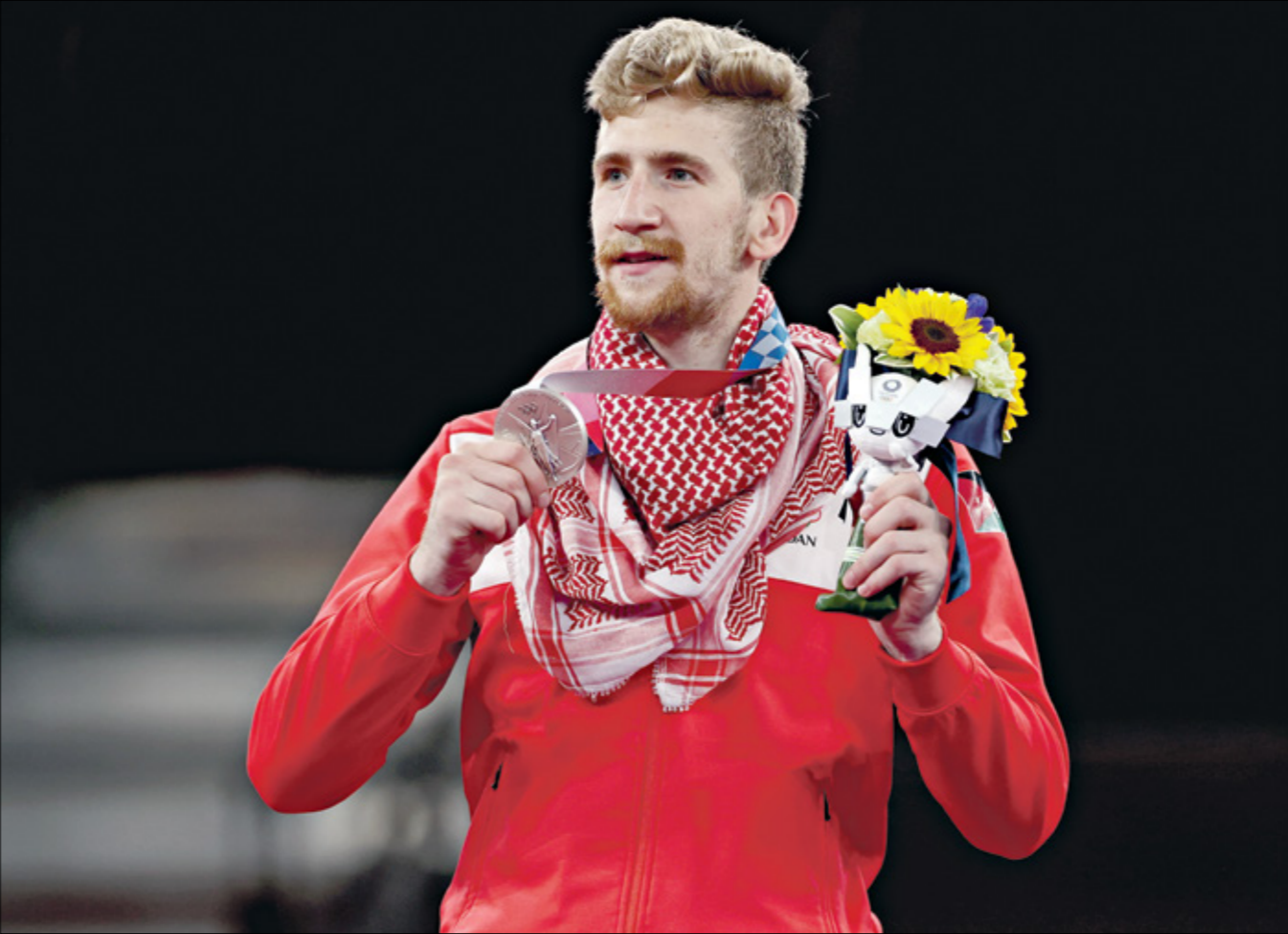
سعادة الشرباتي يبلت الميدالية الفضية بولمبياد طوكيو

بات صالح الشرباتي ثاني أردني يحرز الميدالية الاولمبية