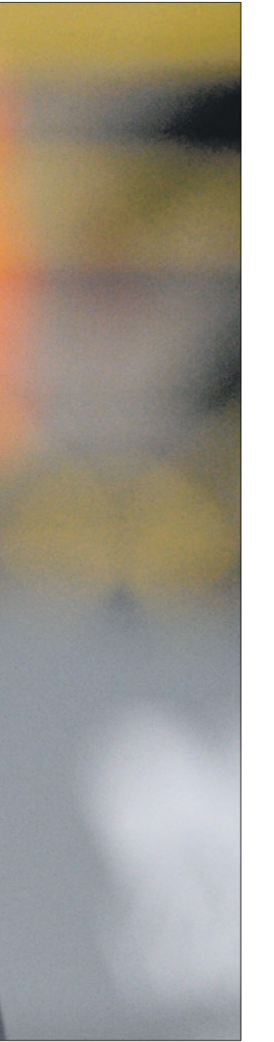
خطف لعلم الرحلة الباريس سانت جيرمان

لدوري الدرجة الأولى، قبل أن ينتقل بين أندية ستانداردو ليج وليفيرين ولانغوازان، حقق خلالها في رصيده كلاعب محترف 140 مباراة في الدوري البلجيكي الممتاز، أسهم في 8 أهداف ما بين صناعة وتسجيل.