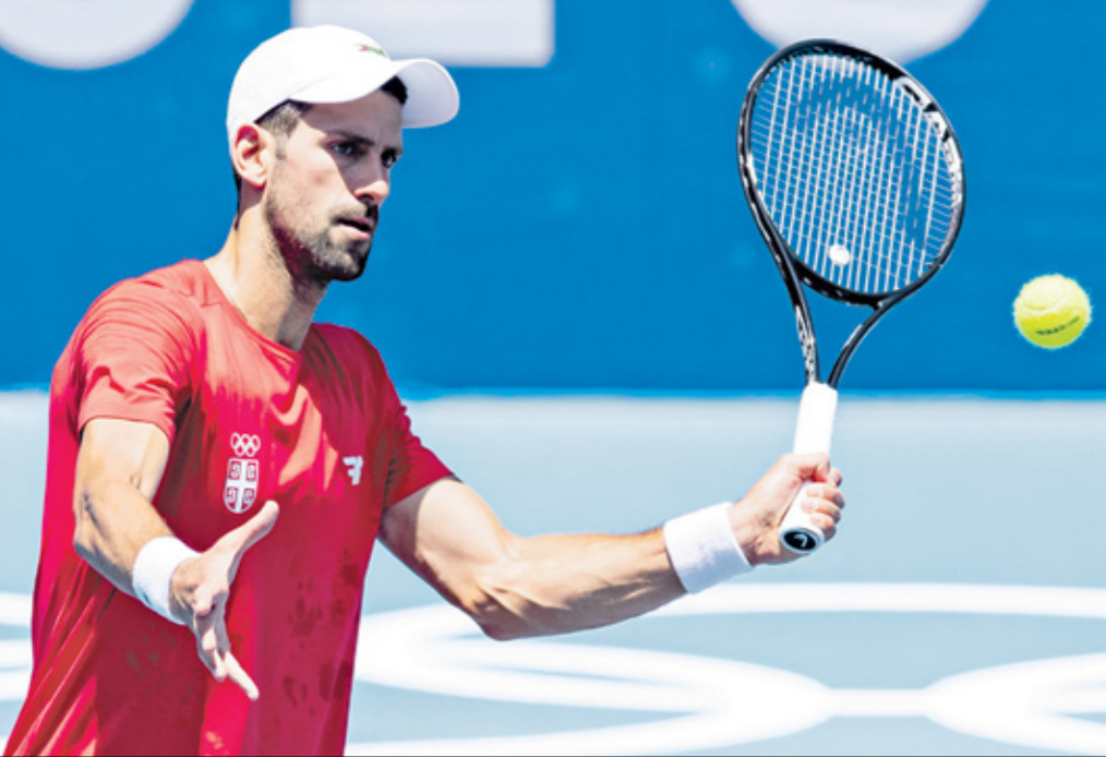
ديوكوفيتش غاضب من إجازة مباريات النّس بالصباح

الكثير من الرياضيين. ولم تكن رياضة التنس الوحيدة التي تعاني بسبب ارتفاع درجات الحرارة، فقد شهدت الأيام الأولى من الألعاب، فقدان رامية روسية الوعي بسبب أشعة الشمس القوية التي جعلتها تنسقط أرضاً، ما دفع الإسعاف إلى التدخل من أجل مساعدتها على استعادة الوعي ورغم ذلك فقد تم نقلها إلى المستشفى، وهو ما يقدم الدليل على تأثير ارتفاع درجات الحرارة على المنافسات إلى حد الآن.