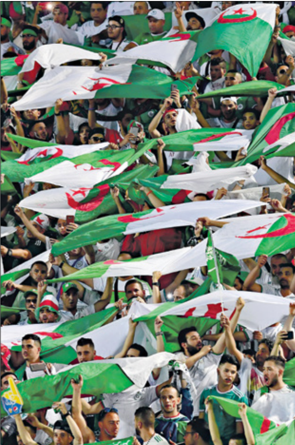
الجماهير الجزائرية كانت تلهل بلطف مخلوفي