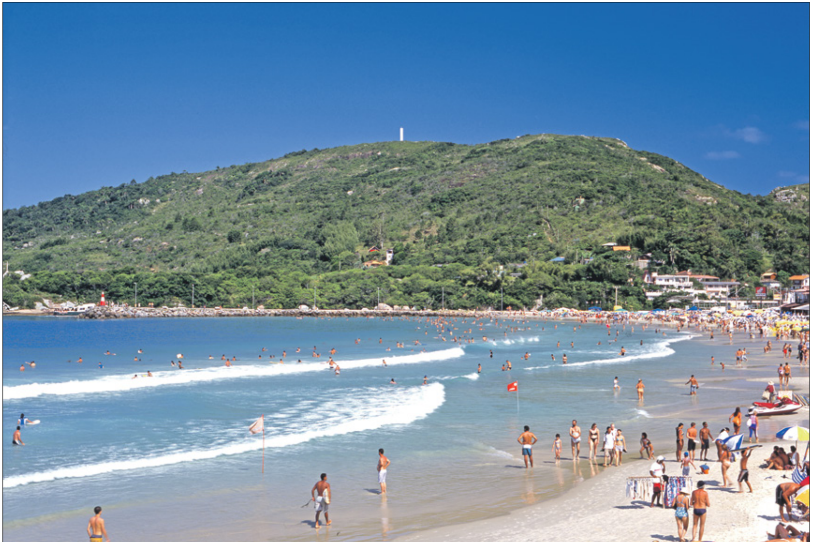
شاطئ لاغون بار، المنطقة الشرقية من جزيرة سانتا كاتارينا، فلوريانوبوليس، 11 مايو 2022

بعد إجراء بحث على العديد من التطبيقات الذكية الخاصة برحلات الصيف، تبين أن السفر بعد منتصف أغسطس/ آب، مقارنة مع بداية الصيف، يساعد في توفير ما لا يقل عن 500 دولار تقريباً لعائلة مكونة من أربعة أشخاص. ووفق تطبيق «سايفينغ كريبتور» Savings Generator التابع لموقع «سكايسكانر» Skyscanner، وهو محرك بحث يسمح للمستخدمين بمقارنة أسعار رحلات الطيران لشركات الطيران والوجهات المختلفة، تبين أن رحلات الصيف بعد منتصف أغسطس مناسبة جداً للعائلات. كما تبين أنه خلال الأسبوعين الأخيرين من يونيو تشهد أسعار التذاكر في الدول العربية تحديداً المزيد من الارتفاعات بسبب انتهاء العام الدراسي. أما بحسب برامج الذكاء الاصطناعي، فقد تبين أن أرخص الرحلات الصيفية تكون بين العاشر والخامس عشر من يوليو/ تموز، وبين التاسع عشر والخامس والعشرين من أغسطس، كما تكون الرحلات منخفضة التكاليف بسبب تراجع الازدحامات على شركات الطيران.