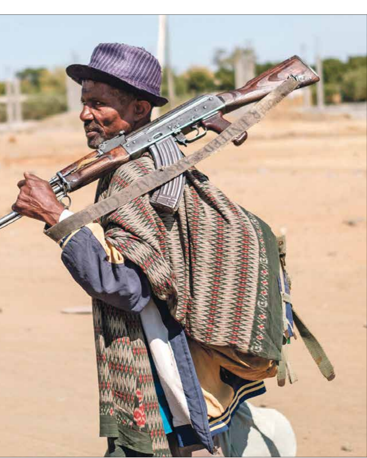
حاصرت القوات الوبية ميكيلي

الإثيوبي عن المدينة، بعدما أعلن في الأيام الماضية أنه يقترب نحو ميكيلي، فيما تؤكد «جبهة تحرير شعب تيغراي» من جهتها أنها الحقت بها خسائر فادحة. وقال دبلوماسيون إن قوات اديس ابابا كانت على بعد 30 كيلومترا على الأقل إلى شمال ميكيلي وجنوبها، في المقابل،