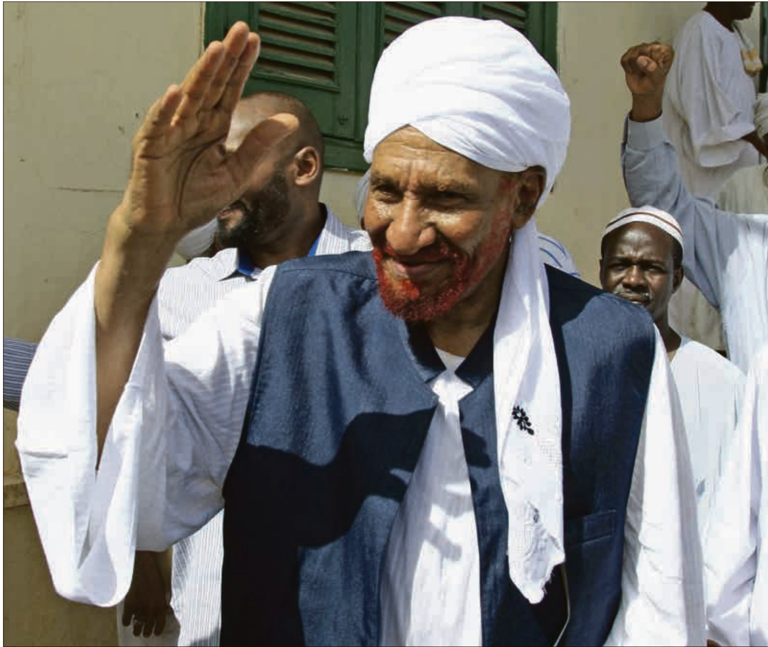
انتخب المهدي إماماً لطلقة الانتصار في 2003

وعرف الصادق المهدي بمواقفه المناهضة للتطبيع مع الاحتلال الإسرائيلي. وكان قد قال، في ندوة في الخرطوم في سبتمبر/أيلول الماضي، إن التطبيع مع إسرائيل «اسم دل على الاستسلام ولا صلة له بالسلام، فالآن لا تواجه أي دولة عربية إسرائيل مواجهة حربية، والمواجهة الموجودة هي مع قوى شعبية غير حكومية». وأضاف «هذه القوى، كما قال الأستاذان ستيفن والت وجون ميرشايمر في كتابهما عن تأثير اللوبي الإسرائيلي على السياسة الأمريكية، يمنح المتطرفين أداة تجنيد قوية، ويوسع حوض الإرهابيين المحتملين والمتعاطفين معهم، ويساهم في الراديكالية الإسلامية. وهذا ما يحدث فعلاً». وأوضح أن «مشروع التطبيع الحالي لا دخل له بالسلام، بل يهدد بحرب قادمة مع إيران». وأكد أن «إسرائيل لأسباب محددة ليست دولة طبيعية بل دولة شاذة». كما انسحب من المشاركة في مؤتمر لوزارة الشؤون