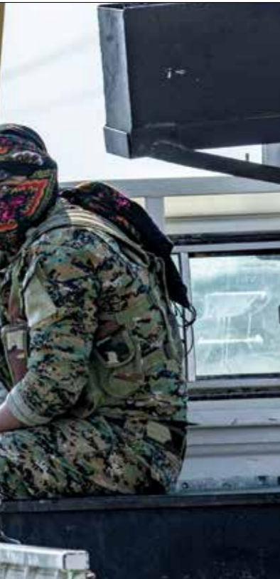
سيطر «قسد» على جرف الصخر الفرات

وفي هذا الصدد، أنهى ما سمي بـ«المؤتمر الوطني لآباء الجزيرة والفرات» أعماله، الأربعاء الماضي، في مدينة الحسكة في أقصى الشمال الشرقي، والذي عقد بحضور 300 شخص يمثلون مكونات شمال شرقي سورية، إضافة إلى شخصيات مستقلة وشيوخ وجهاء عشائر ومثقلين عن «الإدارة الذاتية»، وقوات سورية الديمقراطية، وانتهى هذا المؤتمر، الذي نظمته «جلس سورية الديمقراطية» (مسد)، وهو الجناح السياسي لـ«قسد»، بتوصيات لم تحرّج عن نطاق التوقيع، إلا سيما لجهة التقاعد على وحدة الأراضي السورية واحترام سيادتها، والإقرار الدستوري بحق قوات «الجمهات السورية والدينية والاجتماعية»، كما قرر المؤتمر من توريده لكل الأقاليم التي تخضع من «حل الأزمة السورية وفق بيان جنيف وقرار مجلس الأمن رقم 2254 وجميع القرارات الأممية ذات الصلة»، وفق بيان صدر في ختام المؤتمر. ولكن من التوصيات اللاحقة، تلك المتعلقة