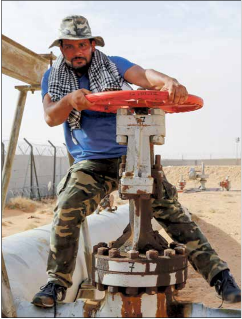
من الاحتجاجات التي شهدتها الكامور فيبعضة أشهر

ومع عسكر مصر نكاية بتيار سياسي إسلامي، وبتقعة مشاعر المصاهير عن «التطبيع خيانة» حتى انكغاً على عقبيه صمتاً حين صار «زعيماً»، وإذا كان الشارع العربي رفض هذا التحالف التليل، في المتأرجح وعلى قنوات تلفزيونية، على منتج صهيوني موغل في عصريرته واضطهاده، فتمة مقابله من استمساغ، برعاية رسمية من مستشاري الاستبداد، بث في ولاته الصهيونية، بالتصويب على فلسطين وعدالة قضيتها. وفي مقال مسؤولية الاستبداد، يعبز آخرون، أحزاباً وتنظيمات، من الإجابة عن أسئلة حول أنوارهم، هؤلاء يتخولون مع المستبدين مسؤوليات الكوارث، إن الصامت أو لإفلاس وقناعات نخوية ضيقة لكل جماعة، حتى أصبح تطبيع التطبيع هدفاً، ولو بالكذب والتضليل لنزع الوجهين الإنساني الحقوقي والديني-المكاني عن قضية فلسطين، وحتى على لسان من لا يابهون أصلاً للدين، وصد التاريخ والعدالة أخيراً، فمقارنة مواقف البعض من فلسطين بمواقف زعيم حزب العمال البريطاني السابق، جيرمي كوربن، أو بحركة المقاطعة الدولية، ستكتشف حجم الكارثة المرعبة، الذيرة لصهيونية عرب الانهزامية. عند المتكئين عن أنوارهم، حتى في مجتمعاتهم.