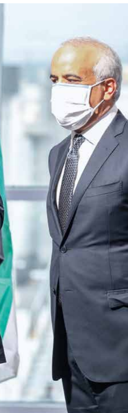
كان نتنياهو في استقبال الطائرة الإماراتية في مطار بن غوريون