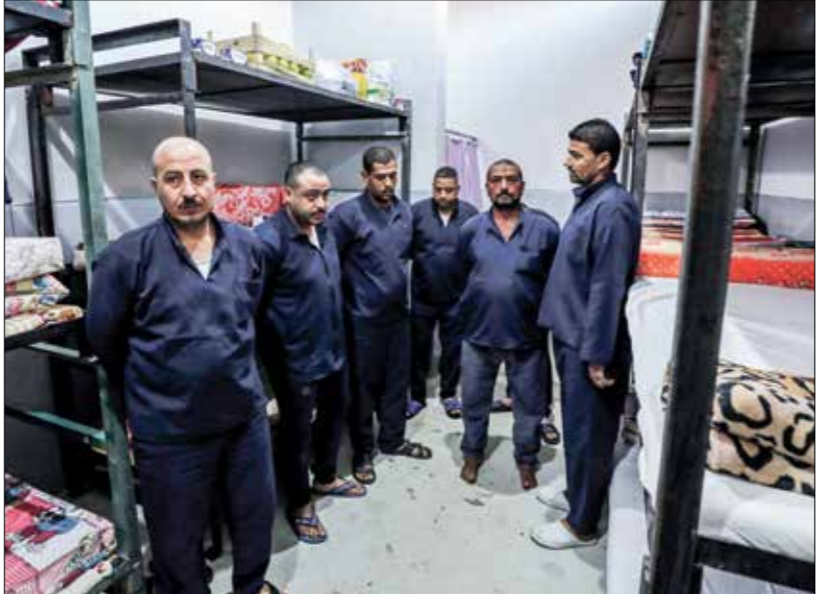
بعض السجون المركزية منعت الزيارات تماماً

وقالت مصادر أمنية وحقوقية، لـ«العربي الجديد»، إن بعض السجنون المركزية، كالوادي الجديد، وأسيوط، وبرج العرب، وجمسة، منعت الزيارات تماماً ابتداءً من الشهر الحالي بحجة اتخاذ إجراءات