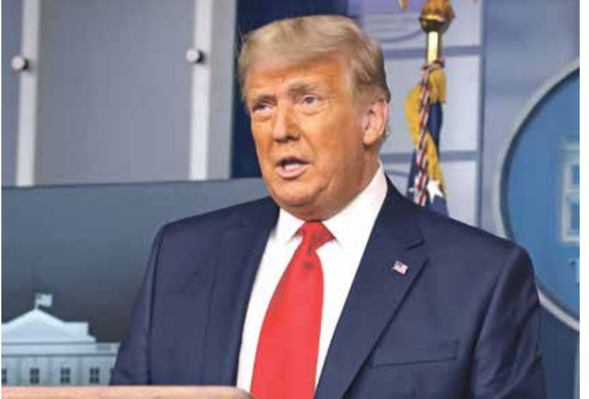
طالب ترامب بتصارة بالعلم على قلبه نتيجة الانتخابات

وكان فلين، الجنرال السابق البالغ من العمر 61 سنة، قد اعترف في 2017 بانه كذب على الشرطة الفدرالية بشأن اتصاله مع دبلوماسي روسي، وفي يوم التالي بالحكم