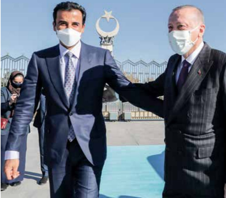
ارمغان مستشارا امير قطر امين (الناشون)