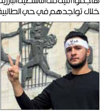
سيطر الفصائل على جرف الصخر منذ عام 2014

أعلن مسؤولون في الشرطة العراقية، أمس الخميس، أن مسلحين هاجموا التييمم الناشطين البارزين بالظاهرات، بواسطة أسلحة رشاشة خلال تواجدهم في حي الصليبية شرقي العاصمة مساء الأربعاء، ما أسفر عن اصابة الاهالي لخمسة جرحى بليغة، ويأتي ذلك بعد ساعات قليلة من تظاهرة نظمها ناشطون في ساحة الفردوس وسط بغداد، للتنديد بقانون «حزبالمعلوماتية»، الذي يسعى البرهان لأشراه في الأيام المقبلة، ويعتبره الناشطون مقيدا لحرية الرأي.