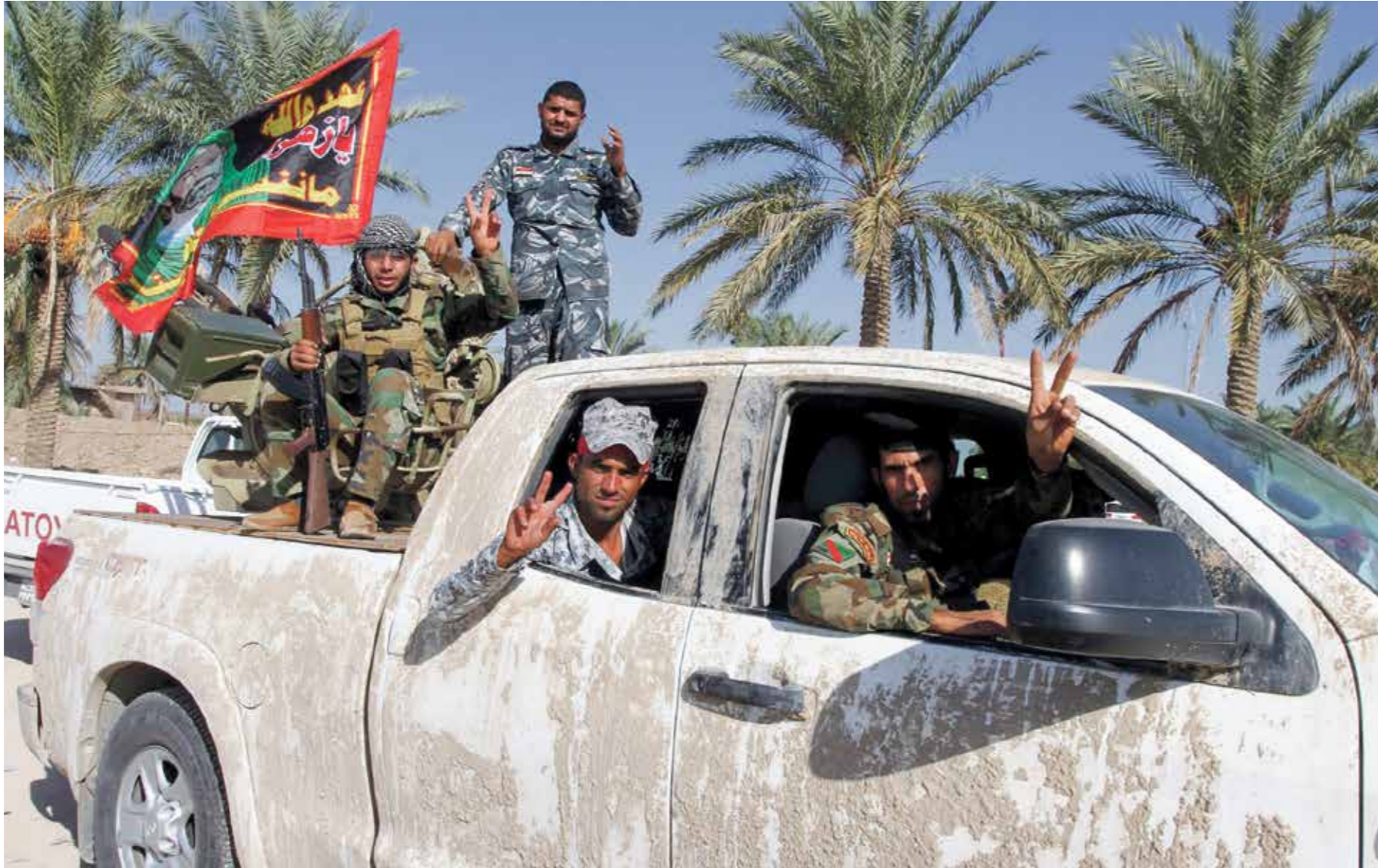
سيطر الفصائل على جرف الصخر منذ عام 2014 (الناشر)

اقترح قدمته قوى سياسية وفصائل مسلحة، بتوطين اهالي جرف الصخر في محافظة الأنبار وإغلاق الملف بشكل نهائي، على اعتبار ان الأخيرة أكبر محافظات العراق وتتحمل ذلك، في خطوة تنطوي على عملية تغيير ديمغرافي جديدة في العراق