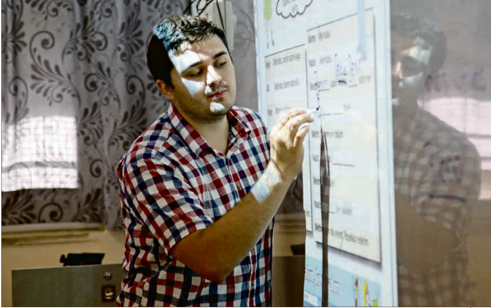
استاذ يعلّم اللغة التركية في أحد معاهد يونس امره الثقافية

بمجرد أن يتقن اللبنانيون اللغة التركية، تفتح أمامهم الكثير من الفرص الاقتصادية، كالمشاريع الاستثمارية وتأسيس الأعمال الخاصة والوصول إلى مجالات مختلفة