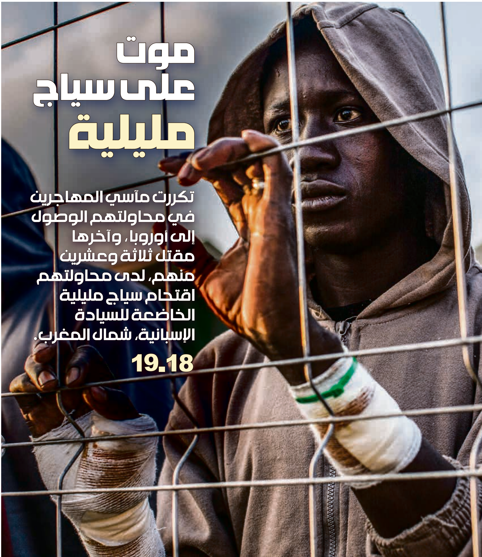
مهاجر شاب جرح أثناء محاولة اقتحام سياج الحدود في مليبية