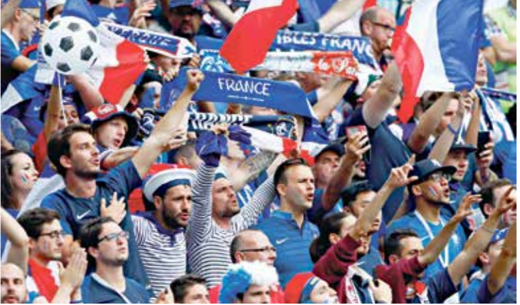
تطالب الجماهير الفرنسية بلقب مونديال قطر