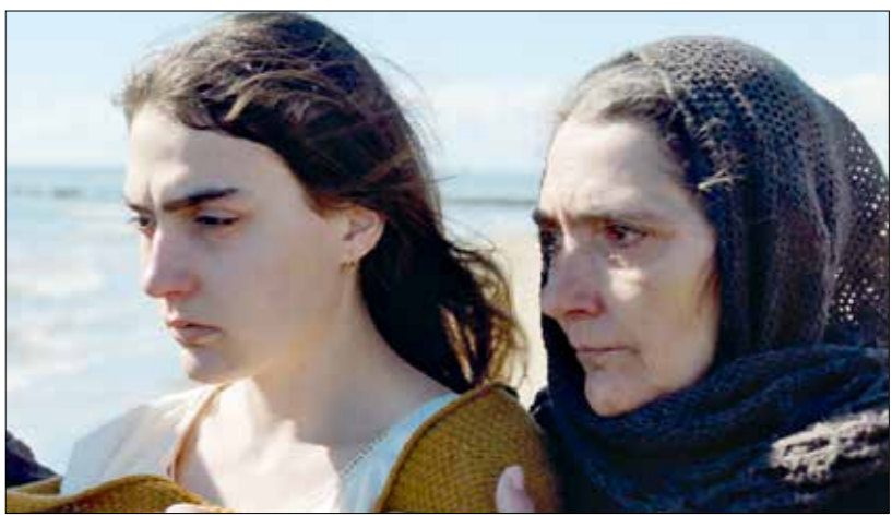
«جسد صلب» لريطالية لورا ساماني، الجائزة الكبرى للمنافس الصحافي

في مكتبة «أغورا» مُنم إسدراو، أحد بالعربية للباحث محمد نور الدين أفاية، بعنوان «معرفة الصورة في الفكر البصري، التمثيل السينما» (المركز الثقافي للكتاب، 2021)، وآخر بالفرنسية للشرح سعد الشرايبي، بعنوان «أفلام من الذاكرة السينمائية» (دار 3 ديسفيلم، 2019)، ثم أسدل الستار على دورة متميزة من مهرجان أضحي رقماً متجدديتها لفيورا، نفوس عزلة واغتراب في أوضاع متلازمة، كتابة عزلة واغتراب في البحر حاضراً كفضاء عزلة واغتراب في فيلمين آخرين، أحدهما لم تصنف لألحة الجوائز: