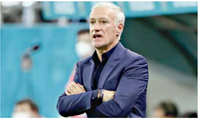
تعرض ديشان لكثير من الانتقادات

تصریح زيدان لصحيفة لكيك الفرنسية، فتح الباب على مصراعيه، بعدما أصبح ديبديه ديشان يهدد بالفشل بمخاطرة