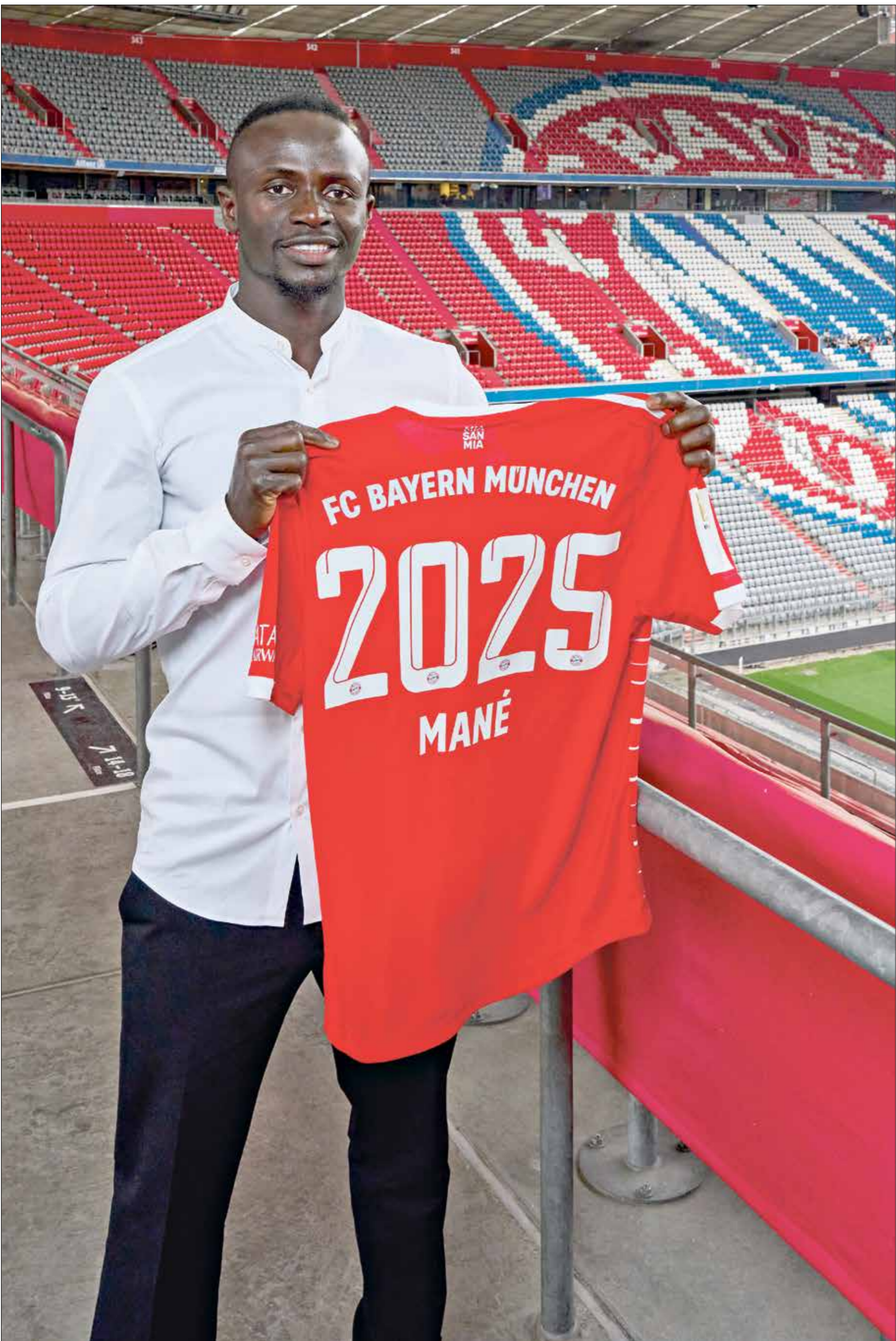
ساديو مانه سيبدأ رحلته مع بايرن ميونخ مع بداية شهر يونيو (جيتي)