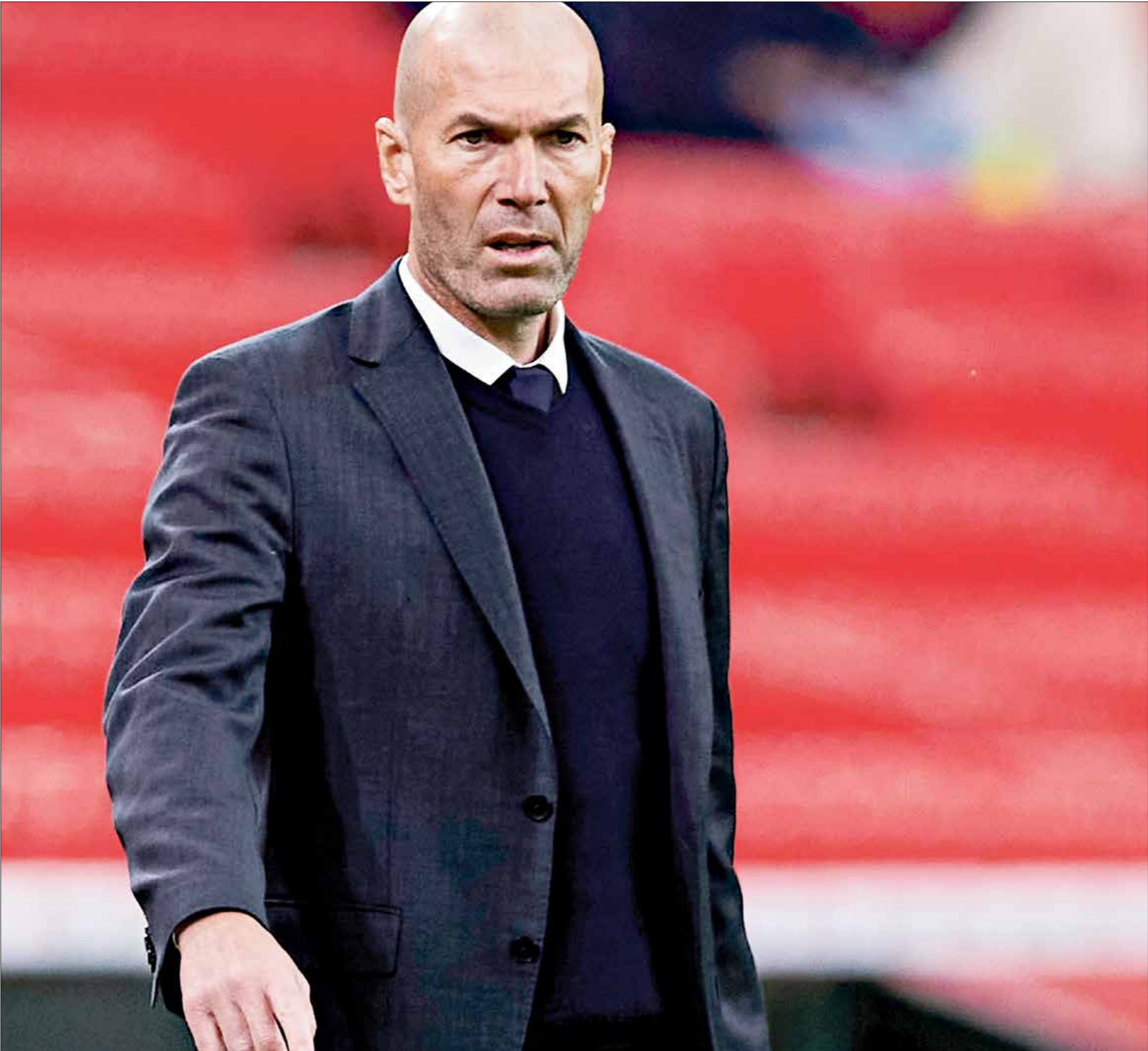
يعقب زيدان في تدريب منتخب فرنسا

منتخب أوروغواي والبرازيل في عام 2013، وفي كأس العالم التي أقيمت في البرازيل عام 2014، حقق منتخب فرنسا نتائج جيدة في دور المجموعات، إلا أن «الديوك» وجدوا أنفسهم خارج المونديال عقب الخسارة في لقب، بشكل دراماتيكي، عبر هدف سجله يد منتخب ألمانيا من دور الثمانية. وفي شهر يونيو/حزيران عام 2015، تعرضت لنتيجة مدمرة، عندما رأت منتخب بلدها يتعرض للهزيمة على يد منتخب بلجيكا ومنتخب ألمانيا. وشنت وسائل الإعلام الفرنسية قبل انطلاق بطولة «يورو 2016»، حملة كبيرة على ديشان