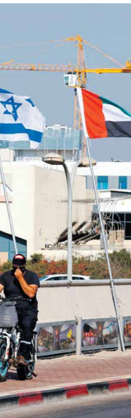
تحمل أبوظبي على تزيير التحالف مع إسرائيل