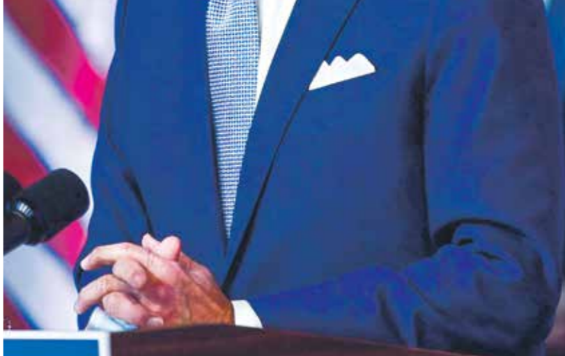
رخص بايدن وصفعه، بحولية إيهاما اللاتلة، (Getty)

الأوضاع. أما خارجياً فالصراع والتنافس كما هو، تقارب تركي وروسي بشأن ليبيا، وخلاف تركي أوروبي لا تزال لجلياتها واضحة في تفتيش سفينة تركية من قبل سفن عمالية «إيريني» الأوروبية. و لا شك في أن هذا التنافس يؤثر على الجهود التي تدفع باتجاه رسم معالم الأخرية في الصورة تركية من قبل نكران هذا الأخير الشخصيات المرشحة لشغل المناصب المقبلة لا تزال تتحج إلى عواصم الدول الكبرى، أبرزها فنحي باشاغما الذي زار عواصم عدة آخرها باريس، وعقيلة صالح الذي توجه إلى موسكو، لحشد الدعم. ومقابل ما يتوقعه أطراف من المرأقين من كل المقاتل الساخنة، وليس اللغف الليبي فقط، تنتظر وضوح الصورة في البيت الأبيض، يرى جانب آخر من المرأقين أن مركب الحل توقف قليلاً عند المحطة الأخيرة في المسار السياسي، فكما أفضى اتفاق الصحراي إلى انقسام سياسي وعسكري بين طرفين يبدو أن الاتفاق بمفرده، التي تتحدث عن ثلاثة أقاليم، سيكسر حالة تنهني إلى التقسيم الحقيقي، وقبل أن تصل البلاد إلى انتخابات «وطنية» سيستيقظ الجمع على أن تلك المسارات لم تنتج حلًا لازمة بل أزمة حل.