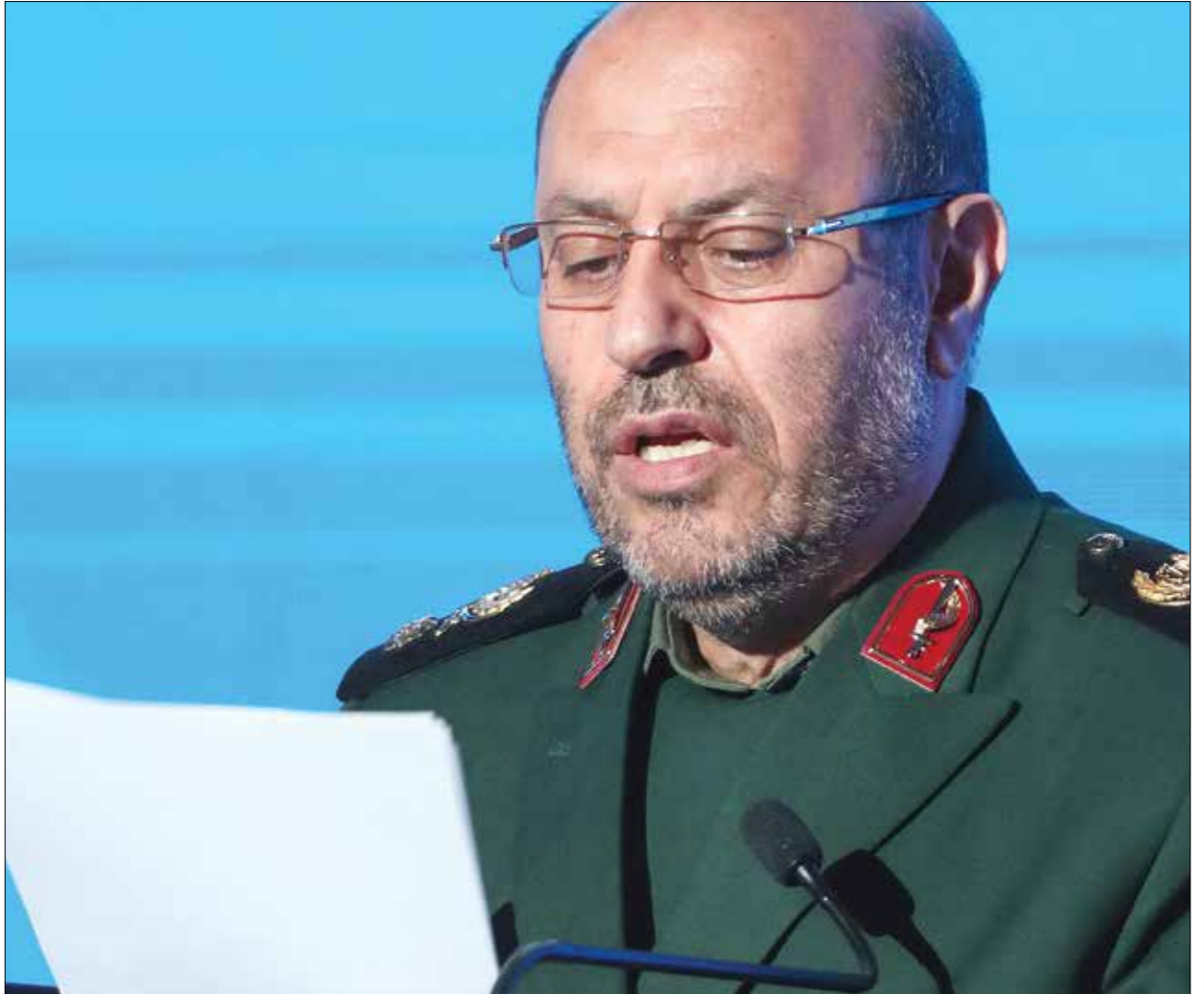
عبد دهقان مع لائله رؤساء إيرانيين