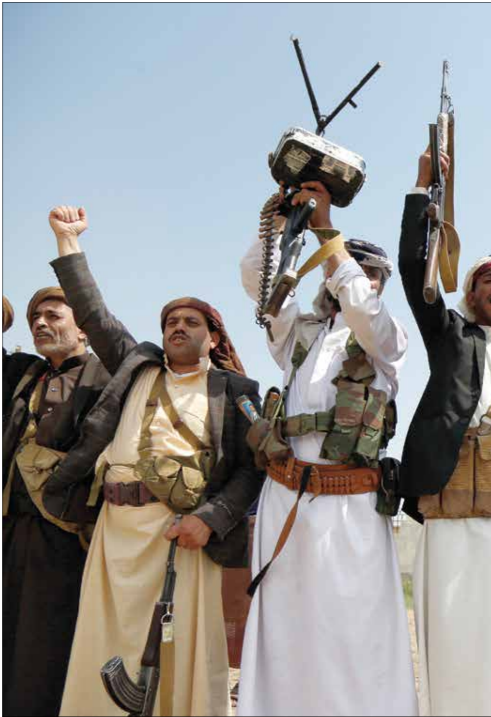
الحكومة، تصنيف الحوثيين جماعة إرهابية مطلب رسمي وشعبي

بمدينة سيئون أواخر إبريل/نيسان 2019، لهدف رئيسي هو إقرار مشروع قانون يمني يصنّف الحوثيين على لوائح الإرهاب، ونص مشروع القانون اليمني الذي لم يخرج سقافة في السعي وراء هذا التصنيف، بعد للنور يومها. على اعتبار جماعة الحوثيين، وكل من ينتمي إليها بجميع توكلائها ومسمياتها من مرجعيات دينية واجتماعية للحكومة الشرعية في جلسة انعقاد واحدة