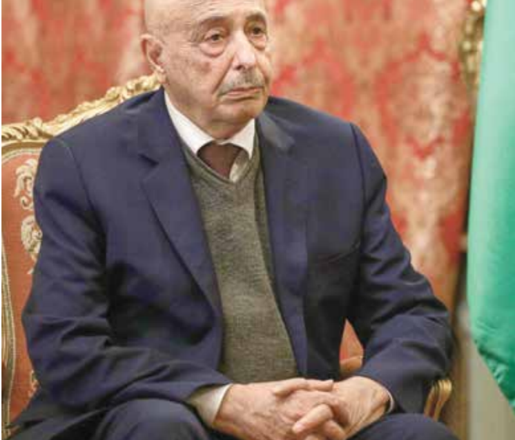
اعرب صالح عن مله بإجراء الانتخابات في نهاية 2021