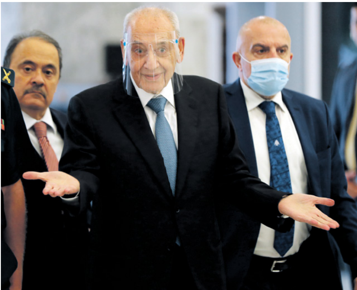
يُنتظر ان يدعو بري مجلس النواب الجديد إلى الانعقاد (حسب بيضون)

ويُنتظر أن يدعو رئيس البرلمان المنتهية ولايته نبيه بري، مجلس النواب الجديد للاستعداد في جلسة مخصصة لانتخاب هيئة مكتبه (رئيس المجلس ونائبه وأميناً سر ومفوضون)، خلال 15 يوماً من بدء المجلس الجديد ولايته (انتخب في 15 مايو/ أيار الحالي). غير أن اجتهادات بدأت تخرج بأن مهلة الـ 15 يوماً لتوجيه الدعوة غير ملزمة. هذا الأمر يترك الباب مفتوحاً أمام العمل على تسوية، تحديداً بين بري ورئيس «التيار الوطني الحر» النائب جبران باسيل، والتي قد تشمل انتخاب رئيس البرلمان إضافة إلى تشكيل الحكومة ورئاسة الجمهورية. لكن مصدراً مقرباً من بري أكد لـ«العربي الجديد» أن «لا تسوية والرئيس بري سيبدو قريباً جداً المجلس لعقد الجلسة، وهو مرشح طبيعي لرئاسة