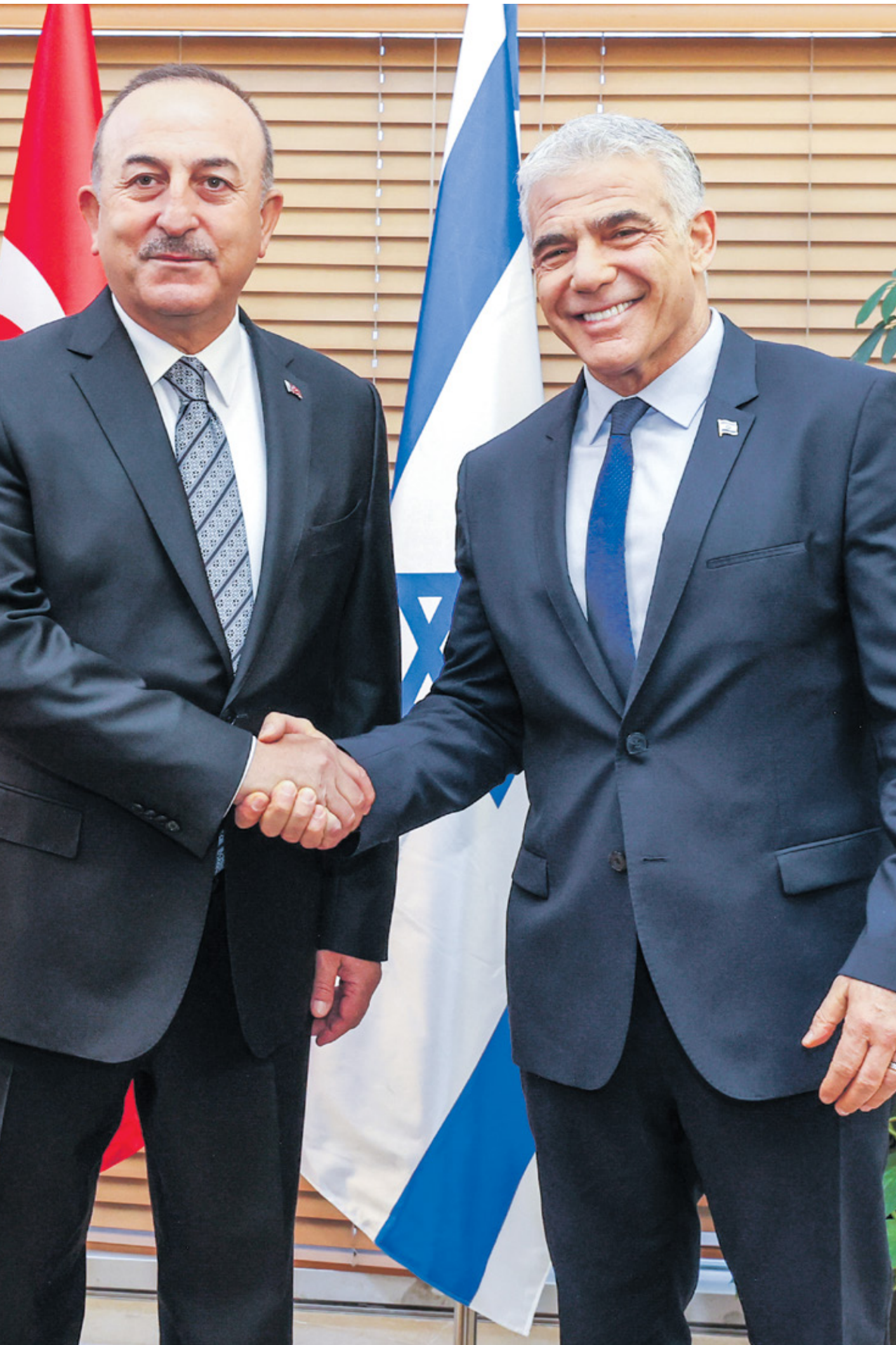
ليد وجاوش اوغلو في القدس المحتلة امس اجميد ورجلة،