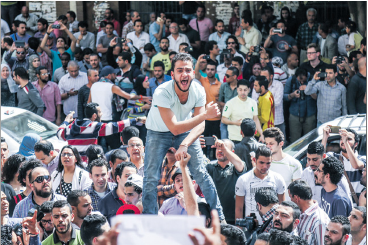
تظاهرات في القاهرة عام 2016 رفضا لتسارعة الجزيرتين

السلاح، مع وجود قوة من المراقبين متعددي الجنسيات بقيادة الولايات المتحدة، والقول إن ذلك «يحتم أن يضر الاتفاق بين مصر والسعودية بإسرائيل»، إلا أنه يحسب تقرير «أكسيوس»، فإن «إسرائيل كانت قد أعطت بالفعل موافقتها».