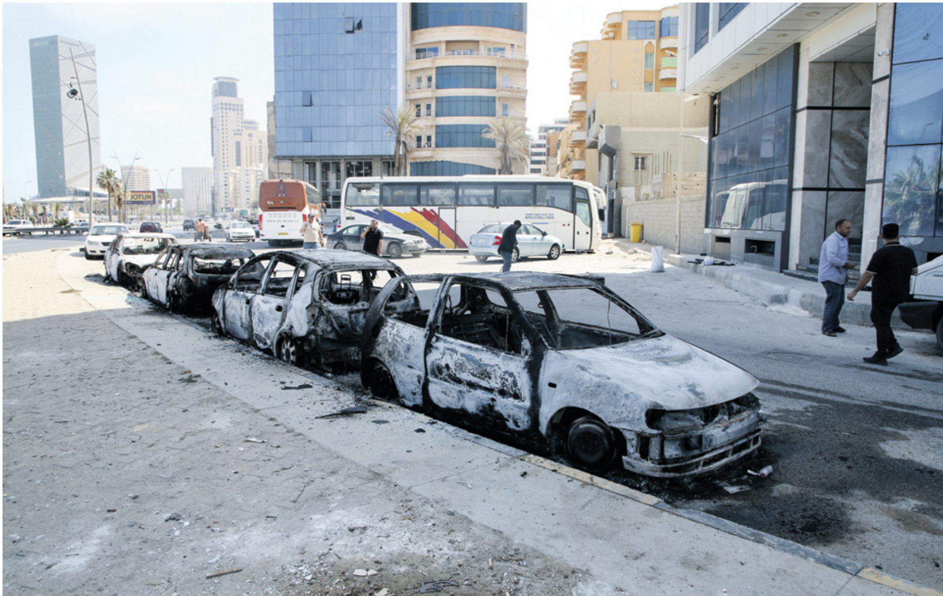
توكوف من تكرار مشهد اشتباكات طرابلس الاسبوع الماضي

لأنها هي الحكومة الشرعية، والتي جاءت باتفاق بين الرجلين لتشكيل حكومة جديدة فلن يتحقق إلا بأمر من الأطراف المسلحة». شرادة أن «مجلس الدولة لا يؤثر في الديبية حتى لو سحج المجلس يده منه، لأن الديبية صحافية، وجود تبة لدى مجلس النواب لتتشكل حكومة مصغرة وقال لا صحة لما يجري تداوله حول تشكيل حكومة مصغرة في ليبيا، بل العمل جار على دعم وساندة الحكومة فتحي باشاغا من كل الأطراف الليبية