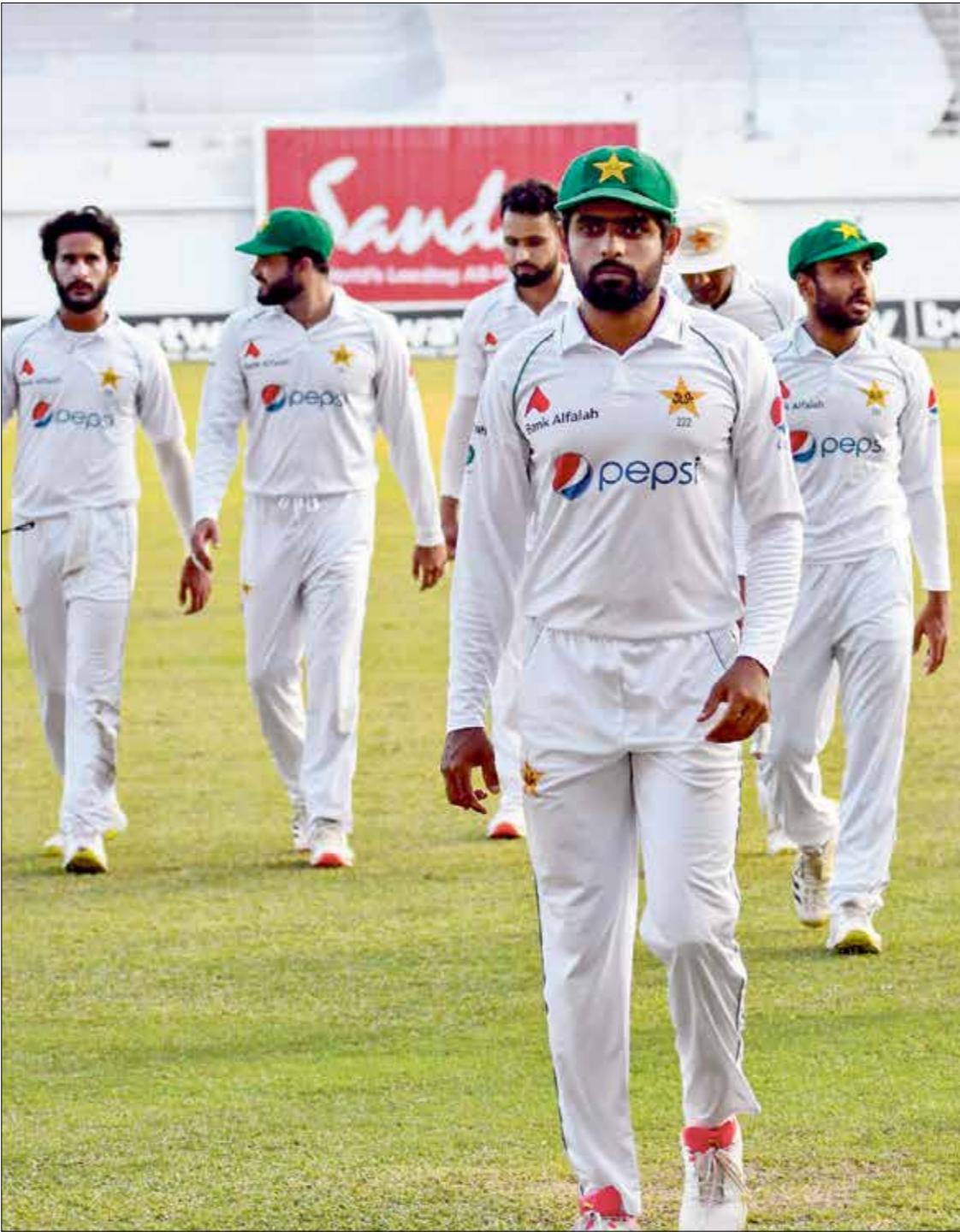
باكستان تخطى لاسطاعه منتخب نيوزيلندا والكنتر الكريكيت