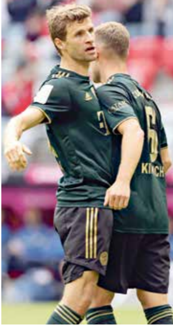
بايرن يقدّم عرضاً مميزاً في الوندية الأخيرة

بحث بايرن ميونخ، حامل اللقب والمضئّر، عن فوز جديد حين يفتتح، اليوم الجمعة، المرحلة السادسة من الدوري الألماني لكرة القدم في ضيافة المتواضع غرويتر فورث، وذلك تزامناً مع ما لحق إليه هدافه ويريت ليفاندوفسكي بشأن رغبته بالندفاع عن النوان النادي البافاري حتى اعتزاله، وبعد بداية متعثرة في مستهل مشواره مع مرتبة الجديد بوليان تاغلسمان (تعادل في المرحلة الأولى مع مونشغلادباخ)، كثر بايرن عن أنيابه وخرج منتصراً من مبارياته السبع الثالثة على الصعدين المحلي والقياري، بينها الفوز خارج القواعد على برشلونة الإسباني 3صفر في دوري الأبطال والفوز 12-صفر على فريق من الدرجة الخامسة في القيادة. وخاض اللاعب 423 مباراة مع الأندية التي مثلها، لكن مسيرته بالتأكيد لم تنجح كما كان متوقفاً في السابق، بعد أن وصل إلى أكاديمية مانشستر يونايتد في عام 2000 وهو في الرابعة عشرة من عمره، وقضى ثماني سنوات في كتبية «الشياطين الحمر».