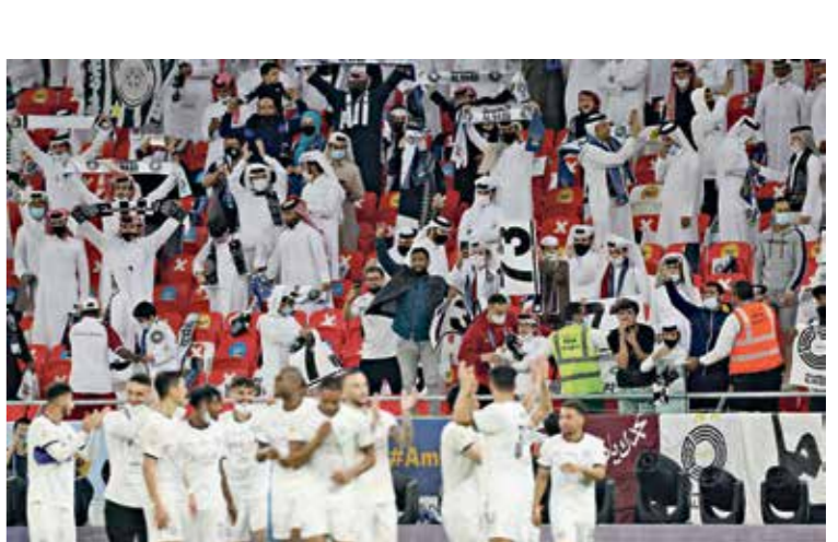
جماهير السد دعمت فريقها بقوة

الجودة - العربي الجديد نجح فريق السد في كسب موقعة كلاسيكو الكرة القطرية، بفوزه على الريان بواقع أربعة أهداف مقابل هدفين، في المواجهة التي جمعت بين الفريقين على استاد خليفة الدولي في ختام مواجهات الجولة الثالثة من الدوري القطري لكرة القدم. وبهذه النتيجة ترع السد على صدارة جدول الترتيب برصيد 9 نقاط من ثلاثة انتصارات، بينما تحصد رصيد الريان عند نقطتين في المركز العاشر بعد تعادلهن. وسجل أهداف السد كل من حسن الهيدوس، وبغداد بونجاح، والمخترق الغاني اندريه