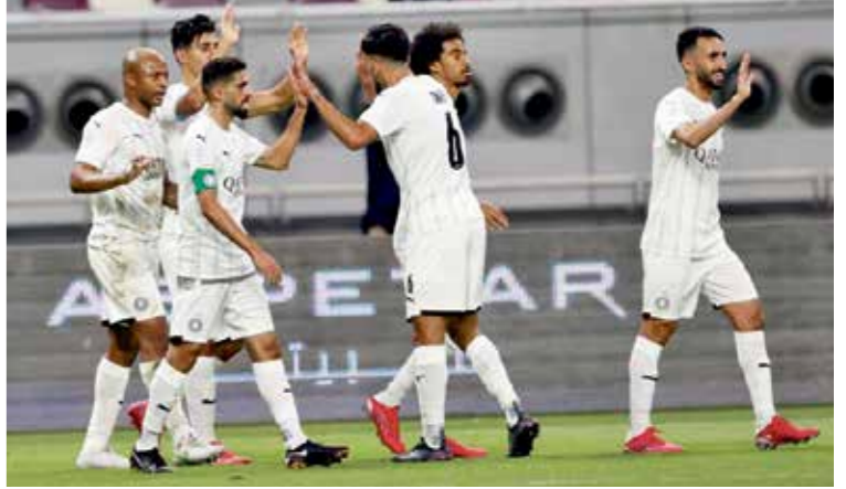
السد تعاد مع نجوم من النصر الفلب