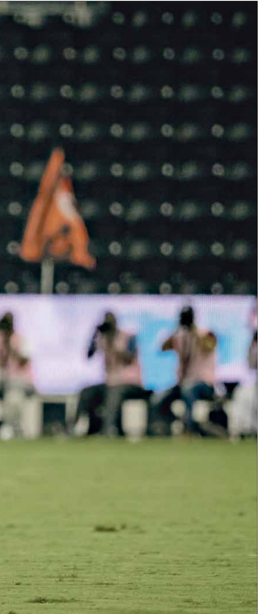
السد واصل صدارته للدوري القطري

أصبح مستقبل المدرب الهولندي، رونالد كومان، محفوفاً بالمخاطر في نادي برشلونة الإسباني، بعد النتائج الخيبة لنادمال للفريق الكتالوني في الموسم الحالي 2021/2022، الأمر الذي جعل وسائل الإعلام العالمية، تسارع إلى تداول عدد من الأسماء المحتملة، من أجل الانتراف على الجهاز الفني له،(البلاغرانا)، وبعد مؤتمر الصحافي، الذي حوله إلى بيان وجه فيه عدة رسائل. كشفت صحيفة «ماركا» الإسبانية، أن خوان لابورتا رئيس نادي برشلونة، سيبحث قراره النهائي، حول مستقبل المدرب الهولندي رونالد كومان، بعدما وضع عدة أسماء على طاولته، ويقوم بدراستها مع فريقه. لذلك يستعرض اليك أهم المرشحين لقيادة الفريق الكتالوني، خلال الفترة المقبلة. مدرب نادي السد القطري، يجري الحديث بين أعضاء نادي برشلونة الإسباني، عن أسطورة تشافي هيرنانديز، المدير الفني