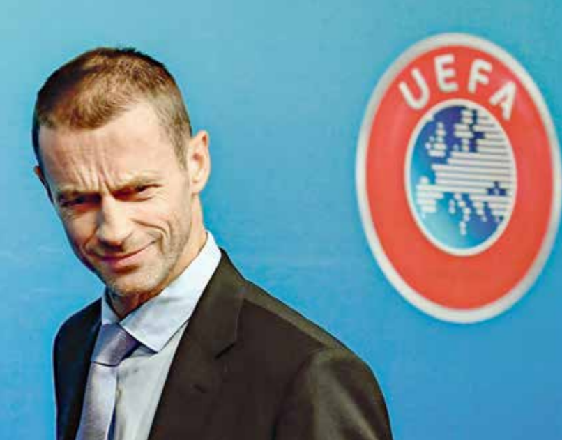
الاتحاد الأوروبي ملاك ملحوظا على الفكرة (فرايس كوزيليا، فرايس برس)

وتكشف: «سيتمثل النقاش أيضاً مشجعين من جميع أنحاء العالم»، مضيفاً: «يلتزم فيفا بأن يكون منتدى للنقاش الهادف من خلال الانخراط مع مجموعة واسعة من أصحاب المصلحة، ويتطلع إلى المناقشات حول النمو المستدام لكرة القدم في جميع مناطق العالم».