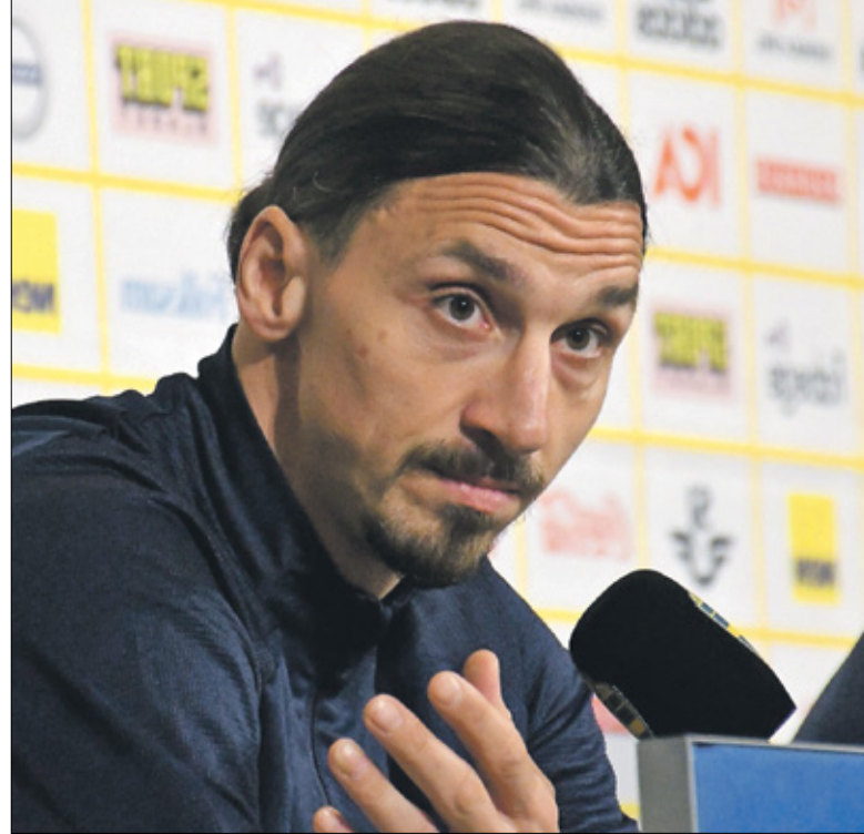
إبراهيموفيتش يبدأ رحلته الدولية جديدة مع السويد

ضد جورجيا في إطار الجولة الأولى من التصفيات الأوروبية المؤهلة لبطولة كأس العالم قطر في عام 2022. وأكد إبراهيموفيتش خلال المؤتمر الصحافي أنه «أصبح أكثر صبرا مع الوقت، عشية عودته إلى صفوف منتخب بلاده بعد أكثر من أربع سنوات من الغياب، وقال «إيبرا» في المؤتمر قبل ثلاثة أيام من مواجهته جورجيا في افتتاح تصفيات كأس العالم 2022: «كلما تقدمت في السن، زاد صبري. داخل الملعب وخارجه»، وأضاف مهاجم ميلان الإيطالي، صاحب 62 هدفاً دولياً، أن «تابع المنتخب الوطني طوال الوقت، الشعب الأين، وأكد أنه خلال اعتزاله الدولي «تابع المنتخب الوطني طوال الوقت، الشعب للمنتخب الوطني هو اعظم شيء يمكنك عمله إلى صفوف المنتخب بالنسبة للعديد من مواقع المتعاقد في رسالة نشرها للعبة بأنه «جيد ومتمر»، وفي غياب النجم السابق لجابرس سان جيرمان الفرنسي ويوفنتوس الإيطالي وبرشلونة الإسباني تصفيات كأس العالم 2022، تلتها مواجهة كوسوفو في الجولة الثانية في 28 آذار/ مارس الحالي، قبل خوض مباراة دولية ضد إسبانيا في الـ31 منه، وكانت عودة إبراهيموفيتش إلى المنتخب السويدي محسومة في أوائل شهر آذار/مارس الحالي من قبل الصحافة المحلية.