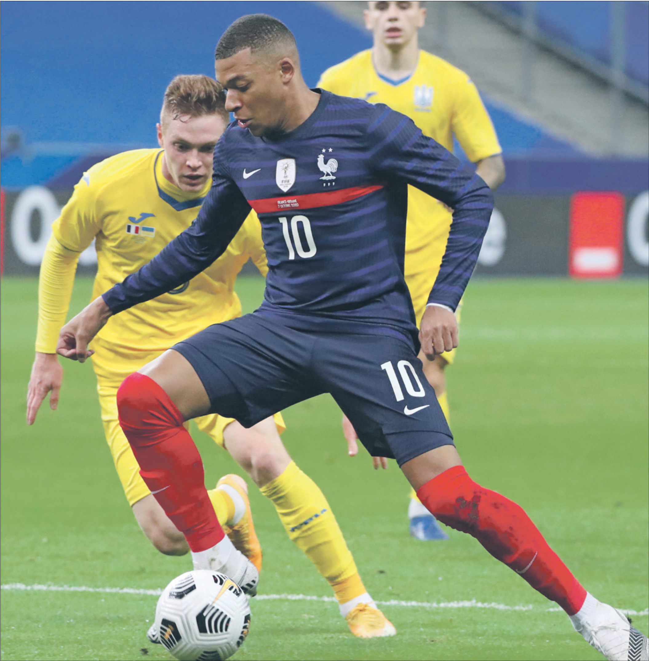
رطة العالم فرنسا يبدأ رحلة التأهل ضد أوكرانيا

افتقدت بطولة كأس العالم 2018 واحداً من المنتخبات المميزة وهو المنتخب الهولندي، الذي لطالما كان منافساً على لقب بطولة المونديال في السنوات السابقة، لكنه يعزّم