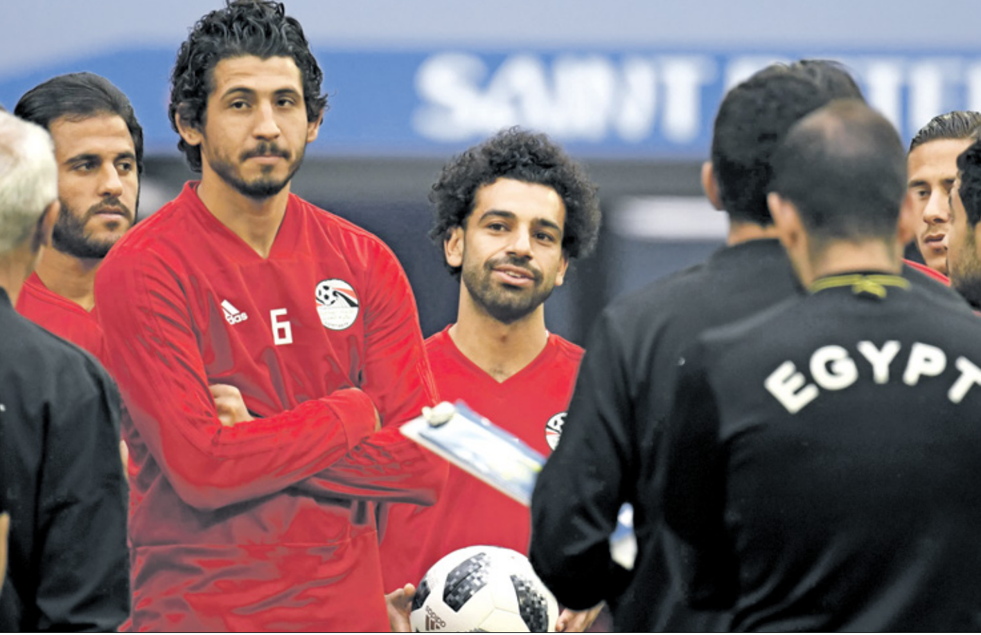
مدير الضم قائمه بلاعصي