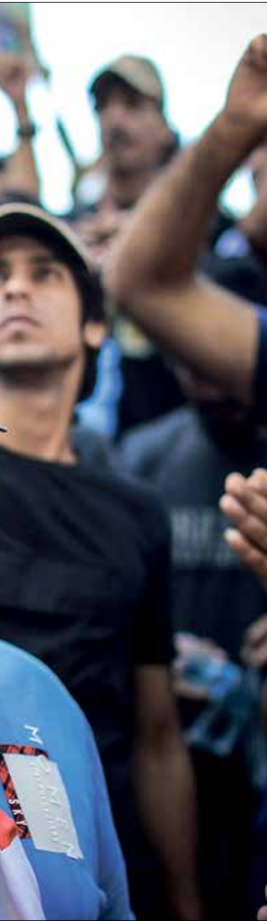
يرفض التيار المدني الدخول في حكومة محاصصة

في المقابل، لا تبدو أن لدى القوى السياسية الكثير من الخيارات المتاحة في ما يتعلق بتخصيص رئيس الوزراء المقبل، وهو ما دفع بأحد الساسة العراقيين إلى استعارة المعادلة اللبنانية في هذا الإطار، بشأن محدودية الشخصيات التي يمكن أن تحقق الحد الأدنى من التوافق السياسي داخل العراق وخارجه لتخمس رئاسة الحكومة، كما أن القوى المكلفة باختيار رئيس الوزراء، وفق الغرف السياسي في العراق القائم على المحاصصة الطائفية (بعد الغزو الأميركي)، تتحول على التناقض المتحد بين القوى السياسية السنية الشيعية وبين الحلفاء الحالي اختيار نائب رئيس البرلمان ورئيس للجمهورية، بمعنى أن اختيار رئاستي الجمهورية والبرلمان يسبق اختيار رئيس الحكومة. إذ يدعو رئيس الجمهورية الحالي برهم صالح البرلمان لانتخابات خلال 15 يوماً بعد التصاقه على نتائج الانتخابات البرلمانية، وتعدد «الخيار الحكمة» أمس الجمعة، في جلسة نقاشية، رئيساً له ونائبين، بالإضافة إلى «التيار الصدري» بين الساعة وأخرى، وهناك جهات تعتمد اختلاق أخبار وإشاعة كاذبة، وتسرب في ساعات متأخرة من الليل، لكن المعلومات مغلوطة لوسائل الإعلام، لكن وزير رئاسة الحكومة هو نتيجة حتمية وأوضاع الأحمدي، في حديث له عبرانيان، «أن التيار الصدري لديه خيارات، الأولى أن يأخذ النسلة الحكومية بالكامل كون صادقاً، وأحد أسماء مطرح، نعم، لكنها تفتق ضربة»، والكاظمي حفظه جديده وتنجح في تحقيق تقدم في ملفات عدة، أهمها إنقاذ الجيش من الانهيار، الذي لعب أخيراً