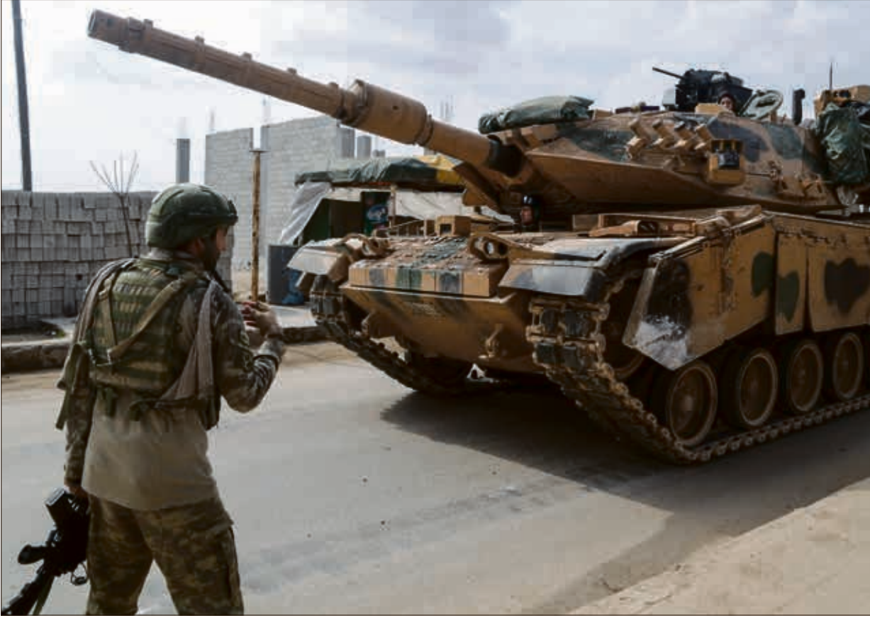
تسمر عمليات القوات التركية في بعض النقاط الحساسة

روسيا وإيران، التسلل نحو مناطق سيطرة المعارضة على خطوط التماس، بالإضافة إلى عمليات القصف شبه اليومية بالمدفعية الثقيلة، حتى بات الطيران الروسي أخيراً يشارك في عملية القصف بعد توقف عقب الأشهر الأولى من الاتفاق. ويات النظام والروس أخيراً يكشفون عن مطامعهم بالتوسع أكثر في إدلب ومحيطها، التي يشار إليها بمنطقة «خفض التصعيد الرابعة»، والتي تضم كامل محافظة إدلب وأجزاء من أرياف حماة الشمالية والغربية وحلب الجنوبية والغربية، وريف اللاذقية الشرقية، بدرية عدم التزام أنقرة بتطبيق التفاهات بينها وبين موسكو، ولا سيما إزالة خطر المجموعات الراديكالية وفتح الطرقات لتسهيل حركة التجارة، فيما تربط أنقرة تطبيق التفاهات في إدلب بأخرى تتعلق في مناطق شمال وشرق سورية، حيث السيطرة الكردية التي تؤرق تركيا على حدودها الجنوبية.