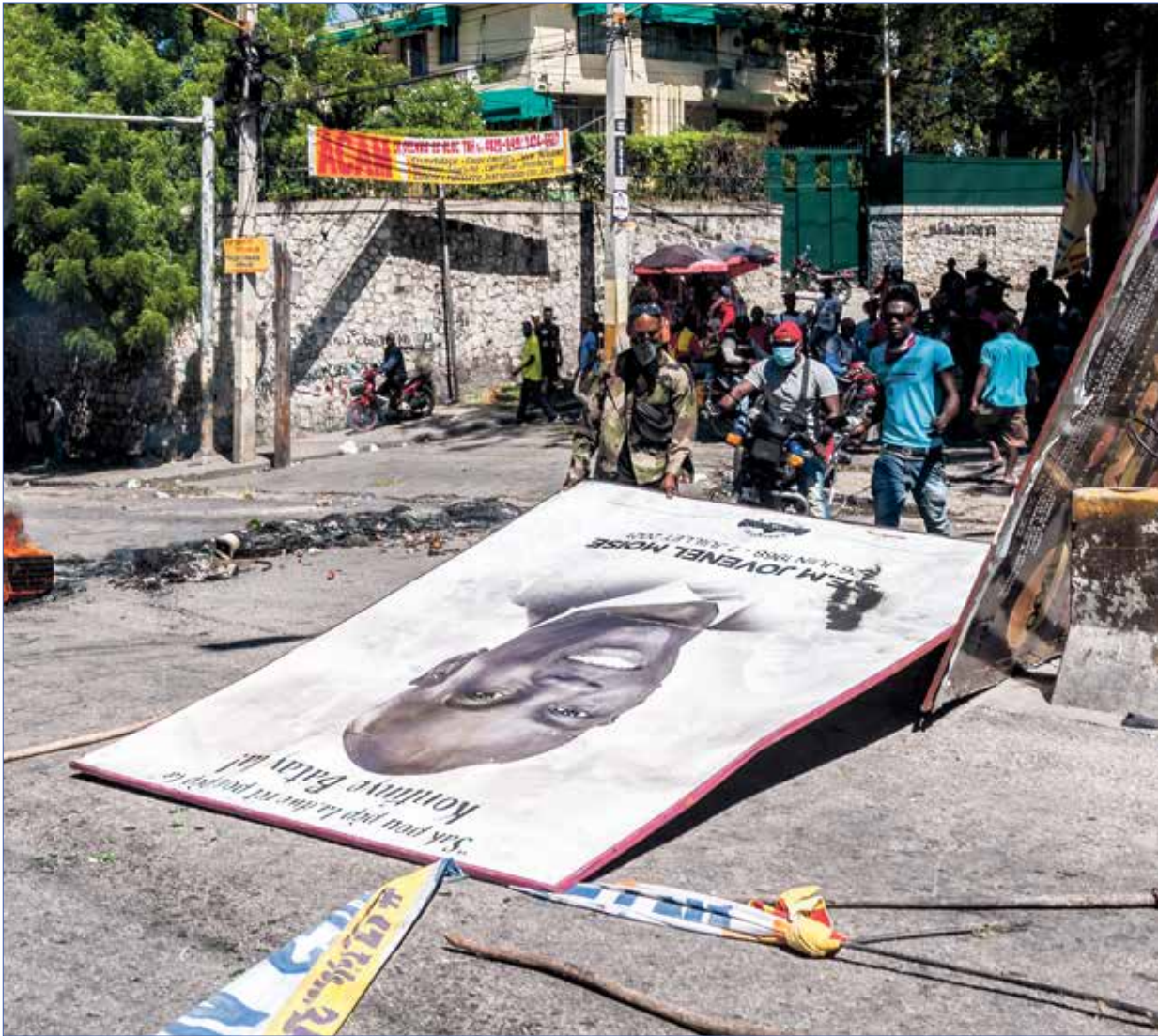
السع نشاط العصابات في عهد الرئيس الراحل جوزيفين موبس (أشياء جوسون/الناظر)

ليس اختطاف 17 مشيراً من أميركا الشمالية في هايتي أخيراً، والتهديد بقتلهم بحال عدم دفع فدية، سوني فصل من فصول جرائم العصابات في هذه الدولة، والتي تناهت نشاطها حتى باتت تسيطر على أكثر من نصف مساحة البلاد، وتخرط في كل شيء غير قانوني