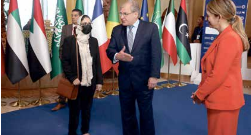
شارك ممثلون عن 27 دولة في المؤتمر