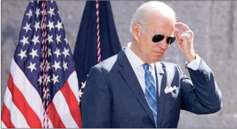
كز بايدن يفعله دعم الدولة في حرب جديدة مع بكين

وتناقض تصريح بايدن مع السياسة الأميركية القائمة منذ فترة طويلة في ما يعرف بـ«المخوض الاستراتيجي» التي تساعد واشنطن بموجبها تايوان في بناء دفاعاتها وتعزيزها من دون التعهد صراحةً بمساعدتها في حال حدوث هجوم، وقلعت الولايات المتحدة لالعتراف بكين بشكلًا رسميًا ووحيدا منذ 1979