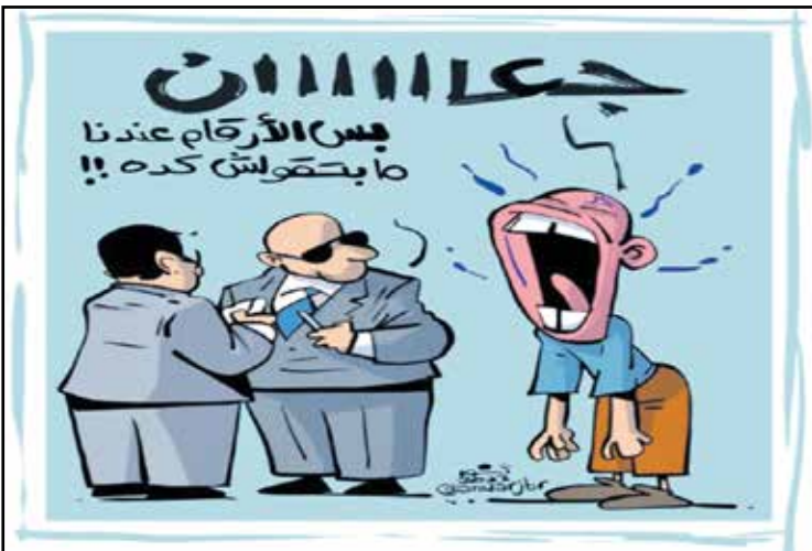
ما بين الواقع والأرقام في مصر (أبور جبر، تويتر)