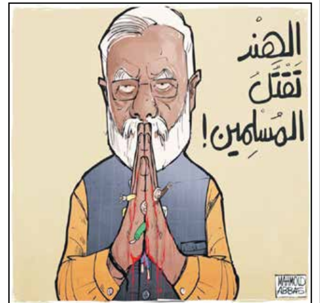
اضطهاد المسلمين في الهند مستمر (محمود عباس، فيسبوك)