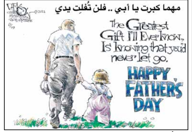
الاب سنّ دائم وعطاء مستمر (جوت داركو)