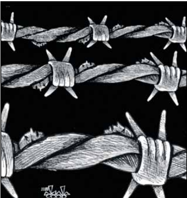
اليوم العالمي للاجئين