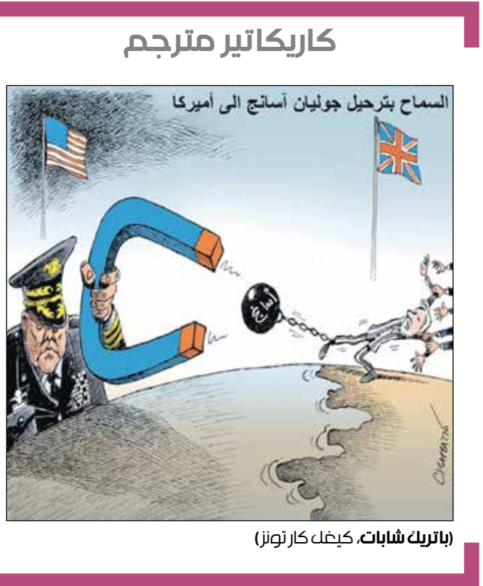
(باتريك شابات، كيدل كار تونز)