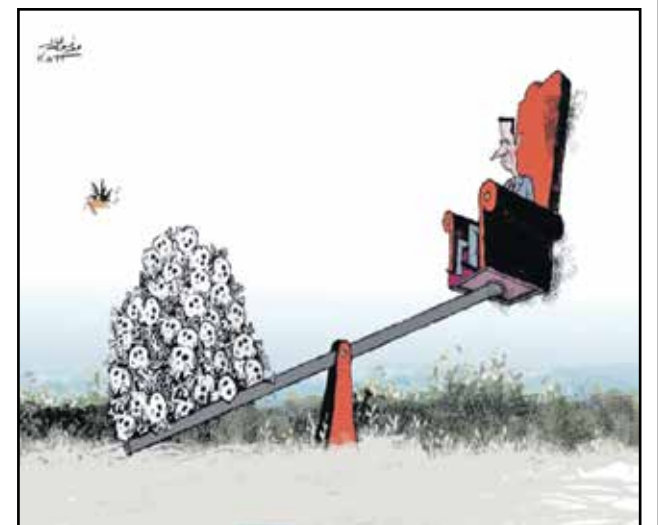
بقاء بشار الاسد في الحكم (موقف قات، سيريا تي في)