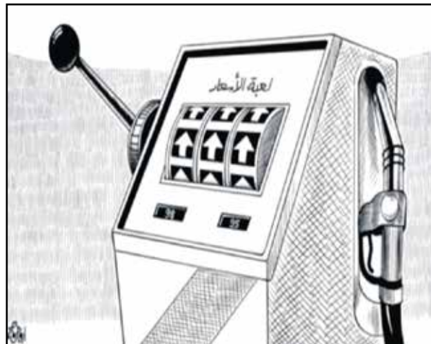
لعبة اسعار المحروقات في لبنان (النهار اللبنانية)