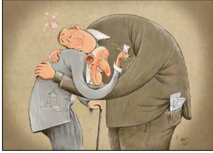
مهما كبرت ابي بصر على اعطاني المصروف (رهيم ارخمندا)

لا أحد في وسعه أن يدرك مبلغ الخيبة التي تعاني منها القروء هذه الأيام، جزاء قرار وزارة الزراعة الأردنية وقف استيراد القروء، خشية الوباء الجديد المنسوب إليها. كانت القروء تمني النفس بالسفر إلى الأردن، تحديداً، لأسباب عديدة، فمواطنو هذا البلد مميّزون بوداعتهم، ولا يتعاملون بشراسة مع الأحياء البرية، ما يعني أن القروء خسرت فرصة العيش بطمأنينة وسكينة بين ظهراشي هذا الشعب الوداع. ذلك سبب أول، أما الثاني فلأن البلاد تتوفر على سيارات شاسعة من الموز اللذيذ، والأهم أنه مرتفع الثمن، بدليل أن القلّة فقط من تستطيع اقتنائه، ما يعني أنه سيكون متاحاً لها بالمجان على أشجاره. وأما السبب الرئيس للخيبة، والذي لم تفصح عنه القروء حتى الآن، فيتعلق بنوايا خبيثة لدى هذه الفصيلة التي كانت تنتظر تطوراً جينياً طفيفاً لتكتمل مساواتها بالبشر، فهي كانت على قناعة دائمة، لا سيما بعد أن شاهدت سلسلة أفلام «كوكب القروء»، بأنها قادرة على منافسة البشر على السلطة، وأحسّت أنها ستجد في هذا البلد ضالتها، ومنظلاً لتحقيق أحلامها. مثلاً؛ كان يدور همس بينها، قوامه أنها لن تجد صعوبة في التعامل مع شعب «قردنته» حكوماته، أصلاً، ولن يضيف إليه حكم القروء مزيّداً من «القردنة»، وما دامت القاعدة راسخة فستكون الأمور سهلة لاحقاً. عموماً، بعد مناقشات مستفيضة قررت القروء المجازفة بالسفر، على قاعدة أن أحداً لن يستطيع تمييزها عن المسؤولين.