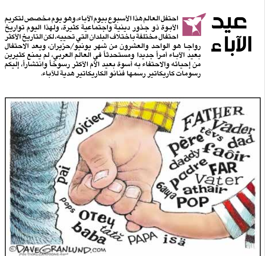
في كل اللغات كلمة بابا موجودة (ديف غرانلوند)