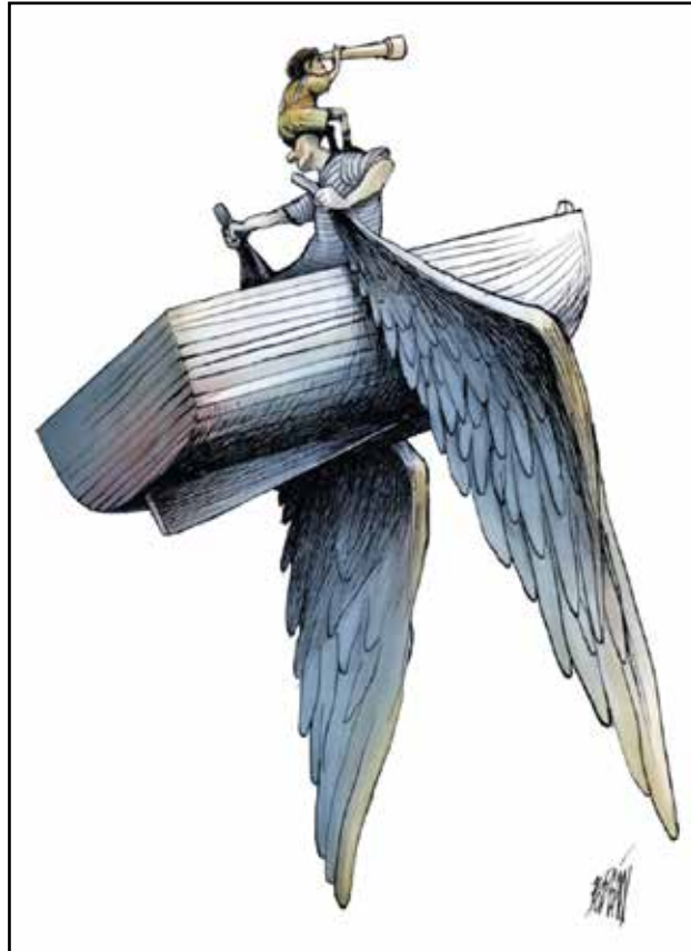
ابي ريان مركب يوصلني لبر الامان (الجبك بوليفان)