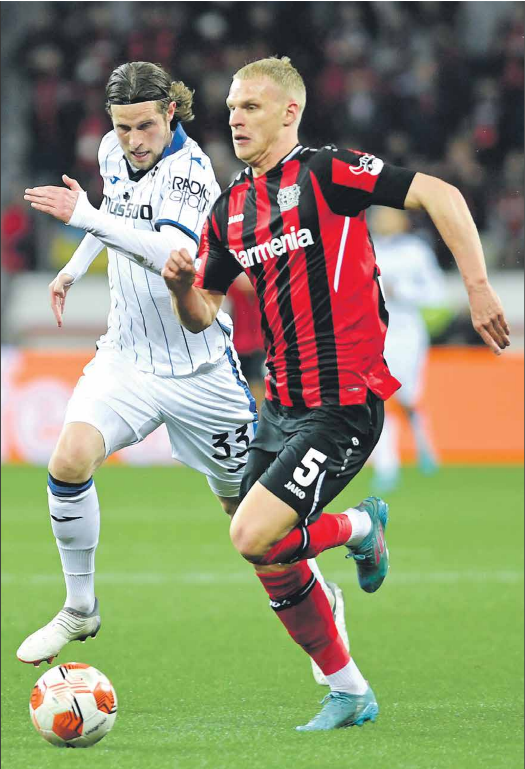
اتلانتا يحسم احر مواجهه مع ليفركورن في ملعب بايرلينا في 2022