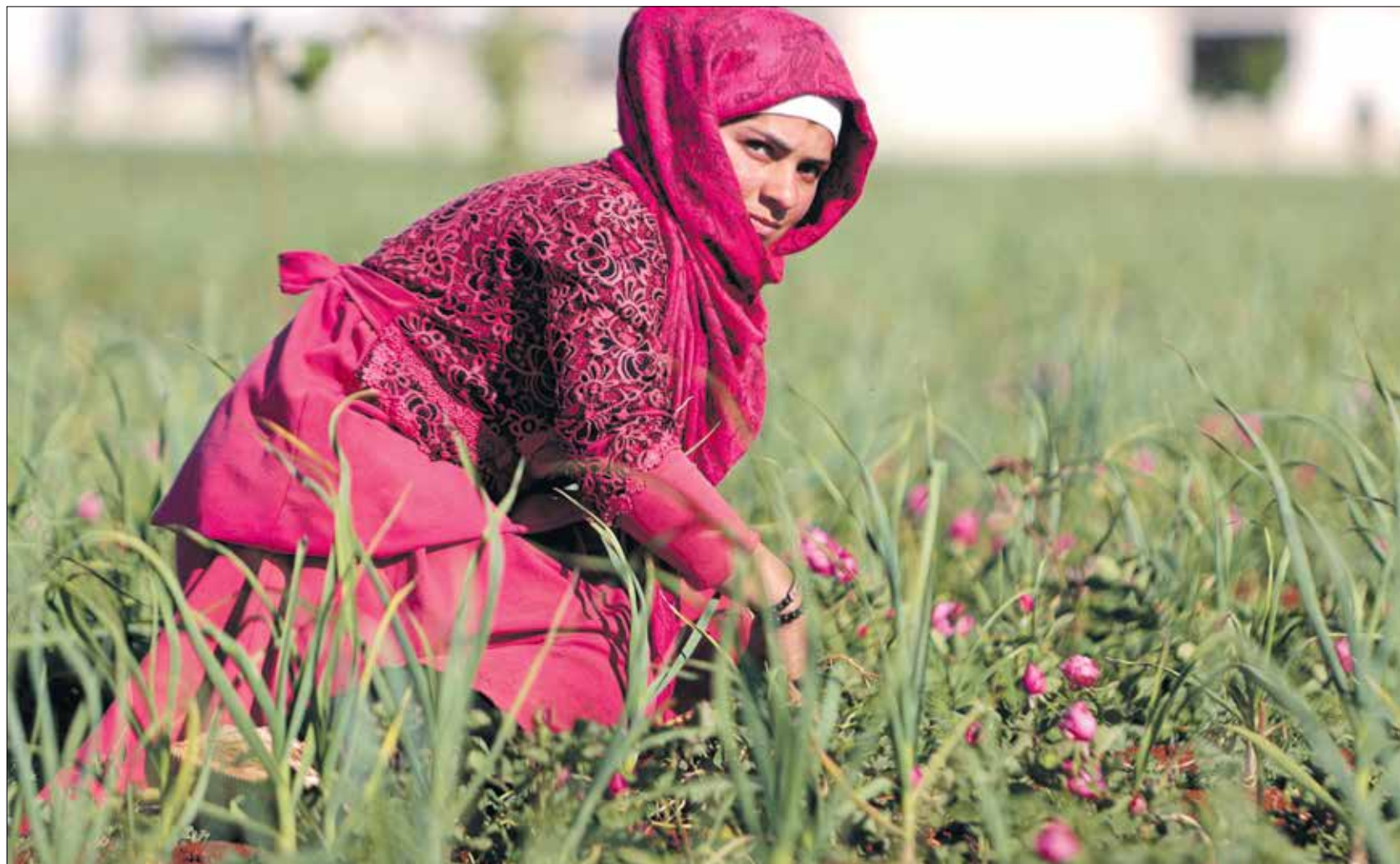
في ريف إدلب (تأليف وتحرير فرانس برس)

انتقل الورد الجوري من دمشق إلى أوروبا في القرن الثالث عشر خلال الحملة الصليبية على بلاد الشام، محتفظاً باسمه Rosa Damascena، وها هو ينتقل إلى شمال سورية وحدود تركيا، مع أهالي ريف دمشق النازحين