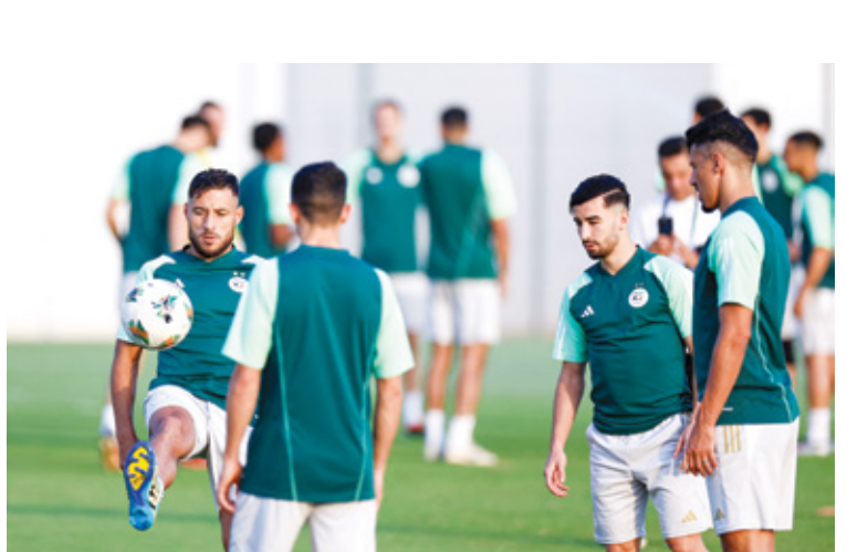
المنتخب الجزائري بقيادة جديدة امك المويض اكينزو (تريبوليتار خراسان برس)

تدخل المنتخبات العربية في الشمال الأفريقي الأخذة الدولية بين يومي 22 و 26 مارس/ آذار الجاري، بحثاً عن تحقيق العديد من المكاسب، ما بين تنشيط بدايات قوية مع مدربين جدد، وتقديم وجوه جديدة، والحصول على احتكاكات مفيدة، وعلاج أخطاء النسخة الأخيرة من اسم افريقيا التي خرجت خلالها من ادوار مبكرة، قبل استئناف مشوار التصفيات الأفريقية المؤهلة إلى نهائيات كأس العالم 2026 في أميركا وكندا والمكسيك. ونتيجة الانظار في