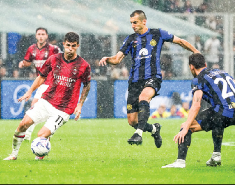
لترب الجماهير المواجهتين

ويعد أن نافس يوفنتوس إنتر لأسابيع طويلة في القسم الأول من الدوري الإيطالي، لم يحصد سوى 7 نقاط في آخر 8 مباريات وتراجع إلى المركز الثالث متخلفًا بفارق 17 نقطة عن إنتر المنتصم بفارق 3 عن ميلان، وستلعب يوفنتوس إنفاق موسمه مع مسابقة كأس إيطاليا حيث سيلتقي الشهر المقبل ويواجه البيغري المرتبط مع يوفنتوس بعقد حتى شهر يونيو/ حزيران عام 2025 ضغوطات كبيرة منذ أسابيع عدة حيث يتطلب بعض انتصار الفريق برحيلة.