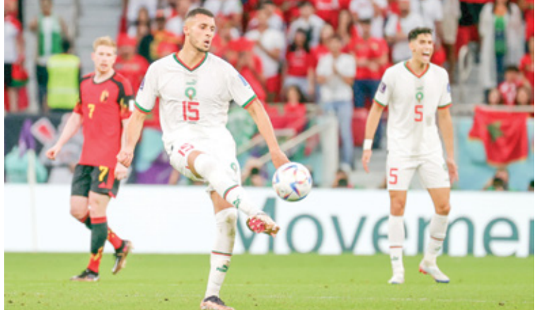
الأسود الأطلس ومساعد للاستفادة من نجومهم المميزين

على رأسهم زامبي سيبيعتي وعيسى ساندي ويوسف عطال وغانداد بونجاح ورامز زروقي وإسماعيل بن ناصر وعمورة وبواوي وفارس شايبني ويفتقد منتخب الجزائر لأسماء كبيرة، منها رياض محرز كاتب المنتخب المحترف في صفوف الأهلي السعودي، وإبريس مولوحي حراس الرمى، وسفيان فيفولي، وإسلام سليمانني، وأكد فالاديم بيتكوفيتش المدير الفني لمنتخب الجزائر، في تصريحات إعلامية، تتلعه لاستغلال البداية في التعرف عن قرب على مجموعة اللاعبين المخترارين لآداء التحدي المغبل وشدد بيتكوفيتش على أن باب