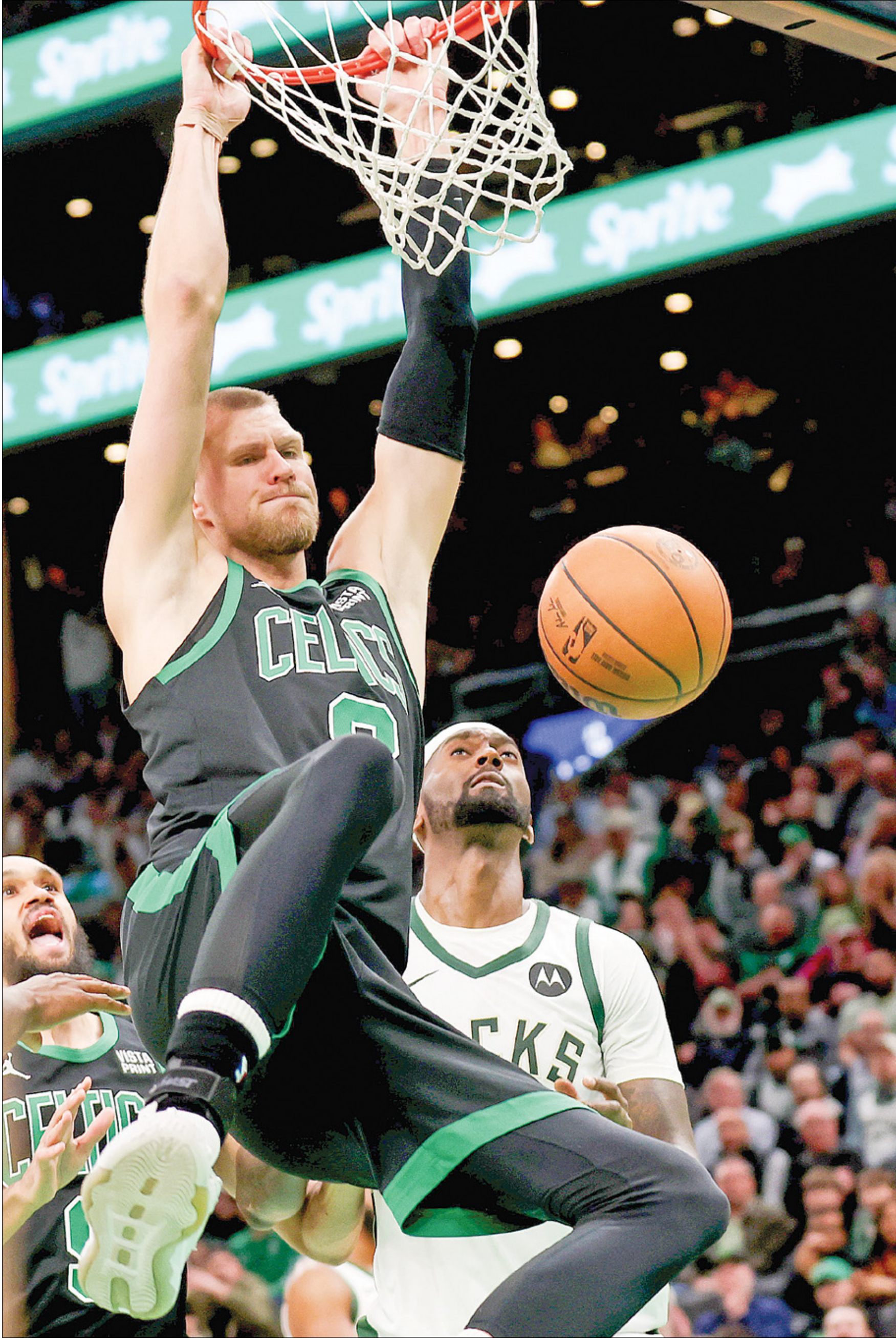
بات بوسطن سلتيكس من أبرز المنافسين على لقب الدوري

حقق فريق بوسطن سلتيكس متصدّر المنطقة الشرقية وصاحب أفضل سجل في دوري كرة السلة الأميركي للمحترفين فوزه السابع توالياً، وجاء على حساب وظيفه ميلووكي باكس (122 - 119). وفرض سلتيكس أسلوبه إذ سجل 5 لاعبين في صفوفه أكثر من 10 نقاط، تقدمهم جايسون تايتوم مع 31 نقطة و8 متابعات و4 تمريرات حاسمة، في وقت ساهم فيه ديريك وايت برصيد 23 نقطة، و اضاف جايلن براون 21 نقطة واللاتفي كريستابس بورزينغيس 17 نقطة والبديك بايتون بريتشارد 19 نقطة.