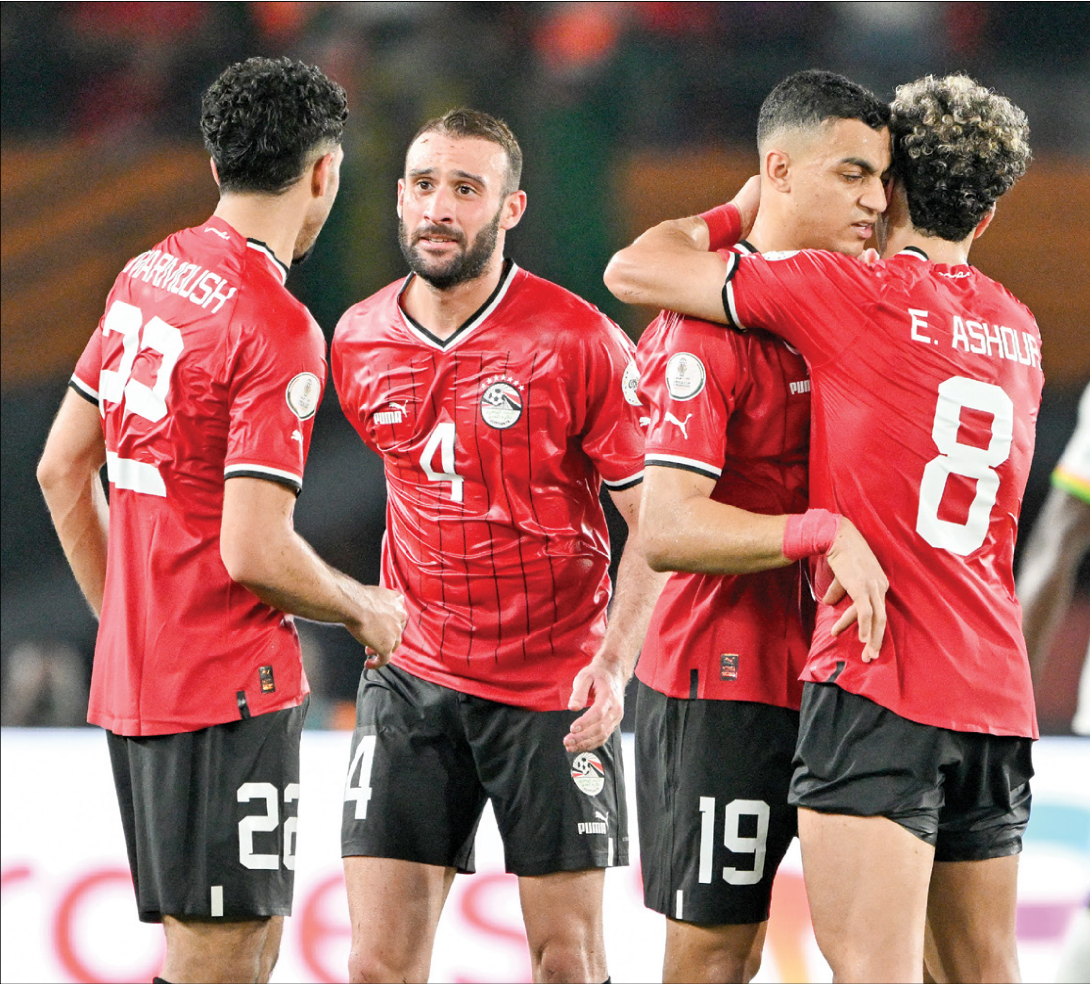
المنتخب المصري يسعى للاستفادة من مدربه الجديد