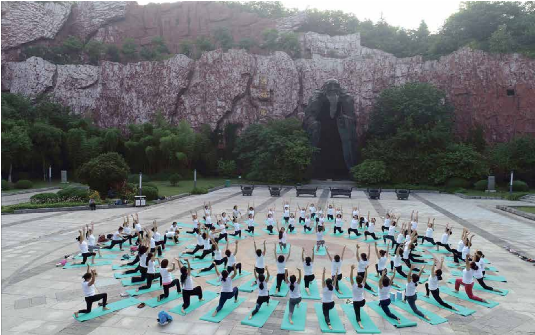
تمارك بوغا في «ساحة لاو تسو» بمدينة هروايان الصينية