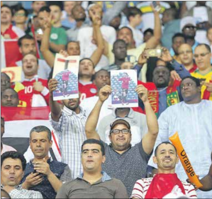
اللحم المصري، مشرف الجاهير

لاكثر من أزمة صحية في السنوات الأخيرة، ولم يقدر البعض حجم علاقته القوية مع محمد صلاح نجم ليفربول الانكليزي، وأفضل لاعب كرة في أفريقيا حاليا، والذي يعتبر ابوتريقة المثل الأعلى والقُدوة الكروية له، حيث نبناه حينما بدأ الثاني رحلته في المنتخب المصري أواخر عام 2011. وتعرض صلاح لانتقادات عنيفة بسبب صوره مع ابوتريقة خلال احتفالات عديدة مثل احتفال صلاح بالحصول على الكرة الذهبية ولقب أفضل لاعبي القارة في عام 2018، وكذلك عند حصوله مع ليفربول على لقب بطل كأس دوري أبطال أوروبا لهذا الموسم. ورفض صلاح محاولات الوقعة بينه وبين ابوتريقة بشكل لافت رغم تعرض صلاح نفسه لانتقادات عنيفة بسبب ظهوره المكرر مع ابوتريقة، متسانا انه - أي ابو تريكة- أكبر داعمه، في المنتخب المصري بين عامي 2011، 2013، بل وتصريحه