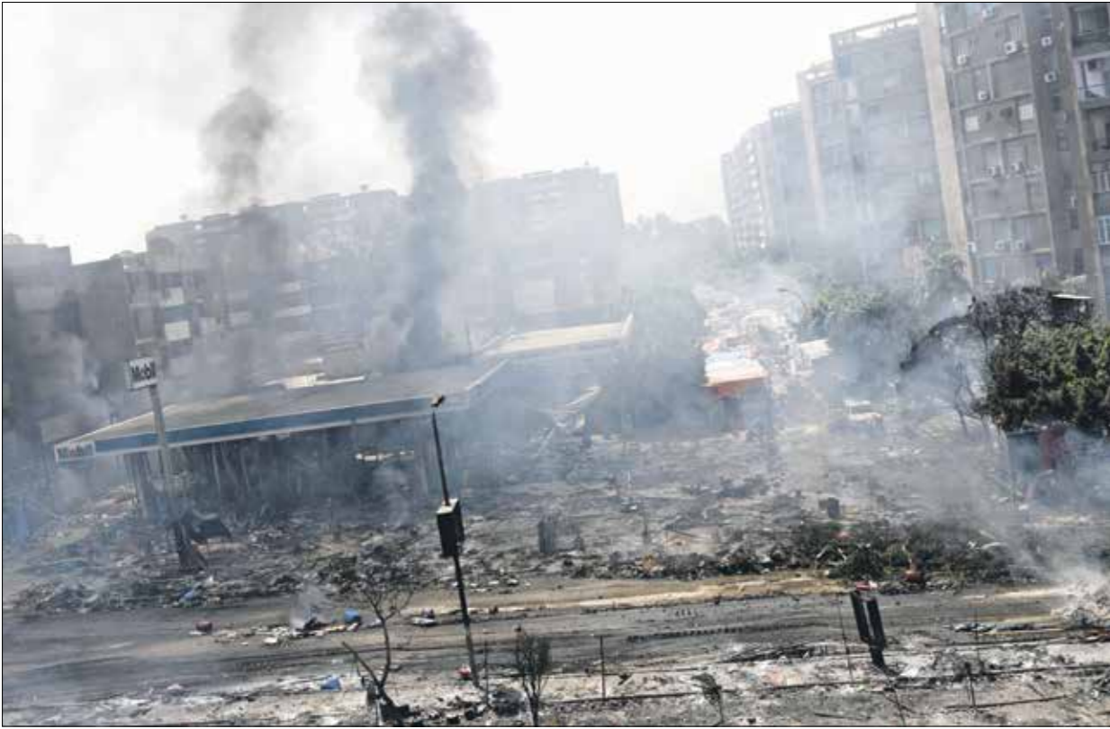
من أحداث مجزرة اعتصامي رابعة والفضة