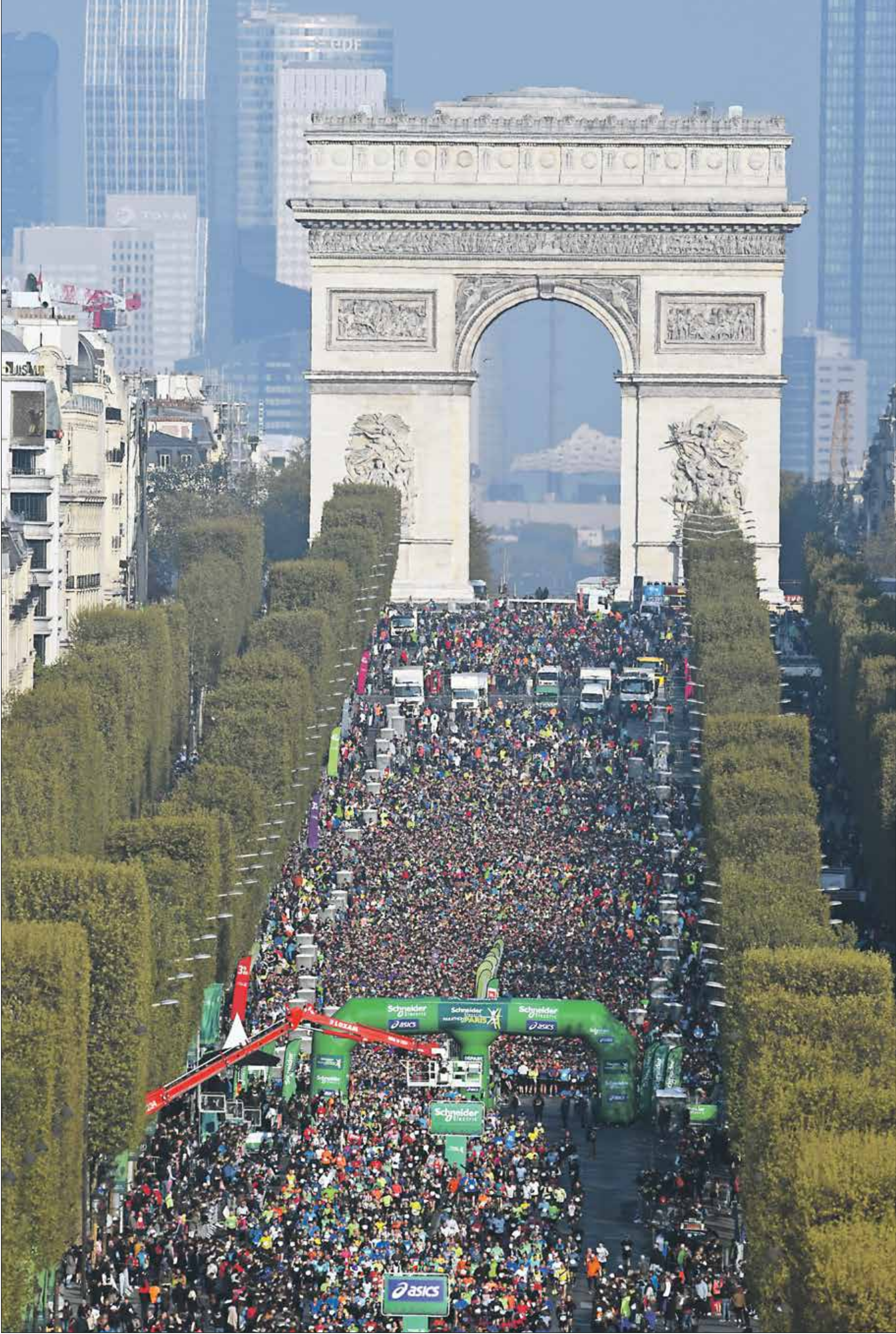
نسخة عام 2019 شهدت مشاركة ضخمة

الذي ماراثون باريس المقرر في 15 من تشرين الثاني/ نوفمبر المقبل، نتيجة تفشي فيروس كورونا وصعوبة إمكانية سفر العديد من المشاركين إلى المدينة، وفقاً للمنظمين. وذكرت الهيئة المنظمة في بيان «خيبة الأمل شديدة لمن ضحوا بكثير من الوقت للاستعداد لجعله ماراثون الخريف». يُذكر ان السباق يمتد على مسافة 42 الفاً و195 كلم، ويمرّ ببعض أشهر الأماكن في العاصمة الفرنسية، مثل شارع الشانزليزيه وبرج إيفل.