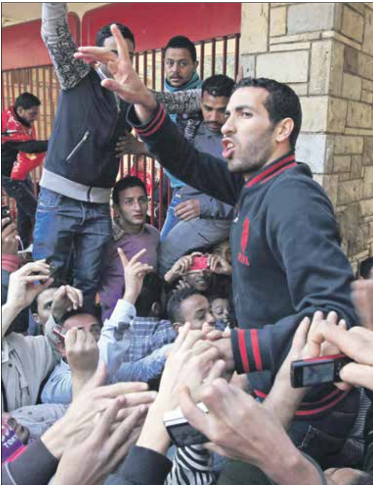
كان حريصا على التقرب من الناس