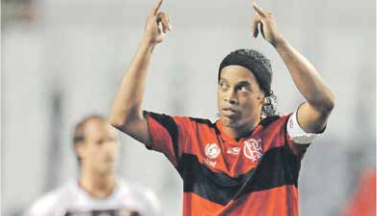
رونالدينو يضا واحد من الصفقات الوهمية لتصوير (يوجا شندز/Getty)

في اجتماعها المقبل وهو ما يكفي فقط لنصف راتب ميسي سنوياً من البرسا بعيدا عن حقوقه الإعلانية، وليس قيمته التسويقية في عالم الكرة، التي تتخطى 100 مليون يورو، وهو ما يفوق الميزانية المالية للنادي بشكل عام شاملة أصوله التشغيلية عن آخر عام مالي 2019-2020، المنتظر عرضها على الجمعية العمومية