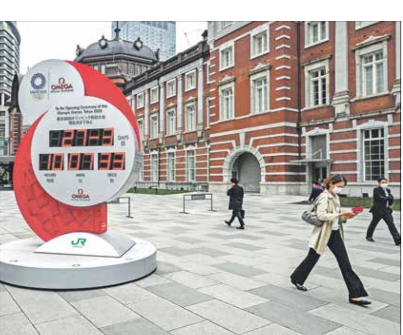
لتزيب الجماهير انطفق دورة طوكيو في العام المقبل

في موعدها الجديد، من بين التكاليف الإضافية العديدة التي لم يتم احتسابها على وسائل التواصل الاجتماعي، وبالإضافة إلى حالة الحجر العام التي عاشتها العديد من دول العالم، وإغلاق المطارات والموانئ