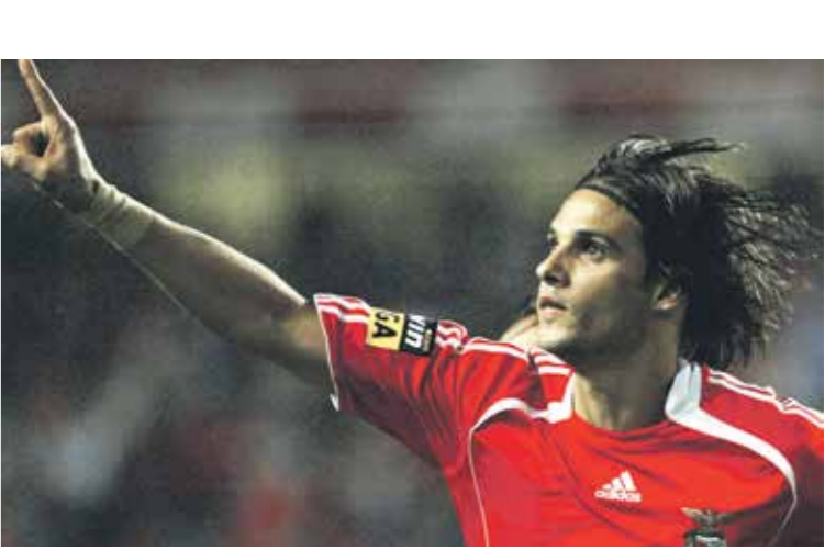
الأهلي تعرض للموقف عينه مع نونو غوميش والمدرب ساليبي

ما قاله رئيس نادي الزمالك في مداخلة هاتفية لقناة نادي الزمالك، كان كفيلاً بإثارة الجدل حول ملف «صفقات الفلكوش» في الكرة المصرية، خاصة وأنه ربط القدرة المالية على ضم ليونيل ميسي قائد وهداف برشلونة الإسباني والهداف التاريخي لبطولة الدوري الإسباني، بامتلكه ربع