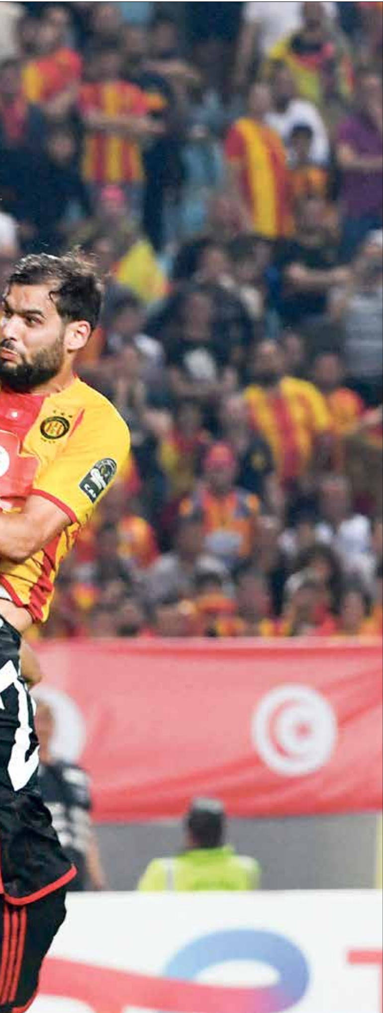
حادل الترجي بمباغلة حارس مرماه الأهلي في اللقاء

دوق جنوى، لينتهي اللقاء بالتعادل السلبي، ومن جانبه، قال السويسري مارسيل كولر المدير الفني للفريق الأهلي: إن التعادل نتيجة طيبة بالنسبة لفريفة أمام منافس مثل الترجي، بمتناز بالوقت في الإداء، وكانت له فرص خطيرة في لقاء الذهاب على ملعبه. وأضاف في المؤتمر الصحافي بعد المباراة: «لم يكن أداء الأهلي في الشوط الأول على المستوى المطلوب، ولكن تحسن الأداء في الشوط الثاني، وبالتأكيد سيختلف الأمر في لقاء القاهرة، وستكون هناك محاولات هجومية أكثر من أجل التسجيل، والحصول