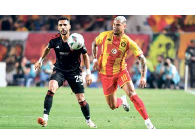
نطح الأهلي في الحد من خطورة الترجي

جاء التعادل السلبي في «الكلاسيكو» العربي الكبير بين الترجي التونسي والأهلي المصري في ذهاب النهائي من عمر بطولة دوري أبطال أفريقيا لكرة القدم لموسم 2023-2024 في رادس، ليؤجل حسم اللقب إلى موقعة القاهرة يوم السبت المقبل ورفقنيا، بات الأهلي في حاجة للفوز بباية نتيجة على ملعبه ووسط جماهيره على استاد القاهرة الدولي من أجل حسم لقب بطل دوري أبطال أفريقيا للمرة رقم 12 في تاريخه، في المقابل يحتاج الترجي إلى