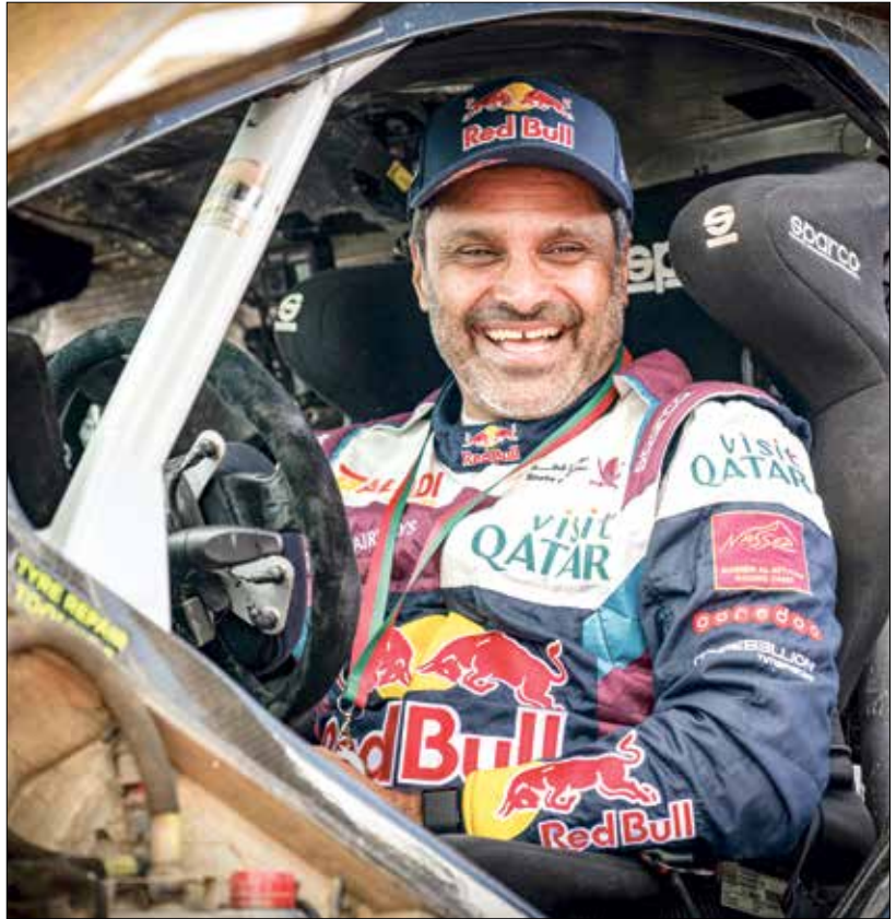
مت مشاركة العطية في رالي البرتغال يوم 7 أبريل 2024 وكاتيليو باسولس

ويعتبر هذا اللقب السادس عشر لناصر العطية وهو رقم قياسي، في تاريخ مشاركاته في رالي الأردن من أصل 21 مشاركة، كما بعد هذا الفوز هو الـ85 في مسيرة السائق القطري خلال مشاركته في البطولة الشرق أوسطية من أصل 233 جولة في البطولة، والتي يسعى فيها هذا العام للفوز بها للمرة العشرون في تاريخه المحال بالانتصارات الكبيرة والتاريخية. وانتهى العطية بصحبة ملاحه البولندي جوفاني بيرناتشيني على متن سيارة