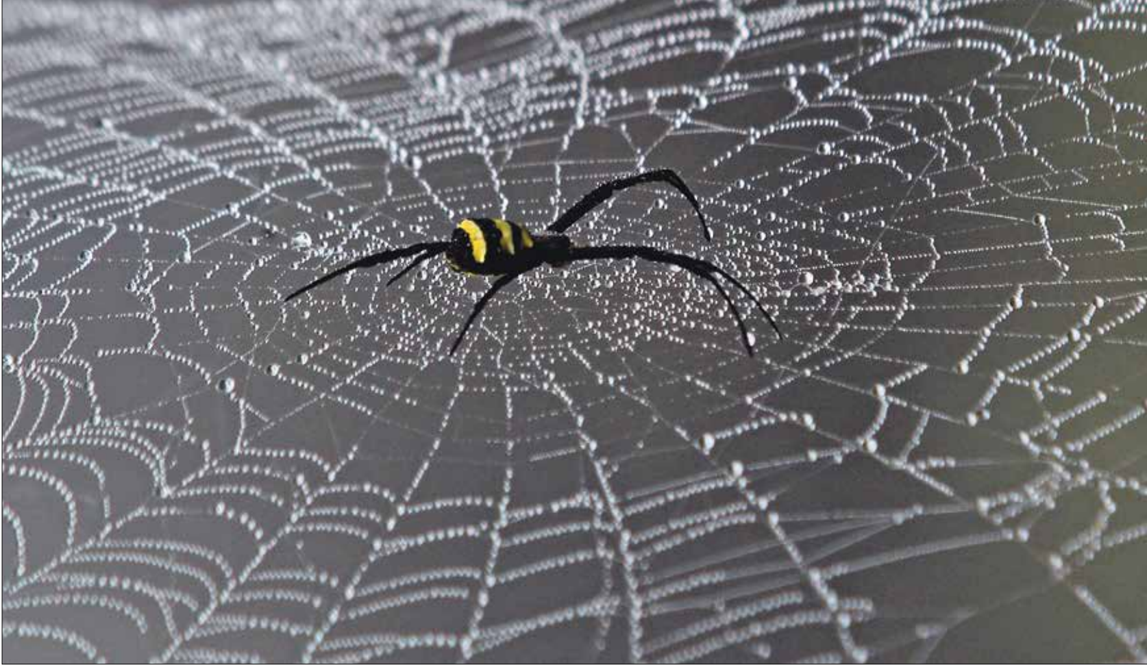
يمكن لهذا البحث أن يعطينا مفاتيح تساعدنا في دراسة أدمغة أكبر وأعمق

وجد أربعة علماء، في العنكبوت، فرصةً لمحاولة دراسة ميكانيكيات الدماغ المعقدة والأكثر غموضًا في علم الأحياء، إذ إن العنكبوت، رغم دماغه الصغير، إلا أنه يبني شبكة معقدة للغاية