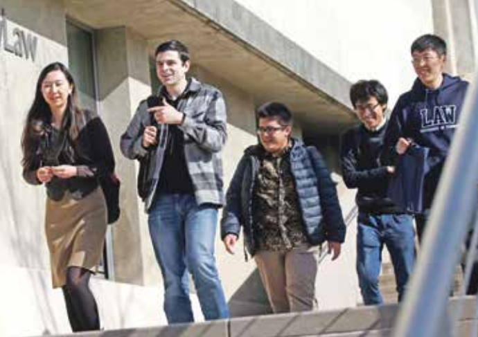
طالب في جامعة روكهيل للتحفوف في فلورنوربا

ينقل تقرير نشره موقع «تايمز هابر إيديوكيشن» عن استطلاع للرأي أجريته جامعة إريزونا الأميركية بالتعاون مع رابطة قيادة المجتمع الصيني – الأمريكي، أن معظم العلماء من أصل صيني في الولايات المتحدة يعتقدون أنهم يخضعون لمراقبة مستمرة من الإدارة، رغم أن أبحاثهم وعاليمهم تدريسيهم ونشاطاتهم العلمية تخضع لتقدير جميع زملائهم من أصول أخرى، ويحتم ذلك خضبة الجامعات الأميركية من خسارة قاعدة أساسية من الطلاب والعلماء من أصول صينية، علماً أن حوالي ألف من العلماء الصينيين فروا من الولايات المتحدة خلال حملة القمع التي شنتها إدارة الرئيس السابق دونالد ترامب على الصينيين، وتظهر بيانات المركز القومي لتبادل المعلومات الخاصة بالطلاب أن الالتحاق الدولي بالجامعات الأميركية انخفض بنسبة 8 في المائة في خريف العام الحالي.