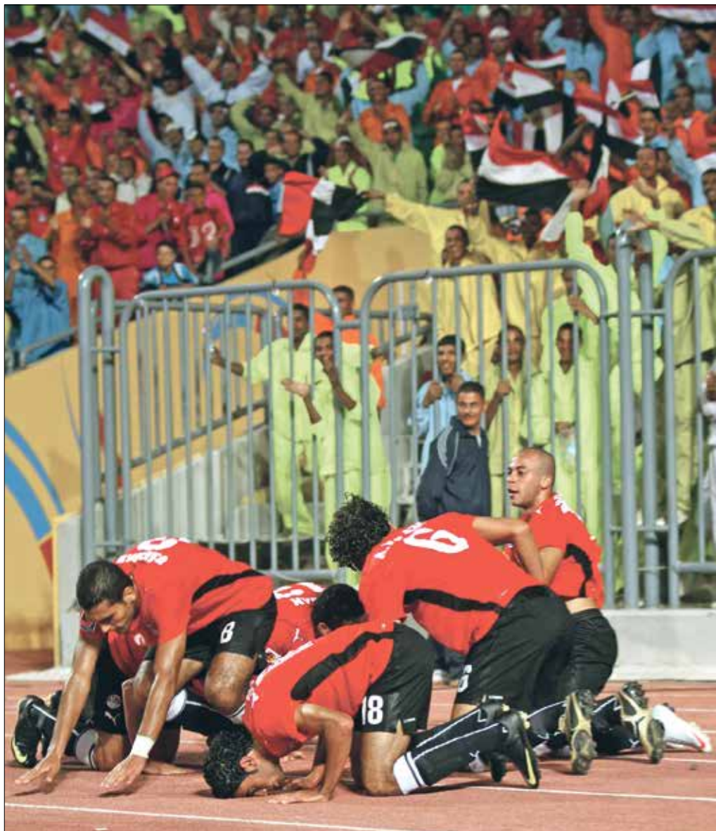
ملتحب مصر يردد تكرار الفرحة والتتويج باللعب

أقيمت بطولة كأس العرب نسخة عام 1992، بنظام المجموعتين، إذ ضمت المجموعة الأولى كلا من مصر والكويت والأردن، بينما ضمت المجموعة الثانية منتخبات السعودية وسورية وفلسطين. وفي تلك النسخة تاهل إلى الدور نصف النهائي الأول كل من مصر وسورية، وتفوق الأول بركلات الترجيح (4 - 3)، أما في نصف النهائي الثاني ففوق المنتخب السعودي على الكويتي بهدفين نظيفين. وفي المباراة النهائية أطاح المنتخب المصري بنظيره السعودي (3 - 2)، ليتوج باللقب.