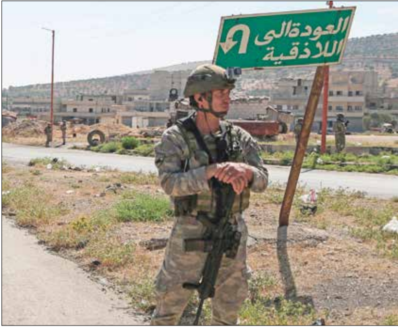
يبدى تركيا لشهدا حياك ملف، «ام 4»

ويعد هذا الطريق أبرز طرق الدولية في سورية، ويبدأ من مدينة اللاذقية، كبرى مدن الساحل الغربي البلاد، ثم يخترق