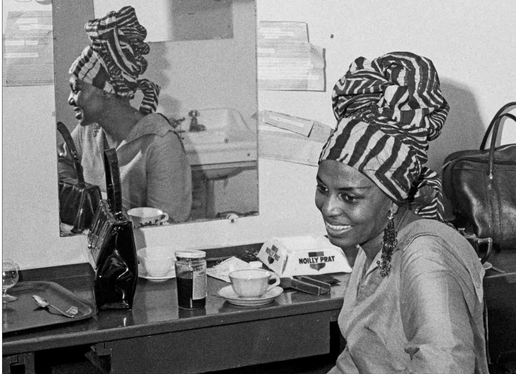
نثيث من بلدها في عام 1959 ولم تعد حلت عام 1994

صوتها إلى العالم، وامتزج البلوز مع الجاز في كلمات أغانيها، لتتحق ماكيبا جماهيرية كبيرة في الولايات المتحدة. لكن لم تلبث أن تراجعت شعبيتها بين أبناء البيض، بسبب نشاطها في حركة الحقوق المدنية، ثم زواجها من زعيم حركة الفهود السود، ستوكلي كارماكل.