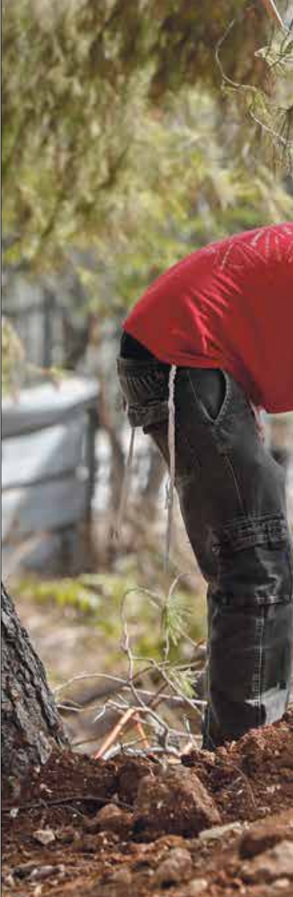
مسلوطن يصعد فيه أحد أجزاء مقبرة اليوسفية في أكتوبر الماضي

ويخشى المحفوسين من أن تؤذي هذه المخططات، من خلال الاستيلاء على جزء من المقبرة، إلى تغيير ملامح المدينة، وطمس المعالم العربي والإسلامي، كما يؤكد المفتي العام للقدس والديار الفلسطينية، الشيخ محمد حسين، إذ كان سبق ذلك تعرض