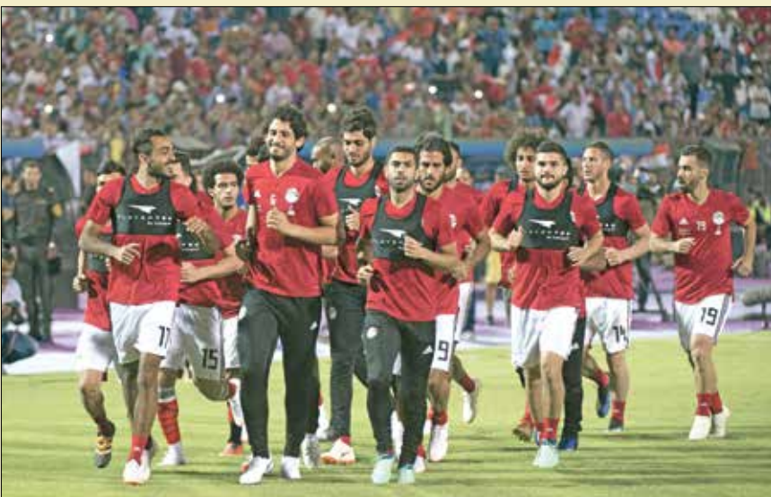
ملحق مصر الأكل ظهوراً في بطولة كأس العرب بين مصر (المنتخب)