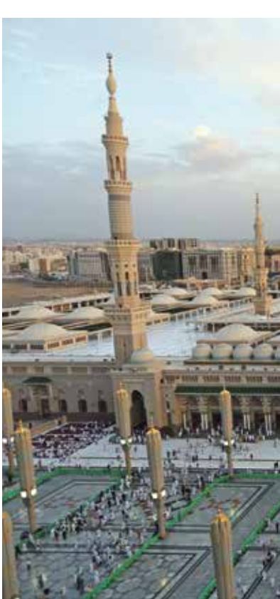
المسجد النبوي بالمدينة المنورة احد نماذج الدراسة

ويشير على الأكبر ضاوي، إلى أن المجلس الوطني للبحوث العلمية في لبنان، قام بالتعاون مع المؤسسة اللبنانية للطاقة المتجددة، خلال السنوات الثلاث الأخيرة، بدراسة إمكانية استخدام الواح الطاقة الشمسية في توليد الطاقة الكهربائية على أسطح المدارس، والمستشفيات، والمصانع، والأراضي المتاع، والمساجد، والكنائس. وتعتبر النتائج الأولية مشجعة باعتبار أن لبنان يمتلك مساحات كبيرة عبر الأخيرة وتم اختيار 26 في غلاستكو، أمام صناع القرار، وتم اختيار الفريق اللبناني من بين منافسين آخرين تقدموا لإعداد المشروع من قبل تحالف «أمة لأجل الأرض»، ومنظمة «غرينبيس»، ما يؤكد على أهمية استثمار الكفاءات البحثية والعلمية اللبنانية في القطاع التيار الكهربائي.