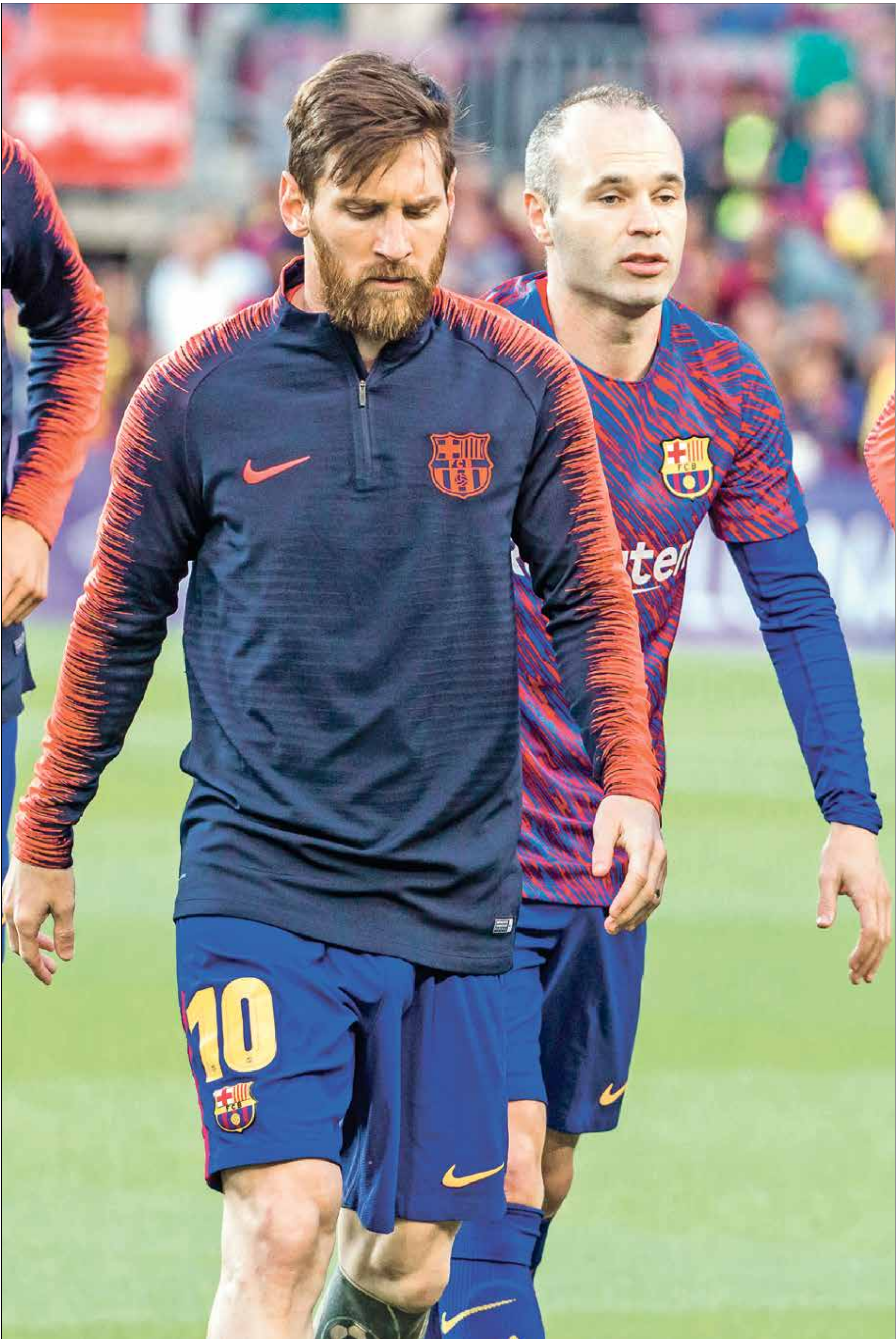
ميسي وإنيستا شكلا مع ناشق والميش فريقاً اسبانيا