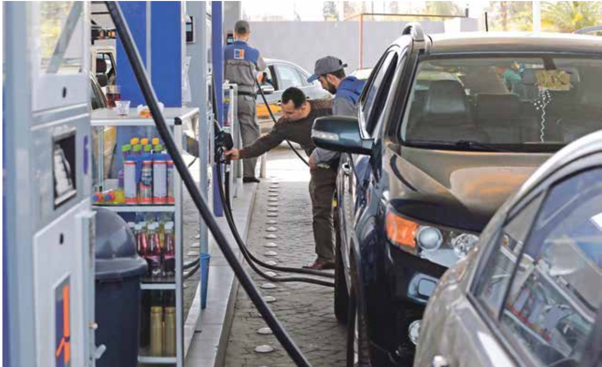
ارتفاع اسعار الوقود يرهق السوريين

تصاعد الزمات العيشية بسبب الإنفء التدريجي للدعم