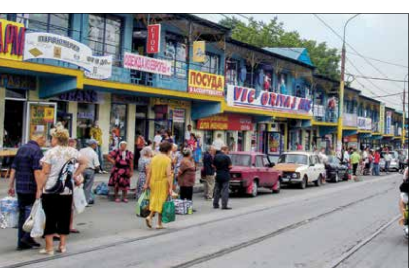
سوق في مدينة دونباس المضرة في اوكرانيا

ومن بين الخطوات السابقة التي اتخذتها موسكو وثارت استياء كيف، اعتراف روسيا بالعديد من الوثائق الصادرة عن «جمهورية