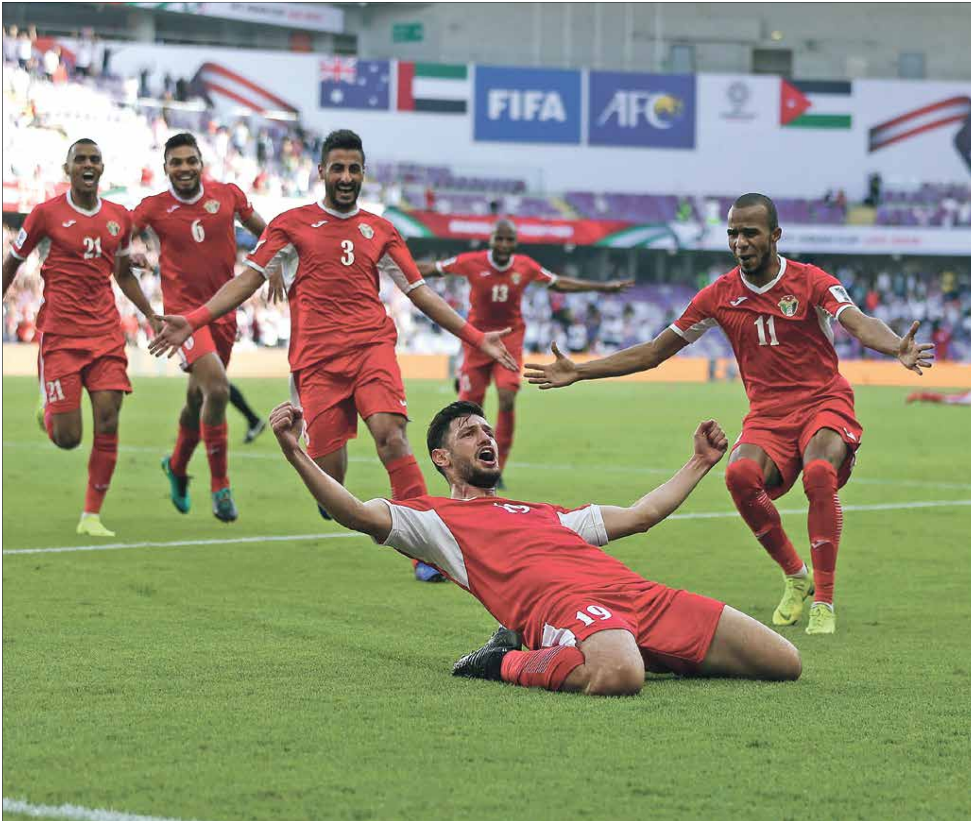
منتخب الأردن ياهل في التأهل بكأس العرب