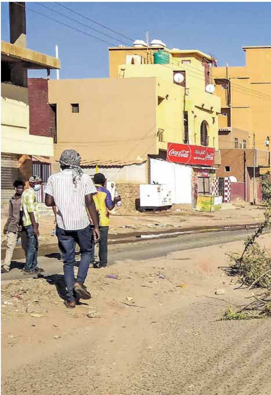
تحركات في الخرطوم بحري، امس ضد انقلابيين (فرانس برس)

بالتوازي مع ذلك، تصاعد المواقف الدولية المنددة بعنف العسكر، وبأن مسؤول السياسة الخارجية في الاتحاد الأوروبي، جوزيب بوريل، في بيان امس، استخدم القوات المسلحة العنف تجاه المتظاهرين السلميين، وطالب السلطات العسكرية بالعودة للدستور وإعادة حدود والإفراج عن المعتقلين، محذراً من أنه في حال لم يعد النظام الدستوري فوراً ستكون هناك