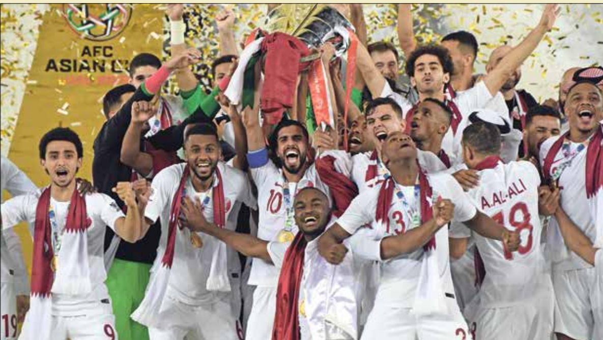
توج الملحق القطري بلقب كأس آسيا 2019