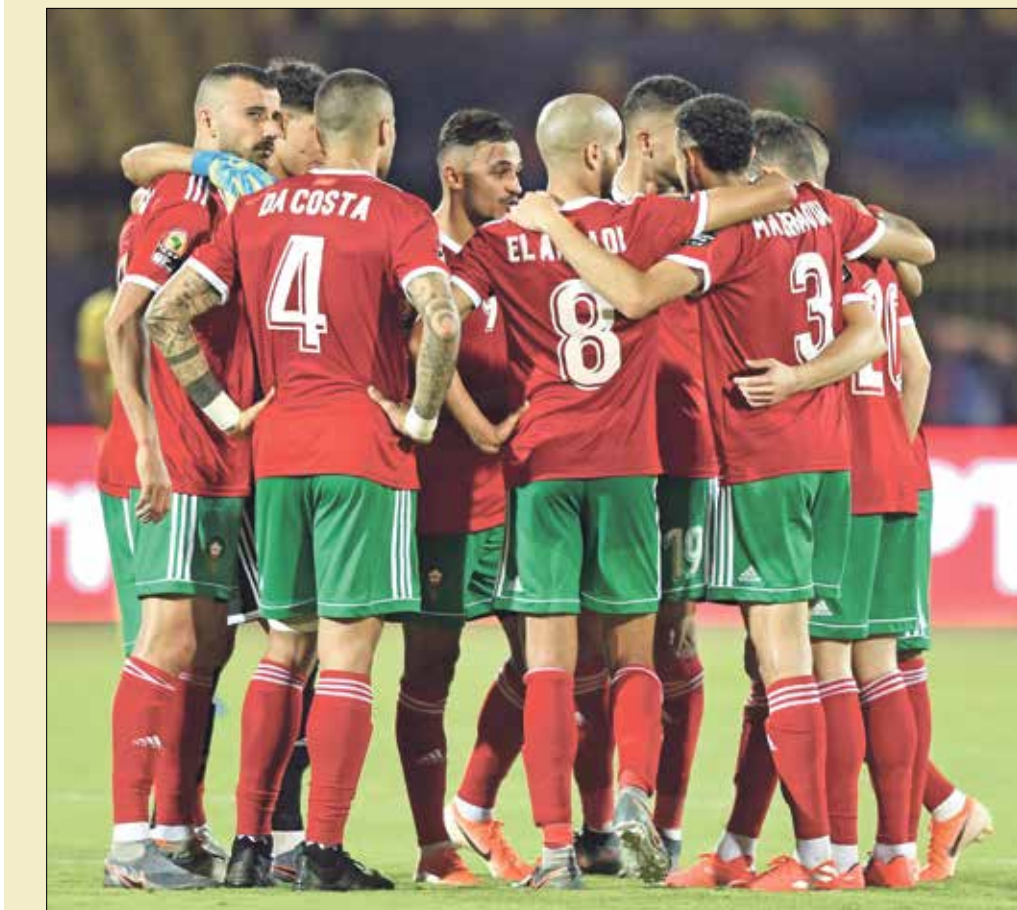
يسعد الملحق المصري للحديث للشباب