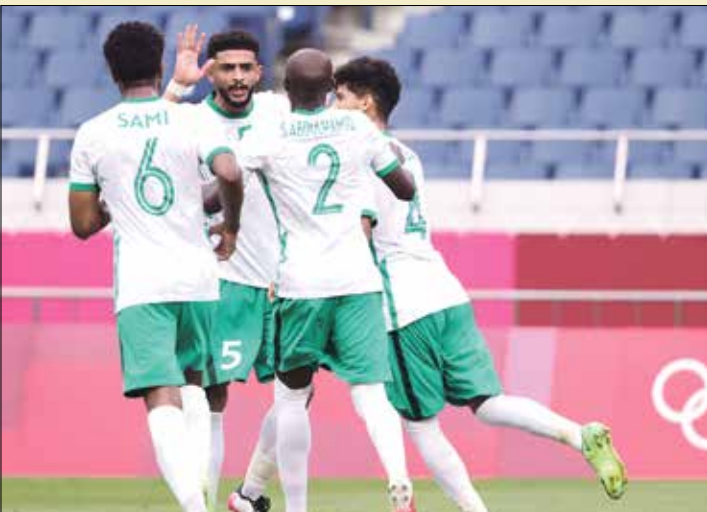
تألق جديرة للمنتخب السعودي في المونديال