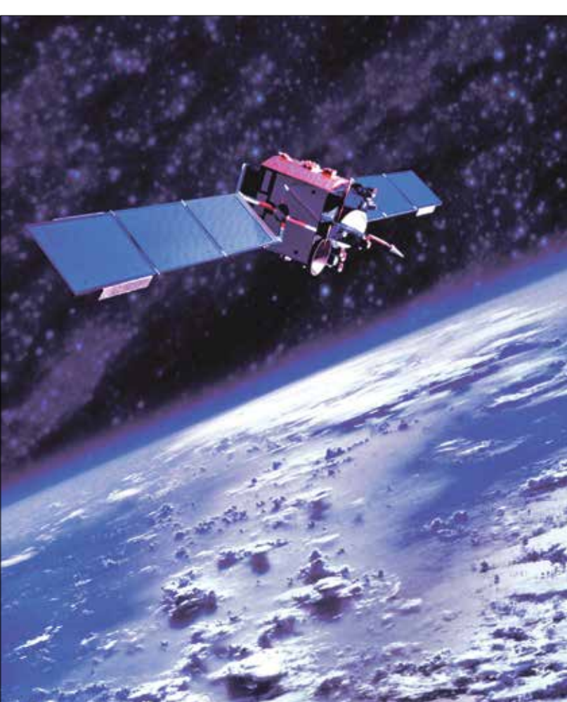
وزن الكتلّة الإجمالية للحسام الفضائية في مدار الأرض بتجاوز 9600 طن

تستخدم في لعبة السوفتبول او الكرة اللينة تدور حول الأرض. وتوجد نصف مليون قطعة من الحطام يزيد حجمها عن سنتيمتر واحد و100 مليون قطعة من الحطام حجمها نحو ملليمتر واحد أو أكبر. ويبدو الحطام، خاصة بالقرب من محطة الفضاء الدولية، في جميع الاتجاهات. وقال ناسا إن هناك حوالي 166 مليون قطعة من الحطام الفضائي في مدار حول الأرض يتجاوز 9600 طن. وقال هولغر كراغ، رئيس مكتب برنامج سلامة الفضاء التابع لوكالة الفضاء الأوروبية، في مقابلة، إنه في غضون بضعة عقود، إذا استمر تراكم الحطام الفضائي، فقد تصبح بعض مناطق الفضاء غير صالحة للاستعمال. أطلق القمر الصناعي «كوزموس 1408»، الذي دُمّر الاثنين، في عام 1982 وكان وزنه أكثر من ألف كيلوغرام، ما خلف كمية كبيرة من الحطام الفضائي. وقالت وكالة الفضاء الأميركية (ناسا)، في بيان، إن الاختبار خلف أكثر من 1500 قطعة من «الحطام المداري المتابع»، ومن المرجح أن يخلف مئات الآلاف من الشظايا الأصغر.