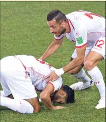
الملحق التونسي الوحيد الذي حقق فوزاً وحيداً في المونديال للعرب