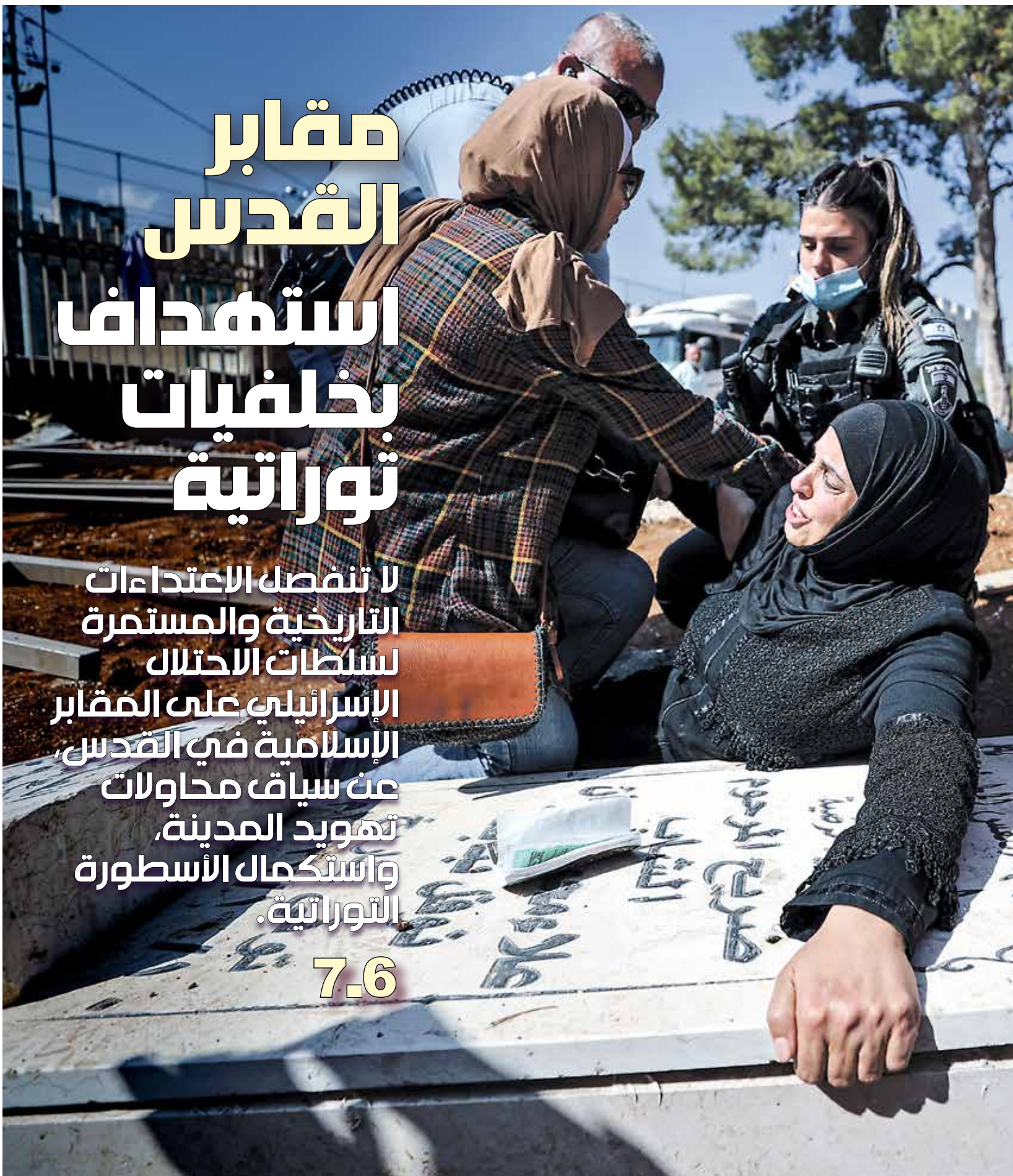
سلطات الاحتلال تستهدف مقبرة اليوسفية بتحويلها إلى حديقة عامة