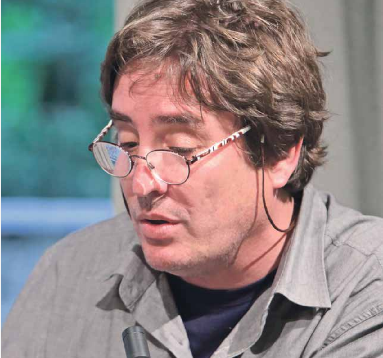
لويس غارسيا مونتيرو في برلين عام 2013