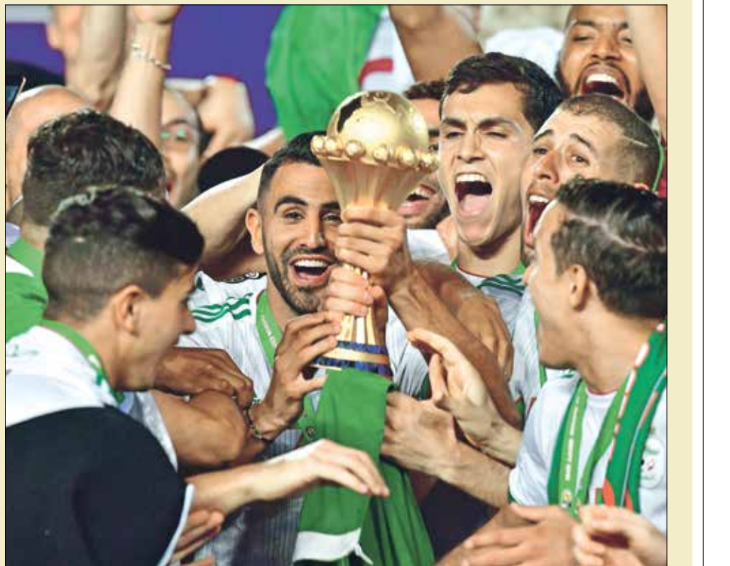
المنتخب الجزائري يحتل المرتبة الثالثة في كأس العرب