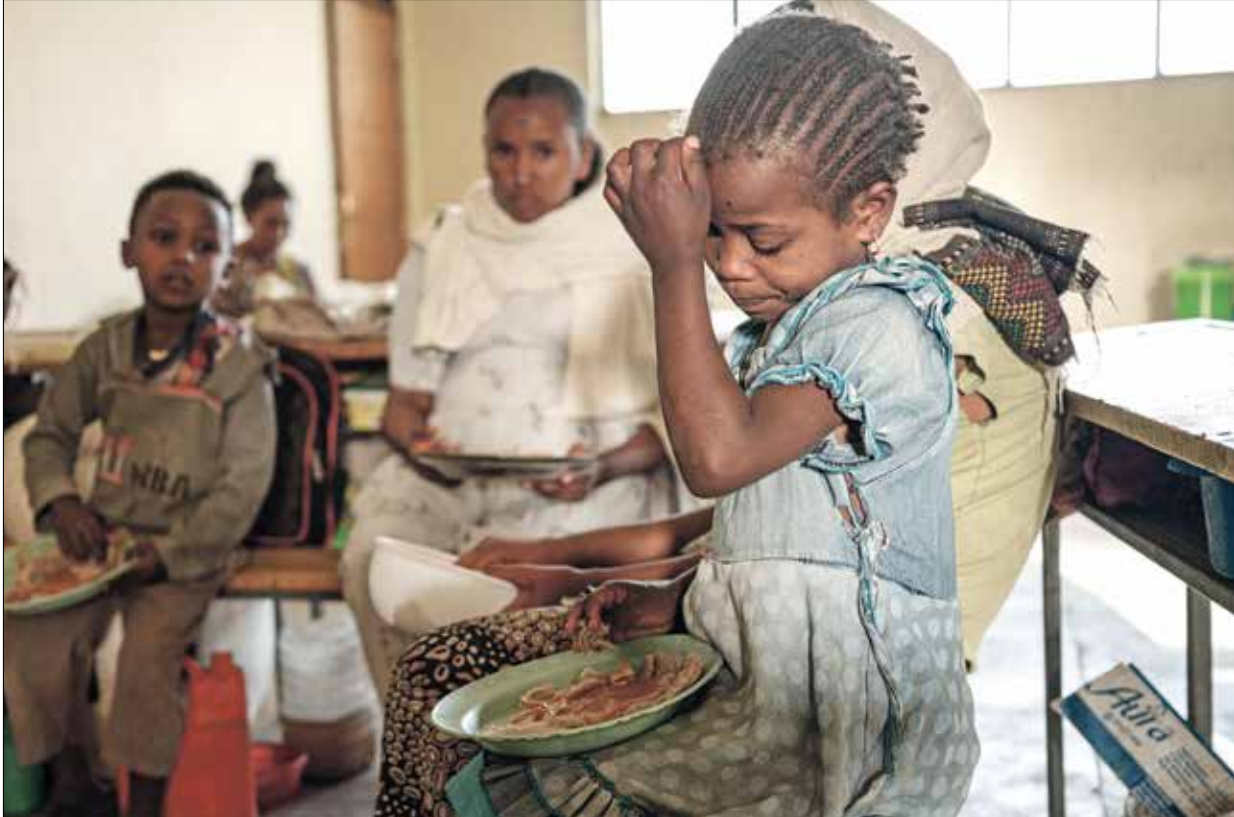
يعيش نحو 400 ألف من سكان تيغراي في ظروف مجاعة

وفي سياق متصل، حاولت السلطات الإثيوبية الدفاع عن نفسها في وجه الاتهامات باقتحام مواطنين على أساس عرقي. وقال مفتي إن «احتجاز الأشخاص لا يتم على أساس عرقي وإنما لالاشتباه في تورطهم بانشطة محظورة، وفق إجراءات تطبيق حالة الطوارئ، وحتى ما تمت عكس ذلك يتم إطلاق سراحهم على الفور». وأعلن أن اتهامات منظمات الإغاثة الدولية بشأن تفكيك حالة الاحتجاز موثقي الأمم المتحدة لا علاقة له بالمنظمة التي يعملون بها، وإذا لم يكن لدى المنظمة دليل فسبقت إطلاق سراحهم وتفت إلى أنه يتم مراعاة اتفاقية فيينا بما