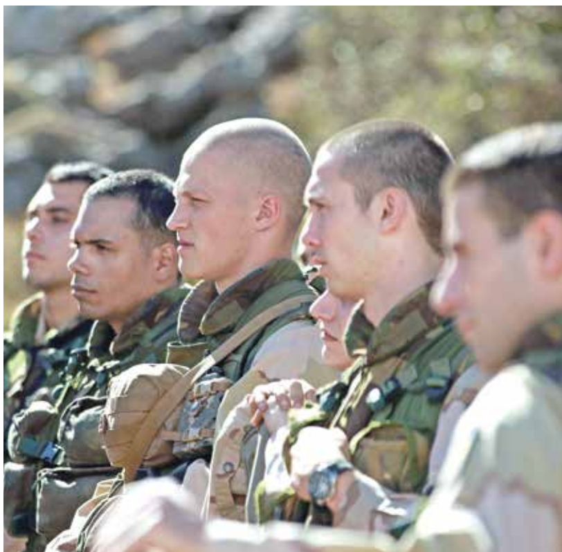
«لا تردّد» لشريف كورفر، صدمة الواقع وعلمه (الملف الصحفي)