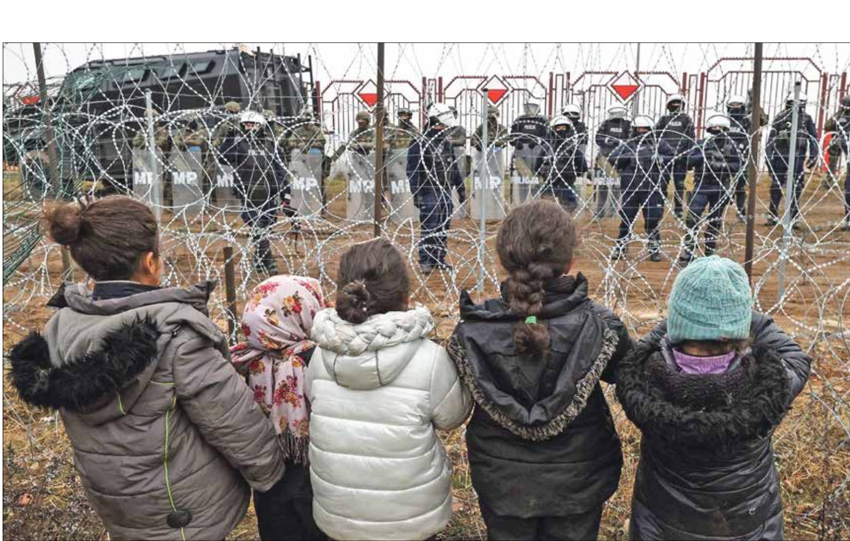
معاناة الأطناء كبيرة على الحدود البولندية البيلاروسية