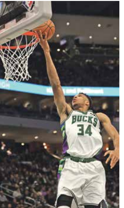
أنيتوكونمبو سجّل 47 نقطة