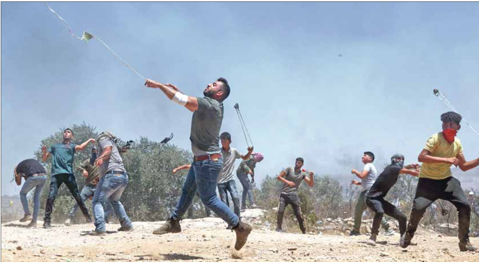
فلسطينيون يرمون بالملاع الحجارة على جنود الاحتلال في مدينة بيتا 2021/7/27

لترك الملايين من الفلسطينيين بلا غذاء ولا دواء ولا تعليب ولا خدمات أساسية، ولو توجّه الناس بهؤلاء نحو التفرّغ والعنف، لقد كان الرئيس ترامب، الذي درج على تبني مواقف حكومة نتنياهوو المنظمة لتحقيقها بلا مناقشة، قد تلقى أكثر من تنبيه من بلده، كما من القيادات اليهودية، أن من شأن التخلي عن المهمة الإنسانية التي تقدها، وكالة الغوث للاجئين الفلسطينيين، قبل الوصول إلى حل عادل لقضيتها، سيحوّل بيئاتهم إلى أرض ملأمة لتخزين مزيد من التلرّف والعنف، وحتى لتجنيد الإريائيين، ولكنه لم يابه بذلك، إذن، لا تزال إسرائيل تمسك بقوة بزمام المبادرة، نتيجة هذا الدعم الأمريكي المطلق. يخطئ من يعتقد أن إدارة بايدن، كما حال الإدارات السابقة، قد تقدم على أي قرار أو تتخذ أي موقف أو حتى تتخطى بأي تصريح يتعلق بالوضع في المنطقة بأسرها (ليس فقط بما يخص قضية فلسطين، من دون الصلوح على موافقة مسبقة من إسرائيل، لهذه الأسباب، لم تدم طويلا موجهة التفاؤل التي رافقت حمي بايدن، فالترام يابدين بالمشور الصهيوني، غير سريته السياسية، معروف، وباستثناء تصويب بعض الأخطاء الفادحة التي ارتكبتها سلفه في قضايا مختلفة أخرى، لم يقدم أي قرار أو موقف يتعارض مع مطالب إسرائيل موقافها؛ لم يكن راعبا ولم يجد نفسه مضطرا.