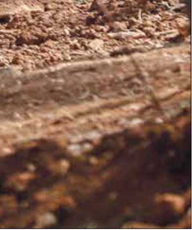
مسلوطن يصعد فيه أحد أجزاء مقبرة اليوسفية في أكتوبر الماضي

ويخشى المحفوسين من أن تؤذي هذه المخططات، من خلال الاستيلاء على جزء من المقبرة، إلى تغيير ملامح المدينة، وطمس المعالم العربي والإسلامي، كما يؤكد المفتي العام للقدس والديار الفلسطينية، الشيخ محمد حسين، إذ كان سبق ذلك تعرض