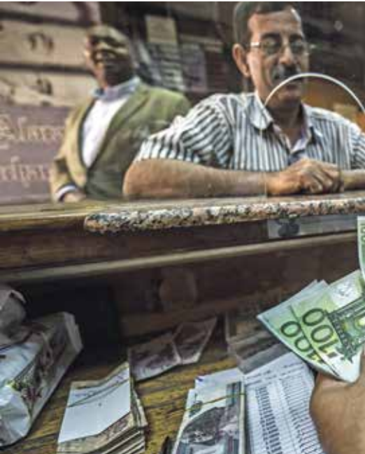
توافد يرافيع تحويلات المصريين إلى 33 مليار دولار في 2021

ولاحظت المؤسسة المالية الدولية أن تحويل المغتربين في بلدان المنطقة النامية شكّل أكبر مصدر لتدفقات الإيرادات الخارجية، متقدمة على مساعدات التنمية والاستثمار الأجنبي المباشر، وتدفقات أسهم رأس المال.