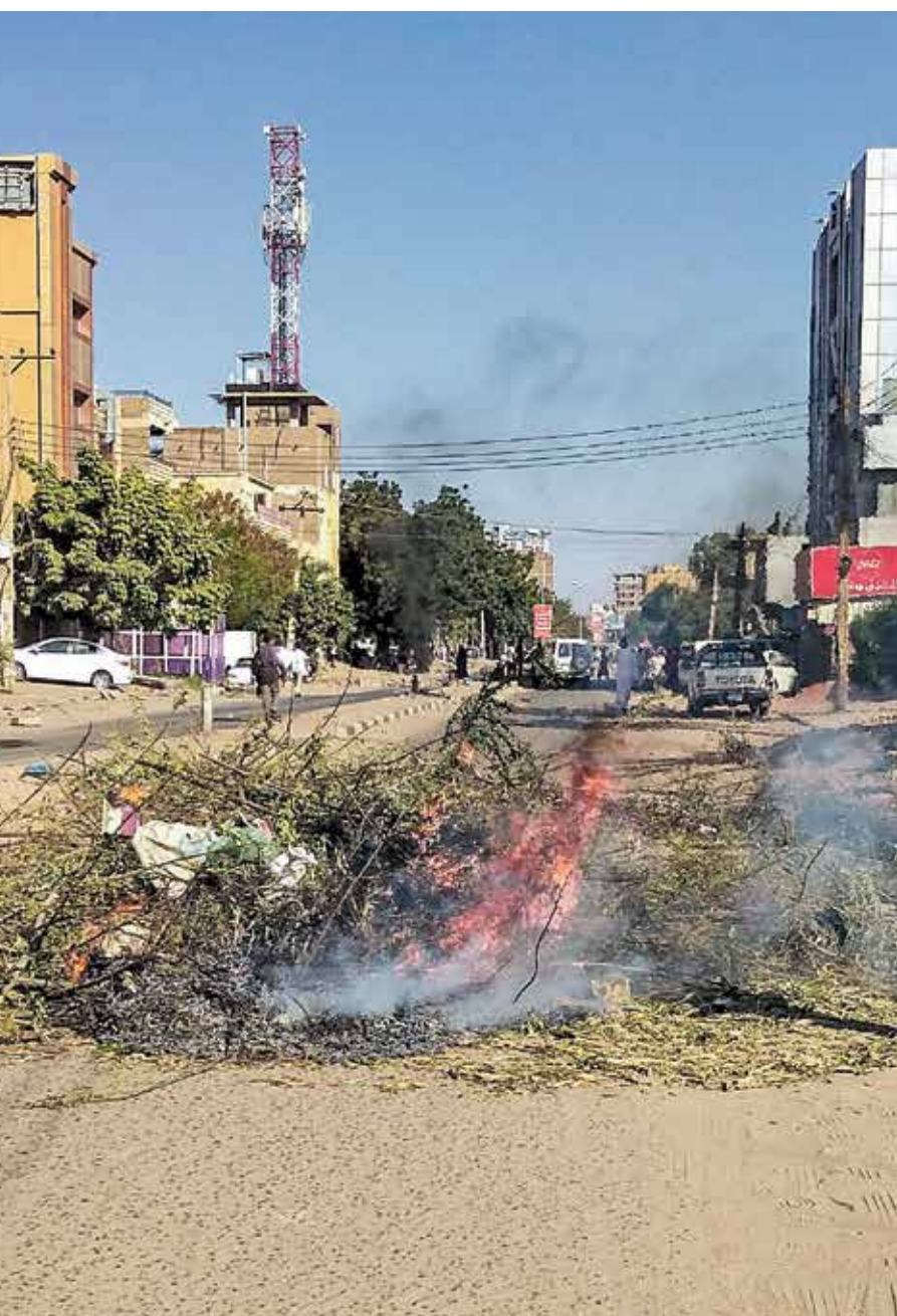
تحركات في الخرطوم بحري، امس ضد انقلابيين

في كل الأحوال يكشف مستوى التغلغل الصهيوني أنه هتف، من بين أشياء، أخرى، لتسويق أن «العربي لديه جيئات مانعة للحرة والديمقراطية»، بتسبيح الانقلاب على إرادته، ما يفضح عقوداً من أزدواجية معايير وقيم غربية.