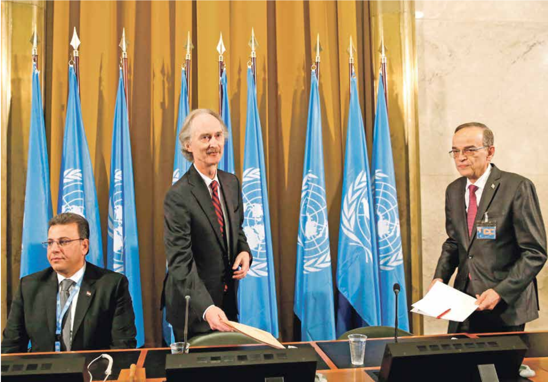
أعلن بجرست (الشفاف البعرة) والكزبري على صياغة مسودة إصلاحات دستورية

وكانت تصريحات بيدرسن أربكت الشارع السوري المعارض، حيث بدت وكأنها مخالفة لقرارات سابقة للأمم المتحدة تنص على كتابة دستور جديد تجرى على أساسه الانتخابات «حرّة ونزيهة»، إلا أن البعرة أوضح، في تصريحات أمس الاثنين، أن