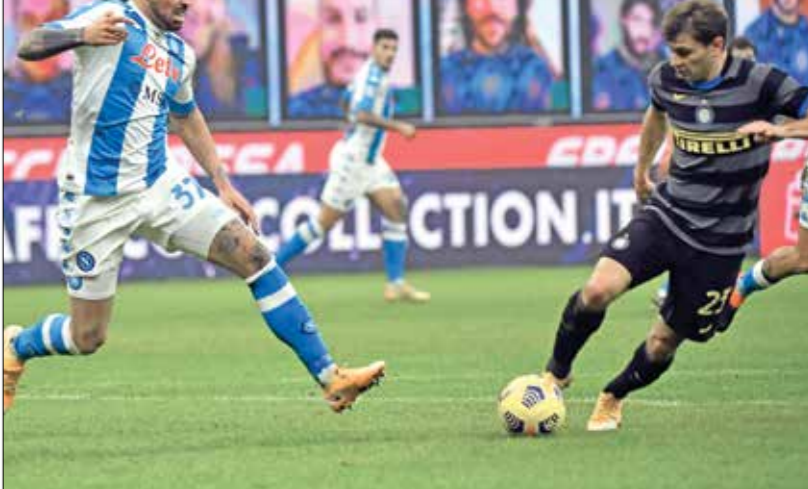
ضمة ذرية مُنظرة بين إتر ميلان ونابولي