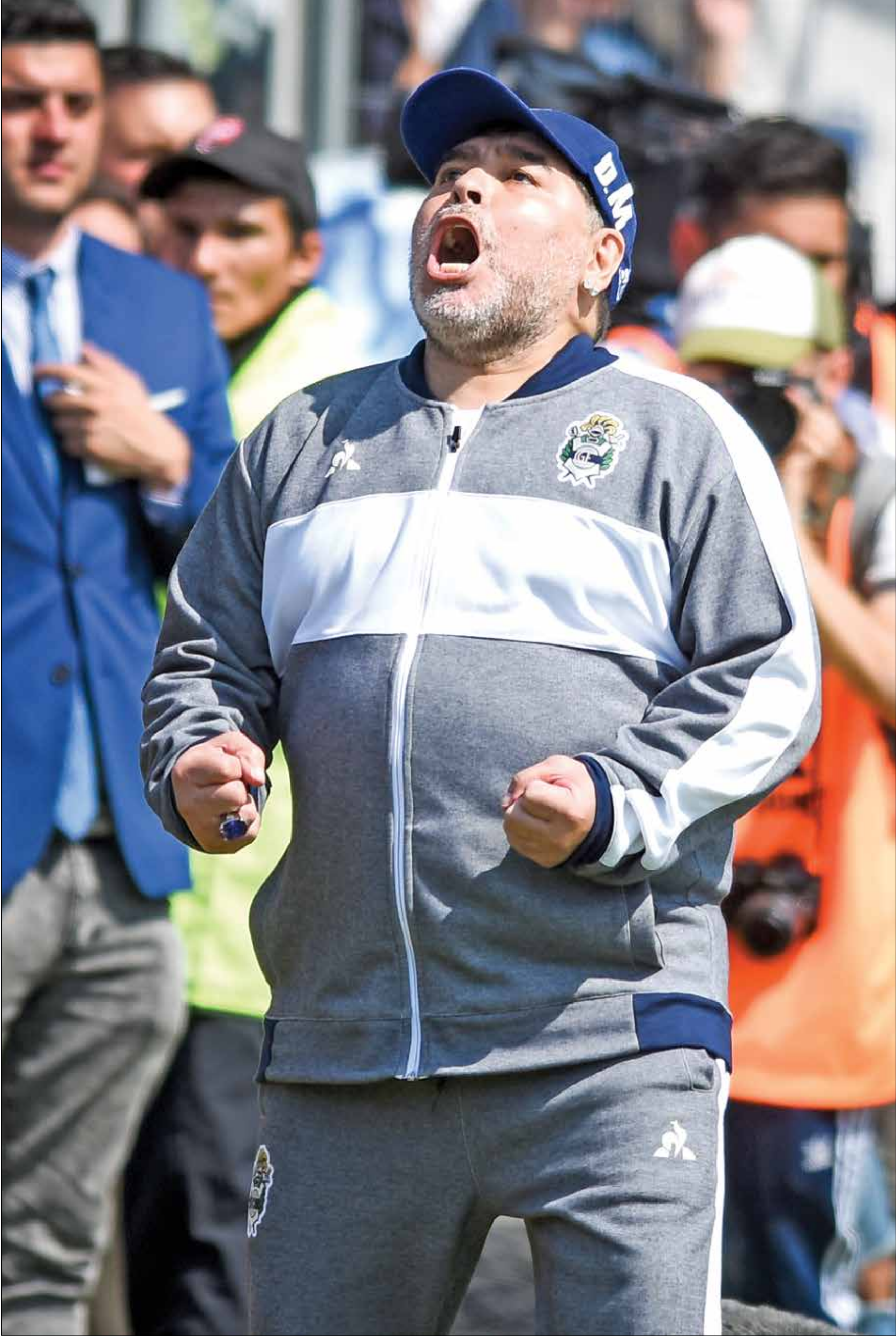
مارادونا اسطورة كرة القدم الأرجنتينية

اقترح الحارس الكولومبي السابق رينيه هيغيئا إطلاق اسم ديبغو ارماندو مارادونا على النسخة المقبلة من بطولة «كوبا اميركا»، تكريماً لاسطورة كرة القدم الأرجنتيني الراحل. وقال هيغيئا عبر المنصات الاجتماعية: «نقترب من استقبال أفضل المنتخبات في اميركا الجنوبية. تقترب كوبا اميركا التي ستضيفها كولومبيا والارجنتين، يا للروعة. يجب ان تكون تابيئا لديغو ارماندو مارادونا. كوبا اميركا ديبغو ارماندو مارادونا».