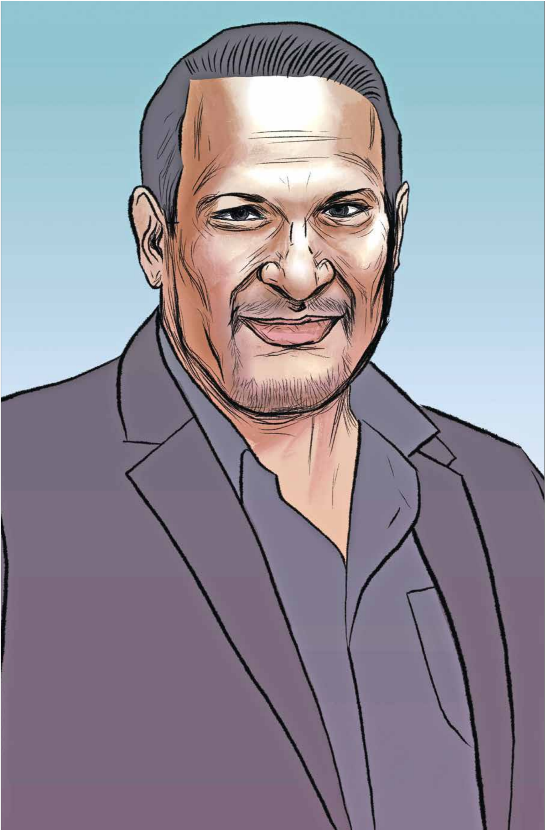
احد عمالقة حراسة المرمم في كرة العراق(أس حوض)