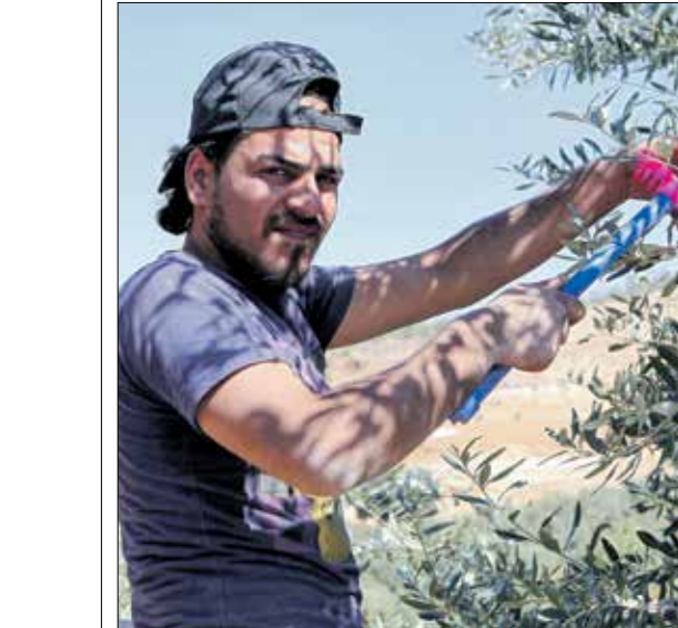
نقص المياه يهدد بتلصق الزراعات