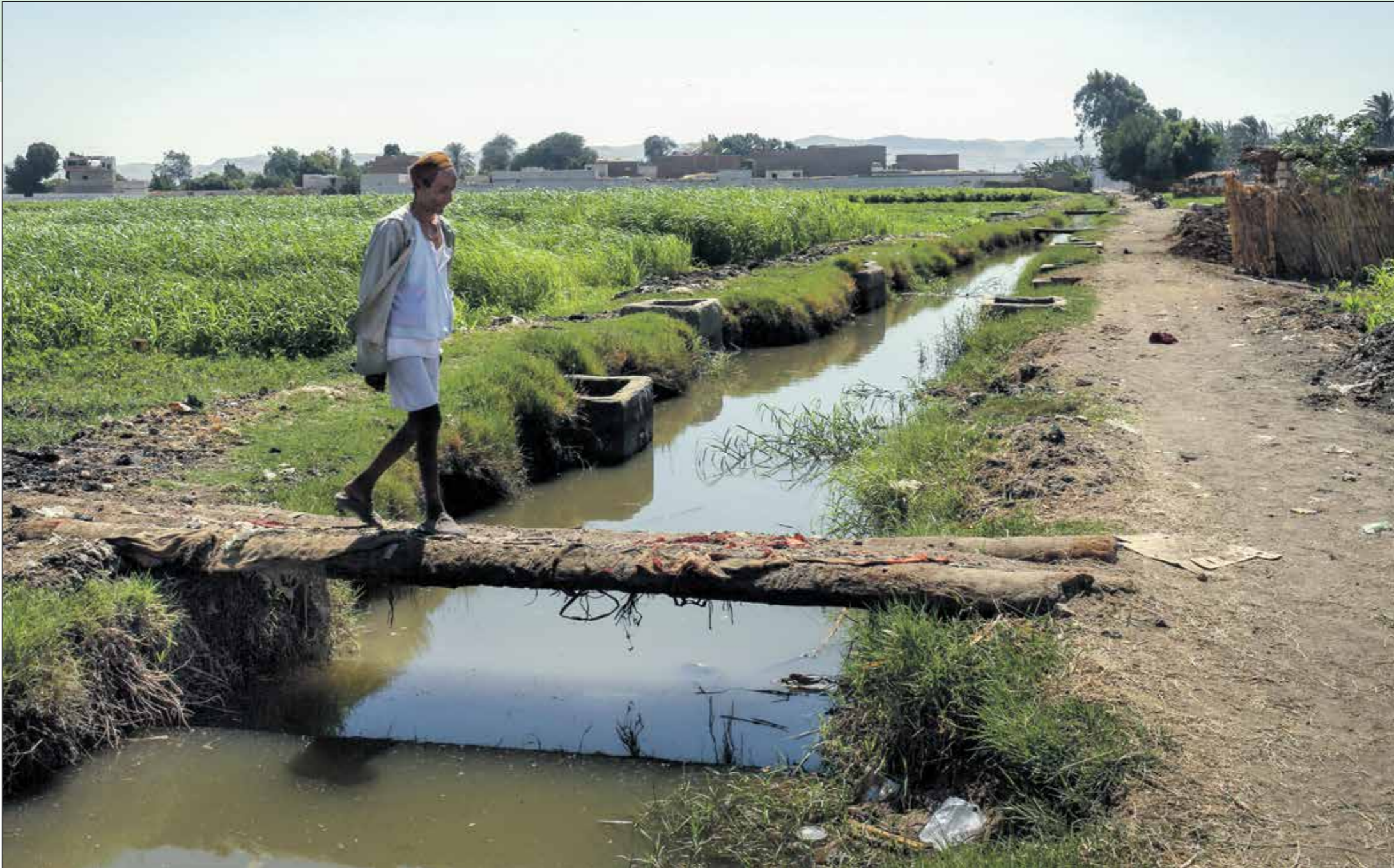
نقص المياه يهدد مساحات واسعة من الأراضي الزراعية في مصر

ومن أوائل المشاريع التي شرعت إثيوبيا في بنائها على نهر النيل الأزرق، عند مخرجه من بحيرة تانا، هو مشروع «تس أباي» لتوليد 12 ميغاطوات من الطاقة الكهربائية، ثمّ سدّ