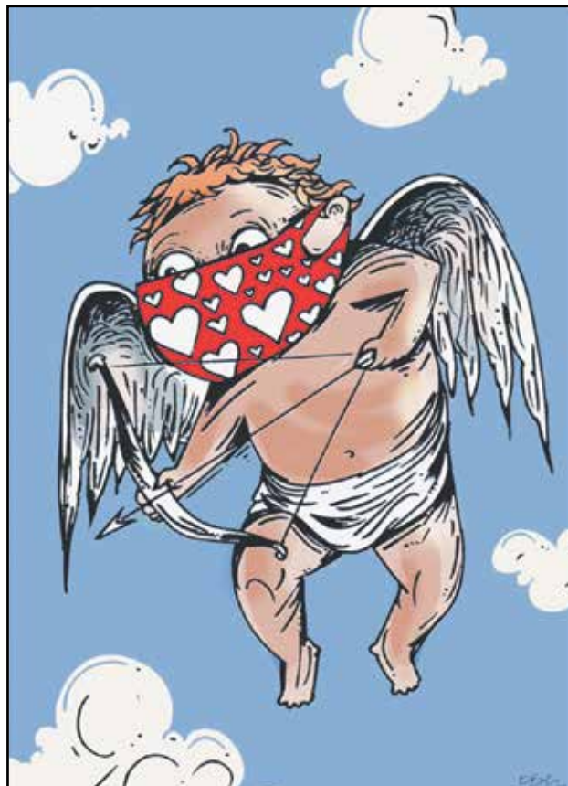
كيوييد ينشر دعوات الحب (أوغور غوريك، كار تون موفمنت)