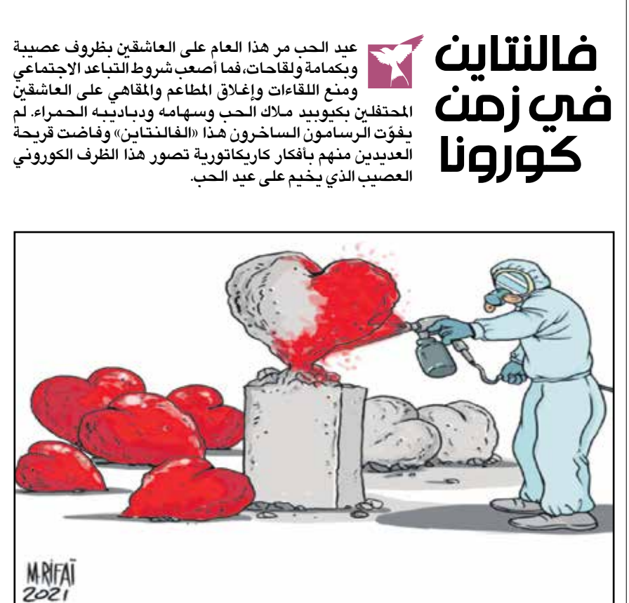
قلوب حجرية تصبغ بالأحمر يوم العيد فقط (محمود الرفاعي، كار تون موفمنت)

فالتناين في زمن كورونا عيد الحب مر هذا العام على العاشقين بظروف عصيبة وبكمامة ولقاحات، فما أصعب شروط التباعد الاجتماعي ومنع اللقاءات وإغلاق المطاعم والمقاهي على العاشقين المحتفلين بكيوييد ملاك الحب وسهامه ودبارديه الحمراء. لم يفوت الرسامون الساخرون هذا «الفالتناين» وفاضت قريحة العديدين منهم بأفكار كاريكاتورية تصور هذا الظرف الكوروني العصبية الذي يخيم على عيد الحب.