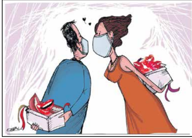
الكمامات تمنع القبلات، فلتنبادل الابتسامات (أوسفاك، كار تون موفمنت)

الجميع في القصر مرتبك، فلا أحد يجرؤ على نقل الاقتراح للزعيم بضرورة نهوضه عن كرسي العرش هنيهات لنقله بضعة أمتار بعيداً عن جدار القاعة الرئيسية في القصر، لأن الكرسي لا يتوسط القاعة. أما الزعيم الذي زاد التصاقاً بكرسيه، فقد كان منشغل الذهن بمتابعة أحداث انقلاب بورما، وأطرافه ترتعش كعادته كلما سمع عن انقلاب جديد. أنذاك يشعر كأن كرسيه يهتز تحت مؤخرته، فيزداد ضغط جسده على الكرسي كي لا يفر منه، إلى أن اتخذ قراراً ذات انقلاب حدث في جزر القمر، أنه لن يتزحزح بعد اليوم عن كرسي العرش مهما كان السبب. وسينام عليه أيضاً، وهو القرار الذي أثار تساؤلات المحيطين به عن كيفية ممارسة نشاطاته الرئاسية، حتى ولو كانت صورية، لكن الزعيم كان يحرص عليها لتلميع صورته. بالطبع، جاء الحل من «صاحب الكرسي»، عندما قيل له مرة بأن برنامج اليوم يتضمن افتتاح أحد «أكبر المشاريع الضخمة» التي أمر ببنائها الزعيم منذ سنوات وانتهى العمل فيها مؤخرًا. وكان المشروع عبارة عن «مركز عمومي» في وسط العاصمة. عندها قال الزعيم: «الأمر هين.. أحضروا المرحاض إلي لافتحه هنا». أنذاك فهم المحيطون الرسالة، وفجأها أن الزعيم لن يترك كرسيه أبداً، ولا حتى لضرورات نقل الكرسي بعيداً عن هذا الجدار. أما الحل فجاء من أذكاهم: «لا بأس.. لننقل الجدار بعيداً عن الكرسي».