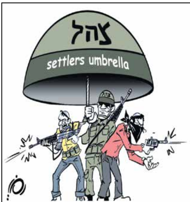
اجرام المستوطنين (رمزي الطويل، فيسوك)