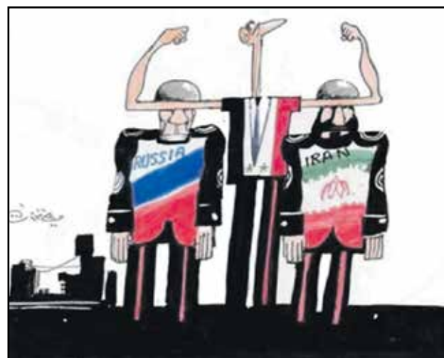
استقواء النظام السوري (علي فرزات، فيسوك)