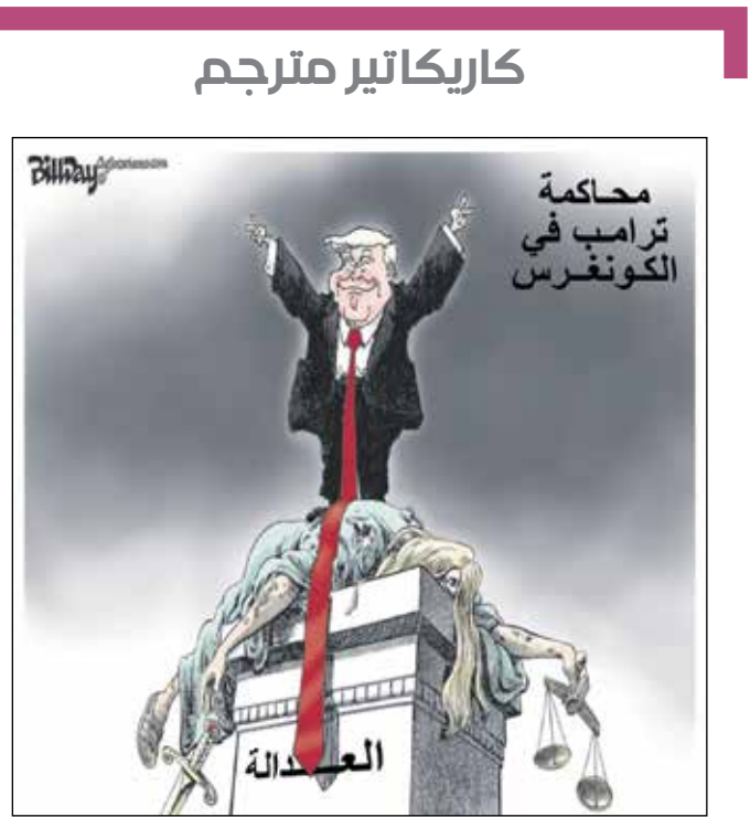
بيك داي، كيغل كار تونز