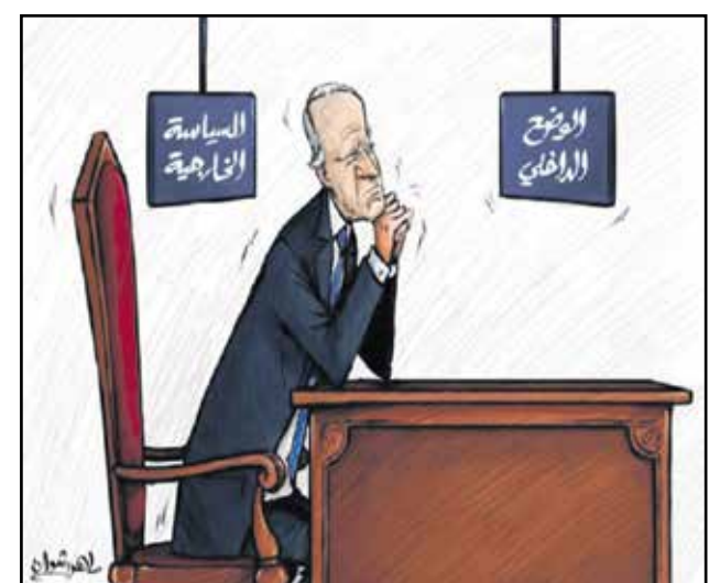
جو بايدن لا يكثر بالسياسة الخارجية