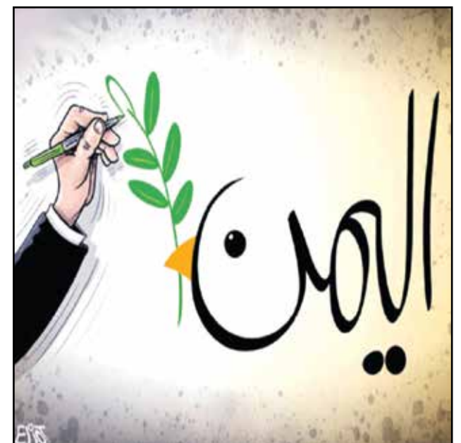
خطط السلام في اليمن