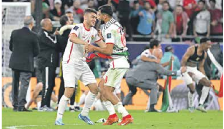
وصق منتخب الأردن الى اهالي كأس اسيا 2023

مع الفريق، ويسعى إلى ان يخفي الموسم بانتخوب بلقب كأس الأردن، بعد فقدان أفرصه في المنافسة على لقب الدوري المحلي، وأضاف في هذا الصدد: «اللاعبون راضوا بالتنوع بلقب كأس الأردن هدفهم الأساسي لإقناع الموسم، بعد جماهير الفريق بتقديم كل ما لدينا لتحقيق الهدف المنشود خصوصاً أن جماهير الأخضر منحتني ثقة كبيرة جعلتني أسمى لأن أتوج هذه الثقة بلقب، خاصة أن جماهير الوحدات متعشقة لآلغاب»، وعن مستقبله قال إنه يرفض النظر على العروض التي تصل إليه حالياً، ويريد ان يتركز مع فريقه الحالي ومع نهاية