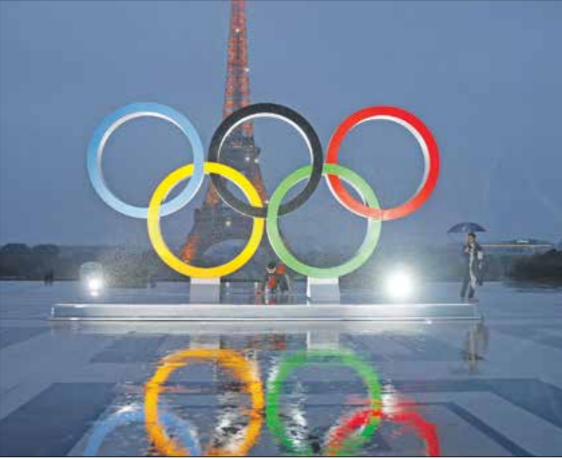
اولمبياد باريس ستشهد مشاركة كبيرة من اغلب دول العالم (Getty)

وقبل أيام قليلة، وصلت الشغلة الأولمبية على متن السفينة بليمج ذات الصواري الثلاثة، إلى سواحل مرسيليا، حيث كان بانتظارها 150 ألف متفرج، وذلك بعد مرور مائة عام على دورة الألعاب الأولمبية الصيفية الأخيرة في فرنسا. وقيل حفل افتتاح أولمبياد باريس 2024 المغزوة في 26 يوليو/ تموز (ستتم الأولمبياد حتى 11 أغسطس/اب)، وصلت السفينة «بليمج» قبالة سواحل ثاني أكبر مدينة في فرنسا على وقع استقبال أسطوري، بعدما بدأ العرض البحري الكبير الذي إرفقه هذا قارب وبحضور الرئيس الفرنسي إيمانويل ماكرون، جرى استقبال السفينة بعرض استثنائي للألعاب النارية من «قصاصات الورق أمعاد تدويرها القابلة للتخلل»، وموسيقى أوركسترا مرسيليا الفيلهارمونية، ولافتات تشجعي نادي أولمبيك مرسيليا فريق كرة القدم الرمزي للمدينة، مع عرض بالمطارات. (فرانس برس)