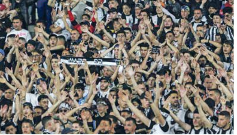
سطيف احقق بالعودة في لقاء الالبان