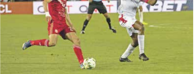
الوداد سجوخن النهائي على أرضه (حالك المرشاحي) (التواصل)

ابطال افريقيا بعد نهائي 2017 الشهير الذي اقيم وقتها من مباراتي ذهاب واياب، وحسمه وقتها الوداد (1-2) في المباراتين، وتوج بطلا: واهم ما يميز نجاح الاهلي والوداد في التأهل إلى المباراة النهائية،