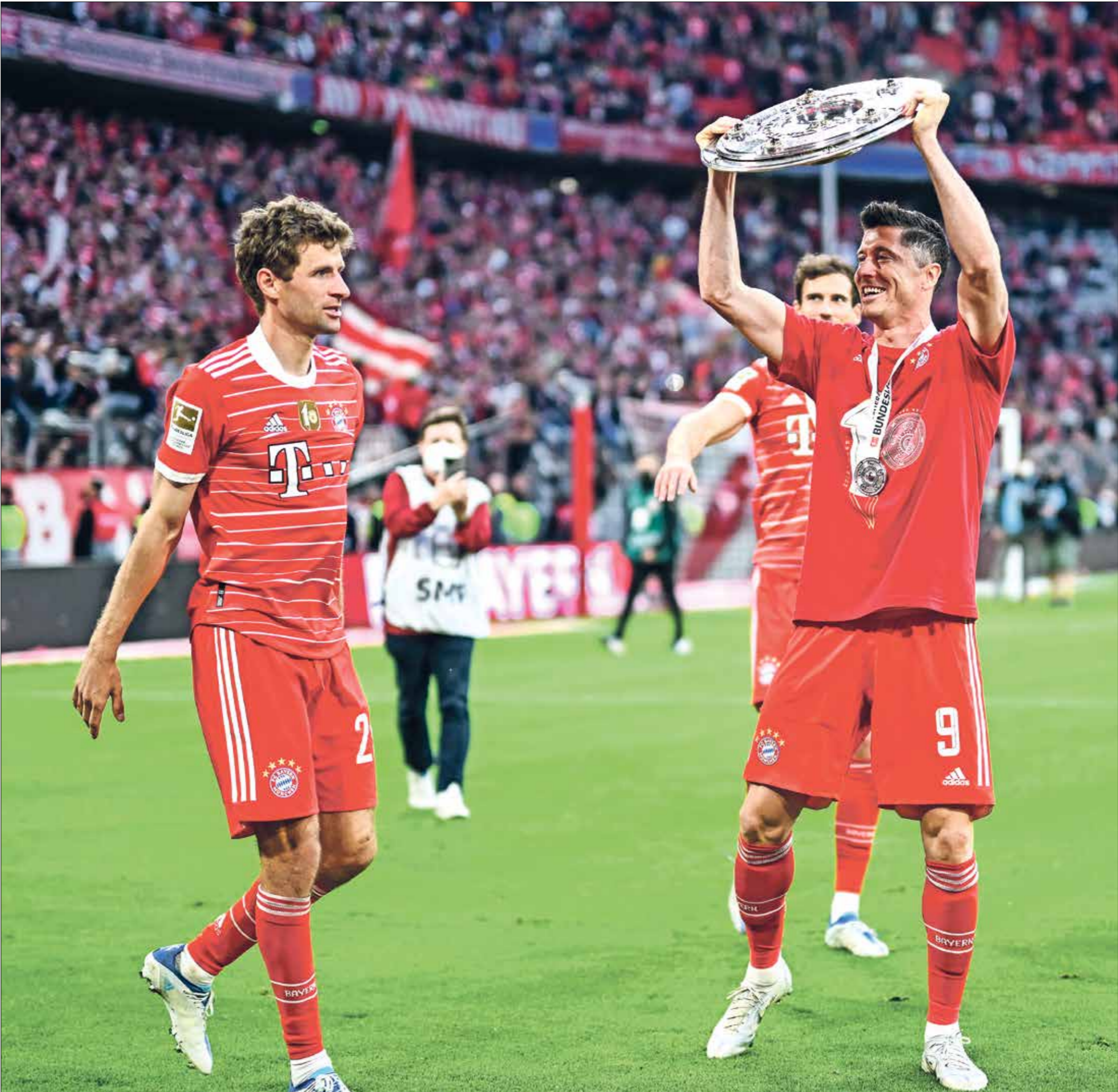
دوج بيغون(اليمين) وجاهمير بايرن ميونخ(اليسار)

صراع الهبوط، الذي شهد نجاة نادي شتوتغارت في اللحظات الأخيرة من مسجّل 3 أهداف في شبك إينتراخت فرانكفورت وهيرتا برلين وأوغسبورغ، كما صنع 5 أهداف في مواجهات هوفنهايم وبوروسيا مونشنغلايباخ، وفولفسبورغ وأوغسبورغ وبايرن ميونخ، فيما هبط أرمينيا بيلفيلد إلى الدرجة الثانية، عقب تعادله مع لايبزيغ (1-1). ليرافق غروين فورث، في حين ستكون على هيرتا برلين خوض ملحق الصعود والهبوط، عقب خسارته (1-2) على يد بوروسيا دورتموند.