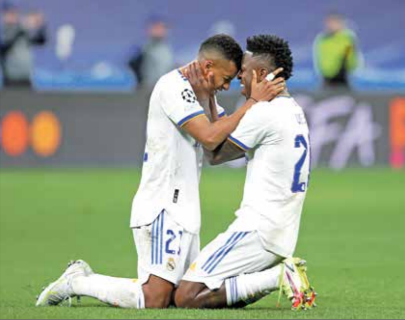
فينيسيوس وودريغو مع نجوم فريق ريال مدريد

وانضم فالغيريدي وورودريغو وفينيسيوس إلى فريق ريال مدريد الريدف للتحاقم خندريجيا، في ناد يشترط متطلباً على قصوى على «طريقة كاسميريو»، إذ انضم القائد البرازيلي إلى فريق الريدف، في خطوة سابقة للانضمام إلى الفريق الأول، عقب اعارته في بورتو البرتغالي مع المدرب جوليان لوبيتيجي، ويُعد انضم المبرك للمواهب الشابة، والملاعب الجديد، والأداء الرياضي الجدد، مع التنوع بلقب الدوري، بجانب التأهل إلى نهائي دوري ابطال أوروبا، إنجازات ريال مدريد للبقاء في القمة، وستكون هذه الأسماء الشابة مصدر قوة النادي الملكي في النهائي الكبير ضد فريق ليفربول، والذين من الممكن أن يُساهموا في التنوع باللقب المحقق في الموسم، خصوصاً أن الثاني فينيسيوس رقم 14، خصوصاً أن الثاني فينيسيوس جونيور وورديغو تقدمنا عرضاً هجومية أكثر من رائعة، وانتما مع المدرب الإيطالي كارلو أنشيلوتي، أنهما على قدر من المسؤولية على أرض الملعب، بأدقهما وصناعهما للأهداف على الصعيد المحلي والأوروبي.