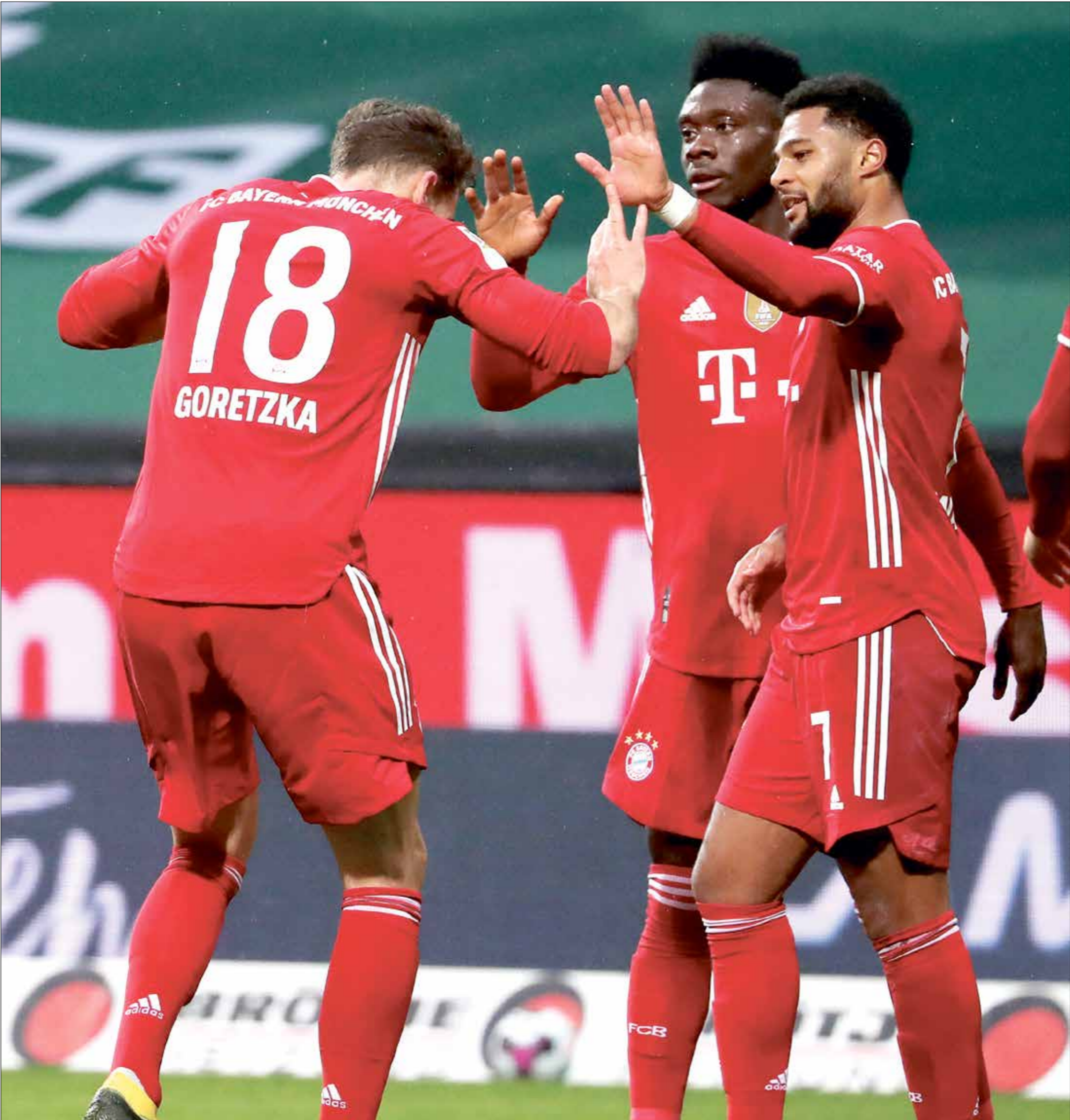
بايرن ميونخ يتنافس على لقب الدوري والكأس مفتط

لكن فوز كان وصالح حمديتش بلقب دوري الأبطال عام 2001 حين كانا لاعبين لا يعني بالضرورة أن كان سيأخذ صف صالح حمديتش في صدامه الحالي مع فليك، بل أن الكثيرين يعتقدون أن كان ربما يلعب دور الوسيط، ما يعني أن