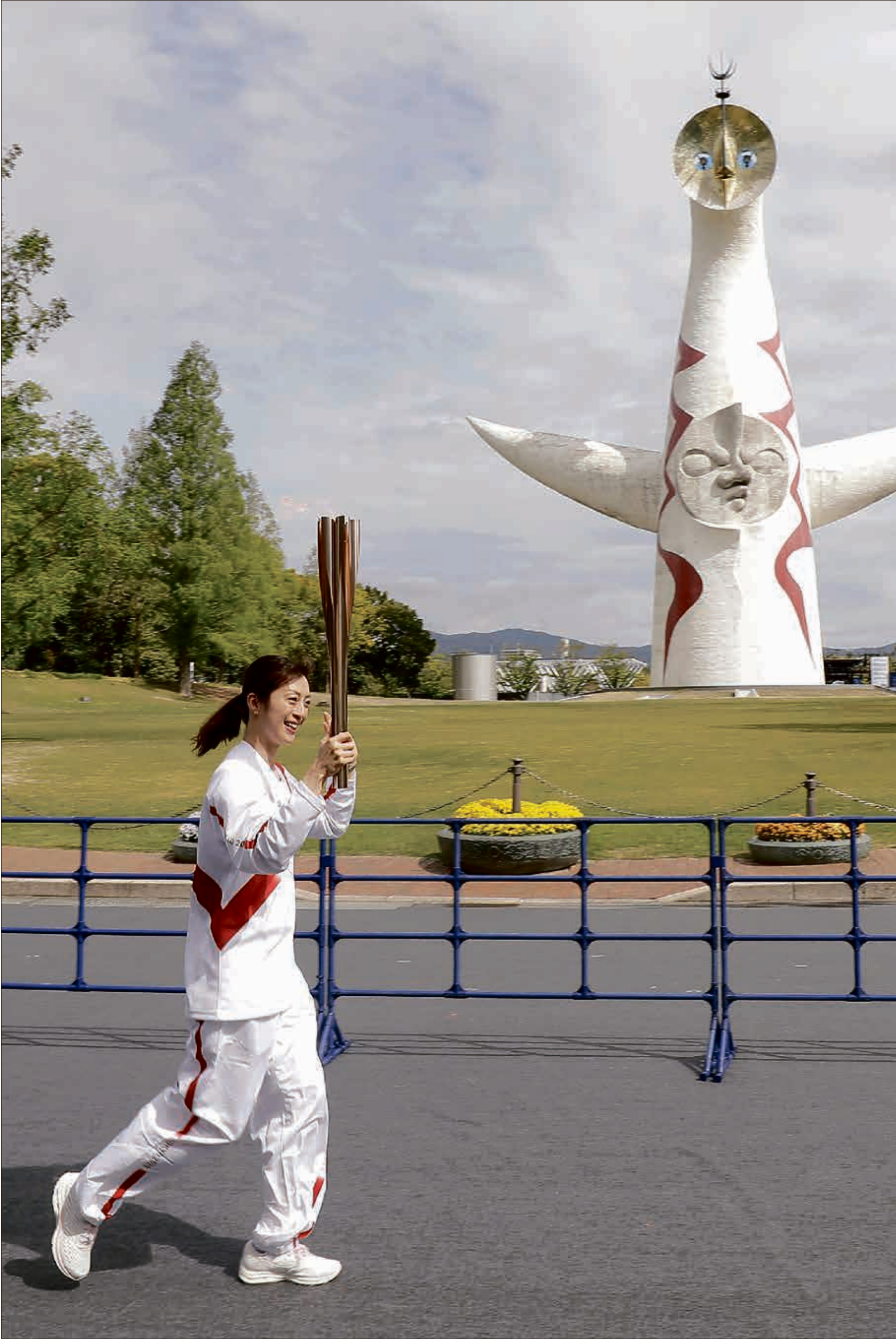
فيروس «كورونا» ما زال يُهدد إقامة الأولمبياد

أكد الأمين العام للحزب الحاكم في اليابان توشيرو نيكاي أن إلغاء دورة الألعاب الأولمبية طوكيو 2020، المقررة هذا الصيف، يُعد أحد الخيارات المطروحة في حال استمرار تدهور وضع وباء فيروس كورونا. وقال نيكاي، في مقابلة مع محطة «تي بي إس» اليابانية: «إذا أنت اللحظة التي لا يمكن فيها فعل المزيد لاحتواء فيروس كورونا، فيجب إلغاء الأولمبياد. إذا انتشر الوباء بسبب الأولمبياد فماذا ستكون فائدته؟».