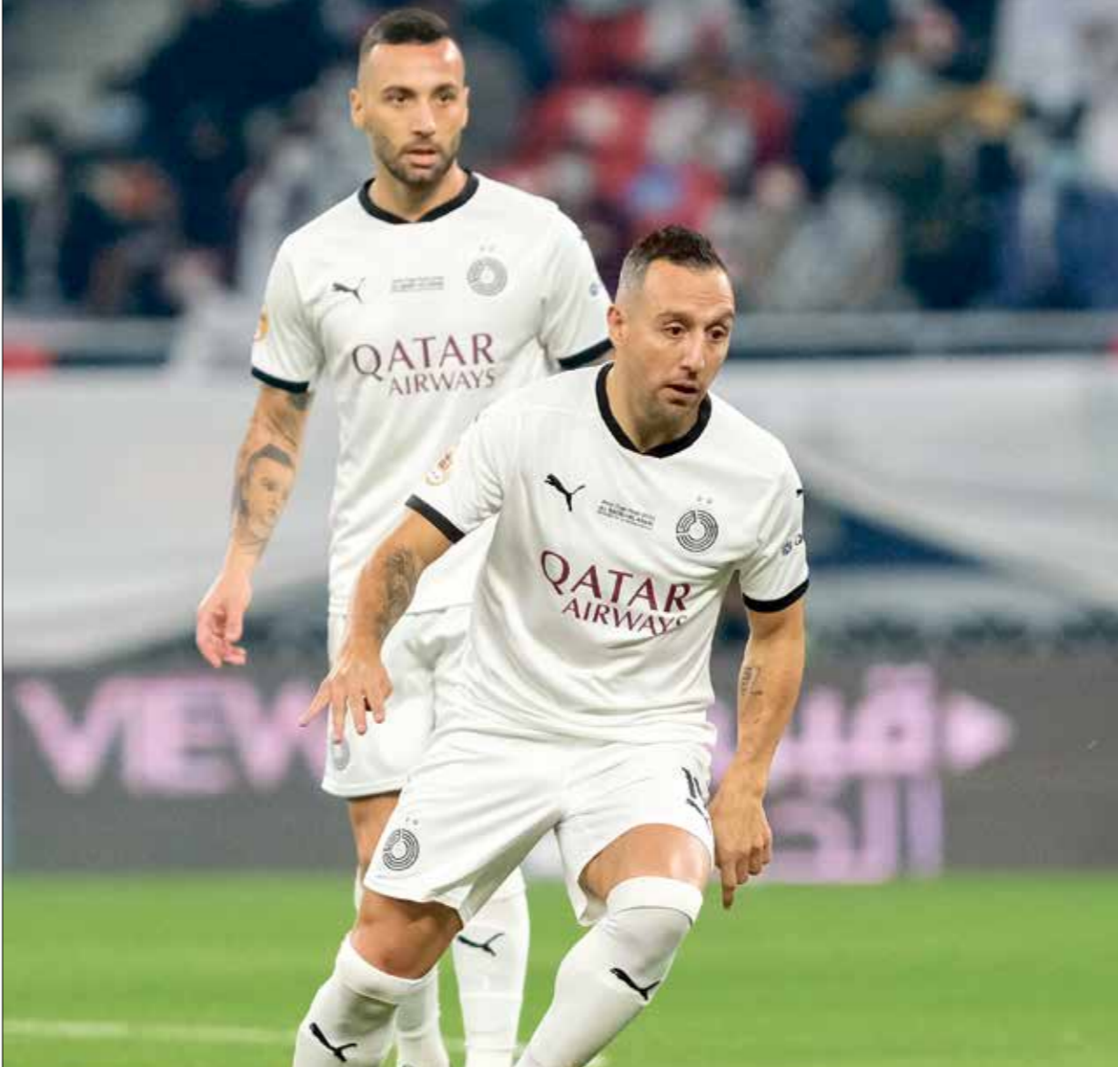
السد يستواجه النصر السعودي في الجولة القادمة

وشهدت المباراة الثانية ضمن ذات المجموعة، أيضاً تعادل الوحدات الأردني مع النصر السعودي 0-0 على استاد جامعة الملك سعود، ليخسر السد وفولاد ترتيب