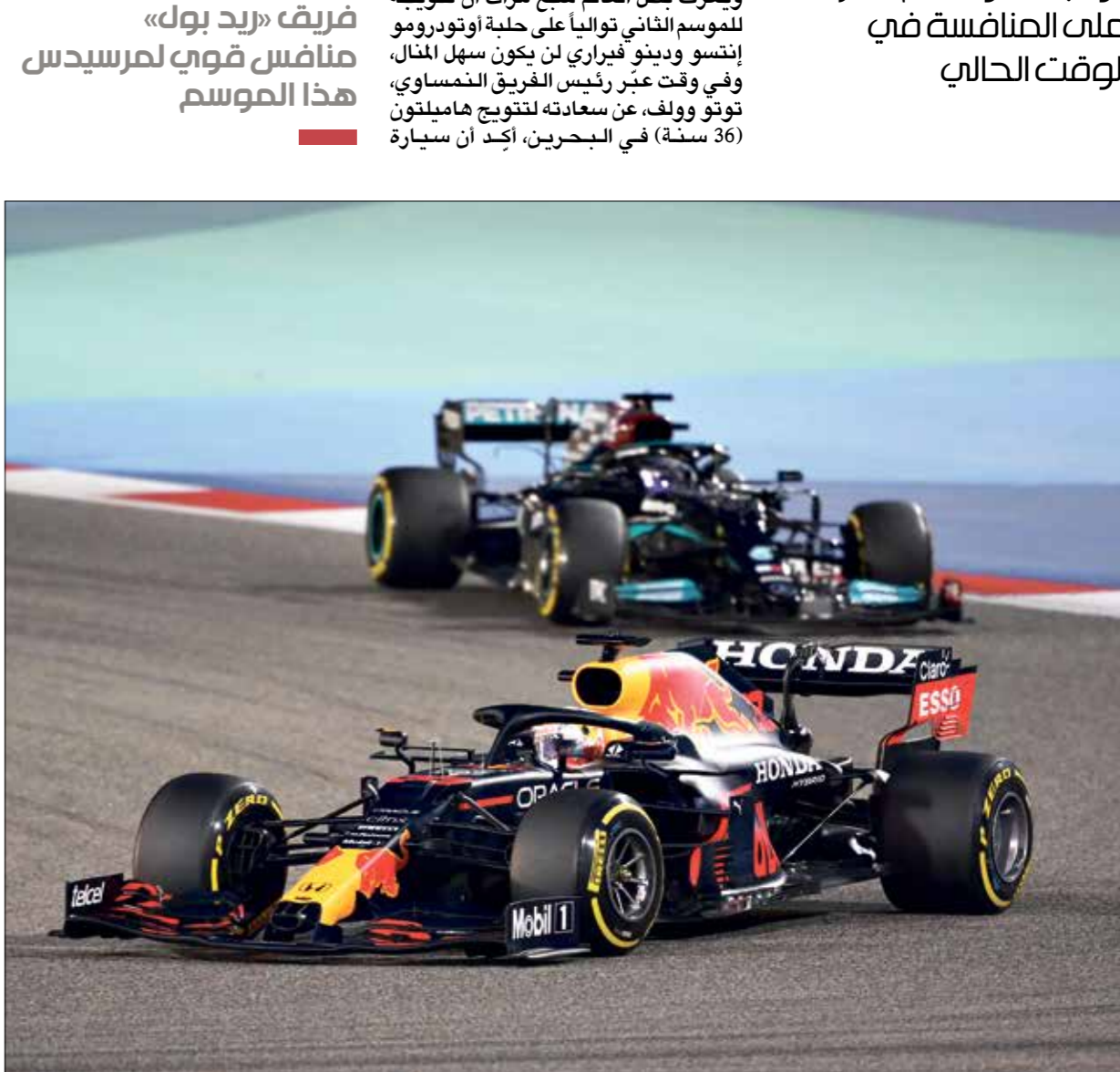
منافسة قوية بين «مرسيدس» و«ريد بول» هذا الموسم

وتعرّف بطل العالم سبع مرات أن تتوجّه للموسم الثاني تواليا على حلبة أوتودرومو إنشو وديدو فيراري لن يكون سهل المجال، وفي وقت عبّر رئيس الفريق النمساوي، توتو وولف، عن سعادته لتتوجّج هاملتون (36 سنة) في البحرين، أبداً أن سيارة