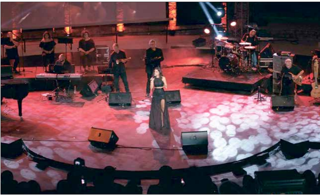
من فعاليات مهرجان قرطاج 2018 (الرشيد)

في تونس، لكن انتشار فيروس كورونا بشكل كبير في دول المغرب العربي، ومنها تونس، يبدو أنه سيؤخر عملية الإقرار و البت بإقامة المهرجان في مورتة الساسة والخمسين. معلوماً هو انتشار فيروس كورونا في عدة مدن أردنية.