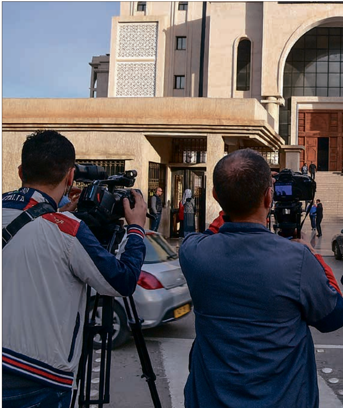
يشغل الصحافيون بهموم المواطنين