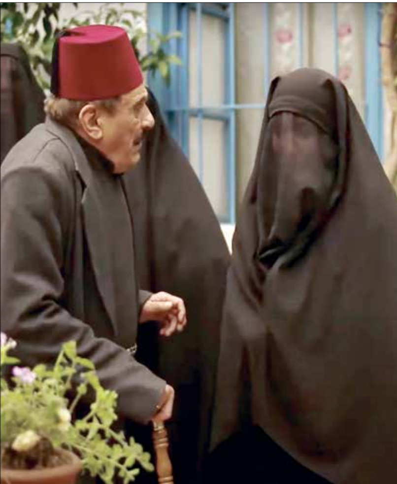
انسحب مسلسل البيئة الشامية «بروكار» من الموسم لهذا العام

رغم أن إنتاج المسلسلات السورية لم يعد مرتبطا بشهر رمضان، كما كان الحال من قبل، وأن العديد من المسلسلات السورية والمشاركة باتت تنتج اليوم بغرض العرض على المنصات الرقمية، خارج الموسم الرمضاني إلا أن شهر رمضان لم يفقد قيمته كسوق للدراما السورية والعربية، وقد أنتج هذا العام عدد كبير من المسلسلات السورية المشتركة، بغرض العرض في رمضان؛ لكن خسرت الدراما السورية نلث إنتاجها قبل أن يبدأ هذا الشهر، حيث انسحب عدد من المسلسلات سورية من السباق ■ ستونو بعدما نشر لمثل والكاكتب السوري ياسر العظمة برومو مسلسل «سنونو» عبر صفحته الشخصية، عاد ليعلن أن العمل سيخرج من السباق الرمضاني، معللاً السبب بأن العمليات الفنية استغرقت وقتاً أكثر من المتوقع. وبذلك، يكون الموسم الرمضاني قد فقد واحداً من أكثر المسلسلات المختظرة، حتى وإن كان البرومو لم يشتر بعمل جيد. يُشار إلى أن الممثل ياسر العظمة قد سبق له الإعلان خلال الأوام الماضية عن نيته المستمرة بالعودة إلى شاشات التلفزيون المنوعة؛ لكن الغياب بعد السنة يبدو أكثر غرابة بعد أن نشر برومو المسلسل ■ مقابلة مع السيد أدم 2: عُرض الجزء الأول من مسلسل «مقابلة مع السيد أدم» رمضان الماضي، وكان من المقرر أن يُعرض