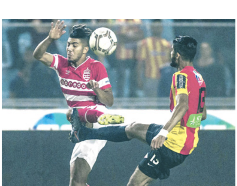
مواجهات الحربي تلعب بالرارة كبيرة احياءالندس

وأثار مباراة القمة التونسية قبل بدايتها جدلا واسعا، بعدما طالب الترجي وزارة الداخلية بالموافقة على لعب المباراة ليلا حسب تجربتها، ورفضت أغلب الأندية اللعب في