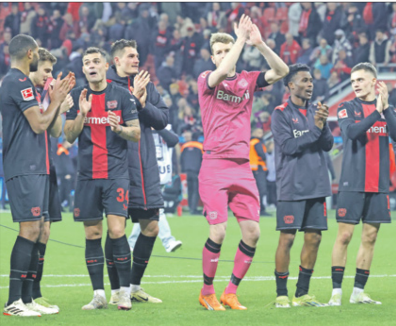
ليفركوزن يسهل مواصلة الصدارة في ألمانيا

يامل شوتونغارت تثبت قدميه في المركز الثالث عندما يحل صغفا على هوفنهايم السابع السبت. ويتفوق شوتونغارت بفارق ست نقاط عن بوروسيا دورتموند الرابع الذي يدخل الفريق الأصفر والأسود باندهاف كبير بعد تناهله إلى ربع نهائي دوري الإبطال على حساب ايندهوفن الهولندي بفوزه عليه إيابا 0-2.