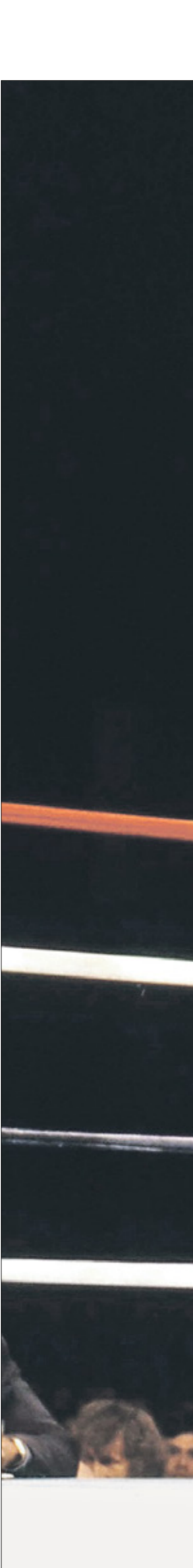
اخبر محمد علي كاضح ملكم في لايح الونز

ويستعد لمواجهة جيك بول في أول نزال رسمي لأسطورة الملاكمة بعد قرار اعتزاله عام 2005. وحقق مايك تايسون 44 انتصاراً من أصل 50 بالضربة القاضية خلال مسيرته الاحترافية، وسيأمل أن ينجح في تكرار نفس السيناريو في الصيف المقبل في أول نزال له بعد 19 سنة داخل الحلبة.