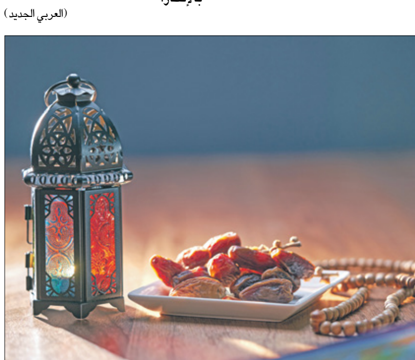
يحصه الجسم على فوائد الصيام حيث يكون صياماً صحيحاً منضبطاً

يمكن أن يوفر الصيام العديد من الفوائد الصحية، والتي تشمل: - المساعدة في إنقاص الوزن عن طريق تقليل