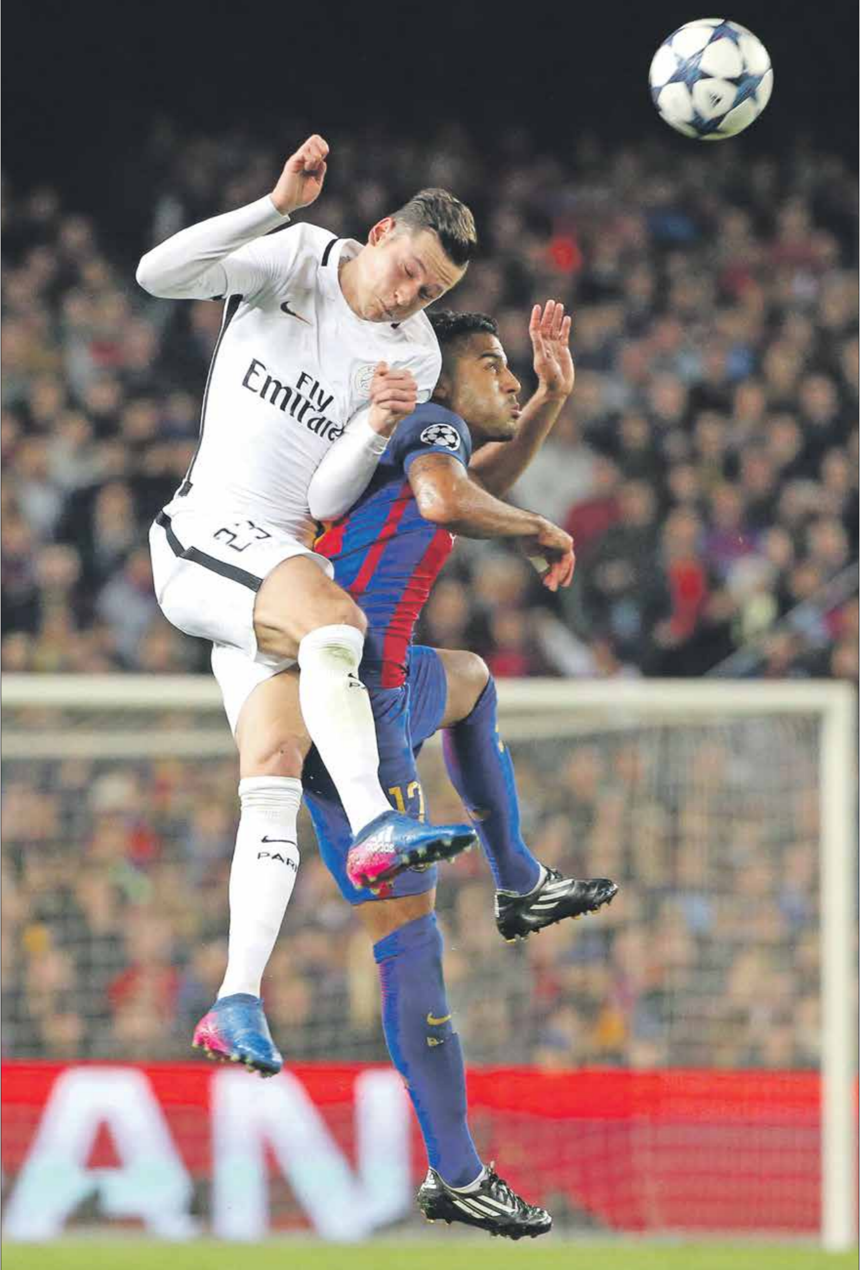
مت مواجهة برشلونة وباريس سان جيرمان في عام 2017

وسيحاول المدرب يورغن كلوب، خطف الانتصار بهدفين أو أكثر من مواجهة الذهاب، وذلك قبل خوض مباراة الإياب على ملعب «أنفيلد» الشهر القادم، وفي حال حقق ليفربول الفوز ذهاباً سيُقدم بخطوة كبيرة نحو التأهل إلى الدور ربع النهائي في البطولة الأوروبية في المقابل لن يكون فريق لايبزيغ منافساً سهلاً للليفربول، خصوصاً أن مدربه ناينغزمان هو واحد من أفضل المدربين في عالم كرة القدم حالياً، والذي يُقدم كرة قدم جميلة وسريعة ويكثفه إسقاط أي منافس مهما كان حجمه. والجميع يعرف المستوى الرائع الذي قدمه فريق لايبزيغ في الموسم الماضي ووصل بعيداً في دوري أبطال أوروبا، ويمك الفريق الألماني عناصر قوية على الصعيد الفني والذهني. كما يملك لاعوه مهارات مميزة على الكرة، تجعلهم قادرين على تهديد مرمي أي منافس. فهل يخرج فريق ليفربول الإنكليزي في تحدي منافسه الألماني الصعب في مباراة الذهاب، أم أن المدرب الألماني يورغن كلوب سيدخل في أزمة حقيقية معقدة هذه المرة في دوري أبطال أوروبا.