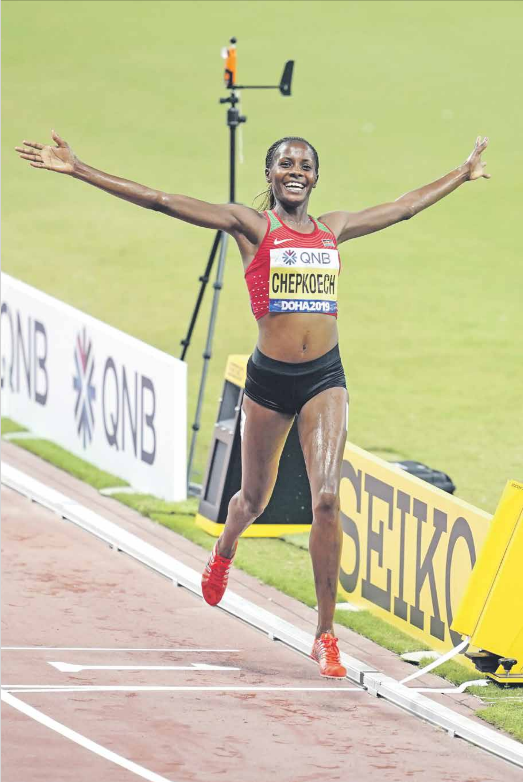
انجاز جديد للعداءة الكينية

حطمت العداءة الكينية بياتريس تشيبكويتش الرقم القياسي العالمي لسباق خمسة آلاف متر بعد ان قطعت المسافة في زمن بلغ 14 دقيقة و43 ثانية في موناكو وتتفوق على الرقم القياسي السابق بفارق ثانية كاملة. وتحمل تشيبكويتش (29 عاماً) أيضاً الرقم القياسي لسباق ثلاثة آلاف متر وحققت إنجازها الجديد في أجواء عاصفة. وقالت العداءة الفائزة: «بعد السباق: أنا سعيدة. أنا سعيدة تماماً بهذا الرقم القياسي العالمي».