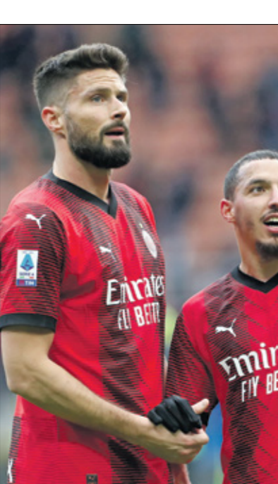
ميلان اللنادي الإيطاليي الصريف

«قرض البائع» لظاهرة الأميركي، وهو نشاط شائع في معاملات الأسهم الخاصة تسمح للبائع بفتح المشتري قرضا على جزء من سعر الشراء. بمبلغ 50 مليون يورو بغائدة 7 في المائة. وينص هذا القرض، الذي