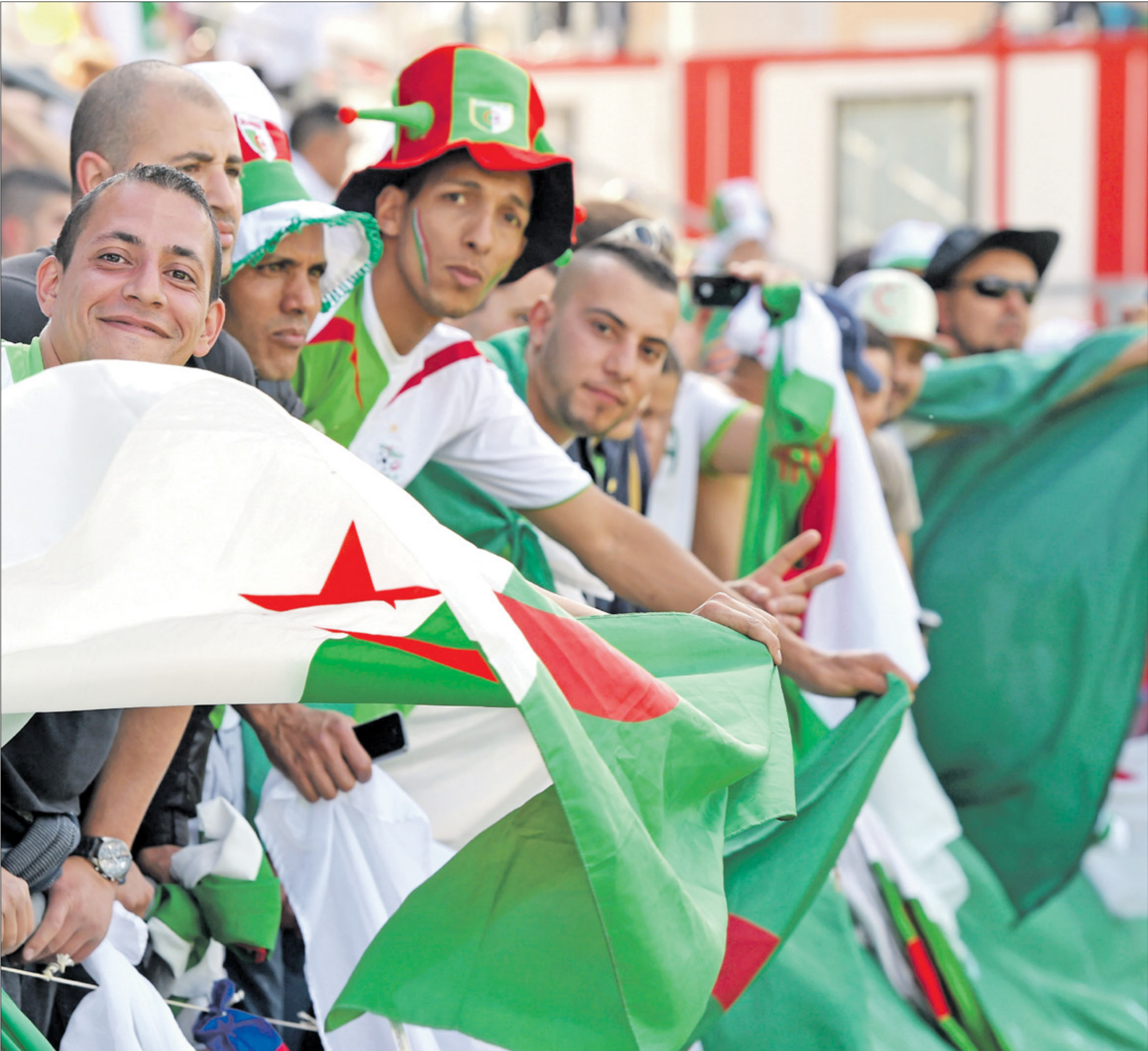
جماهير الدوري الجزائري للترقب الأارة في البطولة

مؤهلة للمنافسات القارية الموسم المقبل. ولا يختلف الحال كثيرا بالنسبة لنادي وفاق سطيف، الذي رغم أن نتائجه الفريق كذلك مباراة بأهداف متقاربة بين المضيف مولودية وهران أمام نادي بارادو، حيث إن الأول لن يكون أمام خيار غير الفوز لمحاولة الابتعاد عن منطقة الخطر، طالما أن الفريق يحتل المركز ما قبل الأخير برصيد 15 نقطة، أما بارادو المضيف فهو يُعتبر إحدى «النسر الأسود» يحتل المركز الخامس في جدول الترتيب برصيد 30 نقطة، وهو ما يعني أن لقاء شبيبة القبائل يُعتبر بمثابة مباراة 6 نقاط، كون أي نتيجة فيها غير