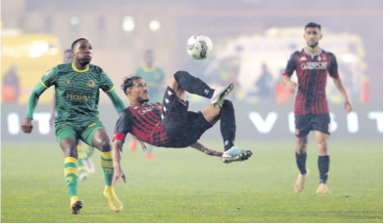
قعم مرئفةة في الجولة الحالية من المسابقة