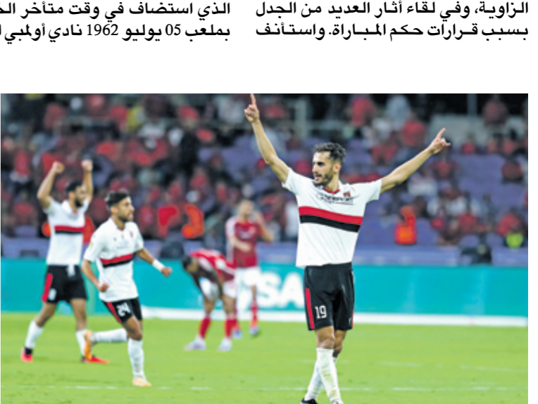
مولودية الجزائر ائفد بلاليل للتعوية

نادي وفاق سطيف المُخمس في هذه المنافسة، فيما نجأ مولودية الجزائر من مهاجمة كبرى بعدما قلب تأخره بهدف نظيف إلى فوز (1/4) أمام فريق شباب الزاوية، وفي لقاء آخر العديد من الجدل بسبب قرارات حكم المباراة. واستأنف بلعب 05 يوليو 1962 نادي أولمبي الشلف