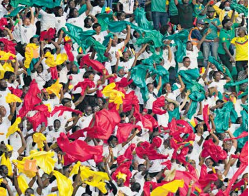
الجماهير الكاميرونية تصطف كرقم العتم

تأسس عام 1958 من اندماج ناديين أحدهما لينكس (الوشق) الكاثوليكي وديامان (المناس) البروتستانتى. وتعد المنطقة ذاتها موطناً لنادي إيفل وريال (النسر الملكي) في مدينة ميوا، وهو النهر الذي يمر عبر بلدة دشانغ، وبياموتوس في ميودا، العائد لمجموعة من البراكين. تأسس عام 1958 من اندماج ناديين أحدهما لينكس (الوشق) الكاثوليكي وديامان (المناس) البروتستانتى. وتعد المنطقة ذاتها موطناً لنادي إيفل وريال (النسر الملكي) في مدينة ميوا، وهو النهر الذي يمر عبر بلدة دشانغ، وبياموتوس في ميودا، العائد لمجموعة من البراكين. تأسس عام 1958 من اندماج ناديين أحدهما لينكس (الوشق) الكاثوليكي وديامان (المناس) البروتستانتى. وتعد المنطقة ذاتها موطناً لنادي إيفل وريال (النسر الملكي) في مدينة ميوا، وهو النهر الذي يمر عبر بلدة دشانغ، وبياموتوس في ميودا، العائد لمجموعة من البراكين. تأسس عام 1958 من اندماج ناديين أحدهما لينكس (الوشق) الكاثوليكي وديامان (المناس) البروتستانتى. وتعد المنطقة ذاتها موطناً لنادي إيفل وريال (النسر الملكي) في مدينة ميوا، وهو النهر الذي يمر عبر بلدة دشانغ، وبياموتوس في ميودا، العائد لمجموعة من البراكين.