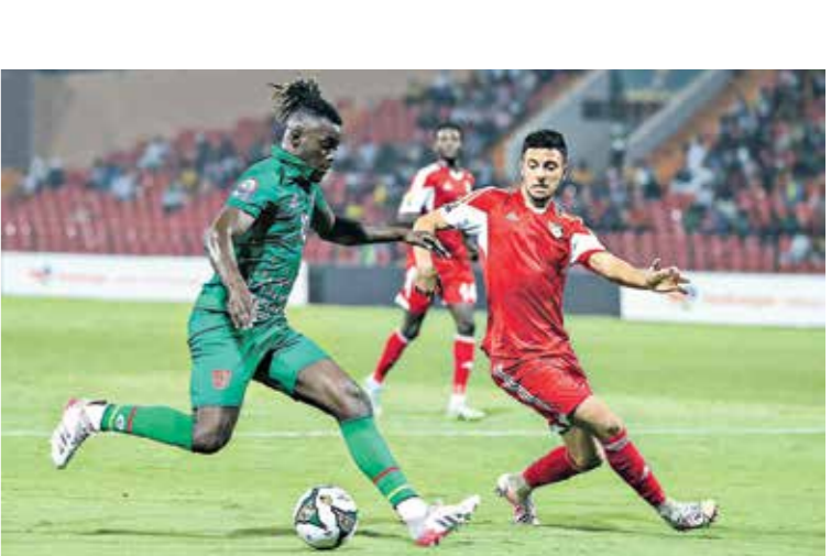
منتخب السودان في مهمة صعبة امام نيجيريا

ويخوض المنتخب المصري الجريح بعد الخسارة الأولى امام نيجيريا بهدف مقابل