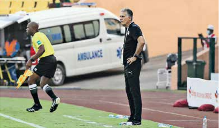
كيروان يسعى إلى اعادة الضغوطات التي يواجهها

المصري، في تصريحات صحافية، جازية للاعبين للمباراة، بحثًا عن الفوز وحصد 3 نقاط يعود بها إلى سياق المنافسة. وقال «سنلعب للفوز على غينيا بيساو، لدينا تشكيلة قوية من اللاعبين» أثنى في قدرتهم على تقديم مستوى أفضل مما كانوا عليه في مباراة نيجيريا الأولى، ونخطط لخوض المباراة بتكتيك هجومي، سعيا وراء الفوز، ولدينا وضع صعب بعد تعرض أكثر اللاعبين للإصابة مثل أكرم توفيق وأحمد فتوح، وكنت أتمنى تواجدهما في اللقاء.» وتابع «سنواجه منتخب غينيا بيساو بكل