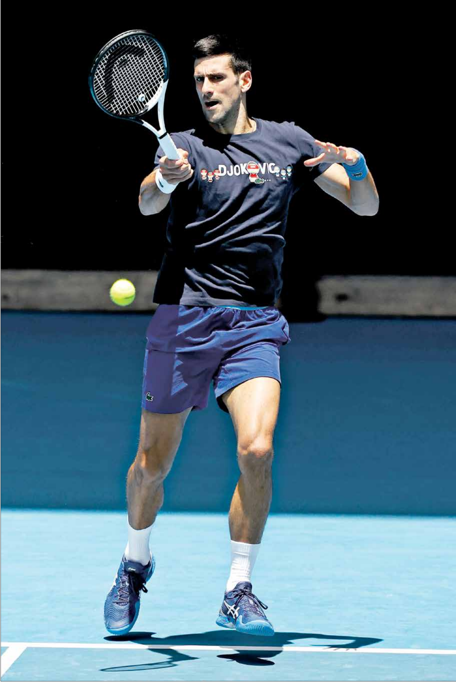
ديوكوفيتش لن يخوض منافسات بطولة أستراليا بسبب التأشيرة

الغت أستراليا تأشيرة دخول النجم الصربي نوفاك ديوكوفيتش إلى أراضيها للمرة الثانية وسترحله بسبب مسألة عدم تلقية اللقاح ضد فيروس «كورونا»، كما أعلن وزير الهجرة. ويعني قرار منع ديوكوفيتش من الحصول على تأشيرة دخول إلى أستراليا لمدة 3 سنوات إلا في ظروف استثنائية، أن الصربي سيحرم من المشاركة في بطولة أستراليا المفتوحة للتنس.