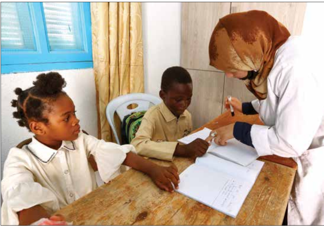
الةة المختلفة لمنع تكاوم مرض تعليم ابناء اللاجئين

ويحصلون تشغيلهم في شبكات تسوّل تجلب لهم الأموال، ما يحرم القصر من حق التعليم ويقيهم بلا موهلات علمية أو تأهيل مناسب لمحابتهم من الفقر والبئس على هامش المجتمع في المستقبل.