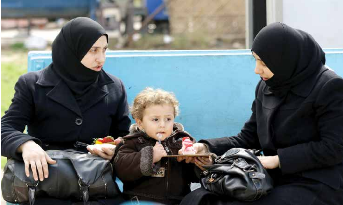
التامع حد يحرص بين زوجة الابن وساء العائلة (وس بارازو، فرانس برس)

ويؤكد أن المجلس «يشعر بفخر كبير عندما يتفوق أبناء اللاجئين في تعليمهم، ويظهرون حسن اندماجهم في المجتمع الذي يحضنهم، وهي المهمة الأساسية التي نعمل لإجلها». من جهتها، تتحدث الالجنة السورية إخصاص لسوس بفرح عن تفوق ابنتها الألتاح 13 عاماً في الصف السادسة والثانية من المرحلة الإعدادية. وتقول: «حصلت رافت على علامات جيدة في مختلف المواد، وجعله تفوقه موضع تقدير من مدرسته وأصدقائه، وسهل اندماجه في المجتمع، علماً أنه التحق بمدرسة حكومية في سن السادسة». وفيما يتمسك رافت بمغامرة دراسته باجتياح كمبر، لكن المستقبل يبقى غامضاً بالنسبة إليه في الحصائل على وظائف.