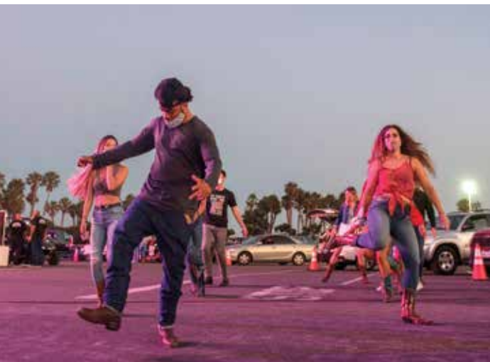
يتناولون مع الموسيقى (الباربي مذكون، فرانس برس)

غالبًا ما يُؤدّي الاستماع إلى الموسيقى للاسترخاء وتخفيف التوتر والكثير من مستشفيات الكورتيبول ومعدل ضربات القلب وأظهرت مراجعة وعرضت ان دراسة أن العزف «هذه دراسة 400 دراسة عن العزف والاستماع إلى الموسيقى يحسنان جهاز المناعة في الجسم، ويقلان من التوتر، ويعززان الترابط الاجتماعي، وكان الاستماع إلى الموسيقى عاملاً مساعداً خلال فترة الإغلاق العام نتيجة تفشي كوفيد-19، وربما ساعدت الموسيقى كثيرين على الارتباط بالأخريين ودعمهم، ويحسب موقع «ساينولوجي نوادي»، يمكن أن تساعد الموسيقى في تعديل المزاج