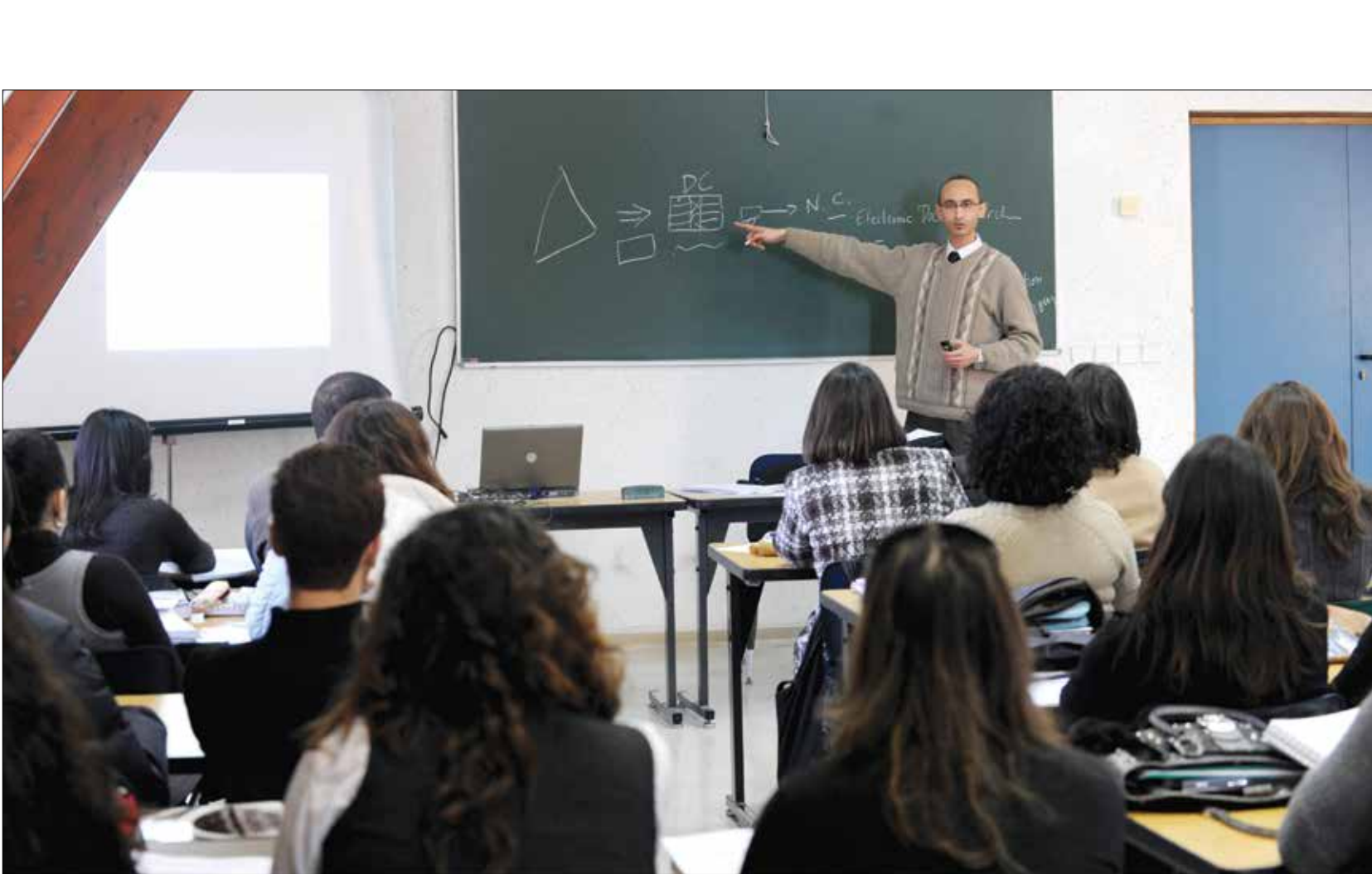
تحرش جنسي يوسع في جامعات المغرب

من البديهي النظر إلى التحرش الجنسي باعتباره من الجرائم في المجتمع، لكن أبناء تناقله قصص انتشاره الواسع في مؤسسات التعليم بالمغرب