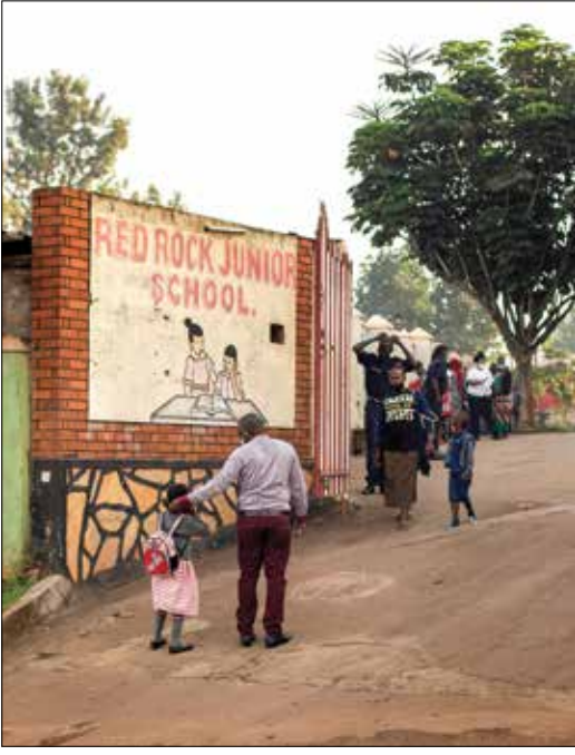
مشهد تجمع غير اعتيادي على باب مدرسة