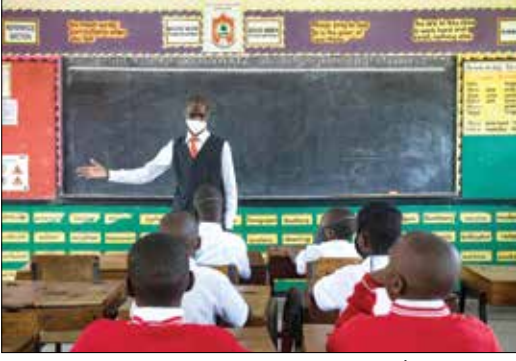
داخـل صف أكثر اكتظاظا نسبيا