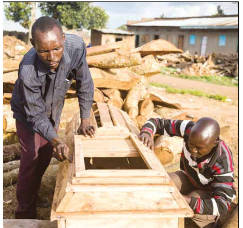
مدرسان امتهنا صنع توابيت