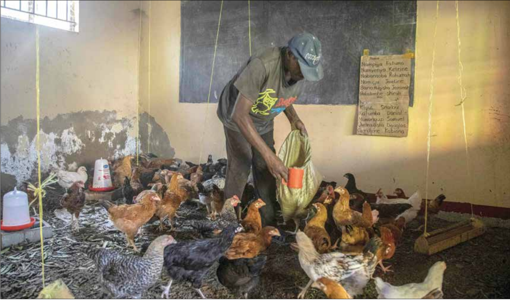
بعيدا عن التدريس للاعتناء برزف الدجاج