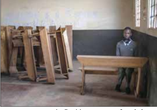
وحيدا على مقعد وحيد مجهز في الصف

شهدت الملاعب صرخات خجولة في اليوم الأول لاستئناف التعليم