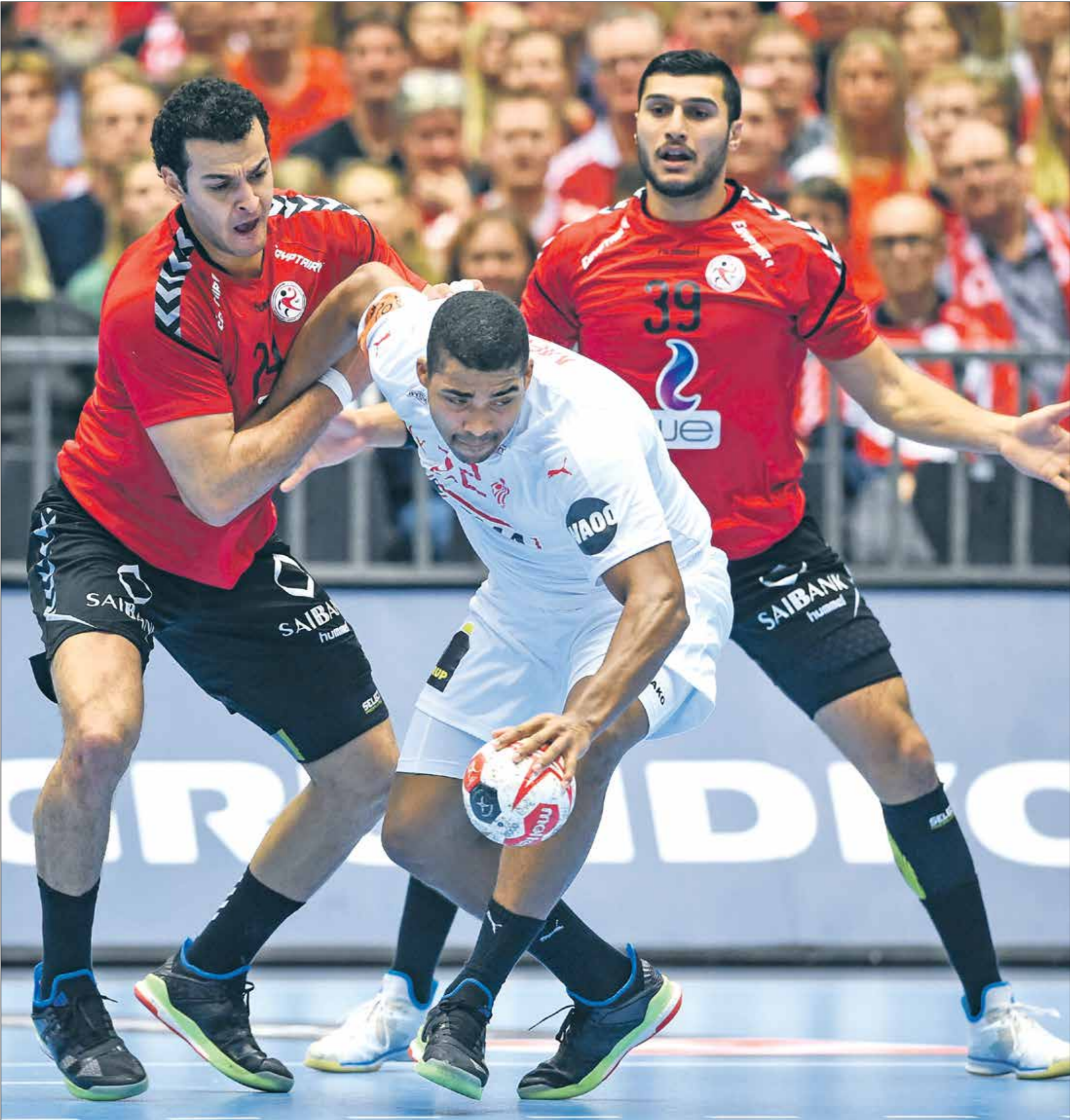
فحم منتخب «الفرانسة» عرض هجوماً

وستعتمد برسالة نجاح للعالم من هذه البطولة»، وتابع مصطفي حديثه قائلًا «خلال تواجدي رئيساً لاتحاد اليد 20 عاماً وشهرين، تعلمت العديد من بطولات العالم، ولكن لو كنا ذهبنا إلى أي مكان في العالم لما تحقق ما تم إنجازه في مصر لتنظيم هذه البطولة». كما نوه إلى أن ما