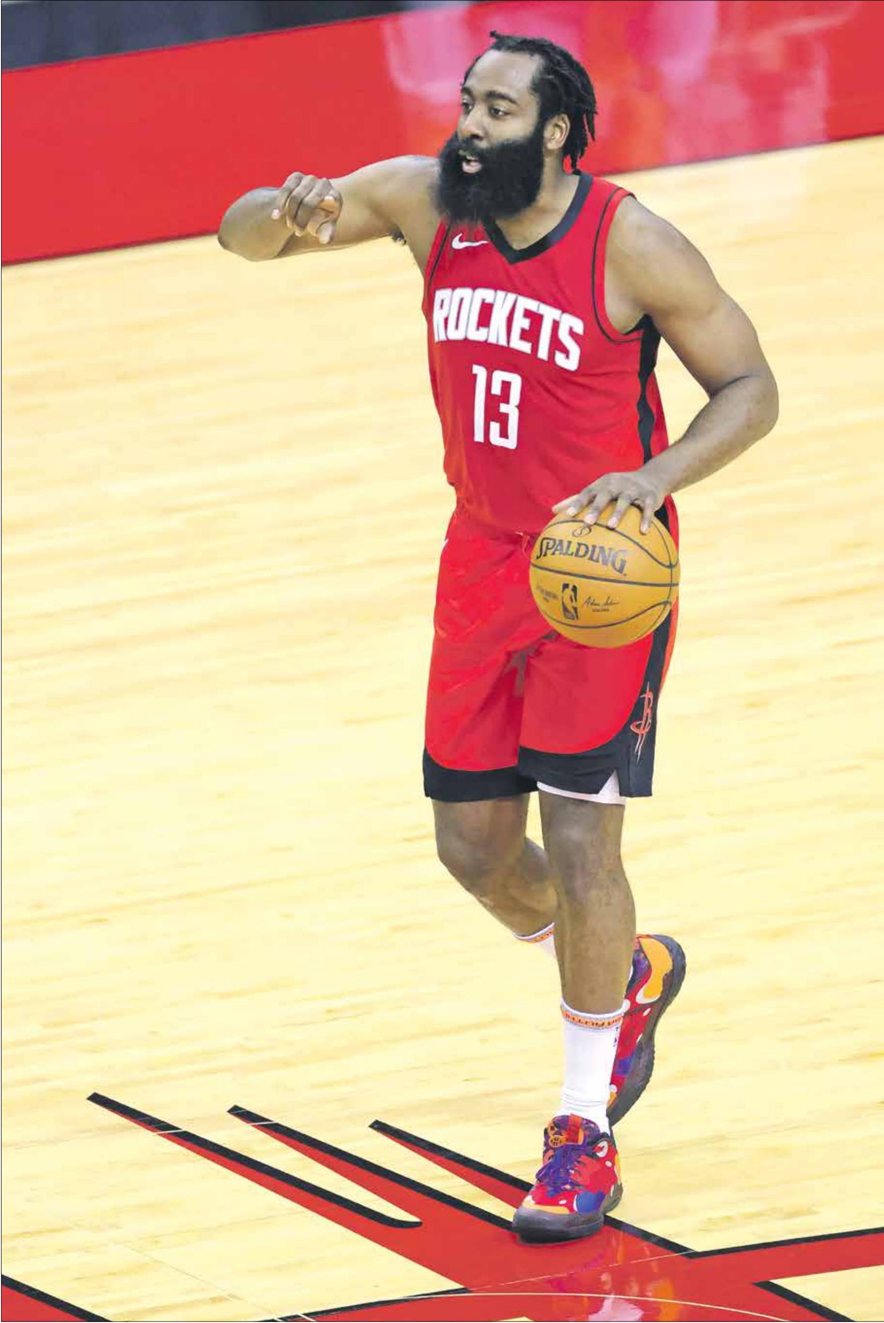
جيمس هاردن يبدأ رحلة جديدة في الدوري الأميركي

كشفت شبكة «إس بي إن» أن هداف دوري كرة السلة الأميركية للمحترفين في المواسم الثلاثة الأخيرة جيمس هاردن ترك فريقه هيوستن روكتس للانتقال إلى صفوف بروكلين نتس. ولم يعلن أي من الفريقين رسمياً عن قيمة الصفقة التي وصفتها وسائل الإعلام الأميركية بأنها «ضخمة». هذا وسيلعب هاردن إلى جانب النجمين الكبارين كيفن دورانت الذي لعب معه ثلاثة مواسم (2009-2012) في أوكلاهوما سيتي ثاندر، وكايري إيرفينغ.