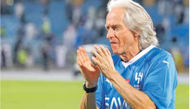
خيسوس كان يملك حصد لقب أبطال اسيا