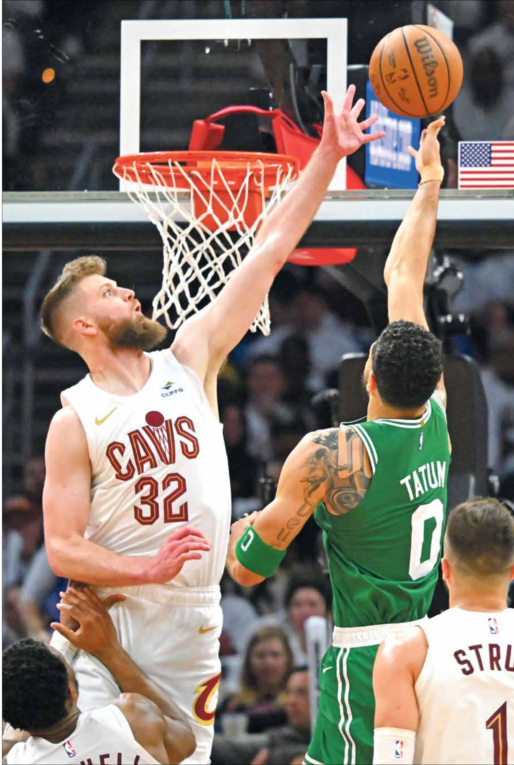
تاتوم قدّم مباراة مميزة امام كليفلاند كافاليرز في اللقاء الثالث

قائد الثنائي جايسون تايكوم وجايلن براون فريقهما بوسطن سلتيكس إلى الفوز على مضيفه كليفلاند كافاليرز 106-93 بتسجيله 61 نقطة، وحذا حذوهما ثاني دالاس مافريكس كاري إيرفينغ والسلوفيني لوكا دونتشيتش بمساهمتهما في فوزه على ضيفه أوكلاهوما سيتي 105-101 في المواجهة الثالثة ضمن الدور ربع النهائي (نصف نهائي المنطقة الشرقية والغربية) من الأدوار الإقصائية (بلاي أوف) في دوري كرة السلة الأميركي «إن بي إيه».