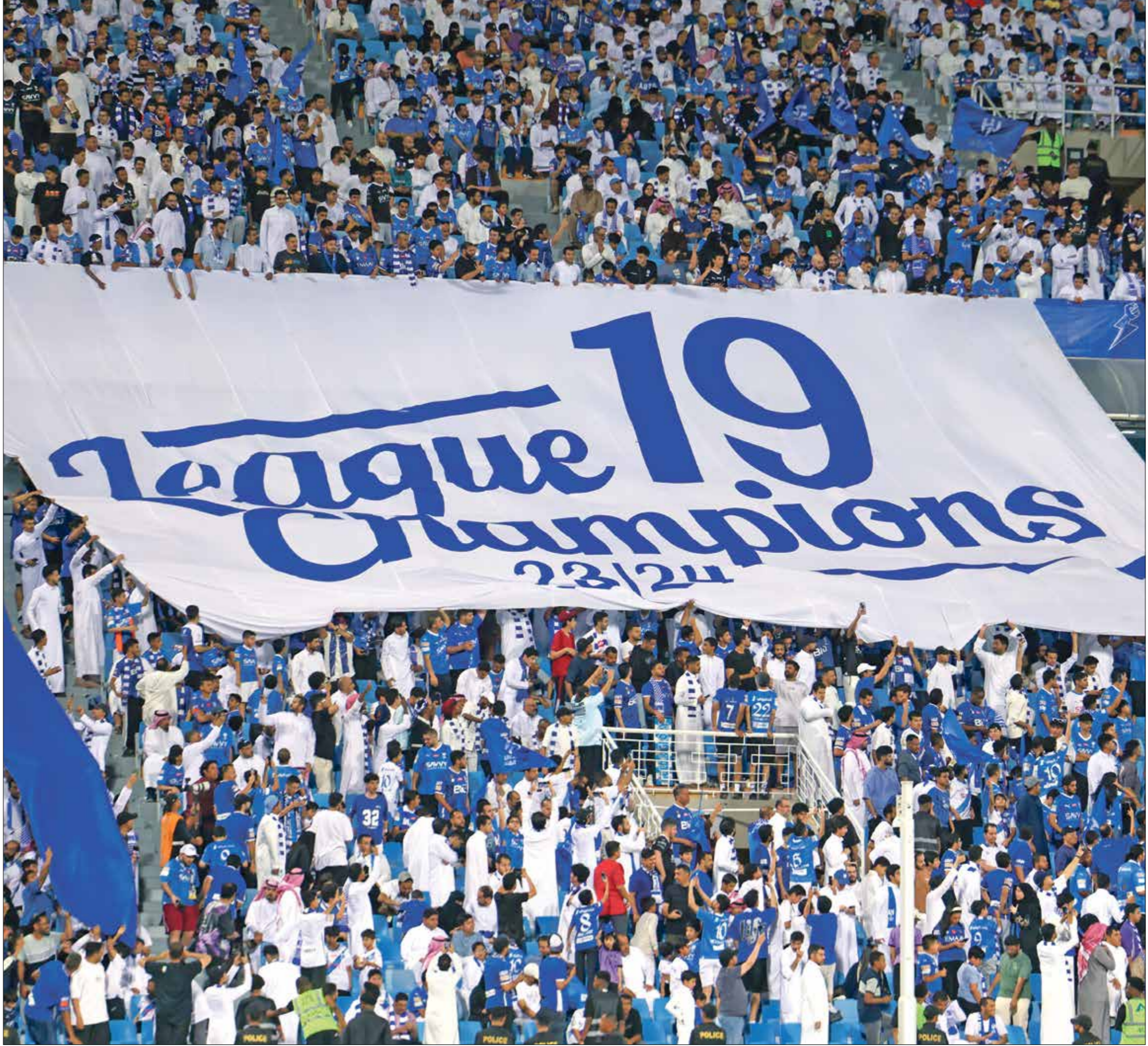
حاط الهلال على سخته خالياً من المراقب

إلى الدولي السعودي علي البليهي، وظُف بونو الخيرات التي اكتسبها في السنوات الماضية لمساعدة الفريق، إذ إنّه شارك في 29 مباراة، نجح خلالها في الدفاع عن شبابه في 15 مباراة، أي في أكثر من نصف المباريات، التي كان خلالها في الموعد، وما نجس للنجح المغربي أنه كان حاسماً في المباريات الصعبة، التي خاضها فريقه الإسباني، وجعلته يُقدّم الإضافة سريعاً إلى فريقه، ويكون من بين أفضل الحراس، رغم الأسماء القوية في مركزه. ورغم حسمه لقب الدوري، إلا أن موسم الهلال لم