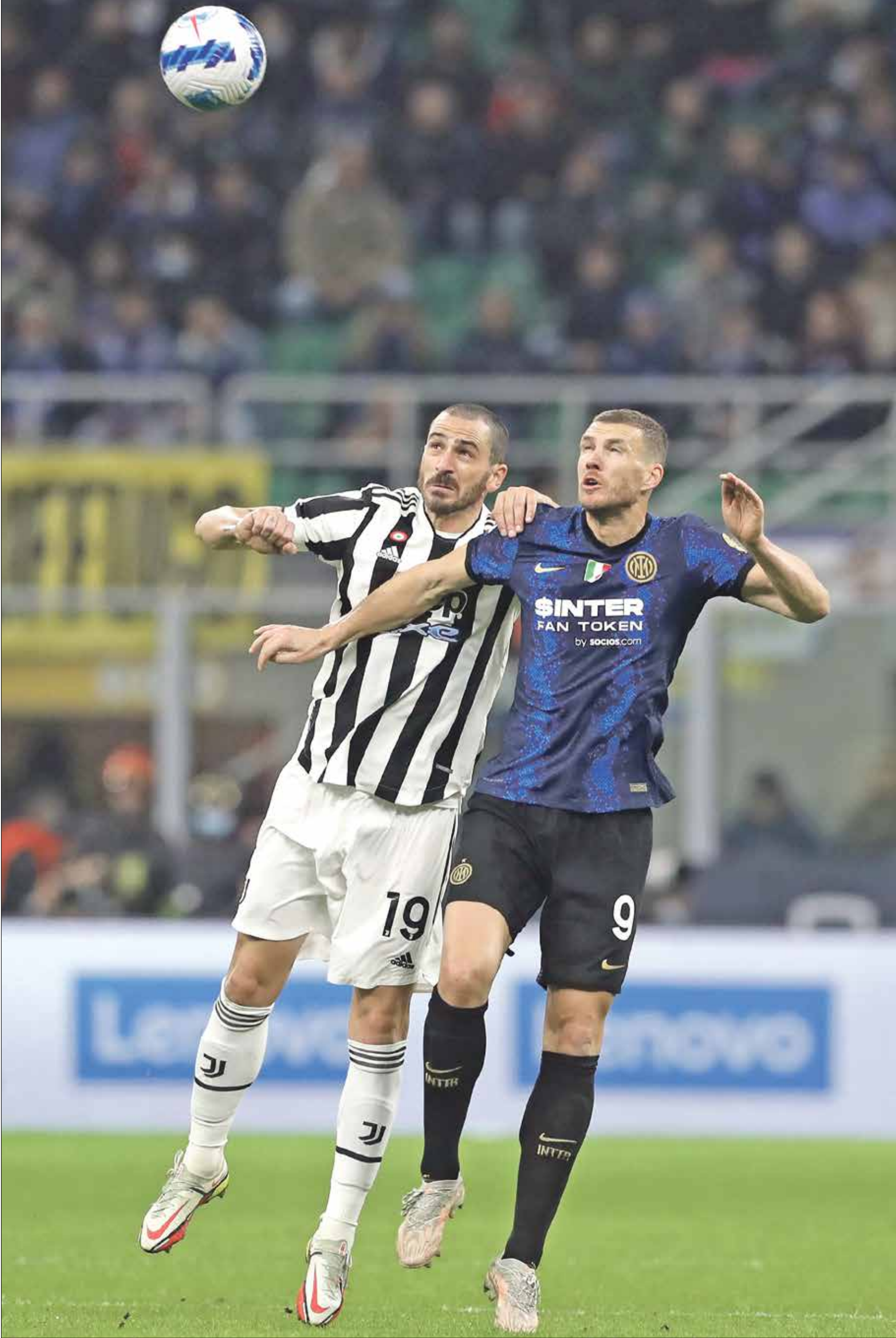
من ستوچ باول القاب موسم 2021-2022

تتجه الأنظار إلى ملعب «جوزيبي مياتزا» في ميلانو؛ مكان إقامة «ديربي إيطاليا» بين الغريمين التقليديين إنتر ميلان بطل الدوري ويوفنتوس بطل الكأس، من أجل حسم لقب النسخة الـ34 في منافسات كأس السوبر الإيطالية. ويأمل إنتر في استغلال افضلية خوض المباراة على ملعبه وإمام جماهيره في مواجهة الـ«بيانكونيري» الذي عوض خسارته «للسكوديتو» بالفوز بالكأس المحلية على حساب أتلانتا في الموسم الماضي.