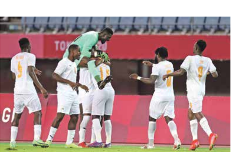
منتخب ساحل العاج يلتقي غينيا الاستوائية

يُسد الستار اليوم، الأربعاء، على منافسات الجولة الأولى من عُمر مرحلة المجموعات لكأس الأمم الإفريقية لكرة القدم المقامة حاليا في الكاميرون، وتستمر حتى 6 فبراير/ شباط المقبل، عبر 3 مباريات جديدة في إطار المجموعتين الخامسة والسادسة، وتتواصل رحلة المنتخبين العربية، وسعيا وراء ضربة بداية قوية في المجموعة السادسة، عندما يخوض منتخب تونس مواجهة العبار الثقيل، بملاقاة نظيره المالي في قمة المجموعة بالدور الأول، وتمثل المباراة بين المنتخبين (تونس ومالي) إعادة لوقعة