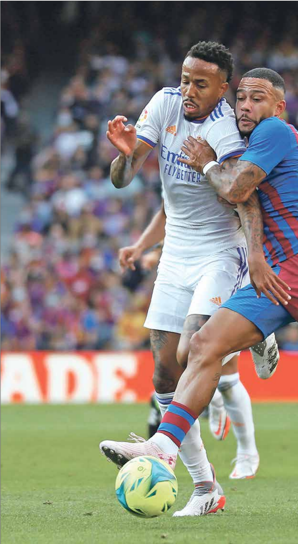
ريال مدريد يهاجم برشلونة

وسجّل كريم بنزيمه 17 هدفاً تصدّر بها ترتيب هدافي «الليغا»، وأضاف 8 تمريرات حاسمة لزميلائه، وخمسة أهداف في دوري أبطال أوروبا، أما الموهبة البرازيلية، فهو ثاني هدافي إسبانيا حالياً برصيد 12 هدفاً وتسع تمريرات حاسمة وهدفين، وريال