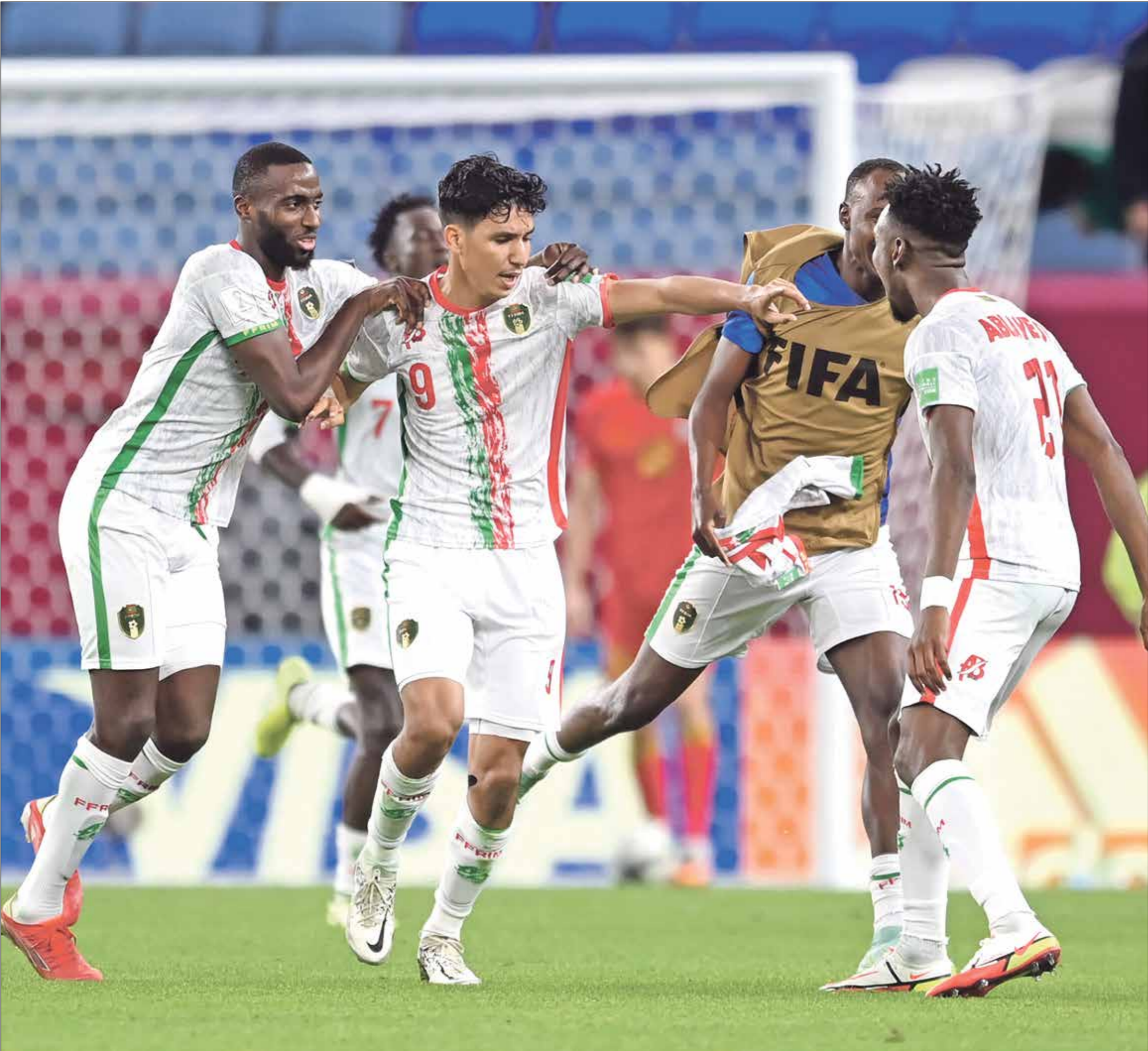
المنتخب الموريتاني يربذ أن يكون الحصان الأسود