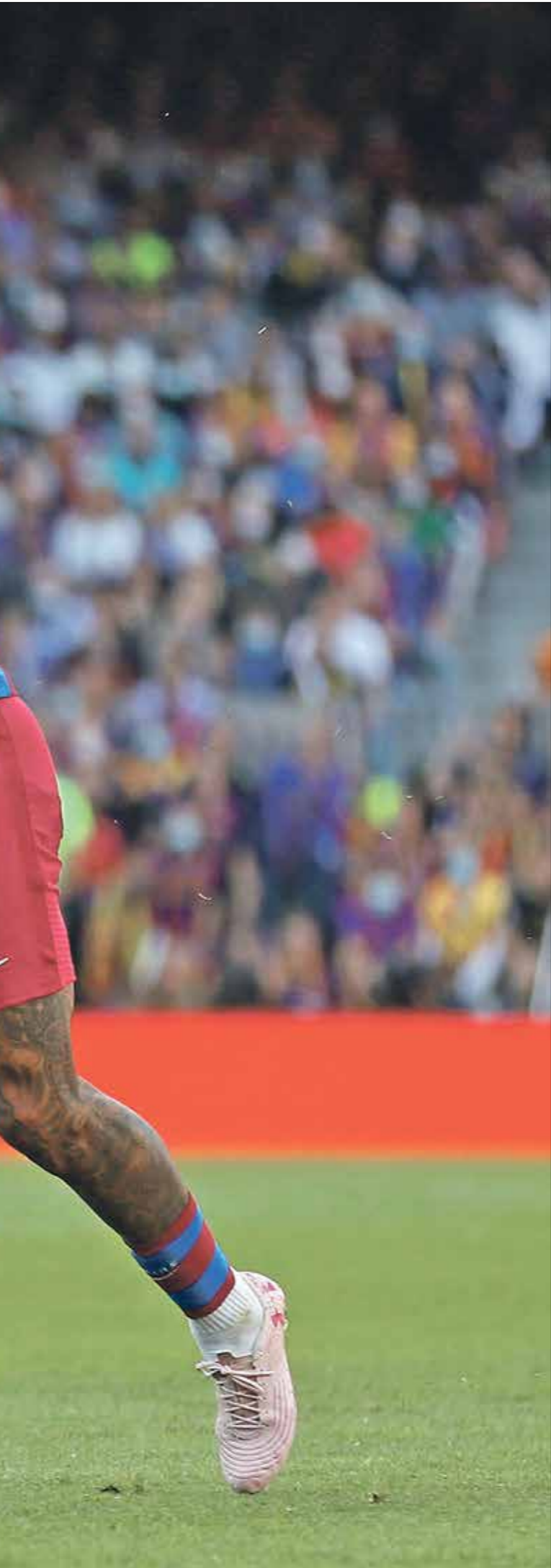
ريال مدريد يهاجم برشلونة

وشكّل بنزيمه مع زميله فينيسوس جونيرو ثنائياً فذاً في الموسم الحالي، بعدما سجل اللاعبان 27 هدفاً في الدوري الإسباني في 21 مباراة، أي أنّ نادياً مشاركاً في البطولة سجلت أقل منهما نادياً واحداً سجل مثلهما (أرابو فالكانو)، فيما اكتفى إشبيلية الوصيف وبرشلونة السادس (31) بأربعة أهداف، وريال