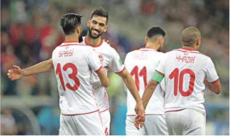
منتخب تونس يصعد للانتصار الاستوائي بالكأس

الأفريقية، لدينا طموحات كبيرة نسعي إلى تحقيقها، علينا التحلي بالتركيز الشديد في مواجهة مالي، والتعب من أجل حصد النقاط الثلاث»، وتابع الكبير: «واجبنا ظروفنا صعبة، سواء بسبب إصابات كورنا، أو إلغاء المباريات الودية، والتجمع لفترة قصيرة جدا، لكنّ خبرات اللاعبين من أهم الأسلحة التي نعتمد عليها، وحرصنا على الاستعداد بشكل جيد، رغم الغيابات وتأخر لاعبين بسبب كورونا، أو للحضور إلى المعسكر مثل سنّف الجزيري وحصل المجرى ويوسف المساكني، والظروف