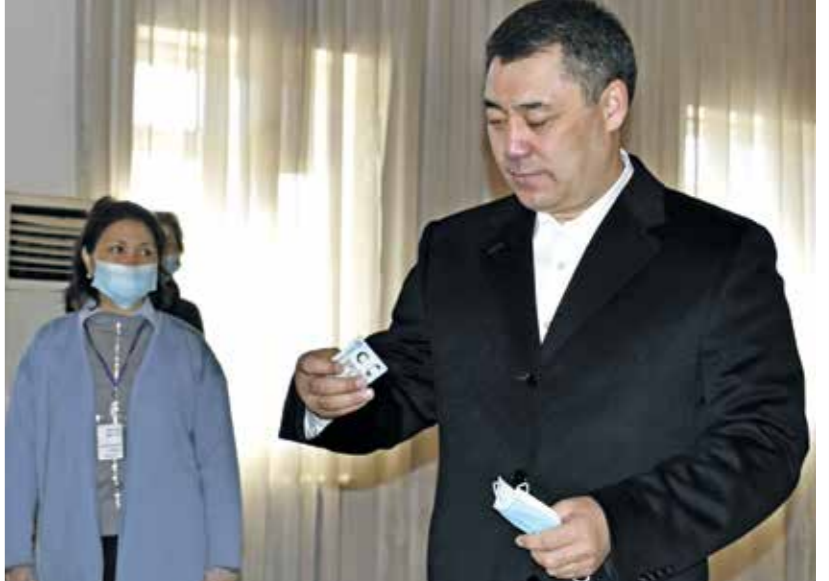
حصص جاباروف على مر 80 ٪ من أصوات الناخبين (الوطن)

فاز القومي صدر جاباروف بفارق كبير، أمس الأحد، في الدورة الأولى من الانتخابات الرئاسية في قرغيزستان، وهي بعد أزمة سياسية شهدتها البلاد في أكتوبر/ تشرين الأول الماضي على خلفية الاحتجاجات الراضة لنتائج الانتخابات الخيائية، وأفضت في حينه إلى استقالة الحكومة ثم رئيس الجمهورية سورونباي جينينكوف وشهدت الحملة الانتخابية لجاباروف زخماً كبيراً، مع احتفاظ أنصاره في الملاعب في جميع أنحاء البلاد على الرغم من تفشي فيروس كورونا، وزُعت لافتات من