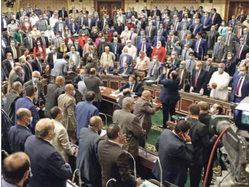
يبدأ المجلس النيابي الجديد عمله غدا الثلاثاء

قرارات جمهوريين، الأسبوع الماضي، لتعيين 28 نائباً من الواليين له في المجلس، ودعوة البرلمان الجديد لعقد جلسته الإجرائية الأولى، غداً الثلاثاء، جلسة سيغيب عنها رئيس الجمهورية في سابقة نيابية، على خلفية تفشي الموجة الثانية من فيروس كورونا، و وفاة ثلاثة نواب في الأوتنة الأخيرة جراء إصابتهم بالفيروس. وكشفت مصادر مطلعة له «العربي الجديد» أنه تقاضي ملايين الدولارات بصفته عضوًا في الانتخابات الخمسينيات كمسؤولات في الانتخابات البرلمانية التي جرت بين أكتوبر/تشرين الأول ونيسان/أبريل 2011، كما تولى منصب الأمين العام لعضوية مجلس النواب لدى جهاز القضاء البشري حال دون ذلك. وهو إذا قرار عنصري في منطلقاته ودوافعه، وتحميها واليمين المتطرف، بتسلط جهاز القضاء وكبار الموظفين، في إشارة للمستشار القضائي للحكومة أفيحاي مندلبليت، وبما أن الوزير يدرك أنه على ضوء توصية المستشار القضائي للحكومة بتوفير اللقاح للأسرى، فإنه من المرجح أن