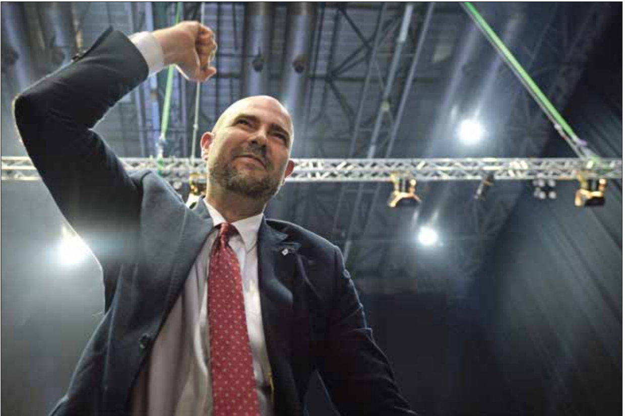
أمير أوحانا يصرخ بمواقفه العنصرية

وصا قائله الوزير العنصري بشأن كون اللقاح «مورد قومية محدودة» يتعارض أولاً مع إعلان رئيس حكومة الاحتلال بنيامين نتانياهو أمس الأول، عن ترقيع وصول شحنة كبيرة إضافية من اللقاحات فايزر، ومع تقديرته أن باز يتم تطعيم كل سكان إسرائيل من قبل 16 عاماً فما فوق