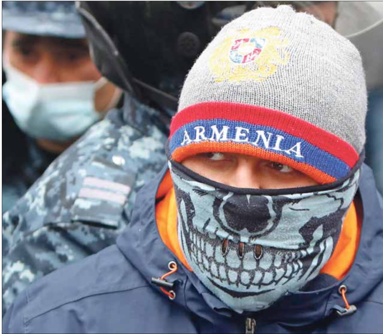
هجوم متوقع من المعارضة الأرمينية على باشينيان

وفي حين تعرض باشينيان إلى انتقادات واسعة من قبل المعارضة التي نظمت تظاهرات بعد توقيع اتفاق نوفمبر، وحملته المسؤولية عن الهزيمة، وسعت لإسقاطه، عملت روسيا على كيل المديح لـ «شجاعة رئيس الوزراء الأرميني واختيار قرار وقف إطلاق النار». ويبدو أن الجانب الأرميني يركز على تحسين الأوضاع الاقتصادية لتجنب انهيار أكبر،