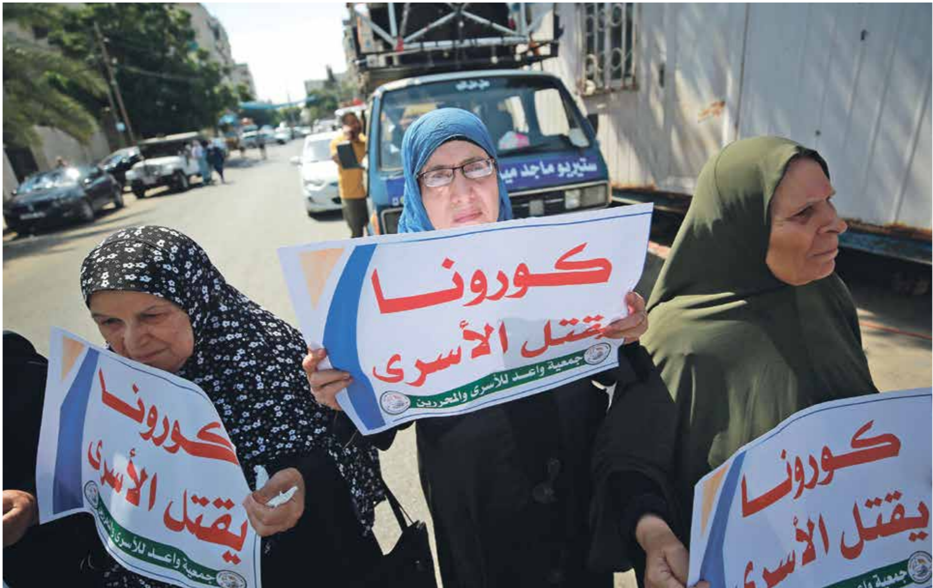
يتحرك الاحتلال المصروفات بلقائ (صالحات الأسرى بالميروس

بكورونا ما زال مسوكاً من الاحتلال، وهو ما يجعل اللق أكبر بشأنهم. تزايدت الإصابات بكورونا في صفوف الأسرى، لأن السجون أماكن مغلقة، «بالتالي فإنها معرضة لانتشار المرض فيها، ويعيش الأسرى هناك مع بعضهم على درجة عالية من الاختلاط الإجباري». وتشدّد فارس على ضرورة إيجاد إجراءات لمنع تفشي الفيروس في السجون بشكل أكبر، لأن عواقب تفشي الفيروس كارثية، وقد تؤدي إلى سقوط شهداء. ولغت إلى أن ملف إصابات الأسرى