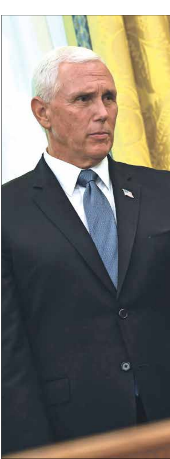
ترامب غاضب جدا من بنس انشربايلونوسكى

الثاني محبط وحزين بسبب تصرفات الرئيس. ويعتزم بنس حضور مراسم افتتاح مبنى الكابيتول في محاولة بالسة منهم لمنع تصديق الكونغرس السبت عن عزل جو بايدن بالانتخابات الرئاسية، عدد من كبار المسؤولين الحكوميين أن بنس قرر حضور مراسم تنصيب بايدن الذين قالوا إن المسألة ستطرح في مجلس النواب اليوم الاثنىن، أن تؤدي التهميدات