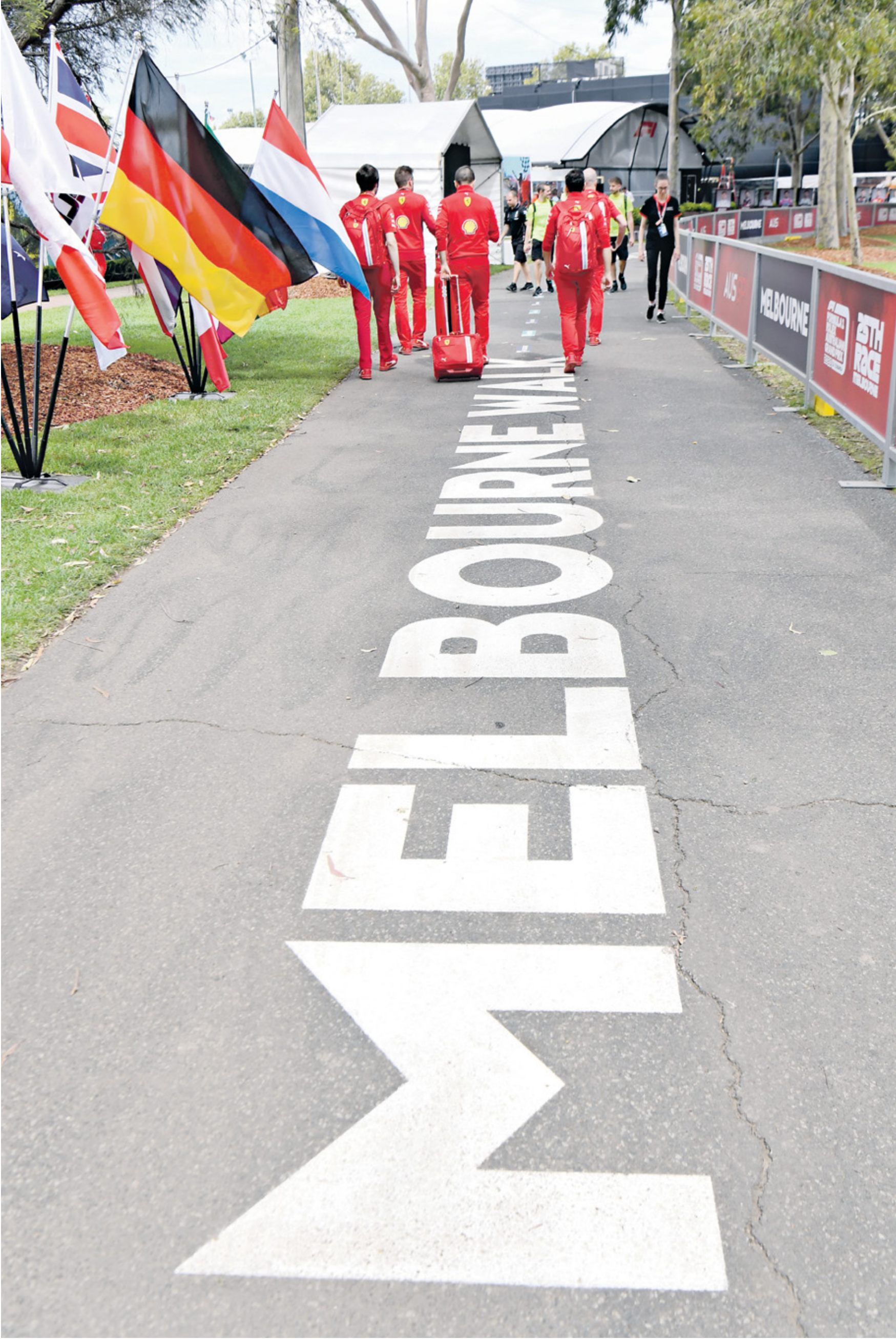
سبأف استراليا يخرج من منافسات موسم عام 2021 لفرمولا 1

اعلن منظمو بطولة العالم للفورمولا واحد عن إلغاء جائزة استراليا الكبرى للعام الثاني توالياً، والمقررة في شهر تشرين الثاني/ نوفمبر المقبل، بسبب تداعيات فيروس كورونا. وواجه المنظمون عقبات بشأن متطلبات استراليا للوافدين ووجوب خضوعهم للحجر الصحي الإلزامي لمدة 14 يوماً، الأمر الذي صعب مهمة إقامة السباق في ظروف طبيعية.