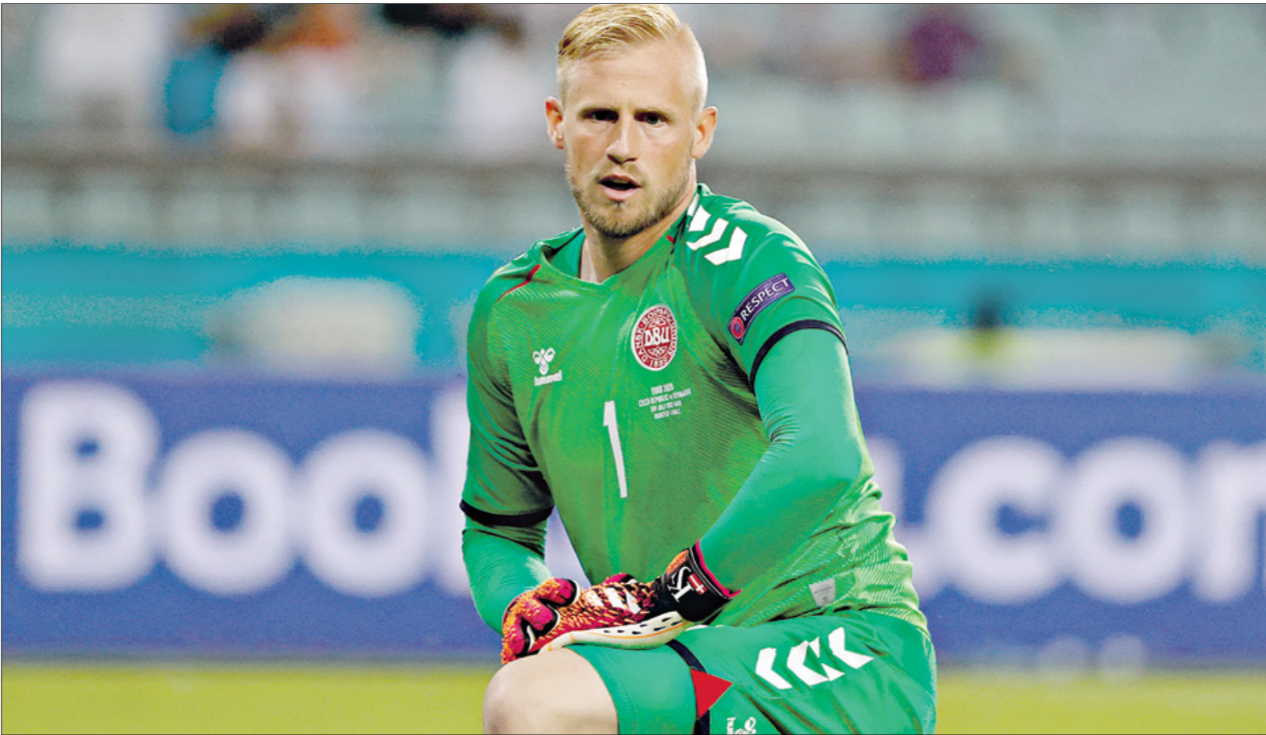
يطمح كاسير شمايكل إلى تكرار إنجاز والده عام 1992

أنني تحطيت»، على سعيد متصل، اعرب جادون سانشو، مهاجم منتخب إنكلترا، عن سعادته البالغة باللعب مع «الأسود الثلاثة»، والمساهمة في بلوغه نصف نهائي بطولة كأس الأمم الأوروبية لكرة القدم 2020، عقب مشاركته في مواجهة ربع النهائي، التي انتصر فيها على أوكرانيا بأربعة أهداف مقابل لا شيء، وقال جادون سانشو، خلال مقابلة مع برنامج «يونوز دين» على موقع يوتيوب: «هو شيء كنت أحلم به وأنا طفل، ارتداء القمصين من أجل عالمي هو شرف كبير بالفعل بالفلسفة لي. اعتبر نفسي محظوظاً، لأن تمثيل منتخب إنكلترا في بطولة