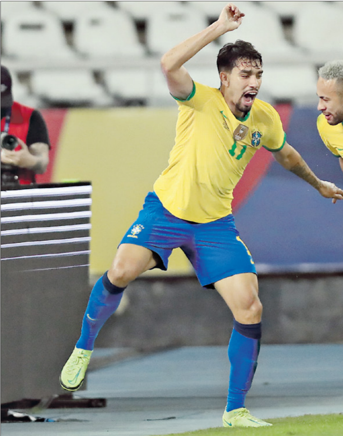
نيمار يسلم للقب الأول له في كوبا اميركا

كوبا اميركا، إذ غاب عن نسخة عام 2019، إثر تعرضه لإصابة قوية على مستوى الكاحل، البرازيلي بلقب كوبا أميركا 2021، فسحق لقب للمرة الثانية على التوالي، بعد لقب عام 2019، وهو طبعاً يملك الأفضلية حالياً بسبب التشكيلة القوية التي يمنحها والعناصر المميزة على أرض الملعب التي جعلته يتفوق على جميع المنافسين في البطولة القارية. كذلك، سيمى النجم نيمار نسخة 2015 وصلت الأرجنتين وتشيلي إلى