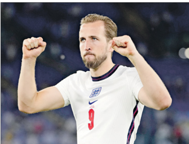
يعتمد منتخب إنكلترا على خدمات نجمه هاري كين

يحلم منتخب إنكلترا بالوصول للمرة الأولى في تاريخه إلى نهائي بطولة كأس الأمم الأوروبية، شرط تجاوز عقبة منافسه منتخب الدنمارك