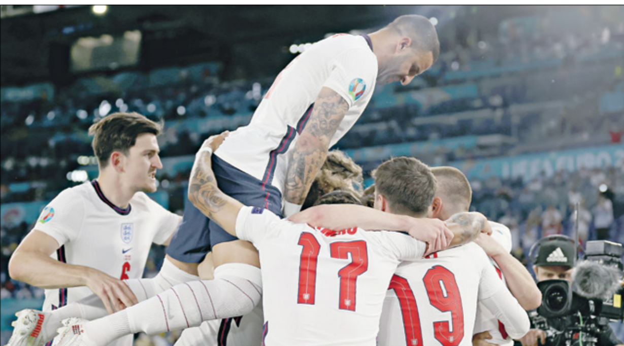
يريد منتخب إنكلترا تجاوز عقبة الدنمارك