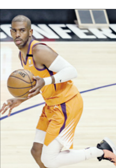
كريس بول، يسلم للتوج بلقب الدورب

ويلعب معدل بول، الذي خاض مباراة كل النجوم 11 مرة وتوج باللقب الأولمي ورغم أنه لم يتمتع بفرصة اللعب في الدوريات الأوروبية مثلما يحلم كل لاعبي باراغواي، إلا أن ذلك لم يمنع من أن يكون محور إشادة كبرى من عديد الأطراف بعدما نجح في تقديم مستويات جيدة. وقد عبّر نجم منتخب أوروغواي السابق وقائد دفاع مونتفوس الإيطالي يارلو مونتيزو عن إعجاب الشديد بقدرات روميرو ووصفه باللاعب المثالي، بما أنه تميز بالقة والسرعة إضافة إلى تألقه في المرافقات التي تسمح له بأن يتجاوز منافسيه المباشرين دون تعقيد وهي من نقاط قوته الأساسية. ومن الصفات التي يجب أن تتوفر في الجناح وأحياناً ثاقب روميرو في كوبا أميركا رغبة جماهير فريقه السابق كورينثيانس البرازيلي في استعادته من جديد، إذ يالطو عدد كبير منهم من النادي انتدابه من جديد بعدما ترك أثراً طيباً عند مروره السابق. كما أن مستواه في كوبا أميركا يثبت أنه ما زال قادراً على المساعدة وتقديم الإضافة إلى الفريق. ووفق بعض المصادر، فإن البريكاتو الصفيي قد يحمل الجديد في مسيرة روميرو، بما أن بعض الأندية الأوروبية تفكر في التعاقد معه، وستكون التجربة في ملاعب أوروبا أم اختبار حتى يظهر روميرو ما يملكه من قدرات فنية.