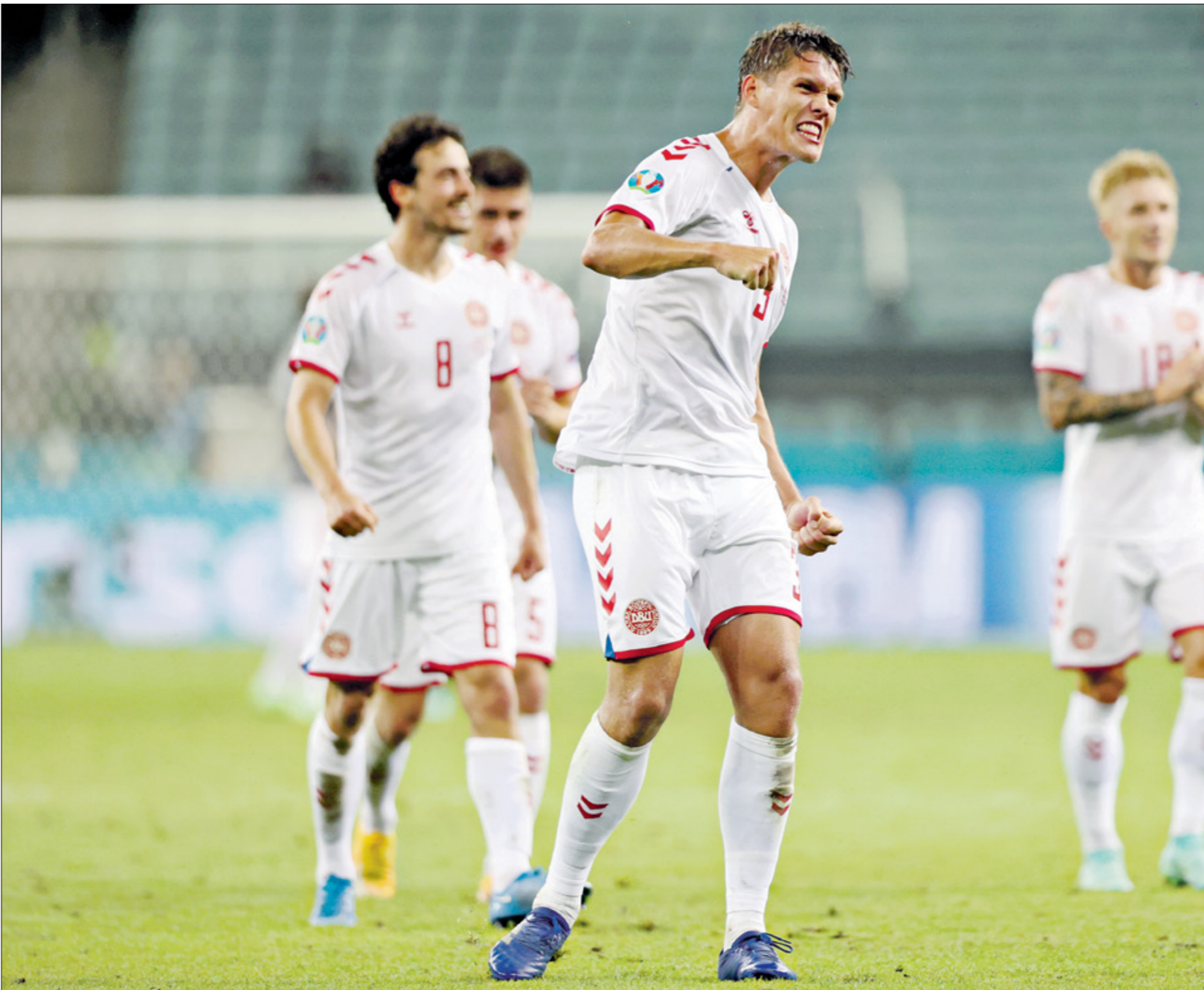
يطمح نجوم الدنمارك لتحطيف المفاجأة ببطولة «يورو 2020»

تجديد عقد ساوثغيت، الأمر الذي يؤدي ماغواير، ويسأله عما إذا كان اللاعبين يرغبون في توقيع ساوثغيت على عقد جديد، قال ماغواير: «نعم بالطبع. يمكنني أن أتحدث بالنيابة عن نفسي فقط، لكنني