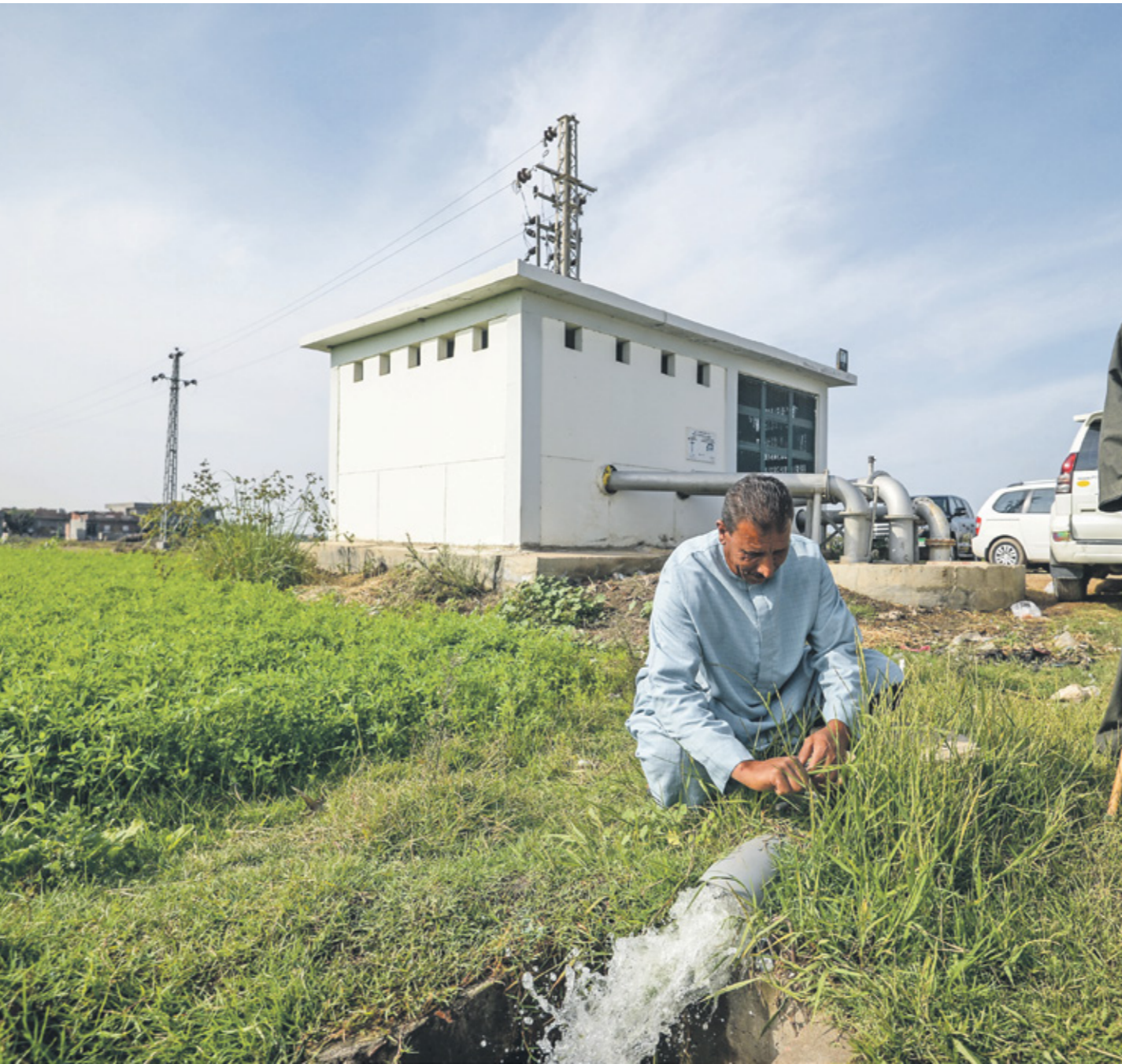
شخ المياه بعُد الزراعة المصرية بخسار باهظة

واعترف رئيس الوزراء المصري، مصطفى مدبولي، مؤخرًا أن مصر، التي تعتمد على النيل بنسبة 97% في مياه الشرب والري،