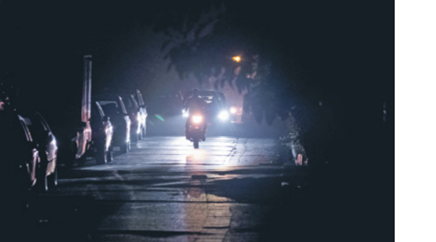
إاد غضب المواطنين الإيرانيين مع بلوغ الحرارة صيفا 50 درجة في بعض المناطق