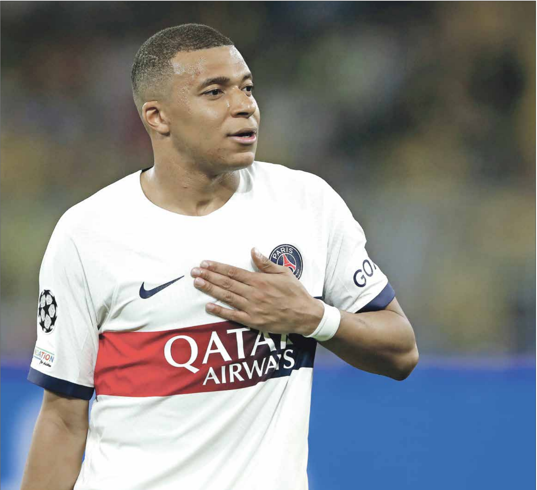
يهتف مبابي على الحصد لقب الأبطال قبل رحيله

في الخط الهجومي إلى جانب مبابي، بدلاً من ديميلي ويرانلي باركولا، اللذين لم يُقدّما المطلوب ذهاباً. على المقلب الآخر، في خوض دورتموند سانما على مستوى خط الدفاع الإسباني، حين غادر قائمته طويشة من الحصابين، على غرار الفرنسي برينسيل كيمبيني، ومواطنه ليفين كسورزاوا، والإسباني سيرجيو ريغو، مع العلم أن المدرب لويس إنريكي، قد يعتمد على مواطئه الإسباني، ماركو اسينسيو أو الكوري الجنوبي لي كانغ إن، أو البرتغالي غونزالو راسوس للعب