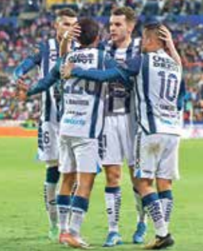
فر ألونسو البقاء