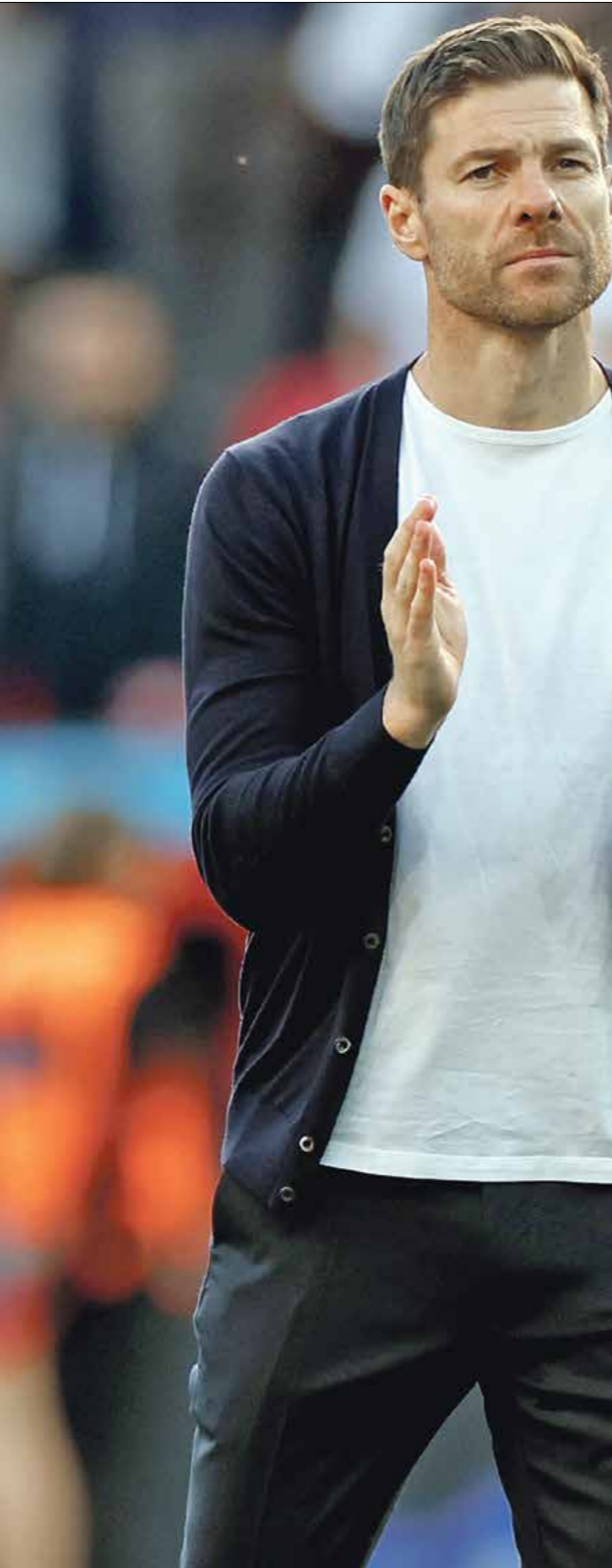
خافيير بيريز، المدير الفني لريال مدريد

بعد النجم السنغالي السابق، بايبس سيسيه (38 عاماً) أحد أبرز المهاجمين الذين مروا في تاريخ نادي نيوكاسل يونايتد الإنكليزي، بعدما سجل معهم 37 هدفاً خلال 117 مواجهةً خاضها في جميع البطولات، قبل أن يقرر الرحيل في عام 2016. ولد بايبس سيسيه في الثالث من شهر يونيو/ حزيران عام 1985، لكن حياته لم تكن مغروسة بالورود، بعدما وجد نفسه وسط أسرة سنغالية فقيرة، تصارع من أجل تأمين قوت يومها، ما جعله يعمل صياد أسماك في طفولته، رغم حبه الشديد لكرة القدم، واستطاع بايبس سيسيه خلف أنظار أحد كشافي الأكاديميات المحلية في السنغال عام 2000، الأمر الذي جعله ينطلق في تحقيق حلمه، عاشه في عام 2004، عندما وقع عقداً احترافياً.