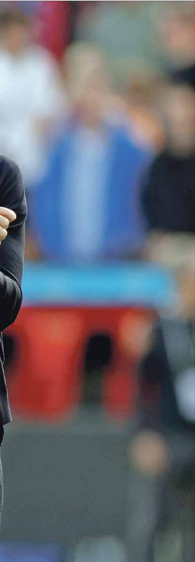
خافيير بيريز، المدير الفني لريال مدريد

جهز ميكيل ارتيتا قائمة تضم سبعة لاعبين لمغادرة ارسنال في الميركاتو القادم، تضم كلا من المصري محمد النني، والظهير البرتغالي سيرلوك سواريس، كما ستحسم إدارة الخريف مصير أربعة لاعبين شعاري، وهم الاسكتلندي كيران تيرني، والبر تغالي تونو تاماراس، والبلجيكي البريت سامي لوكونغا، والبرازيلي ماركينيويس، فيما سيكون مستقبك الحارس الانكليزي ارون رامسديل، والمهاجم غاريك جيسوس، الاكثر تعقيدا من بين هذه الاسماء.