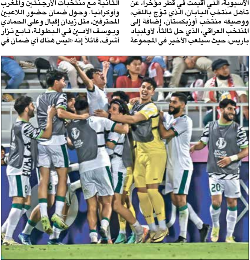
اللاعبين العراقيه لتهل لأولمبياد باريس