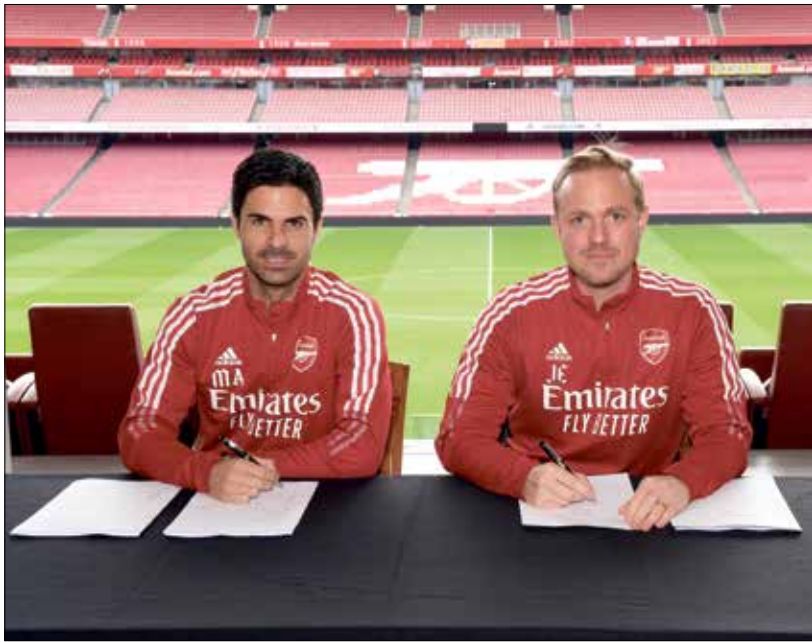
أرتيتا يصعد لصفحات الملعب من ابطال أوروبا

وعلى الصعيد الفني، يُقدّم فريق أرسنال مستوى كرويا مُميزًا على أرض الملعب خصوصًا بعد تفوقه على كل من تشلسي ومانشستر يونايتد في الجولتين الدفاعية أكثر وأكثر من تحقيق بطاقة التأهل إلى الأبطال فارتيتا يعتمد على الكرة الهجومية السريعة التي تتركز على البناء السهل والمميز من الخلف، ثم ضرب من خارج منطقة الجزاء، وهو ما جعل الجماهير تسعد كثيرًا بما يُقدمه أرتيتا وخصوصًا هذا الموسم. ويحتاج أرتيتا عدة لاعبين من الصف الأول لتحسين المستوى الفني أكثر وأكثر والعودة بقوة في منافسات الدوري الإنكليزي الممتاز ومنافسة الكبار مثل مانشستر سيتي، ليفربول، وتشلسي، وغيرهم. فهل نتخج الحرب الإسباني، ميكيل أرتيتا، في تحقيق الهدف الذي تريده الجماهير وتأكيد أن ثقة الإدارة التي وضعتها فيه لم تكن صدفة أو دون دراسة لما يُقدمه المدرب مع الفريق على أرض الملعب.