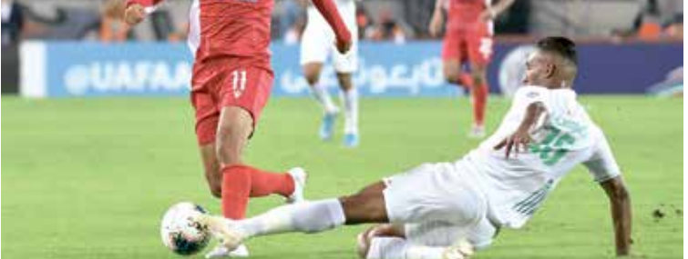
الوداد المغربي واختار امام بئرزة النغولبي

العاصمة المصرية القاهرة. ويبحث صاحب الأرض عن الفوز بفارق هدفين على الأقل. الدور نصف النهائي لدوري أبطال أفريقيا، بطولة إيجابية مثل التعادل أو الخسارة في مباراة هدف أو الفوز. ويدخل الأهلي