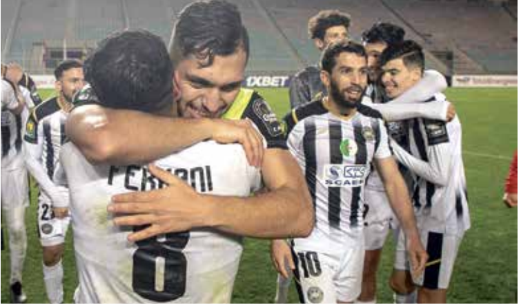
ووفاف سطيف يريد تحفيظ نتيجة إيجابية قبل أزد