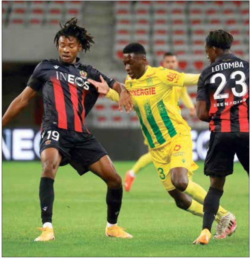
مواجهة قوية قنطرة بين الفريقين من أجل لقب محلي

يسعد فريقا نيس ونانت من أجل حصد لقب يُقدّم الموسم الحالي وذلك في نهائي الكأس