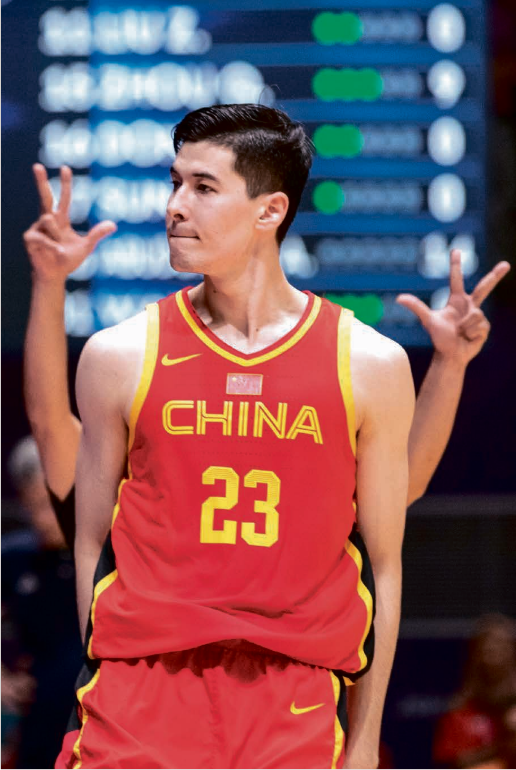
تاجيك جديد يطاول بطولة رياضية كبيرة بسبب فيروس كورونا

قررت الصين تأجيل النسخة الـ19 من دورة الألعاب الآسيوية التي كان من المقرر أن تستضيفها مدينة هانغتشو في مقاطعة تشيغيانغ في الفترة من 10 وحتى 25 سبتمبر/ أيلول المقبل، وذلك في ظل التفشي الكبير لفيروس كورونا مؤخراً. وذكرت محطة (CCTV) التلفزيونية الصينية أن المدير العام للمجلس الأولمبي الآسيوي، حسين المسلم، أعلن رسمياً عن القرار، مشيراً إلى أنه سيتم الإعلان عن الموعد الجديد للحدث في وقت قريب.