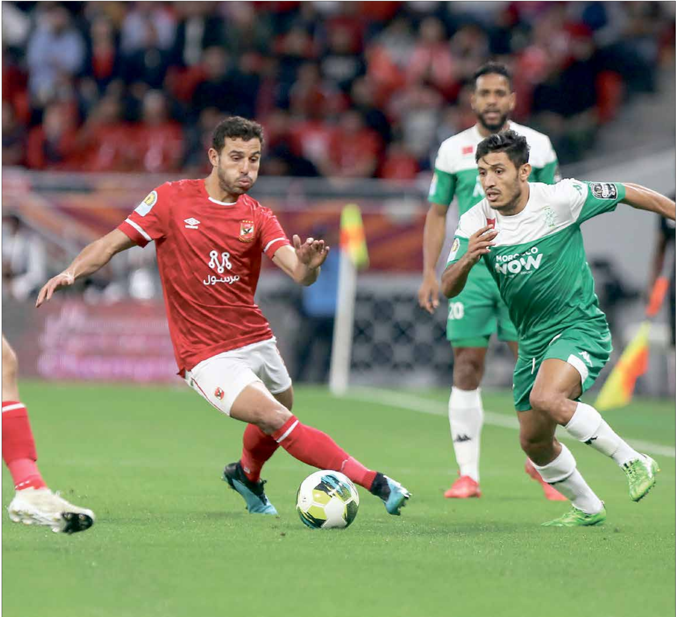
الأهلي المصري يواجه ووفاف سطيف من أجل التأهل

جديدة(2-4-4)التي لجأ لها مؤخرًا، وهي الطرق التي يتناول البركازي على تنفيذها في مبارياته الأخيرة بالسدوري المغربي. ويعتمد الوداد على قوته الضاربة، ممثلة في جاي مبيزتا وتسومو راسي الحربية المتألقين المغرب (1-5) وخسر في أنغولا (1-2) ونجح في التأهل إلى الدور ربع النهائي متصدرًا لجدول ترتيب المجموعة الرابعة متفوقًا على منافسه الأنغولي، وهو السنهابيرو الذي يسعى لتكراره هذه المرة ويخوض اللعب في مواجهة الصعبة تحت قيادة مدره الفني وليد البركازي، وهو يراهن على طريقة لعب