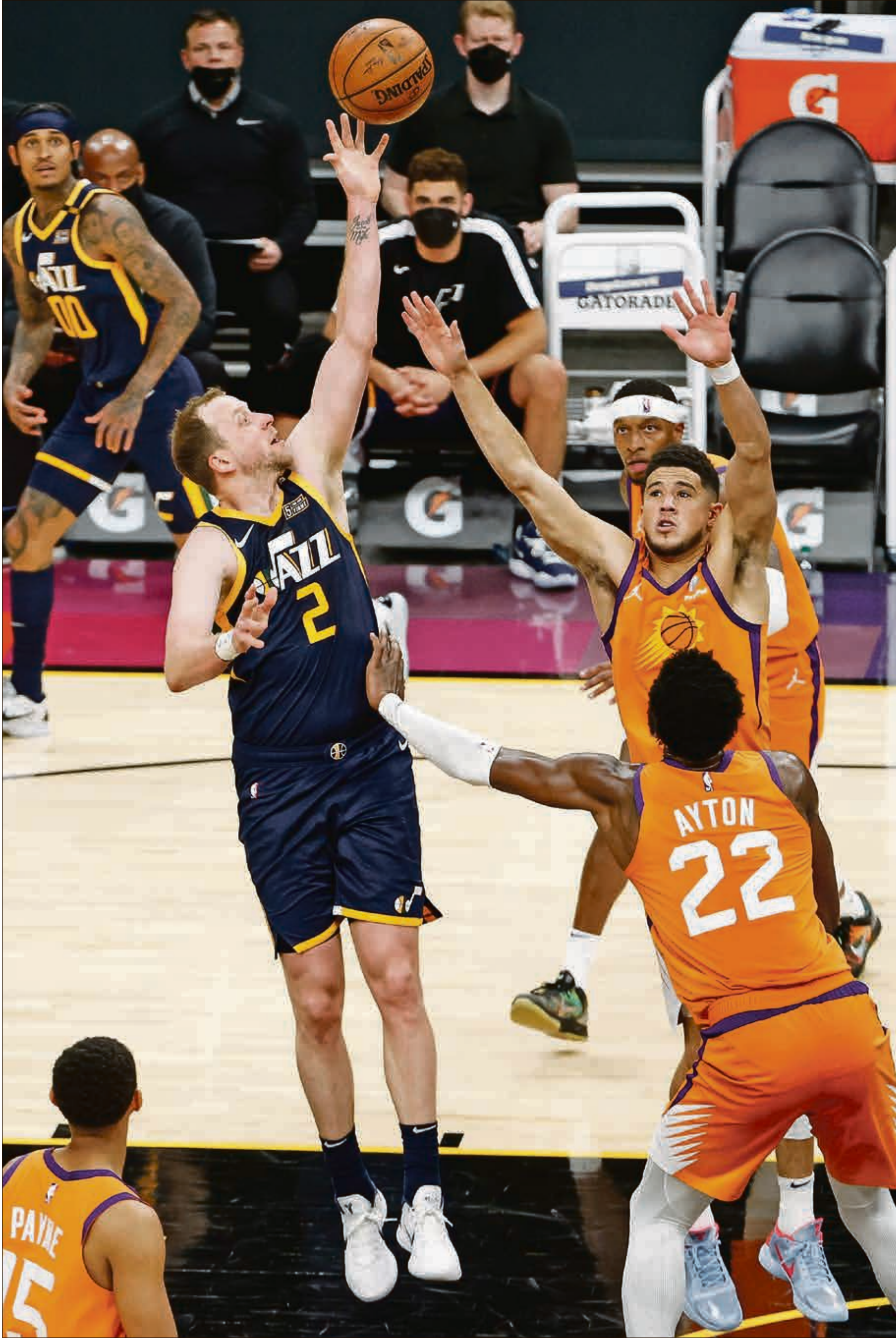
يوتا جاز استعاد المركز الاول من فينيكس صنز

استعاد فريق يوتا جاز صدارة المنطقة الغربية بفوزه على ضيفه سان انطونيو سبيرز (126 - 94) في دوري كرة السلة الأميركي للمحترفين مستفيداً من خسارة فينيكس صنز المتصدر السابق، أمام مضيفه أتلانتا هوكس (135 - 103). ويدين يوتا جاز بفوزه الثالث توالياً والـ48 في 66 مباراة حتى الآن إلى البديك جوردان كلاركسون صاحب 30 نقطة مع 6 متابعات و4 تمريرات حاسمة.