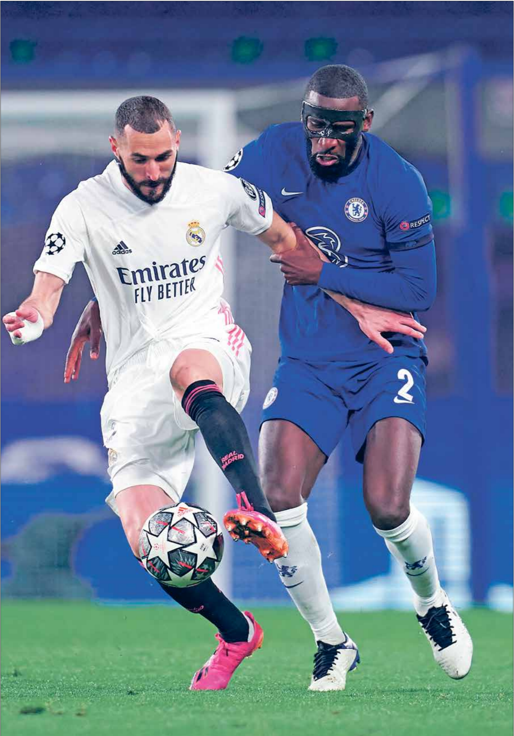
ريال مدريد يفتتح اللقاء أمام ريال مدريد الإسباني، في المباراة النهائية لدوري أبطال أوروبا، في لندن.