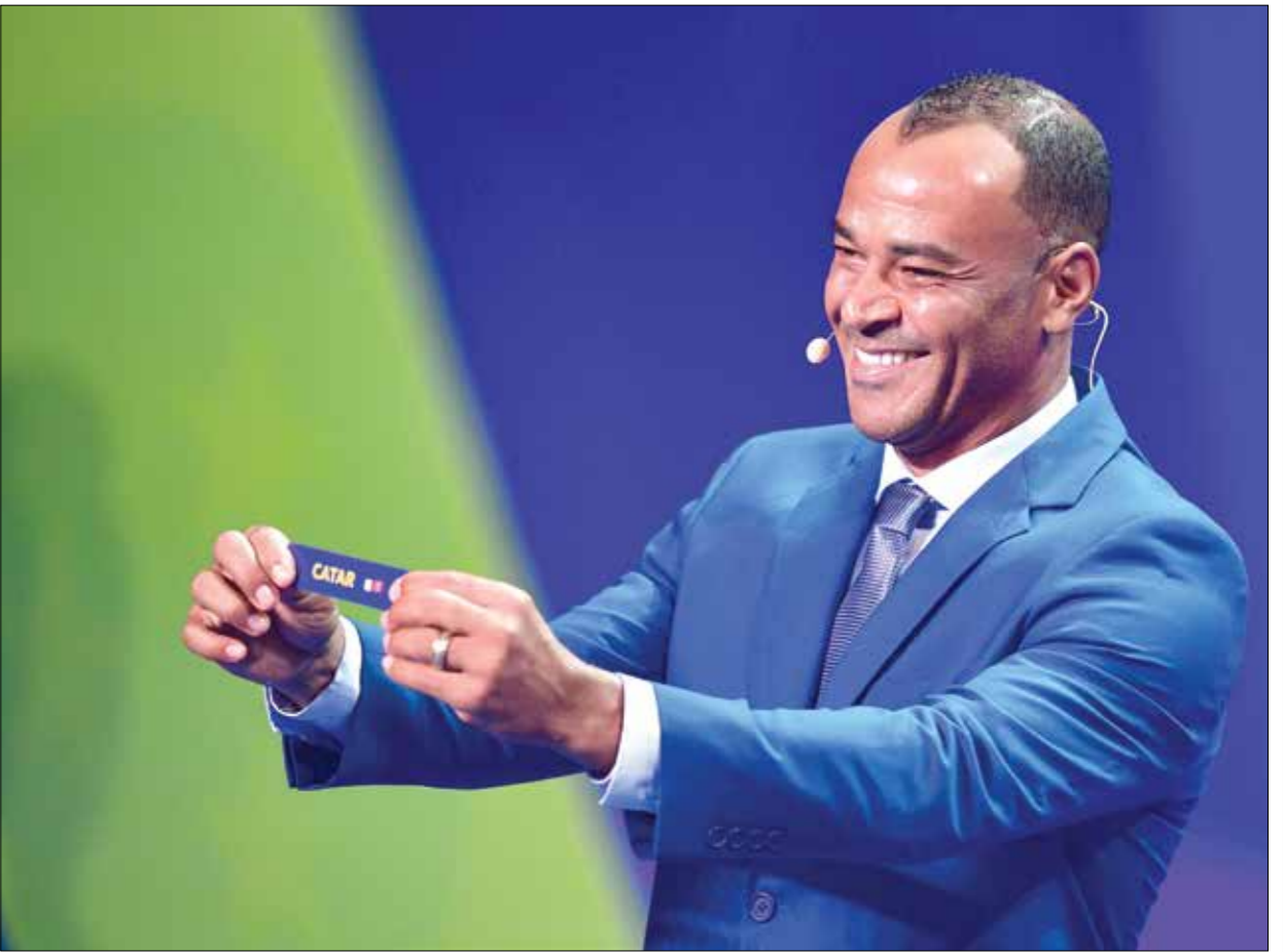
كافو الملوح بلبف مونديال 1994 و2002 مع منتخب البرازيل (كافو في سواد/فيرانس برس)

ويعد أسطورة كرة القدم البرازيلي كافو اللاعب الوحيد في العالم الذي شارك في نهائي ثلاث نسخ متتالية من المونديال، وذلك عندما دافع عن ألوان منتخب بلاده في نهائي مونديال 1994 بالولايات المتحدة الذي فاز به