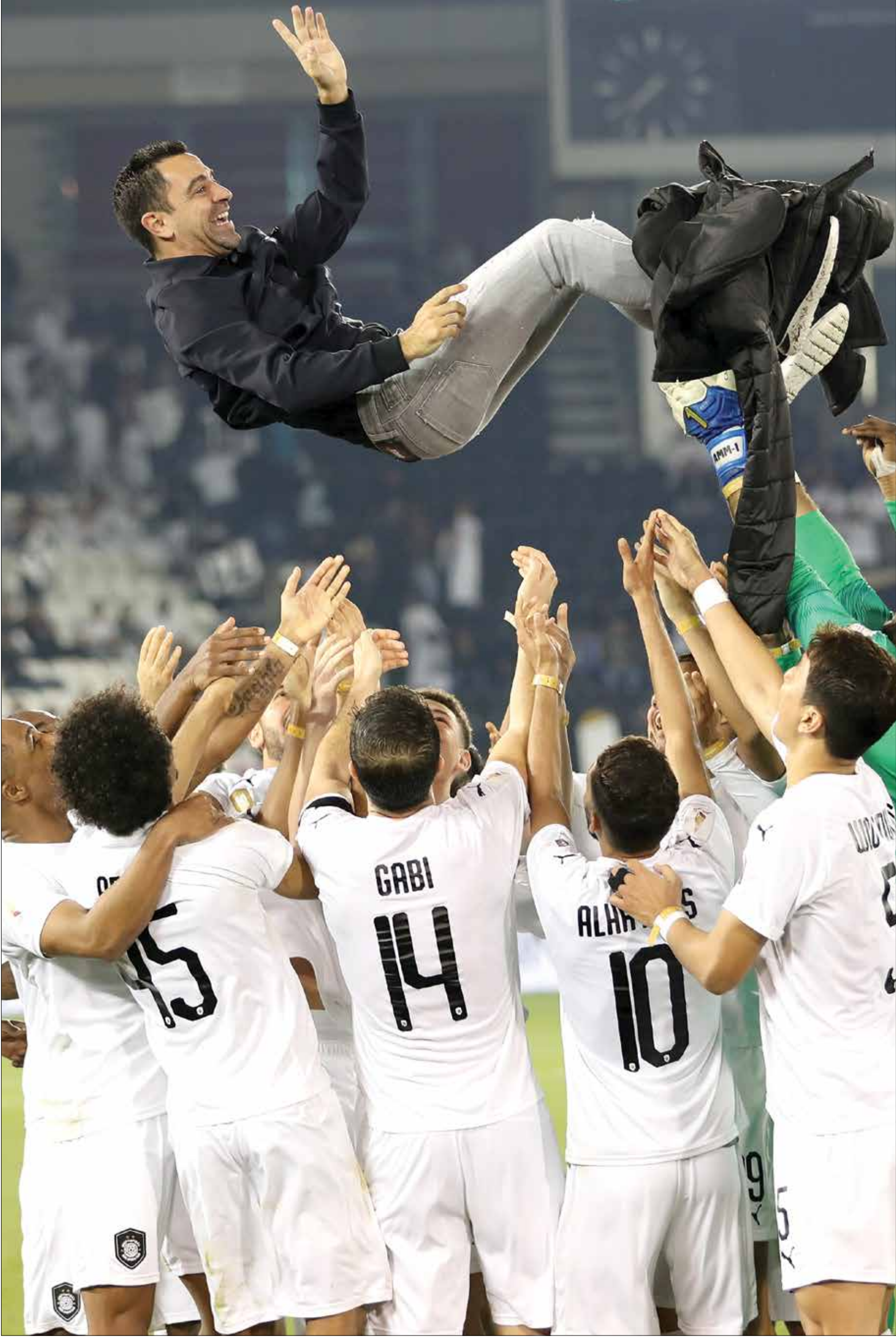
السد متصدر لترتيب الدوري القطري برصيد 32 نقطة

يسعى السد متصدر الدوري القطري لكرة القدم لكسر عناد السيلية امام الكبار، عندما يلتقيه اليوم الخميس في افتتاح المرحلة الثالثة عشرة. وجمع السد 32 نقطة مبتعداً بفارق ثماني نقاط عن الدحيل الثاني. ويستعد السد الآن لمواجهة السيلية الثامن برصيد 15 نقطة، الذي شكل عقدة للفرق الكبيرة في الآونة الأخيرة بعدما فاز على الدحيل والغرافة، واستهلك الإياب بتجاوز الريان الوصيف 2-0 في المرحلة الماضية.