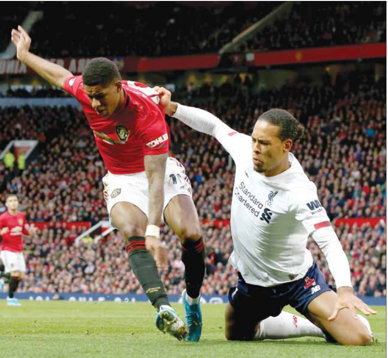
الندية البريزيرليغ في امان رغم الخسائر المالية

مع الإغلاق الأخير ستكون كرة القدم مدبئا في صافن، ويرجع ذلك إلى قوة عقود البث الخاصة بها، التي تمت حمايتها من خلال الإعفاء الحكومي للرياضة التخبوية، حيث إن الدوري الإنكليزي الممتاز وحده يمتلك عقوبا بقيمة 3 مليارات جنيه إسترليني سنويا على شكل صفقات تلفزيونية. 400 مليون جنيه إسترليني منها تنصهر في رابطة الدوري الإنكليزي وحسرت اتنية الدوري الإنكليزي الممتاز 700 مليون جنيه إسترليني في حسومات البث بسبب الوفاء خلال الموسم الماضي والعقوبات التجارية مع استمرار مشكلة غياب الجماهير، إذ من غير المرجح أن يعود المشجعون إلى الملاعب بأعداد كبيرة حتى الموسم المقبل، وهو ما يستتسب مزيد من الضخائر القدرية بمئات الملايين. صحیح ان ندية البريميرليغ والدرجة الأولى يجب ان تكون قادرة على الصمود في وجه العاصفة المالية من خلال مزيج من استثمارات