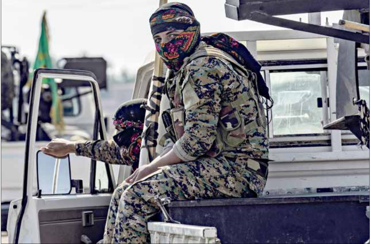
لكتشف «قسد» من كثر لاجرة عفرية (ذلك سبيلنا)