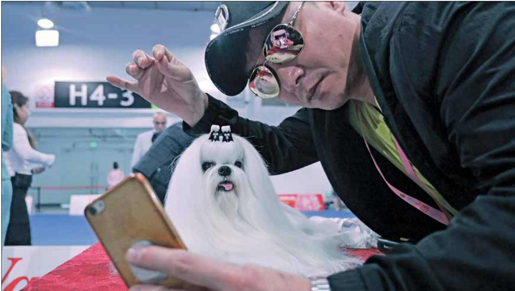
سليفي مميزة مع كلبه

من مظاهر تمثيل الصينيين بالغرب اقتناء الحيوانات الأليفة بنسبة عالية لدى الشباب والنساء، وبينهم عدد كبير من الباحثين عن تأسيس وحدتهم في المدن