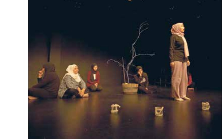
من العروض في الدنمارك (اليمين الجديد)