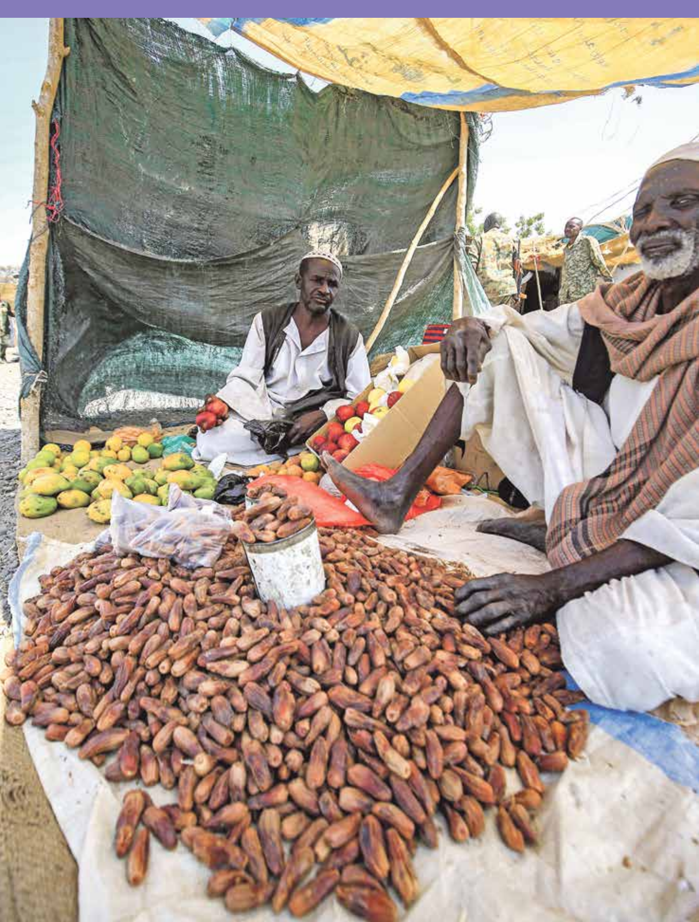
الخلفات التجارية لرحصالح المواطنين في الوه صراعات معيشة عصبة على الحكه (فرانس برس)

ويؤكد الرمادي أن الاضطراب السياسي يستتعيه إرباك اقتصادي، مشيرا إلى أنه «في الفترة الأخيرة، كان الاستثمار أن يتوقف تماما مع هروب الرساميل السودانية إلى دول أخرى، وهذه ظاهرة بالغة الضرر بالاقتصاد»، ودعا السياسيين إلى إيلاء الاهتمام لأولوية إيجاد مناخ مؤات يضمن استقرارا سياسيا، لأن الأسس الموجودة تتطلب سياسات واضحة لا تقوّضها الصراعات»، وقال إن الصراع الحالي غير مقبول لأنه يؤدي إلى «فشل اقتصادي مهما كانت إمكانيات الدولة هائلة»، معتبرا أنه «ينبغي النأي بالاقتصاد الوطني ومعيشة الناس عن الصراعات السياسية التي لا تنتج إلا الخسارة الكبيرة للوطن وسكانه».