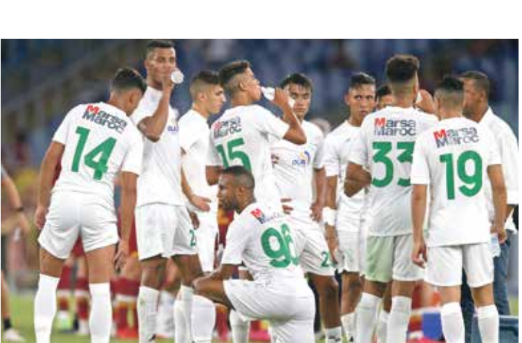
الرجاء يستعد للانصار واسعد عشاقه

وستكون الجولة العاشرة حاسمة، وستجد فيها انظار الجمهور المغربي، للمعب محمد الخامس بالعمامة الاقتصادية للمغرب، لخباصة متميزة، سيسعى الوداد كما الرجاء لتحصنها ، وستندتد فيها أعصاب الصغار كما الكبار من عشاق قطبي كرة القدم