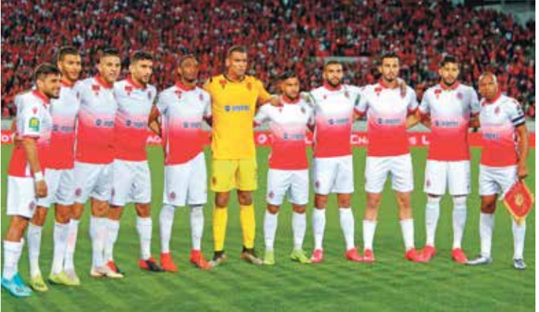
الوداد يريد الصدارة