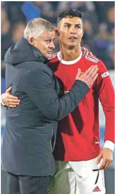
رونالدو يسعد سولشاير لمواجهته السليم بعد سنوات من الغياب عن الحيزين

فريق أردني يشارك في نهائيات الأندية العربية أبطال الكؤوس، وفي عام 1993 كان الرمثا على موعد مع إنجاز أردني متميز على الصعيد القاري، عندما حصل على المركز الثالث في بطولة الأندية الآسيوية أبطال الكؤوس الحادية عشرة، بعدما حقق نتائج كبيرة وأخرج فرقا عريقة في طريق بلوغه للدور قبل النهائي، فبعد ما بالأعلى البحريني الذي تعادل معه في المباراة 1-1 وهزّمه في إربيد 2-1، ثم أخرج بانجاس