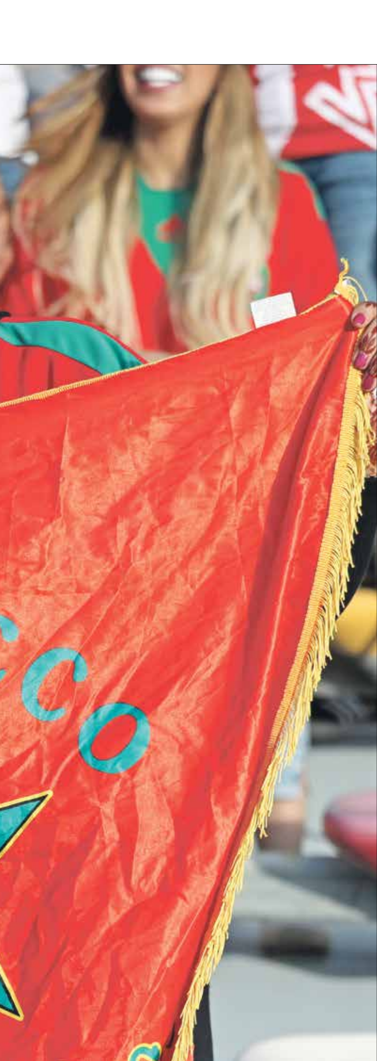
الجماهير الغالب البرع عن المدير الطير

ويتصدر الوداد الرياضي ترتيب الدوري المغربي المحلي، بعد إجراء 9 جولات، حيث يملك 25 نقطة، حازها من 8 انتصارات، وتعادل واحد، مقابل ذلك، لم يتعرض الفريق الأحمر لأي خسارة هذا الموسم بعدما سجل أبعده 14 هدفا، في حين استقبلت شبكته هدفين فقط، ما يؤكد قوة خط هجومه الذي يقوده الكونفولي عي ميميزا، الذي أكد بدوره لـ«العربي الجديد»، أنه يامل مواصلة هن الشياك، وتعادلتي في مباراتي، وتلقت خسارة واحدة، مقابل ذلك سجل لاعبو الفريق الأخضر 14 هدفا وتلقت شبكهم 5 أهداف.