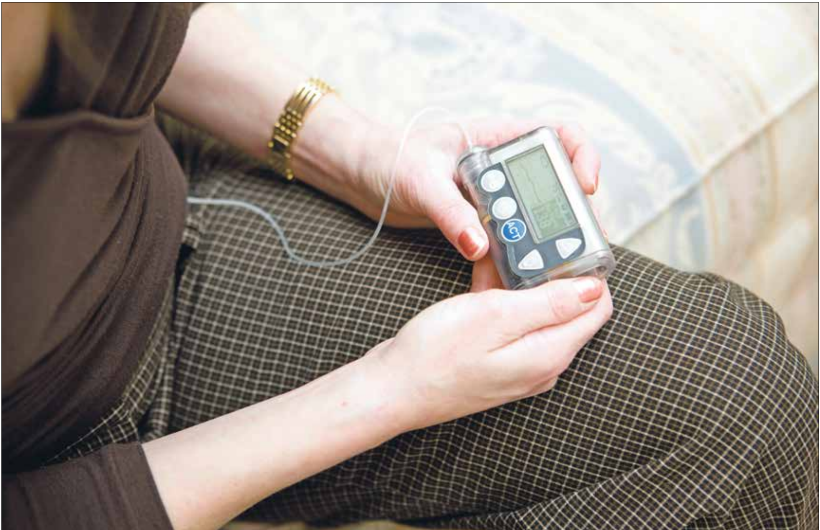
مضخة الأنسولين هي جهاز إلكتروني صغير بحجم جهاز الهاتف الذكي