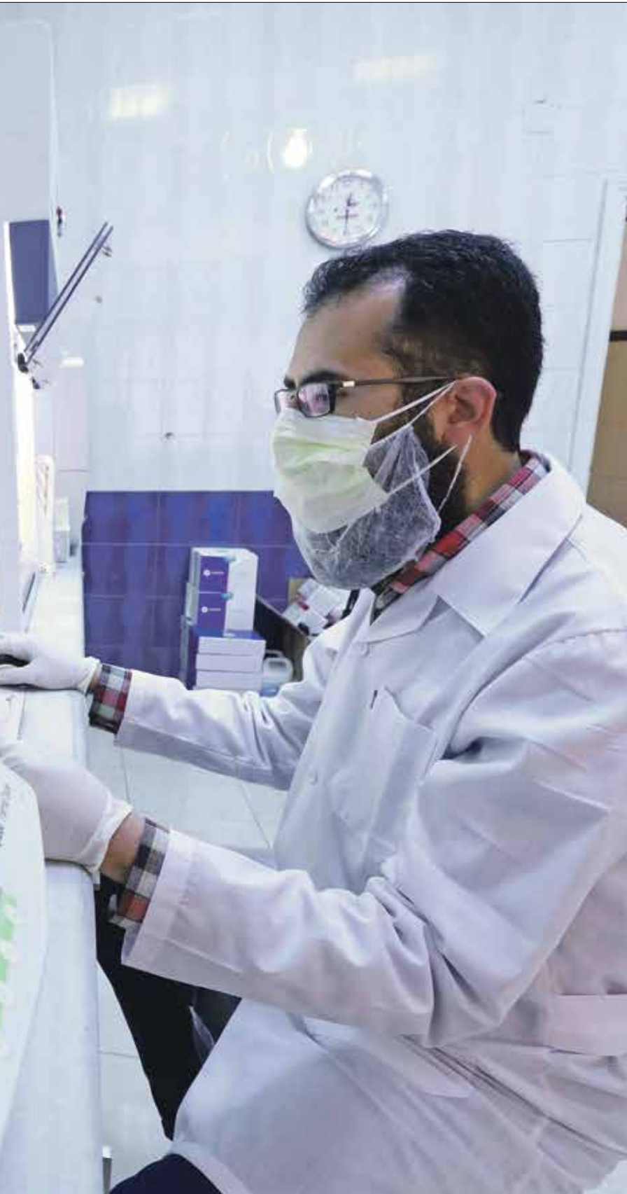
انباء الشمل السوري في مواجهة كورونا بعد الحرب احمر حذور/ فرانس برس

إنقاذ الجرحى في خلال الحرب، ونحرص على مساندة مهمة استجابة المستشفيات في إدلب وشمال غربي سورية لمتطلبات توفير الخدمات الصحية للناس، ونتمسك بتأدية الواجبات الإنسانية كاملة بغض النظر عن أي ظرف، مع الحرص على أن تشمل جميع المستضعفين من نساء وإطفال وشابحين، ويتابع عبدان أن تخفيف الأعباء عن المستشفيات لا يتحقق بالجهود التي تبذلها مديرية الصحة في إدلب والكوادر العاملة فيها، إذ يجب زيادة عدد هذه المستشفيات وتحسين بنيتها التحتية، وزيادة عدد أطبائها، إلى جانب تعزيز