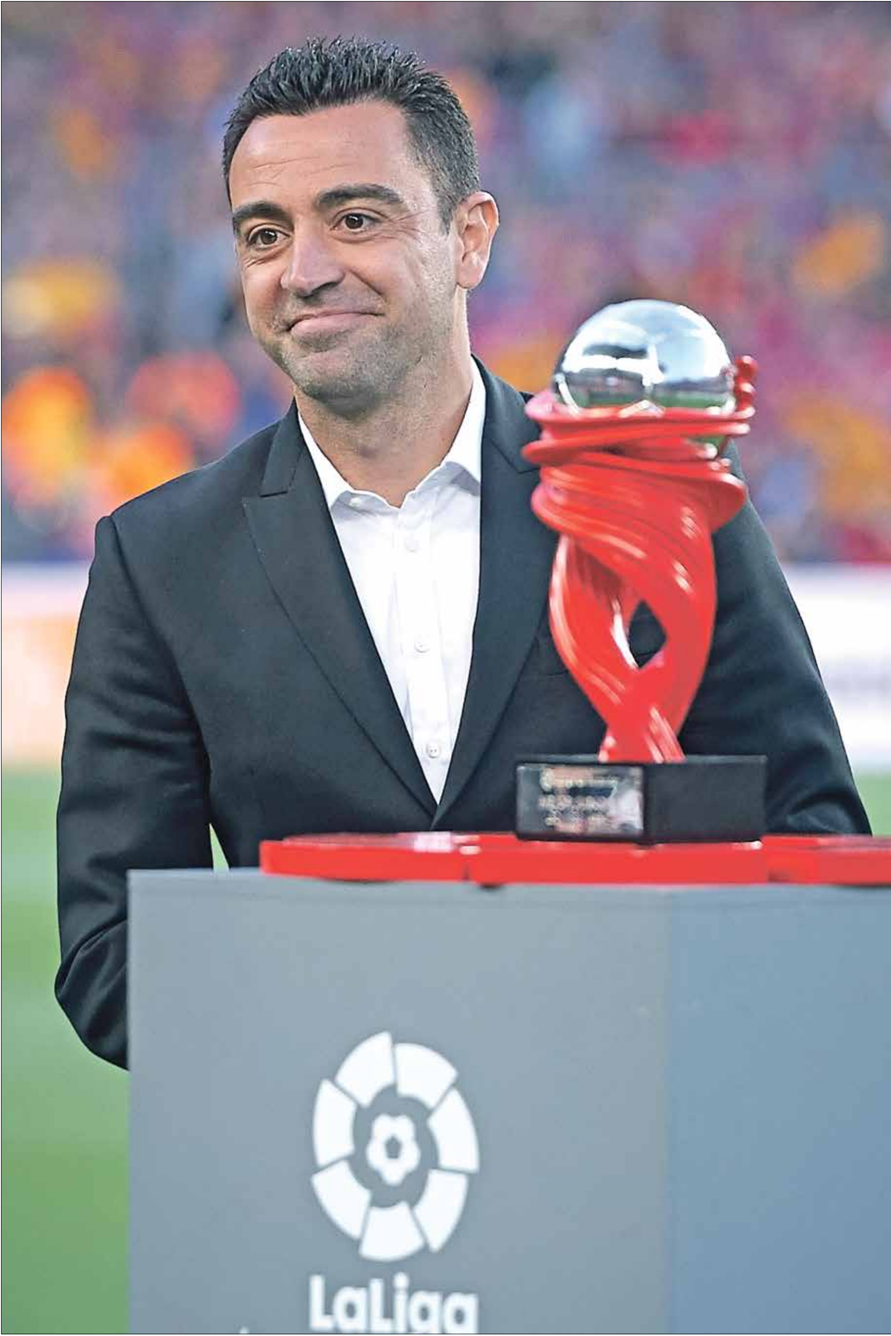
تشافي يعود لبرشلونة محمدا بعد سنوات من الألف لاليجا هالك