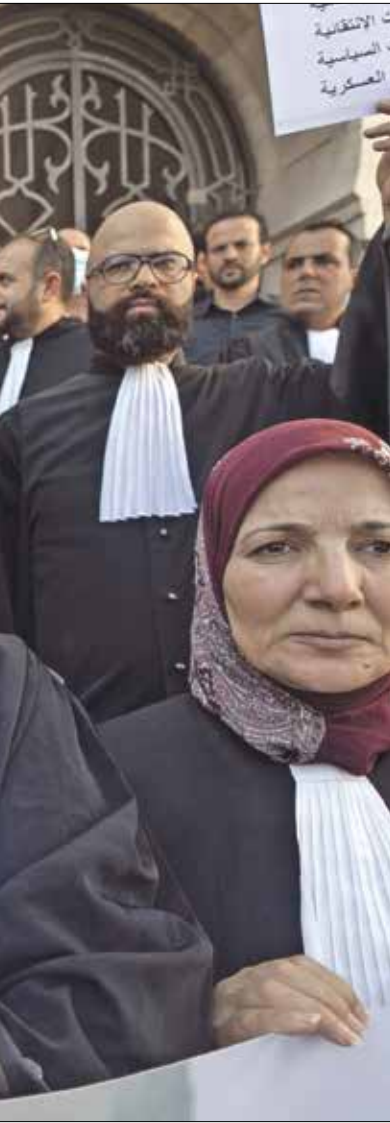
رفض محاولة التدخل بمعمل القضاء (رأسين قريحي/ الأناضول)

واكدت وزيرة المرأة السابقة سهام بادي، لـ«العربي الجديد» أن هناك «عدة مخاوف من حصول، أهمها ضرب استقلال القضاء، وكان الرئيس الأسبق (الحبيب) بورقيبة، في حوار سابق مع قيس سعيد، وأضاف أن «هذا الأمر سيهدم من سلطة المروقي، من أجل حزب «حراك تونس الإرادة» في بيان، أمس الجمعة، أن «التمتع الذي أثير ضد المروقي كما منذ البداية منقوبا بتدخ