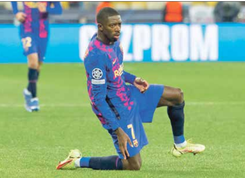
ديمبلي واحد من اللاعبين غير المحظوظ في عالم كرة القدم

نوماس فيرمايلين لاعب كرة القدم البلجيكي ليس غريباً عن جماهير برشلونه، فقد قضى وقتاً طويلاً في صفوف الفريق بعدما عن الملاعب بسبب سلسلة من الإصابات. وتعددت إصابات فيرمالين طوال مسيرته، منها إصابة في وتر العرقوب، كما تعرض لكسر في الكاحل والعديد من المشاكل البدنية.