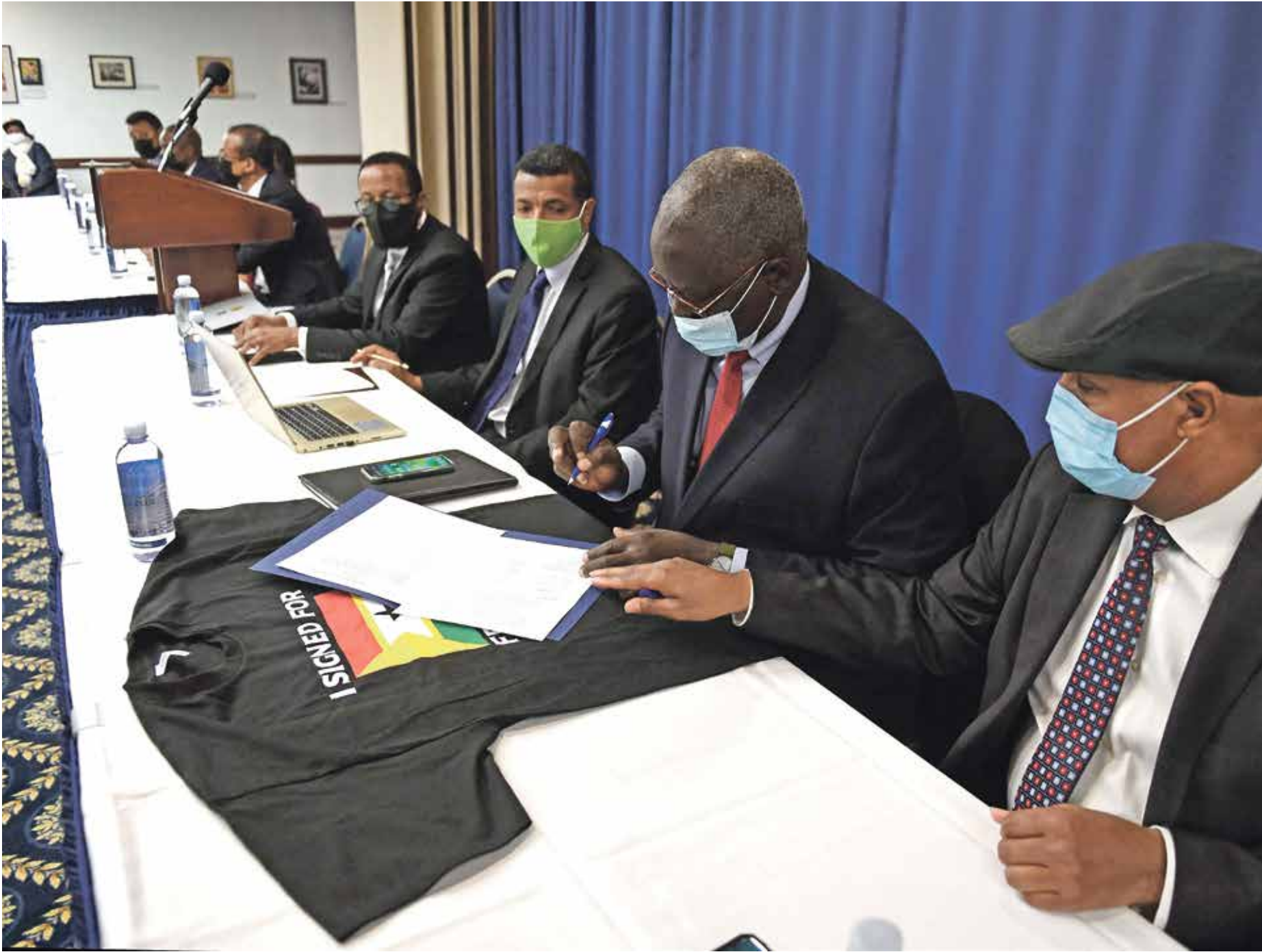
مملوون مع المجموعات المسلحة خلال التوقيع على التحالف في واشنطن أمس

وعدت وزارة الدفاع متفادعي الجيش إلى الانخراط مجدداً في صفوفه «الحماية البلاد من جانبه، أكد النائب العام الإثيوبي دييون