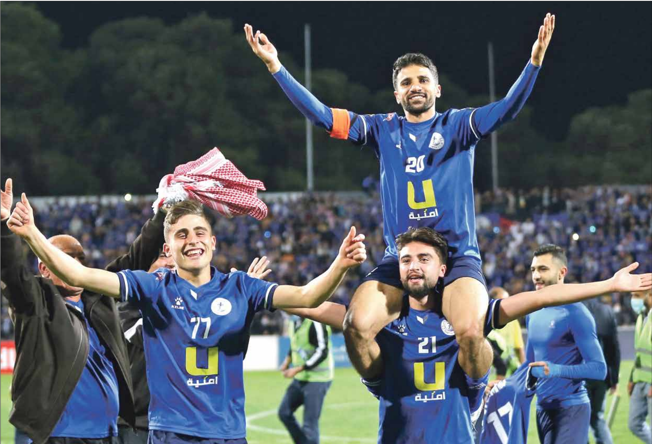
الرمثا بعد هذا اللف بعد سنوات طويلة من الغياب عن منصات التتويج (حساب الرمثا/الرمثا)

الإماراتي (0-0 و2-3)، وتعمه ظفار العماني بعد الفوز عليه 0-1 في إربيد والتعادل معه 1-1 في مسقط، ثم جاء الإمتحان الصعب أمام فريق مغلان الإيراني فتعادل معه في طهران 1-1 وسط هتافات أكثر من 60 ألف مشجع زاروا الفريق الإيراني آنذاك، ثم تعادل معه في إربيد بدون أهداف في المباراة الشهيرة التي شهدت امطاراً غزيرة ملأت استاد الحسن، وفي مباراة الدور قبل النهائي خرج على يد النصر السعودي