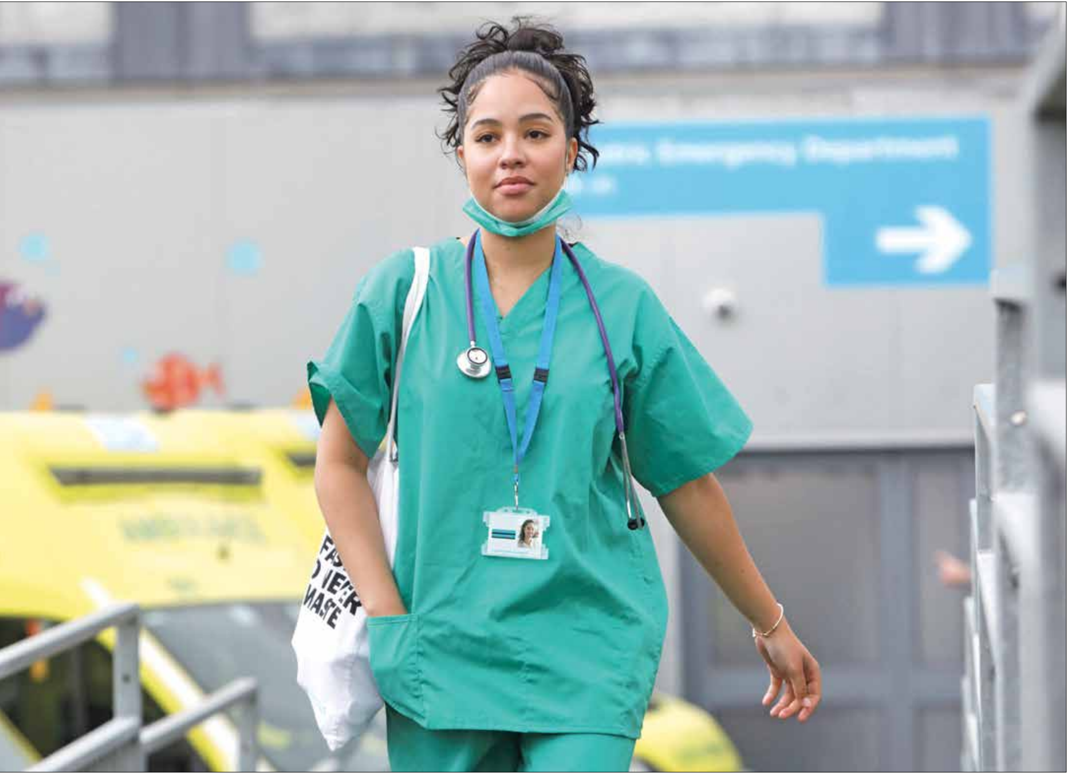
سلطت الجائحة الضوء على عدم المساواة

تبدو تداعيات جائحة فيروس كورونا جلية في بيئة عمل الكوادر الطبية في بريطانيا، إذ كشفت عن مشاكل بنيوية في هيئة الخدمات الصحية، وتحديدًا بالنسبة للأطباء من أقليات عرقية، غير أنهم لمسوا تغييرات إيجابية رغم المعاناة